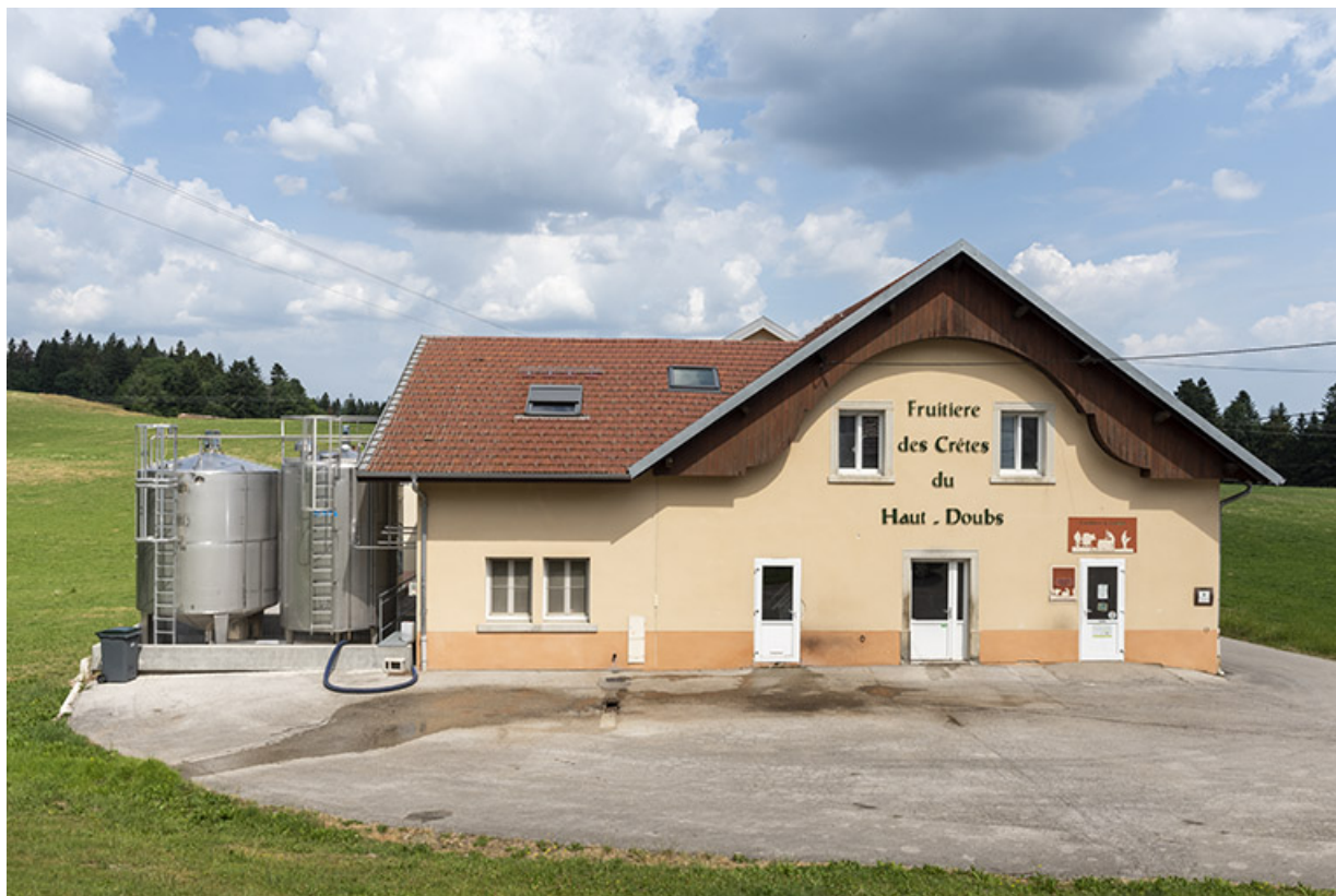
Fromagerie de Grand'Combe-des-Bois dite Fruitière des Crêtes du Haut-Doubs.