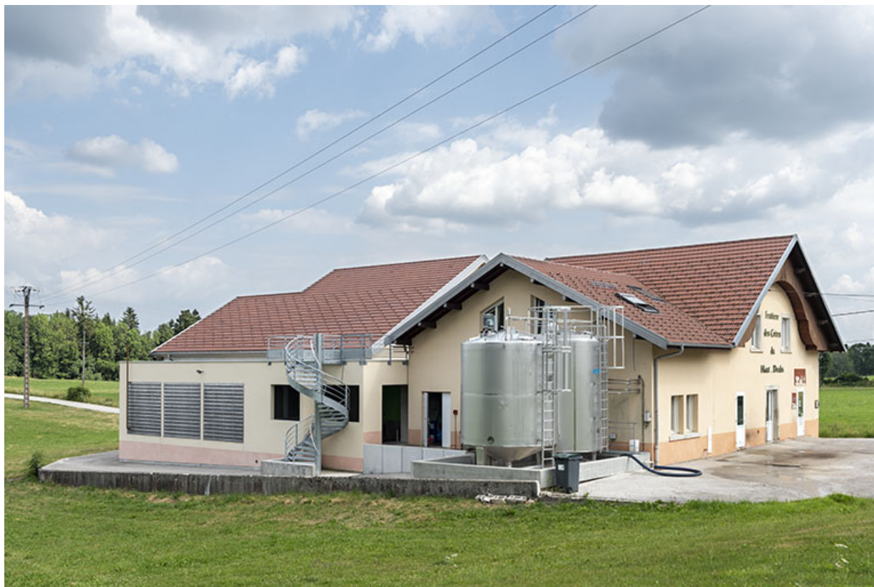
Vue d'ensemble, de trois quarts gauche.

25, Grand'Combe-des-Bois, 3 rue des Peux