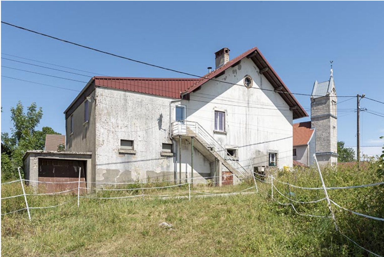
Façade latérale gauche.