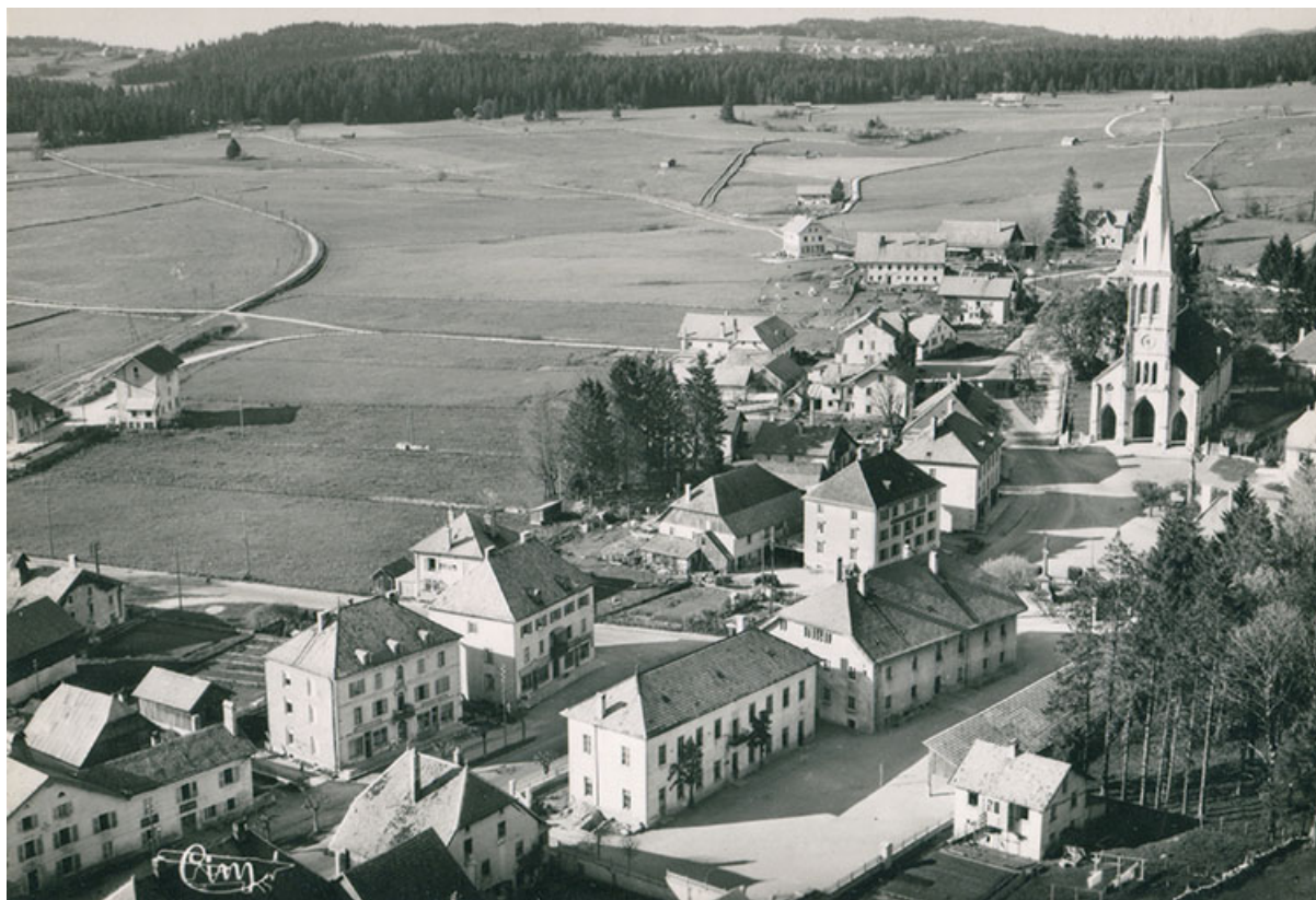
Le Russey (Doubs) - Alt. 900 m. 37730 A - Vue panoramique aérienne [le village vu du sud], 3e quart 20e siècle. Le bâtiment est visible à gauche.