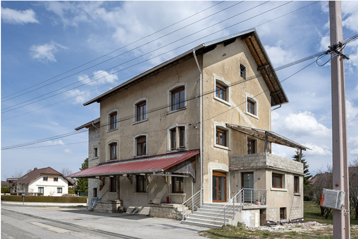
Façades antérieure et latérale droite.