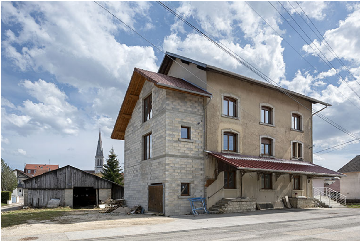
Façades antérieure et latérale gauche.