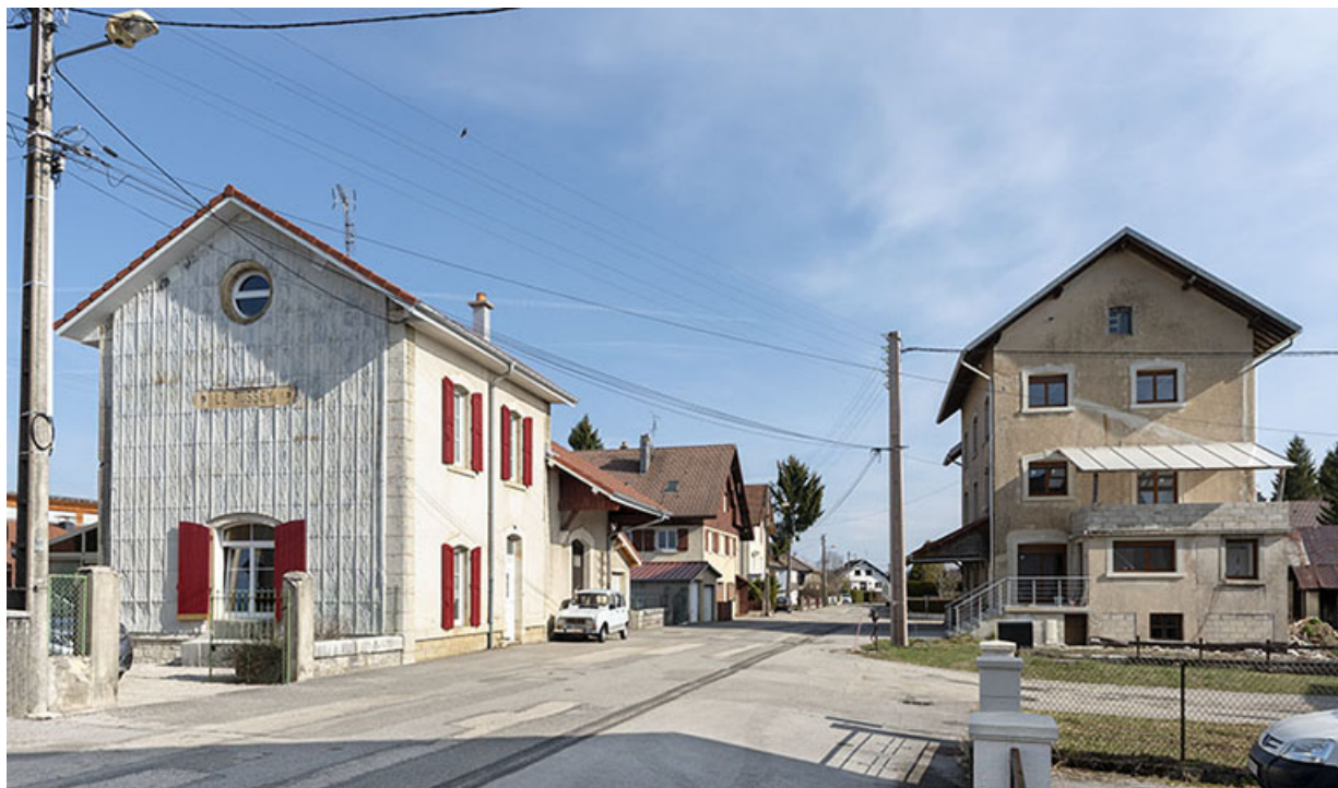
Vue d'ensemble depuis le sud, avec l'ancienne gare à gauche.