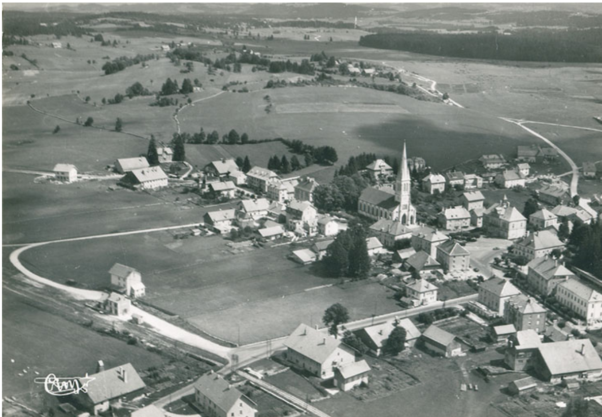
Le Russey (Doubs). 22180 - Vue panoramique aérienne [le village vu de l'ouest], milieu 20e siècle. Le bâtiment est visible à gauche, derrière la gare.