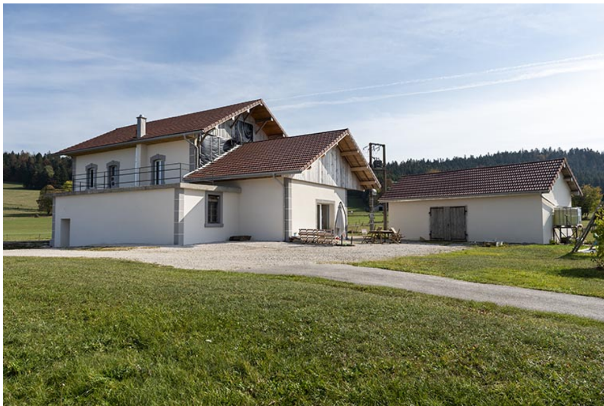
Fromagerie : façades postérieure et latérale gauche (avec le garage à droite). 25, Les Combes, 2 allée Sous le Bois, lieudit : Cloison Vincent