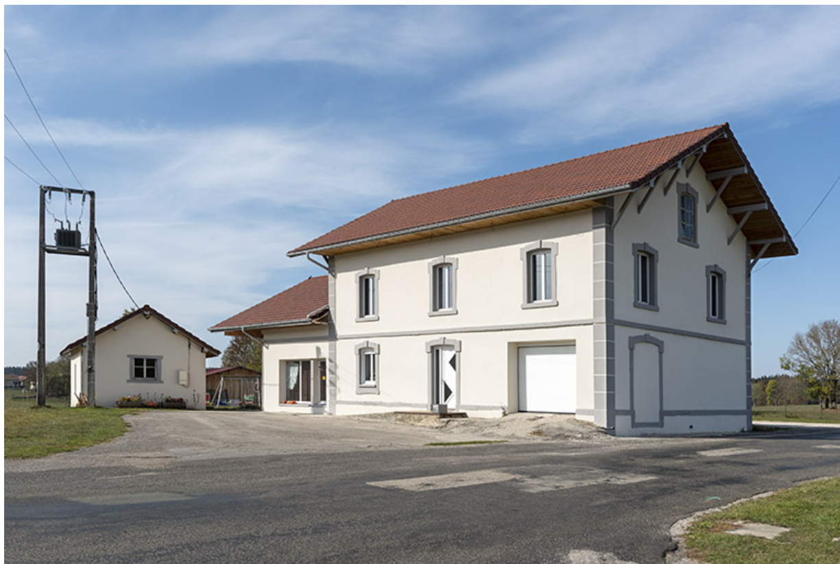
Fromagerie : façades antérieure et latérale droite.

25, Les Combes, 2 allée Sous le Bois, lieudit : Cloison Vincent