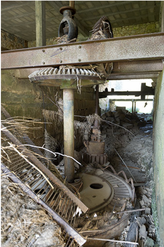
Moulin : turbine Pouguet.

25, Les Combes, 4 rue du Moulin, lieudit : Remonot