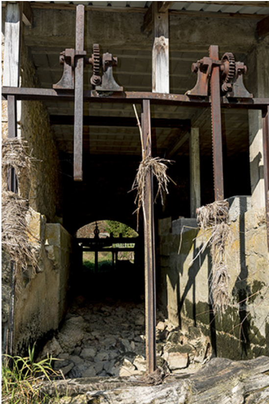
Moulin : vestiges des vannes de prise d'eau gauche. 25, Les Combes, 4 rue du Moulin, lieudit : Remonot