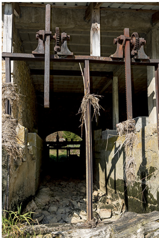
Moulin : vestiges des vannes de prise d'eau gauche. 25, Les Combes, 4 rue du Moulin, lieudit : Remonot