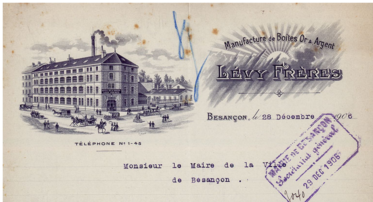
Manufacture de boîtes de montres Lévy Frères (25 rue Gambetta), Papier à en-tête, 1906.