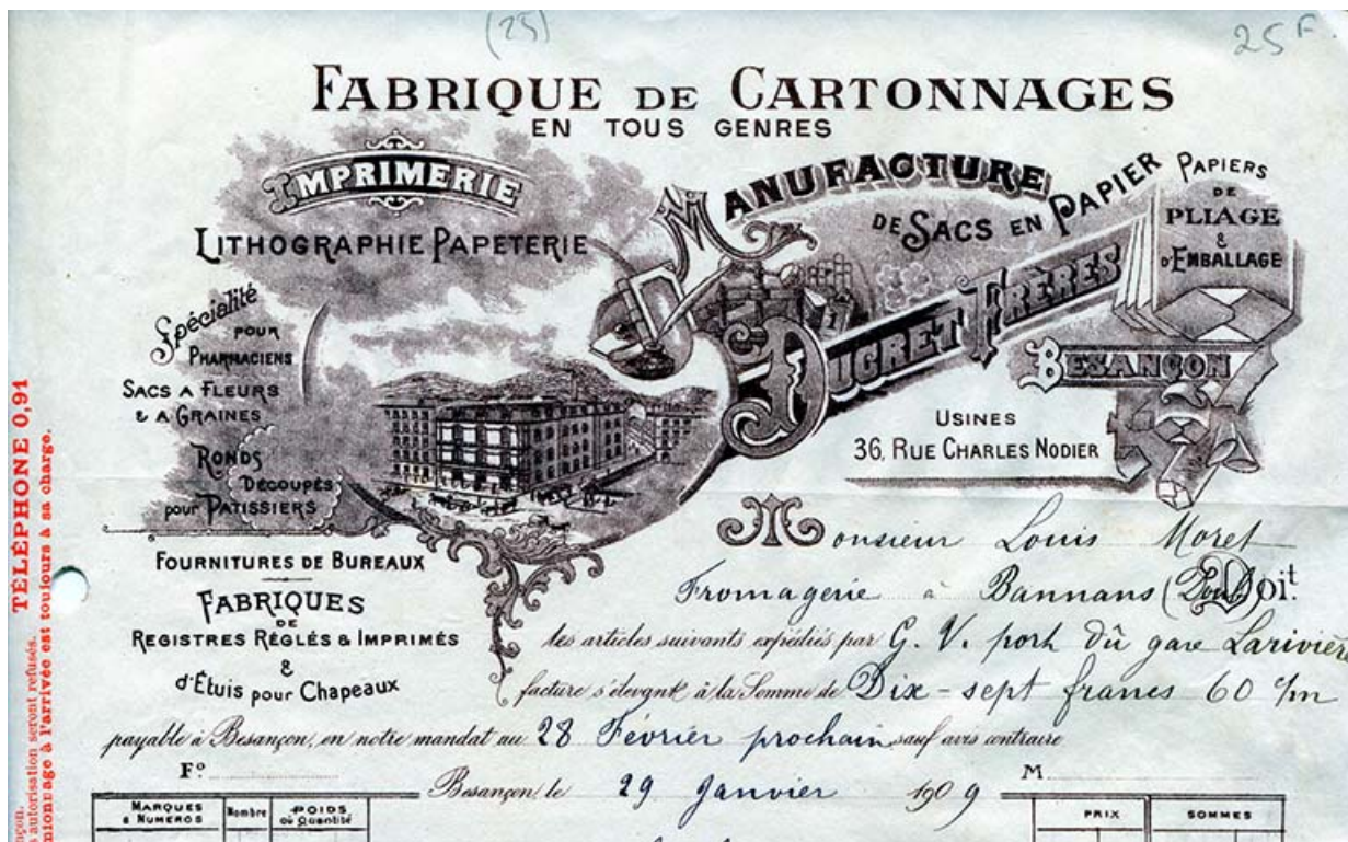
Fabrique de cartonnages Ducret Frères, papier à en-tête, vers 1909.