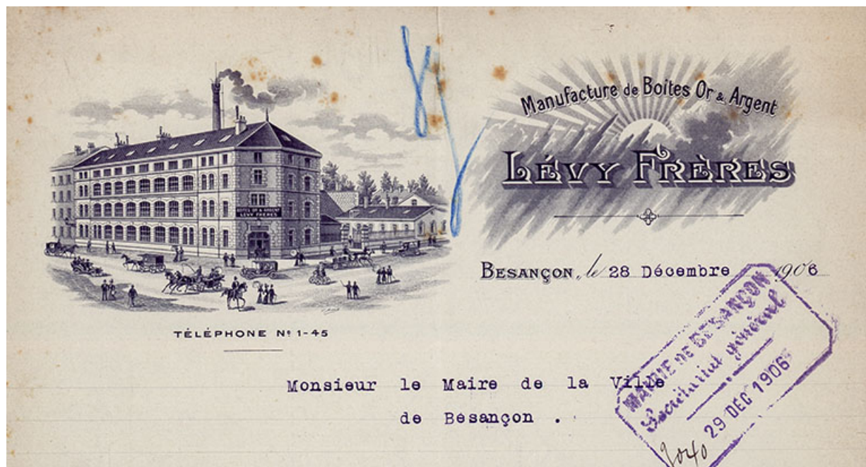
Manufacture de boîtes de montres Lévy Frères (25 rue Gambetta), Papier à en-tête, 1906.