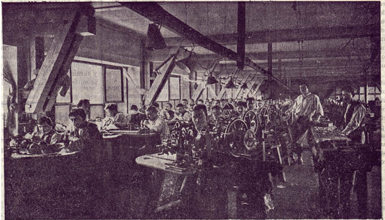
Vue générale de l'Atelier Bornet

Atelier de décor de boîtes de montres Bornet. Vue générale (25 avenue Gambetta), 1906.