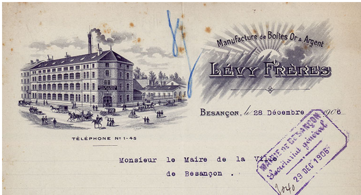
Manufacture de boîtes de montres Lévy Frères (25 rue Gambetta), Papier à en-tête, 1906.