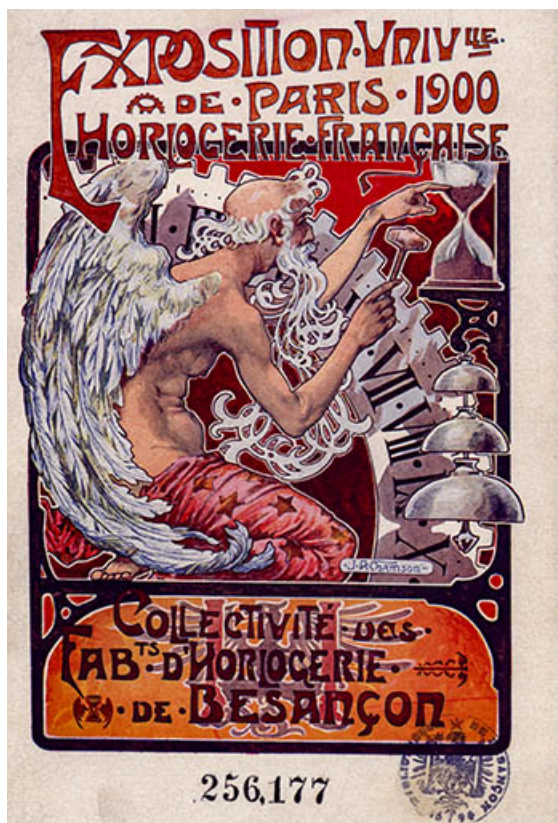
Catalogue de l'Exposition universelle de Paris, 1900 : horlogerie française [1ère de couverture].