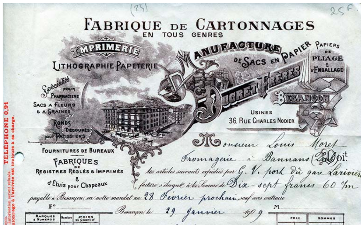
Fabrique de cartonnages Ducret Frères, papier à en-tête, vers 1909.