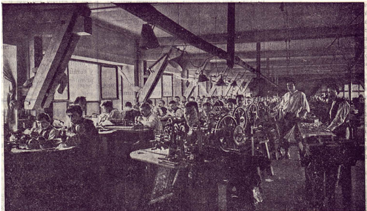
Vue générale de l'Atelier Bornet

Atelier de décor de boîtes de montres Bornet. Vue générale (25 avenue Gambetta), 1906.