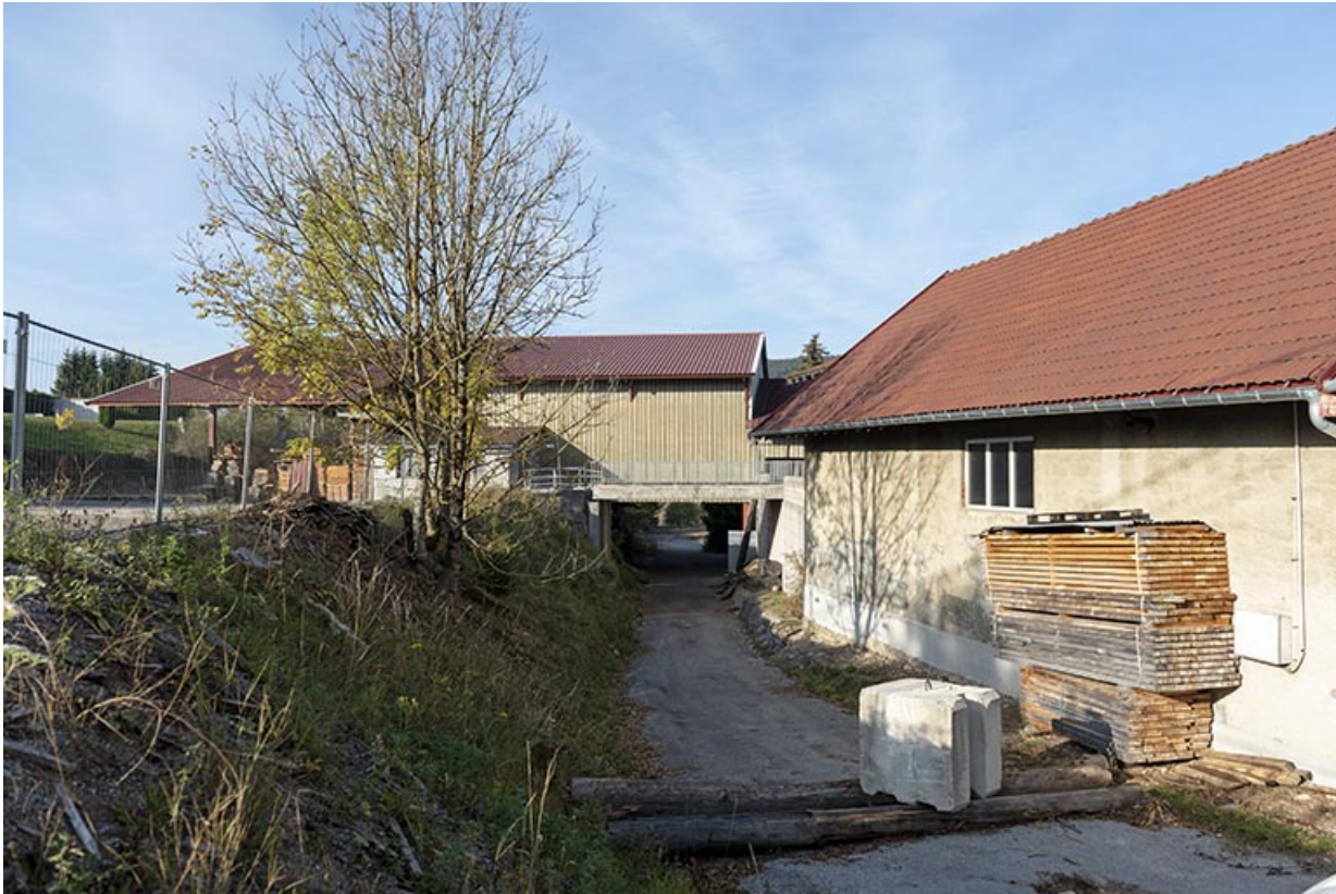
Atelier récent et chemin, depuis l'est.