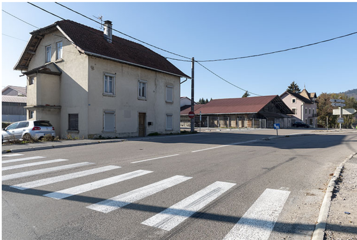
Vue d'ensemble du site, depuis l'est. Au premier plan, maison de 1919. 25, Les Fins, 1-3 route de Maîche