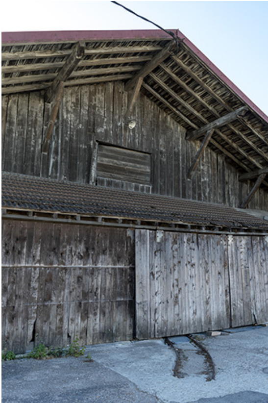
Atelier de 1919 : façade antérieure (nord). 25, Les Fins, 1-3 route de Maîche