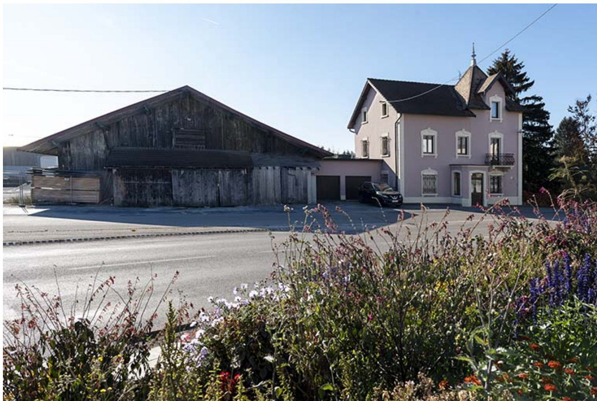
Atelier de 1919 et deuxième maison : façade antérieure (nord).