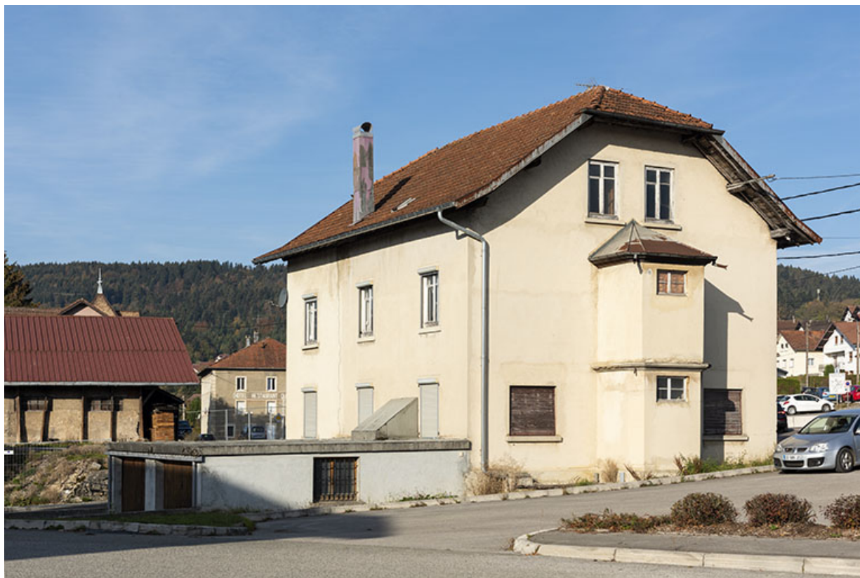
Maison de 1919 : façades postérieure et latérale gauche.