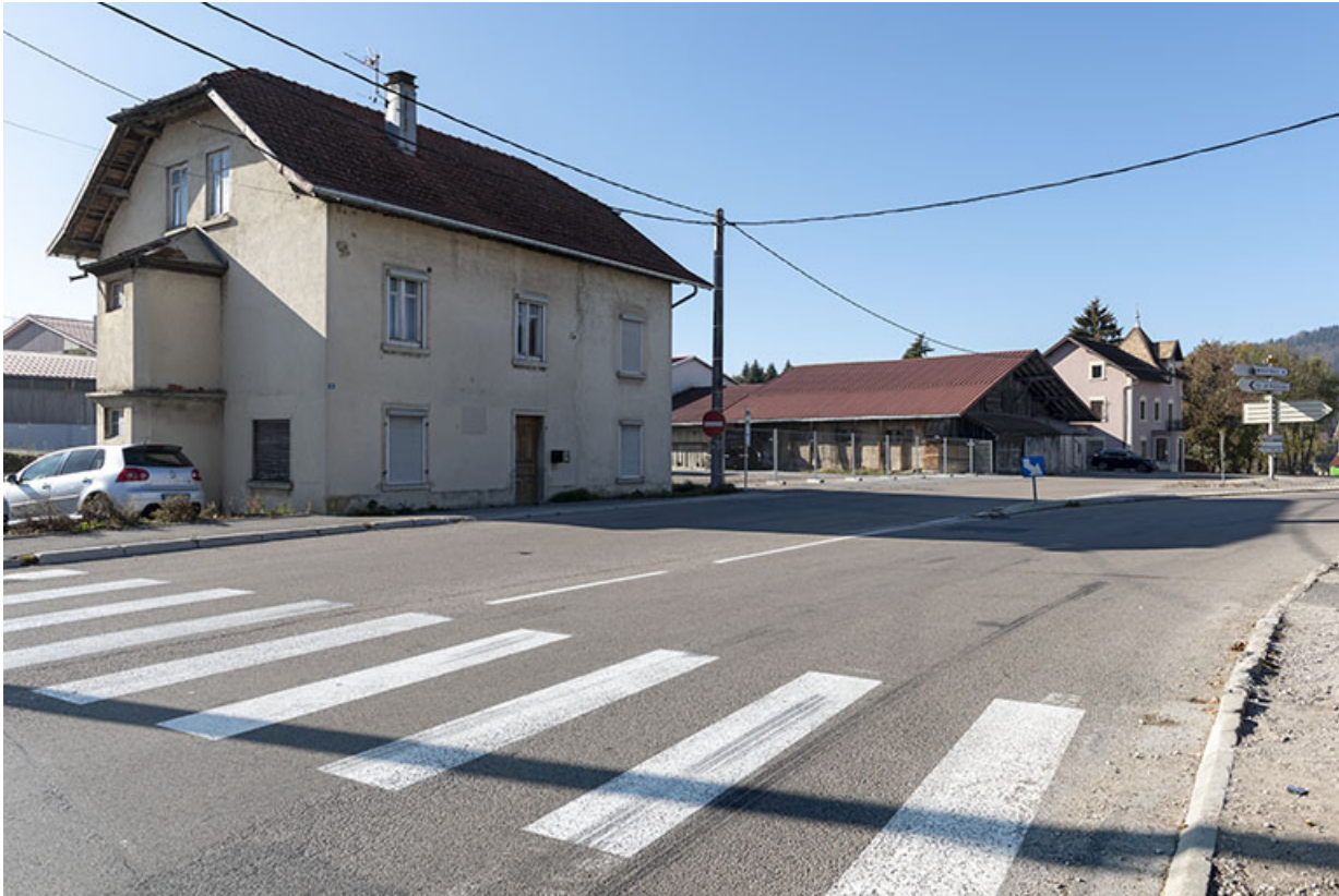
Vue d'ensemble du site, depuis l'est. Au premier plan, maison de 1919. 25, Les Fins, 1-3 route de Maîche