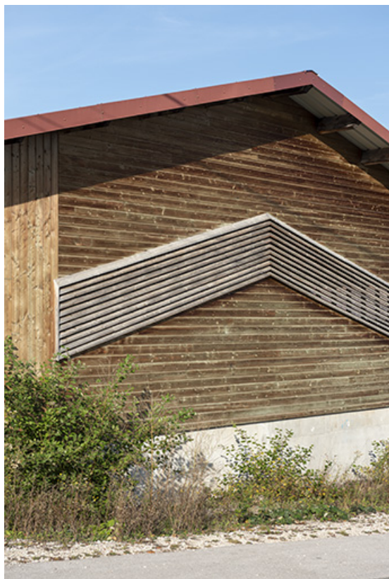
Magasin industriel : essentage de planches sur le mur est.