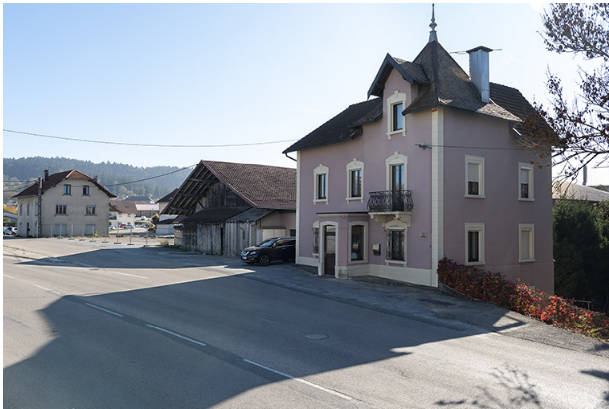
Vue d'ensemble du site, depuis l'ouest. Au premier plan, maison bâtie entre 1928 et 1938. 25, Les Fins, 1-3 route de Maîche