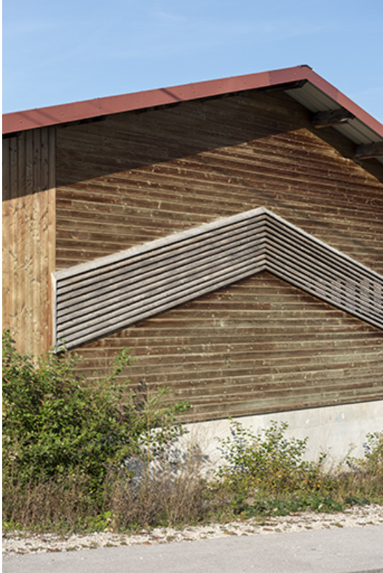
Magasin industriel : essentage de planches sur le mur est. 25, Les Fins, 1-3 route de Maîche