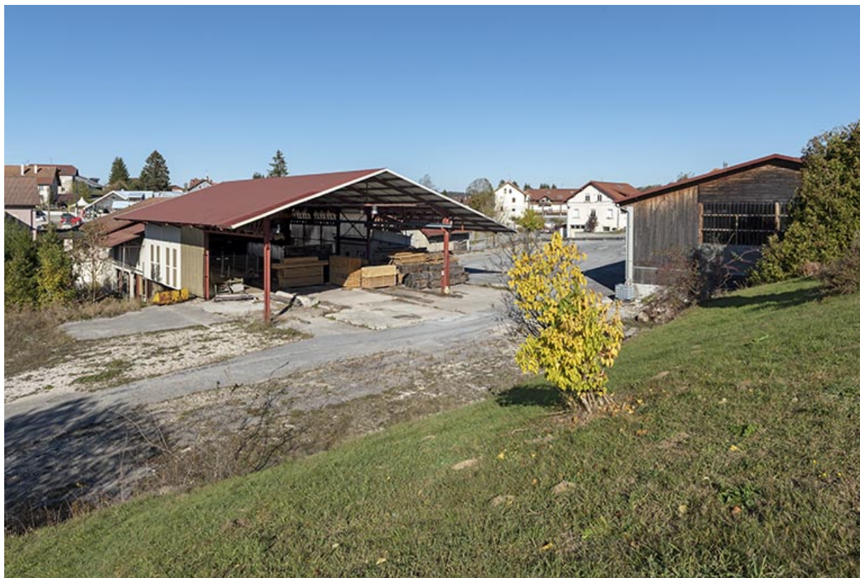
Ateliers de fabrication et magasin industriel, depuis le sud-ouest.