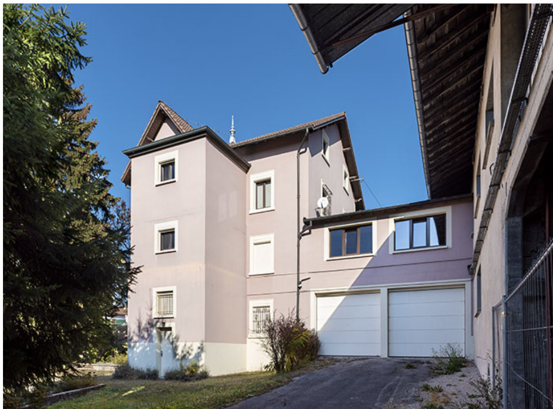
Deuxième maison : façade postérieure, de trois quarts droite.