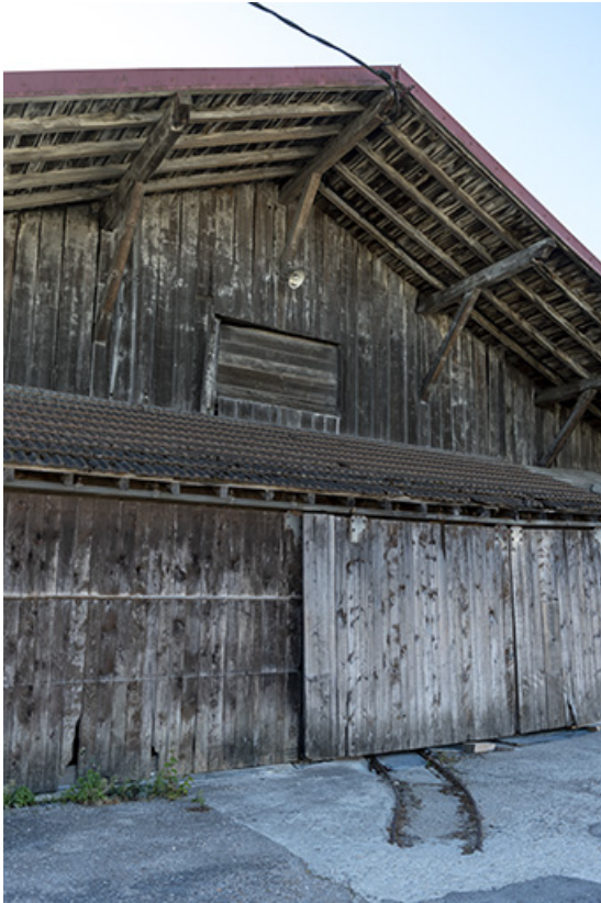
Atelier de 1919 : façade antérieure (nord). 25, Les Fins, 1-3 route de Maîche