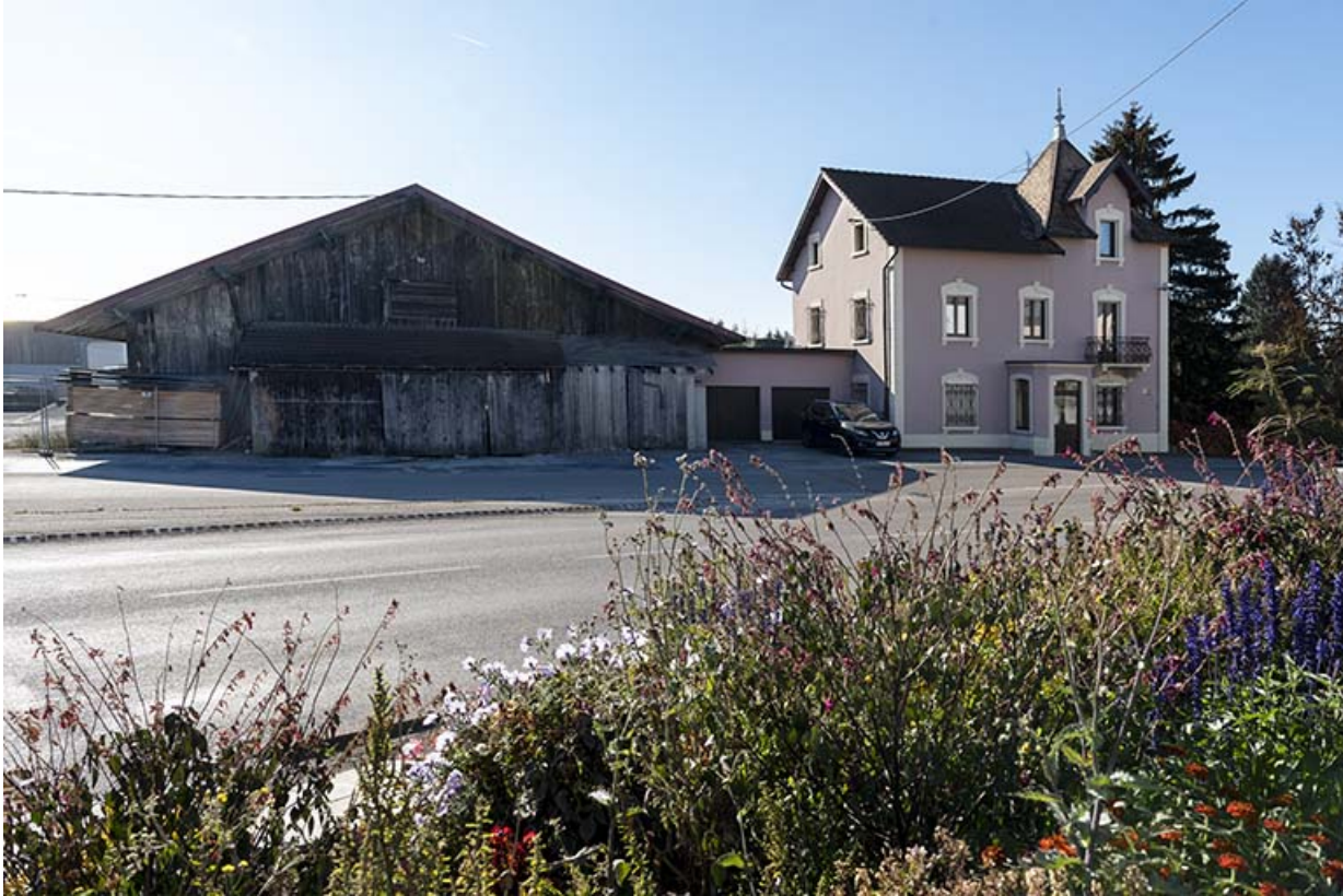
Atelier de 1919 et deuxième maison : façade antérieure (nord). 25, Les Fins, 1-3 route de Maîche