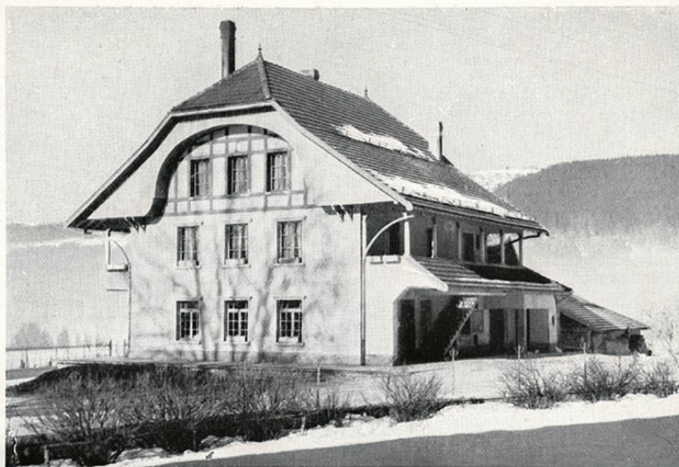
Une des fruitières les plus modernes : le chalet de fromagerie des Frénelots, dans le vallon de Morteau (Doubs).

Une des fruitières les plus modernes : le chalet de fromagerie des Frénelots, dans le vallon de Morteau (Doubs), 1949 ? 25, Les Fins, lieudit : les Frénelots