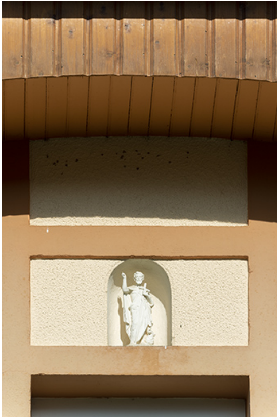
Façade antérieure : niche avec statuette de saint Jean-Baptiste.