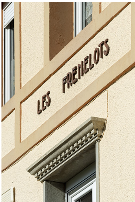
Façade antérieure : détail du décor.