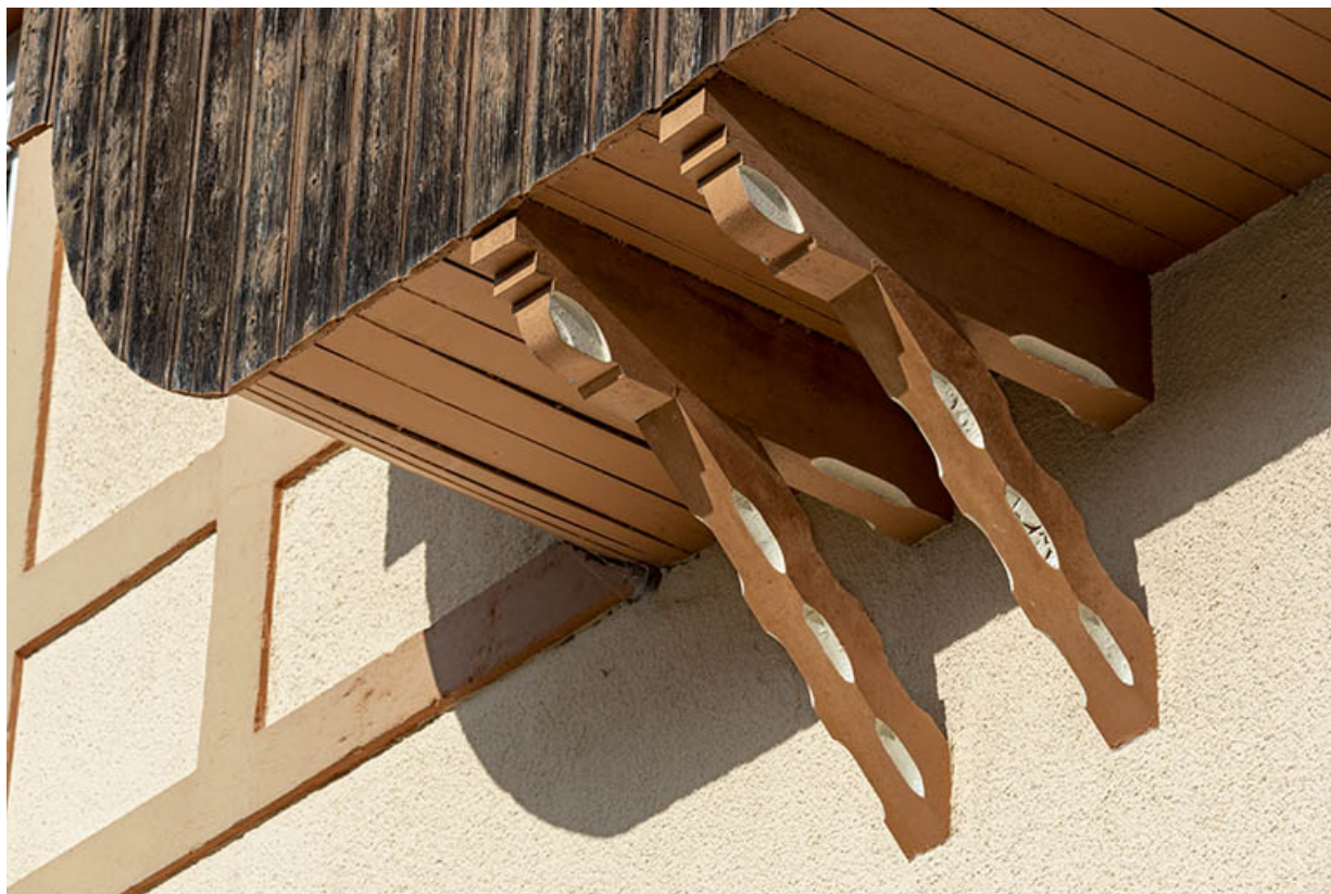
Façade antérieure : corbeaux en bois supportant le rang-pendu.