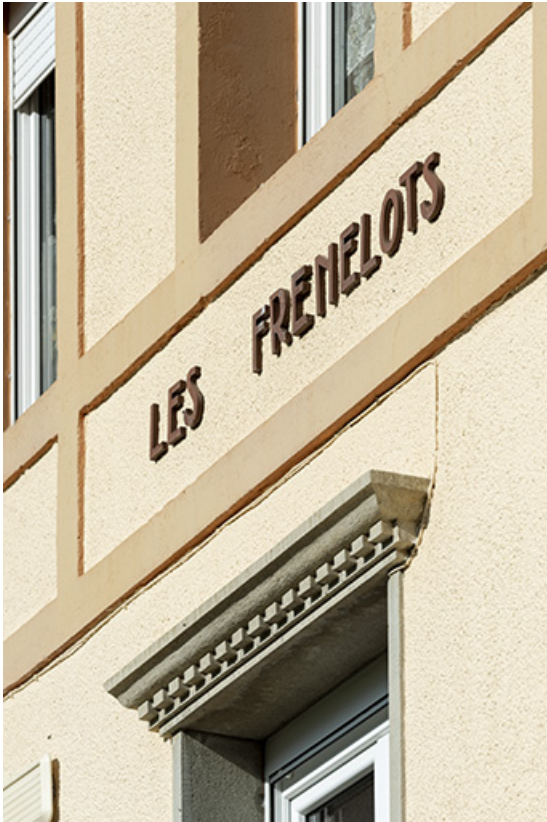
Façade antérieure : détail du décor.