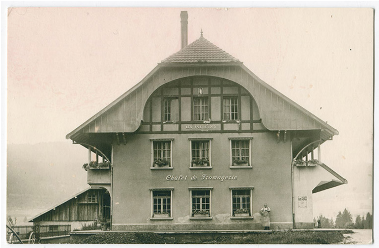
[Façade antérieure], milieu 20e siècle 25, Les Fins, lieudit : les Frenelots