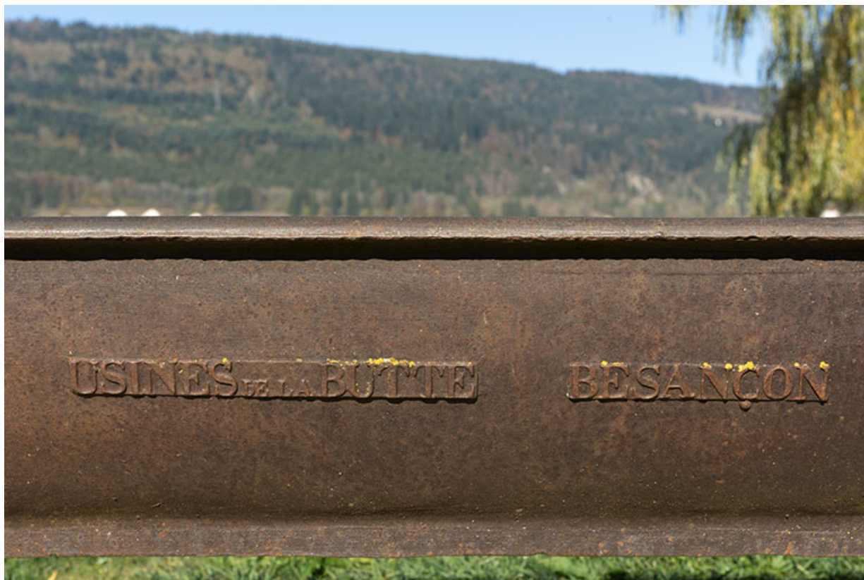
Auge-abreuvoir : nom de fabricant (Usines de la Butte, à Besançon). 25, Les Fins, lieudit : les Frenelots