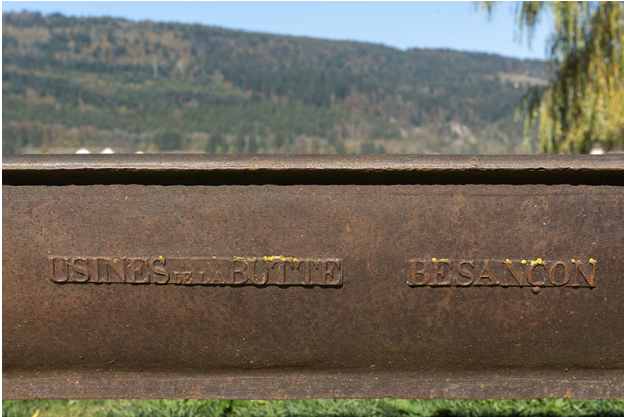
Auge-abreuvoir : nom de fabricant (Usines de la Butte, à Besançon).