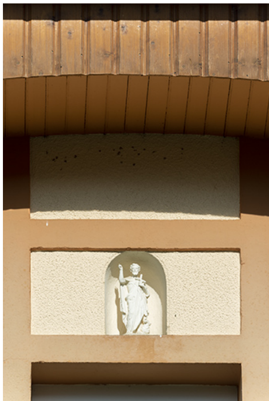
Façade antérieure : niche avec statuette de saint Jean-Baptiste.