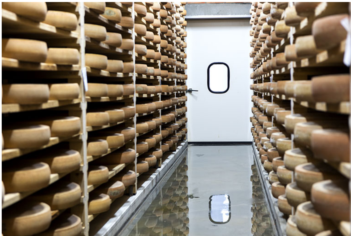
Cave d'affinage : intérieur d'une pièce, porte fermée. 25, Les Fins, 2 rue du Paradis