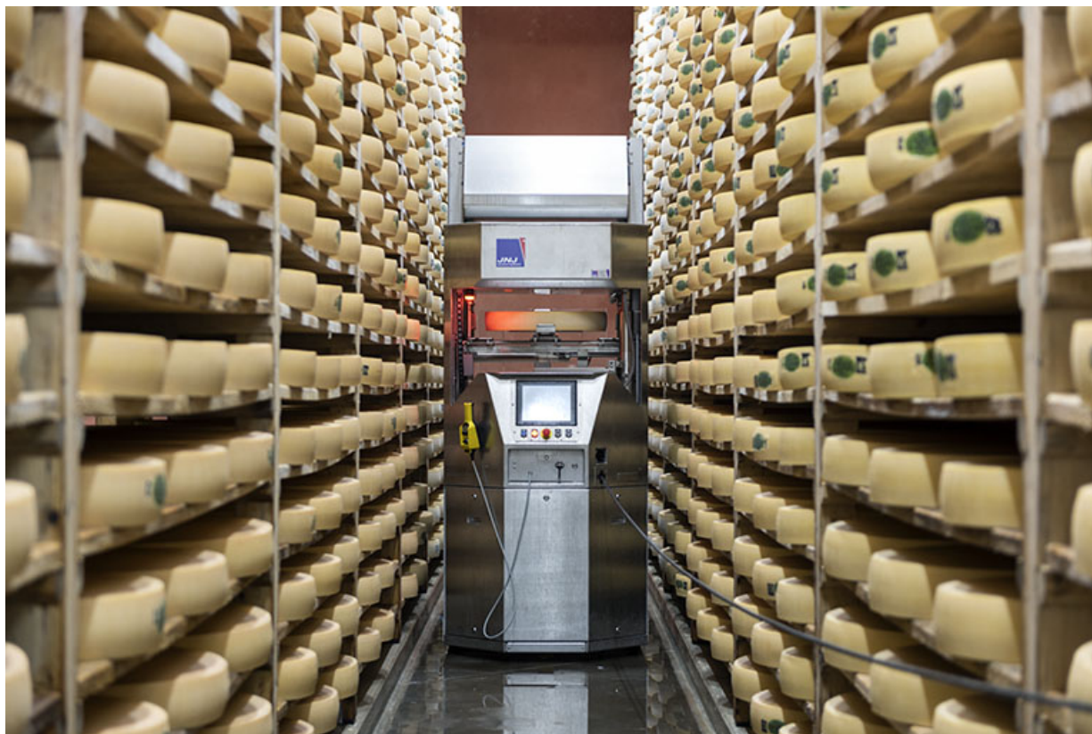
Cave d'affinage : intérieur d'une pièce avec le robot de soins. 25, Les Fins, 2 rue du Paradis