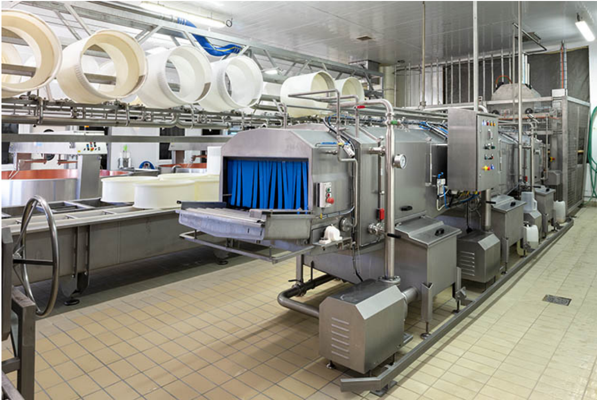
Atelier de fabrication : tunnel de lavage des moules.