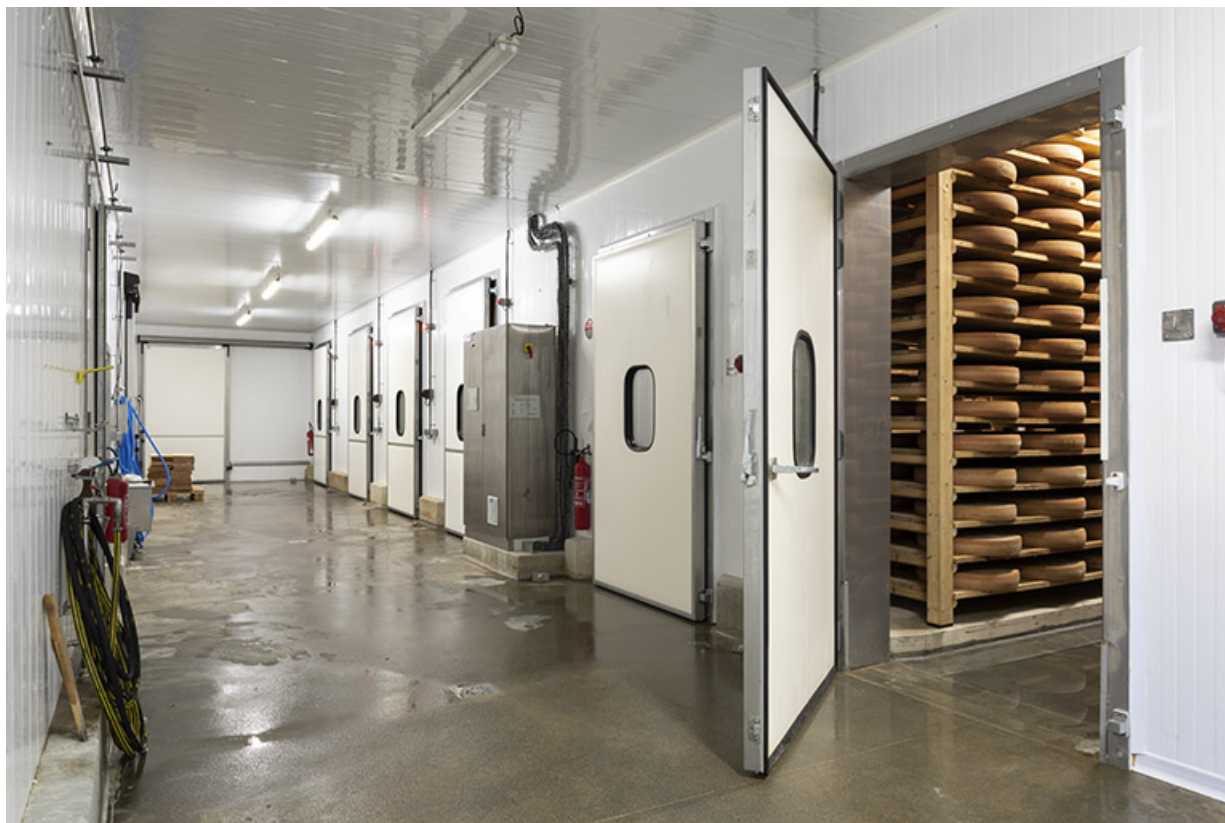
Cave d'affinage : couloir desservant les pièces.