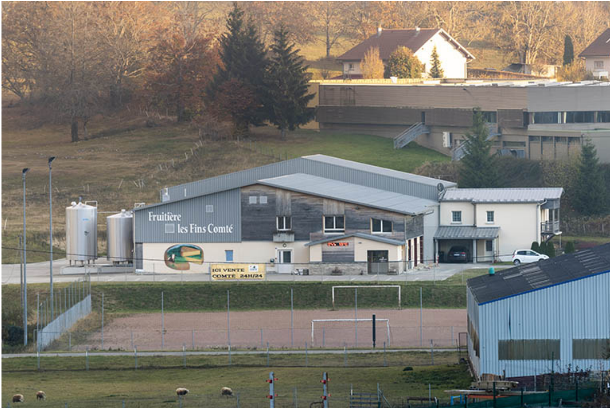
Vue plongeante sur la façade antérieure, depuis le nord.