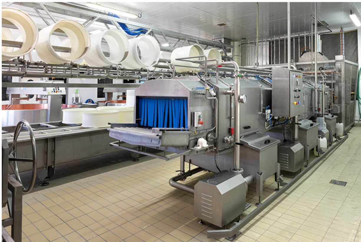
Atelier de fabrication : tunnel de lavage des moules.