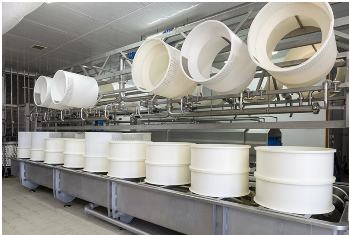
Atelier de fabrication : installation de soutirage et moulage. 25, Les Fins, 2 rue du Paradis