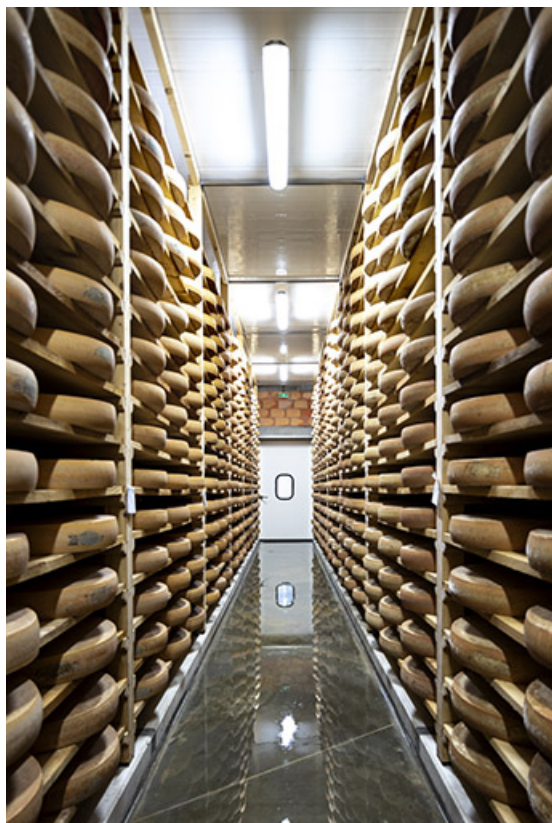
Cave d'affinage : intérieur d'une pièce, depuis le fond. 25, Les Fins, 2 rue du Paradis