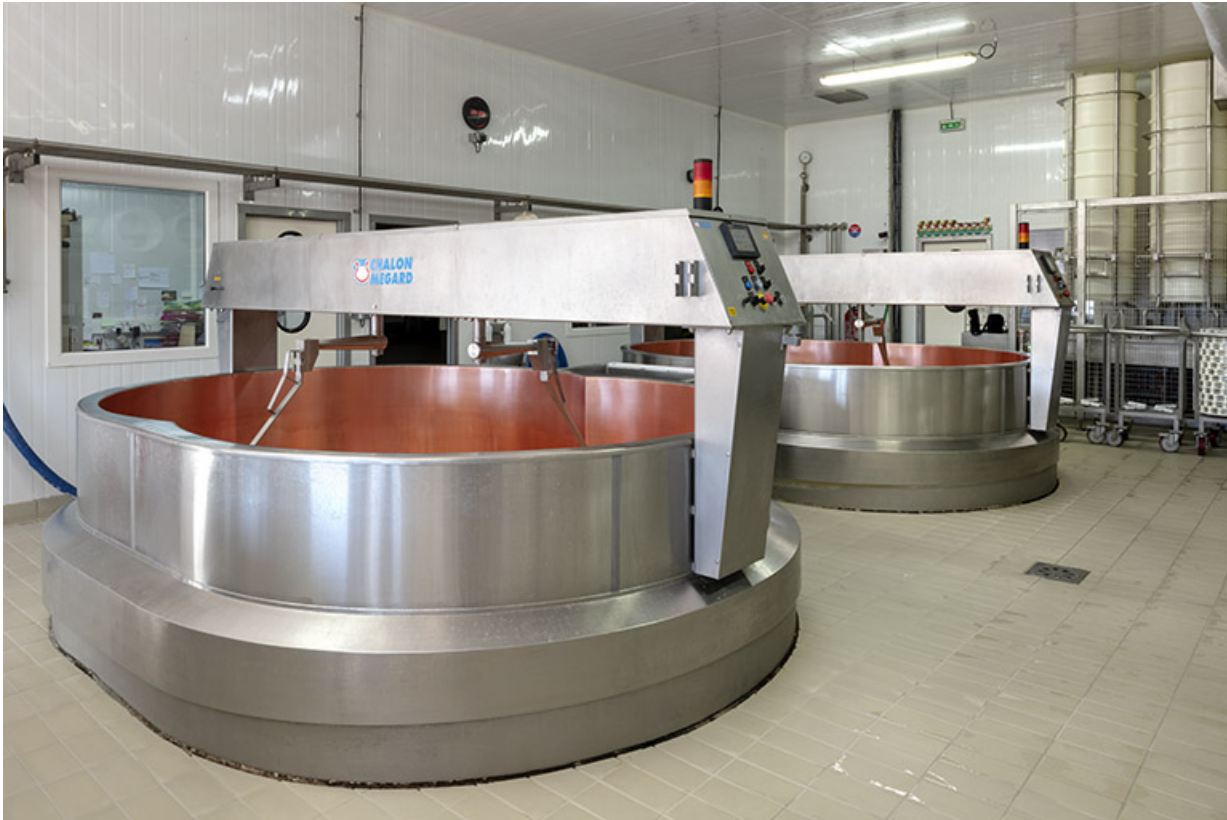
Atelier de fabrication : deux des trois cuves.