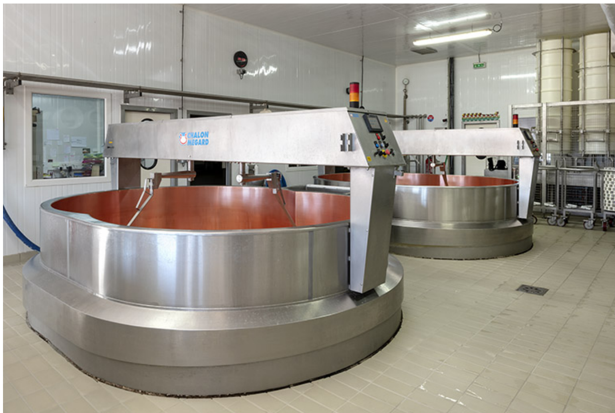
Atelier de fabrication : deux des trois cuves. 25, Les Fins, 2 rue du Paradis