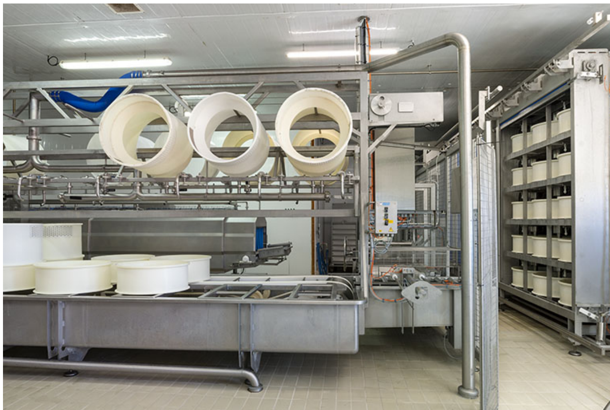
Atelier de fabrication : installations de soutirage et moulage à gauche, de pressage à droite. 25, Les Fins, 2 rue du Paradis