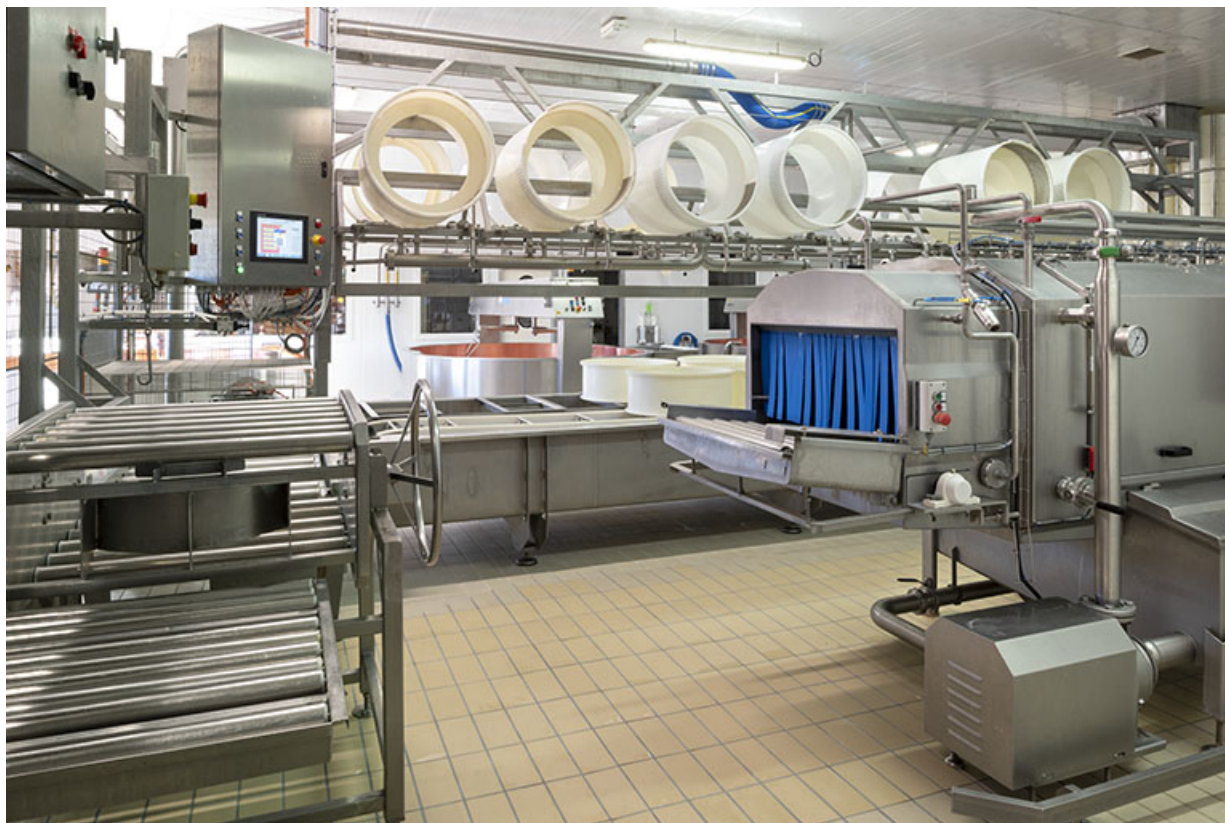
Atelier de fabrication : système de transfert des moules à gauche (avec le tableau de commande du pressage), extrémité du tunnel de lavage à droite.