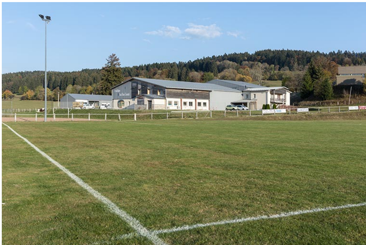
Vue d'ensemble, depuis l'ouest.