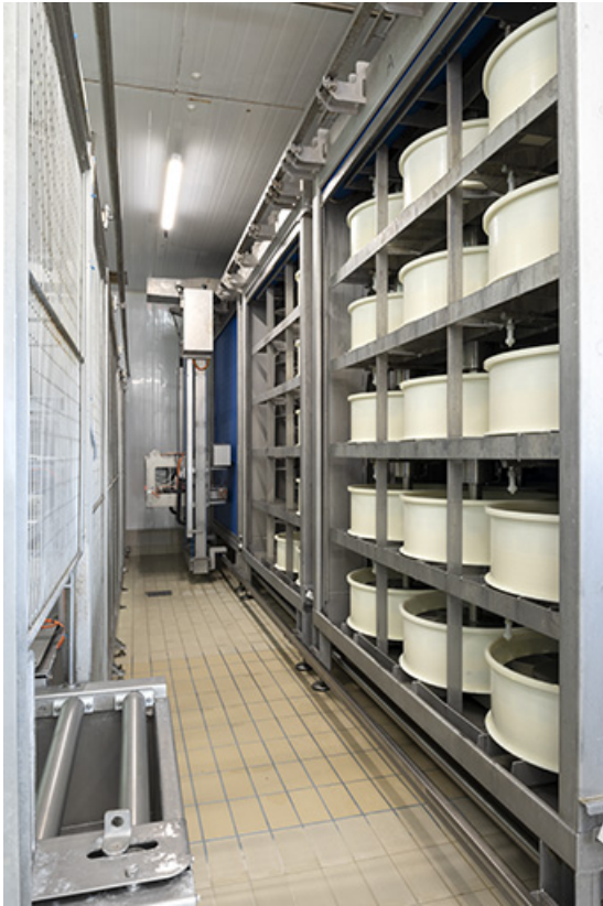
Atelier de fabrication : pressage.