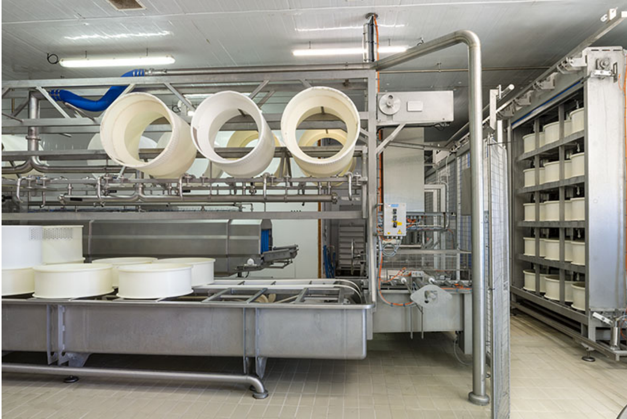
Atelier de fabrication : installations de soutirage et moulage à gauche, de pressage à droite. 25, Les Fins, 2 rue du Paradis