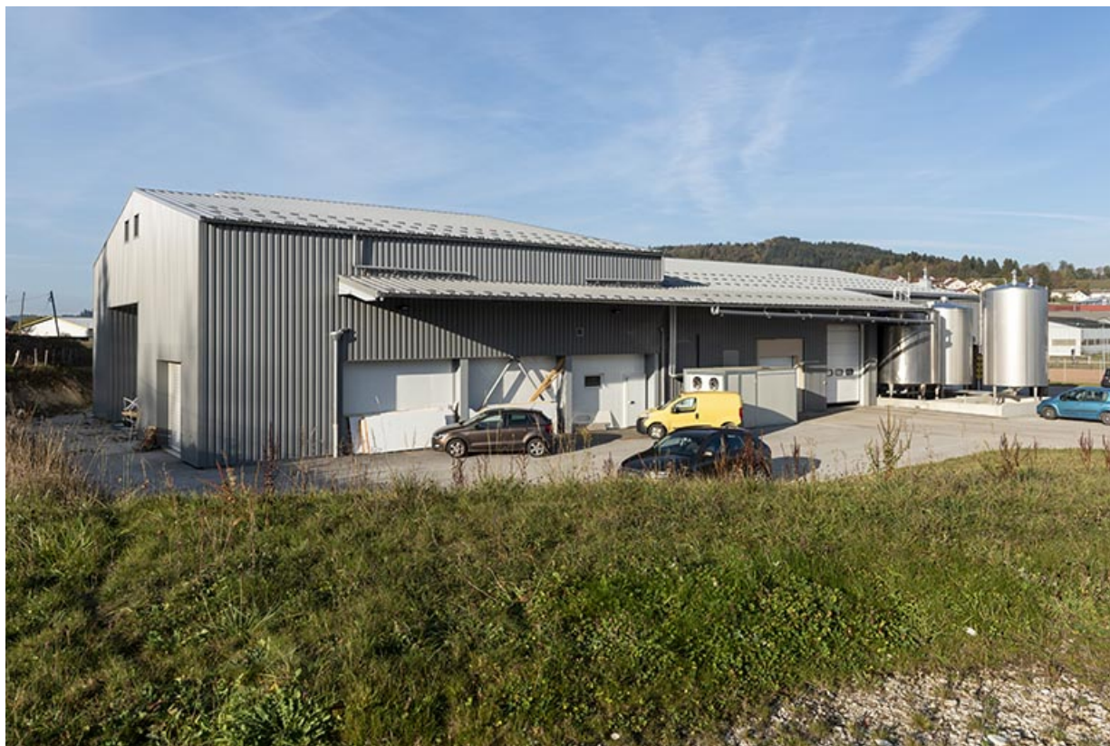
Façade latérale gauche, de trois quarts gauche.