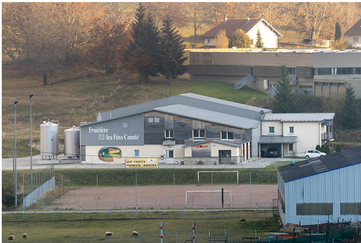
Vue plongeante sur la façade antérieure, depuis le nord.