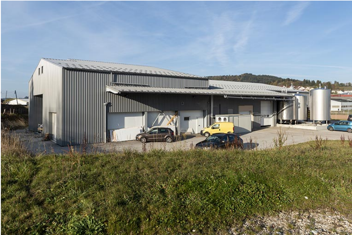
Façade latérale gauche, de trois quarts gauche.