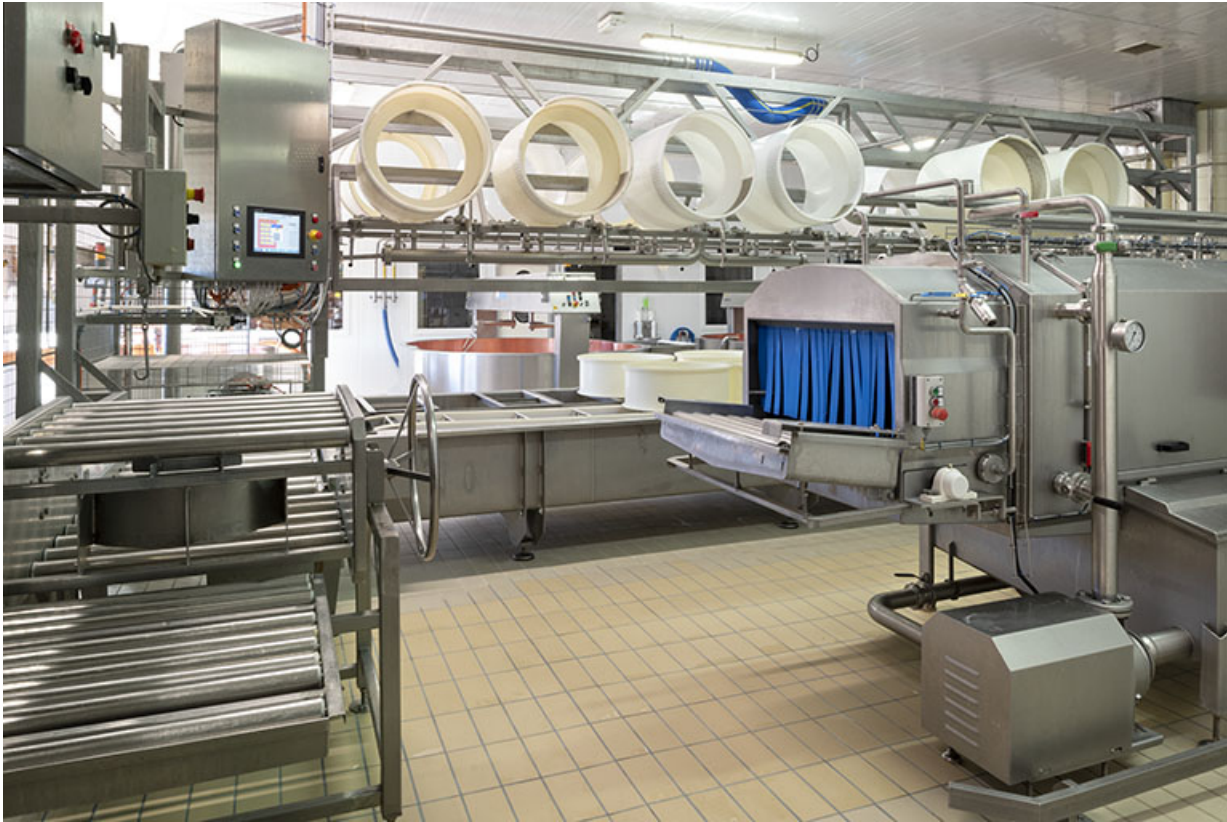
Atelier de fabrication : système de transfert des moules à gauche (avec le tableau de commande du pressage), extrémité du tunnel de lavage à droite.