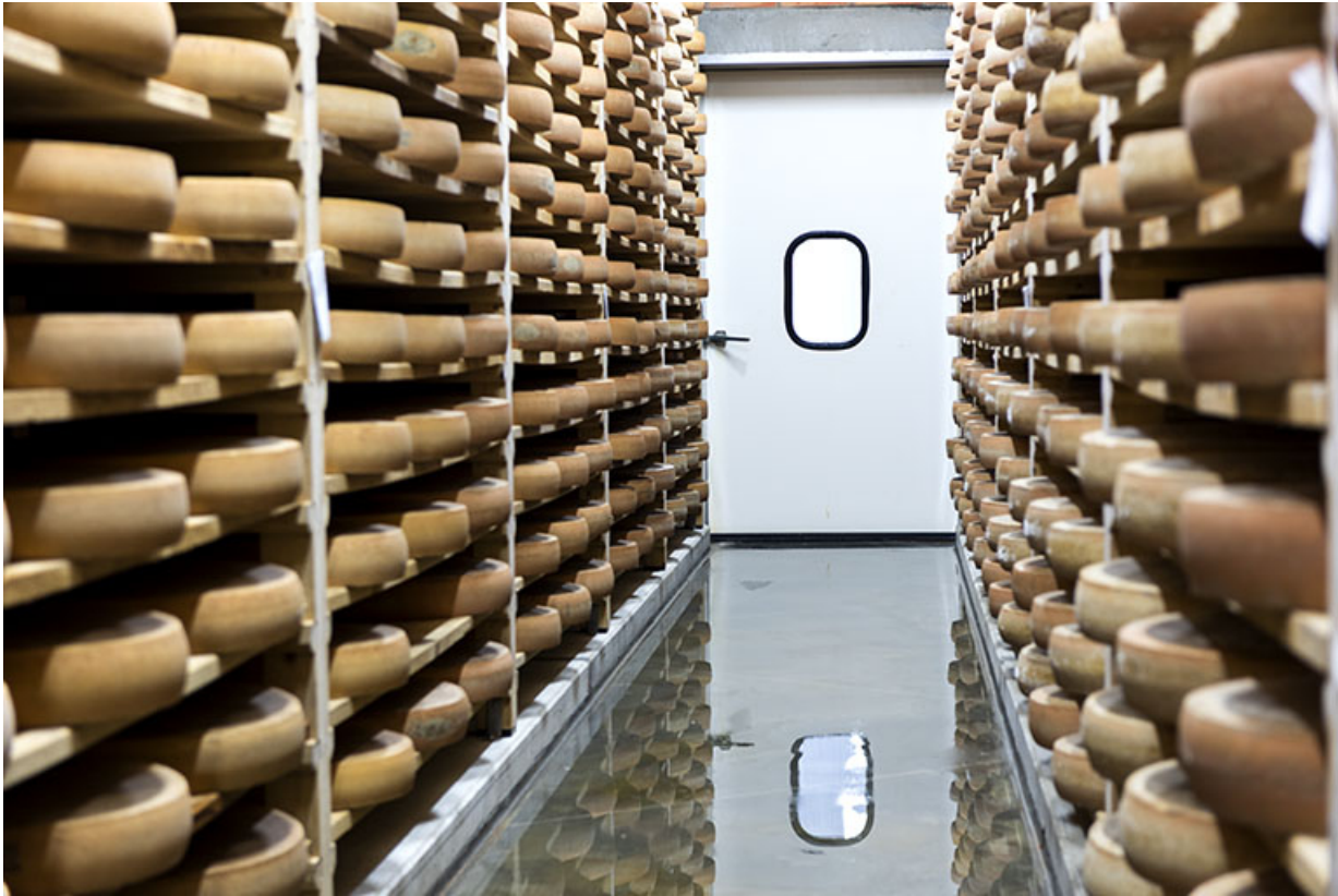
Cave d'affinage : intérieur d'une pièce, porte fermée.