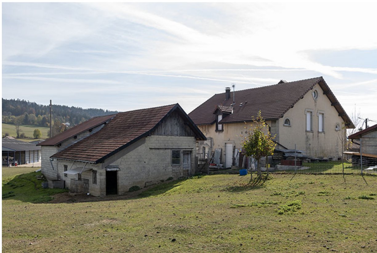
Vue d'ensemble, depuis le nord-ouest.