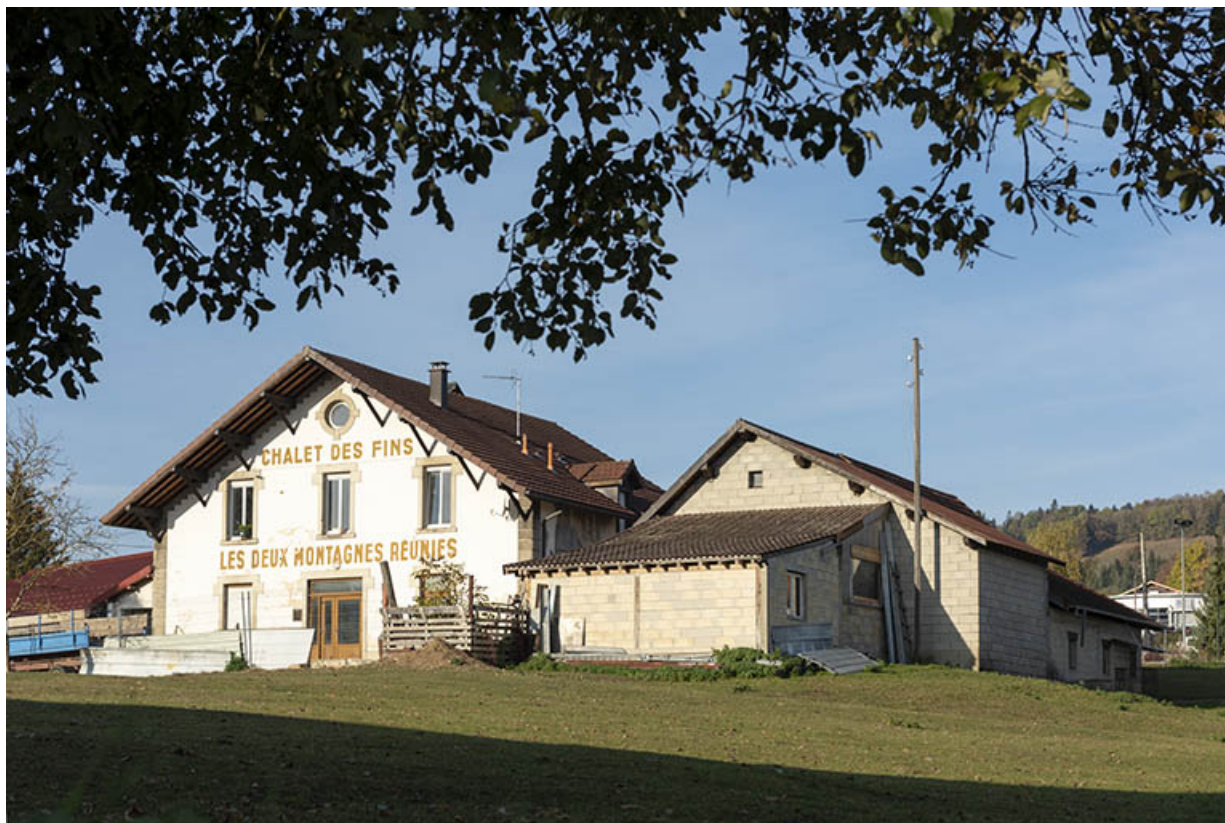
Vue d'ensemble, depuis le nord-est.