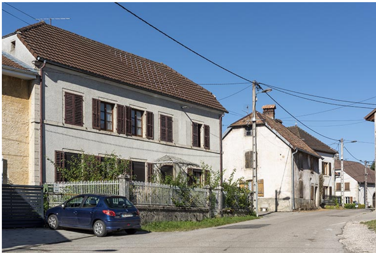
Vue d'ensemble, depuis l'est. Maison de 1859 (n° 45) à gauche, maisons de Nicolas Gueutal (n° 49 et 53) à droite. 25, Montécheroux, 45-47 Grande Rue