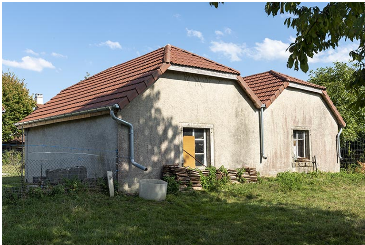
Forges : façade postérieure, de trois quarts gauche.