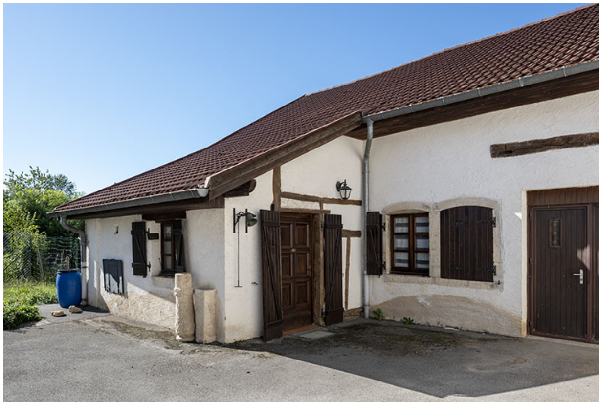
Maison au n° 47 : façade antérieure, de trois quarts droite. 25, Montécheroux, 45-47 Grande Rue