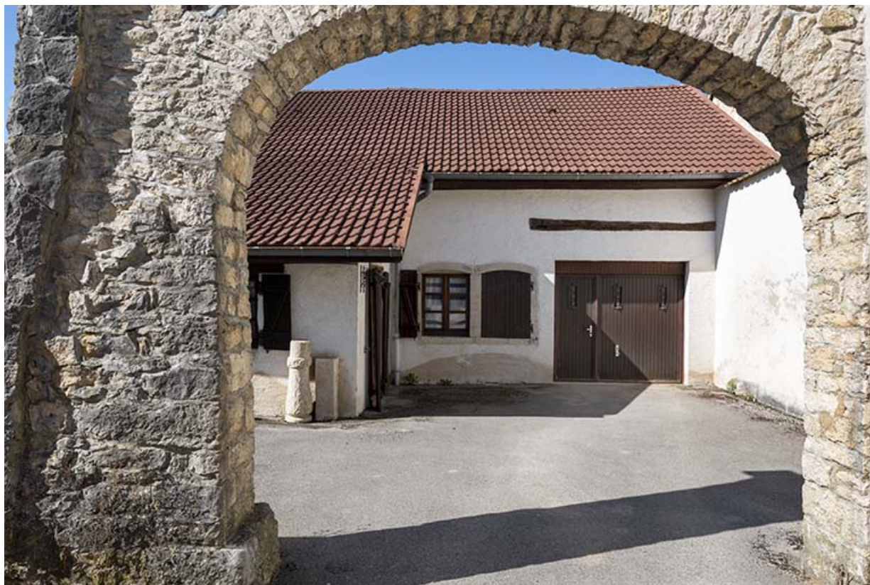
Maison au n° 47, depuis l'entrée.