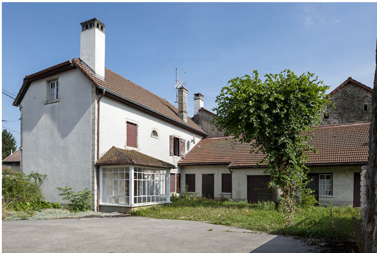
Maison au n° 45 (façade postérieure) et corps abritant logement et garage. 25, Montécheroux, 45-47 Grande Rue