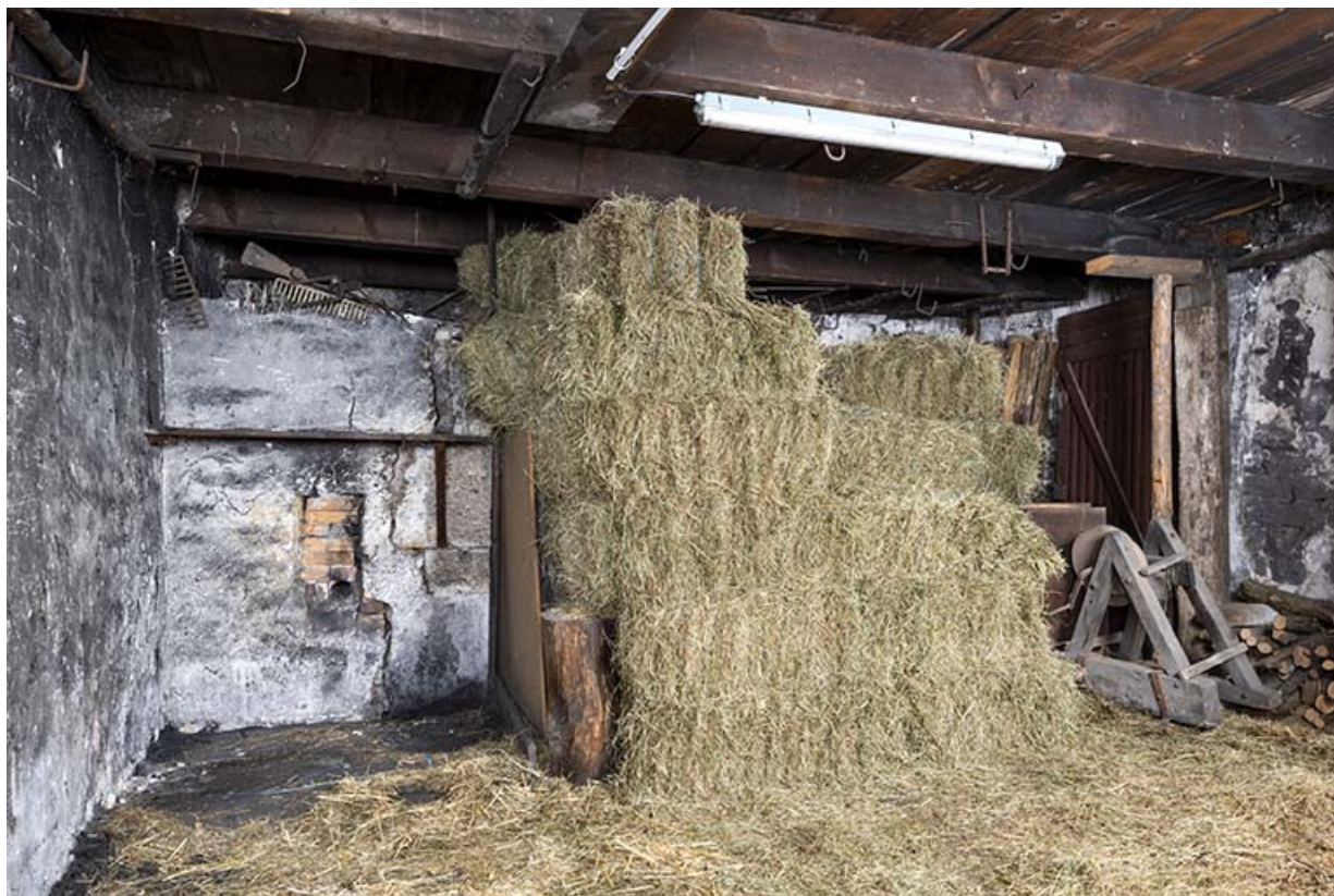
Forge sud : 2e foyer (à gauche derrière le tas de foin). 25, Montécheroux, 45-47 Grande Rue