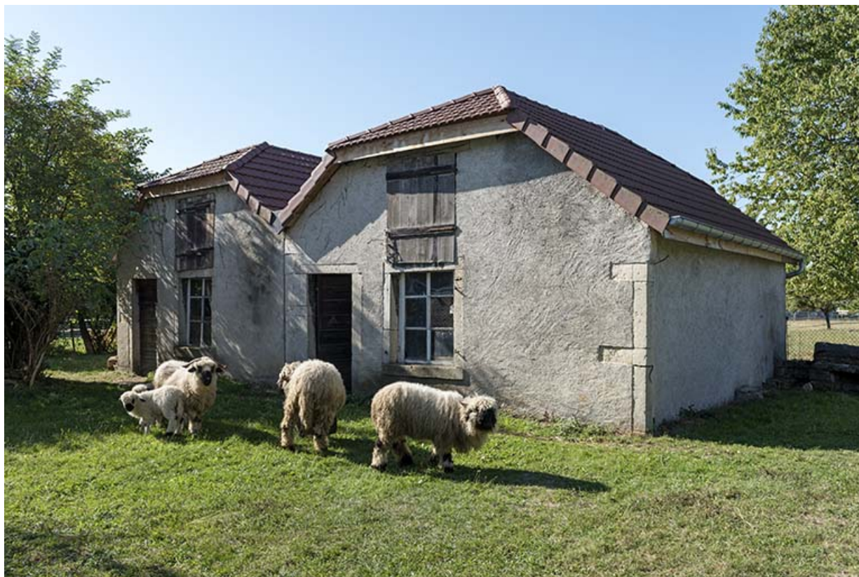
Forges : façade antérieure, de trois quarts droite. 25, Montécheroux