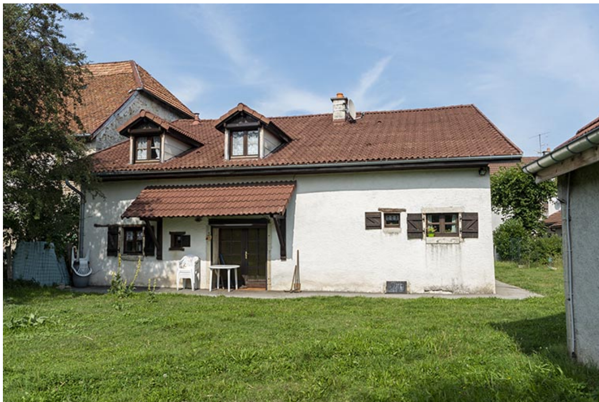
Maison au n° 47 : façade postérieure. 25, Montécheroux, 45-47 Grande Rue