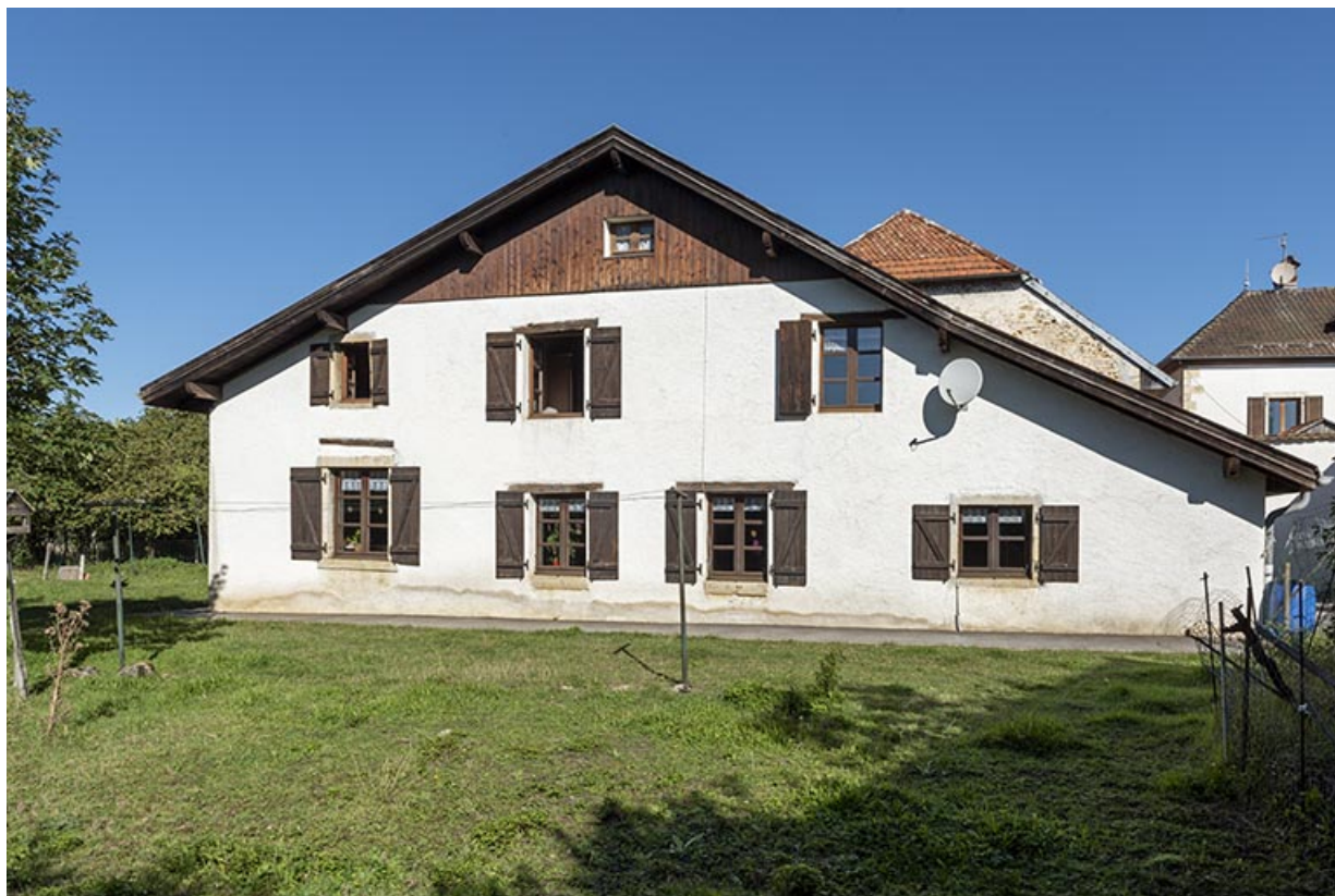
Maison au n° 47 : façade latérale gauche.