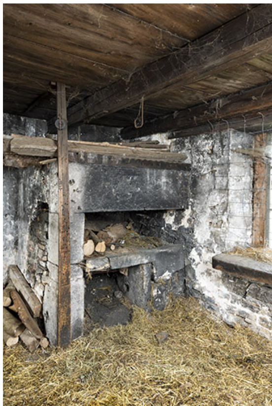
Forge nord : foyer.