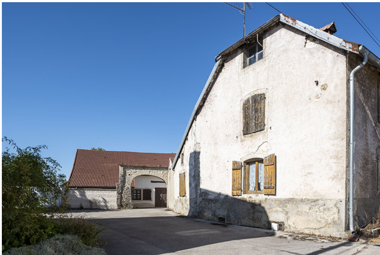
Maison au n° 47, depuis la Grande Rue. A droite, la façade latérale gauche de la maison de Nicolas Gueutal (n° 49). 25, Montécheroux, 45-47 Grande Rue