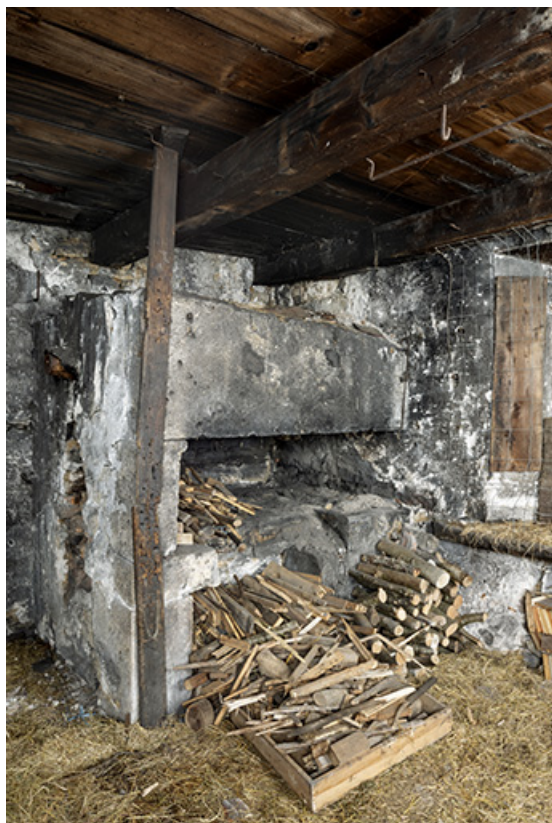
Forge sud : 1er foyer.