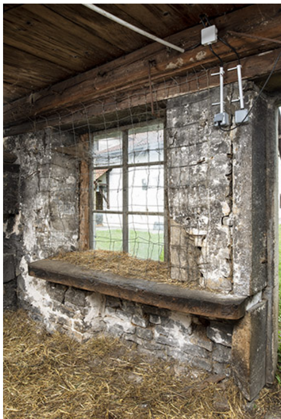
Forge nord : fenêtre et établi.