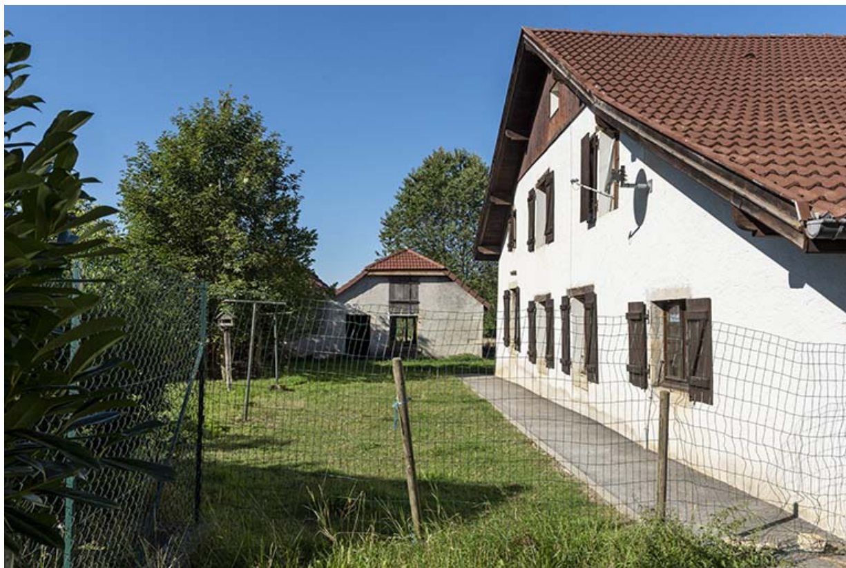
Maison au n° 47 : façade latérale gauche, vue en enfilade. Au fond, les forges. 25, Montécheroux, 45-47 Grande Rue