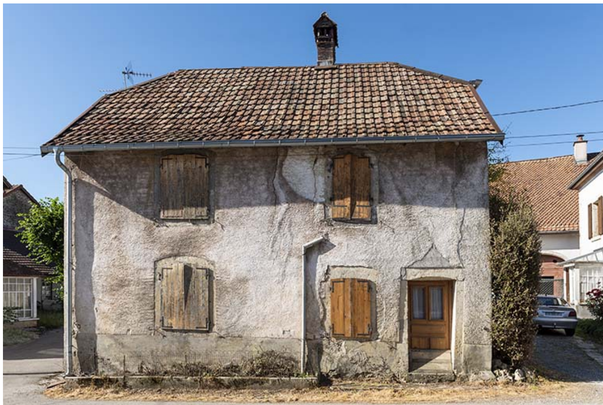
Maison de 1786 : façade antérieure. 25, Montécheroux