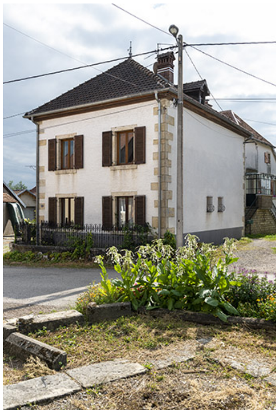
Maison de 1853, de trois quarts droite.