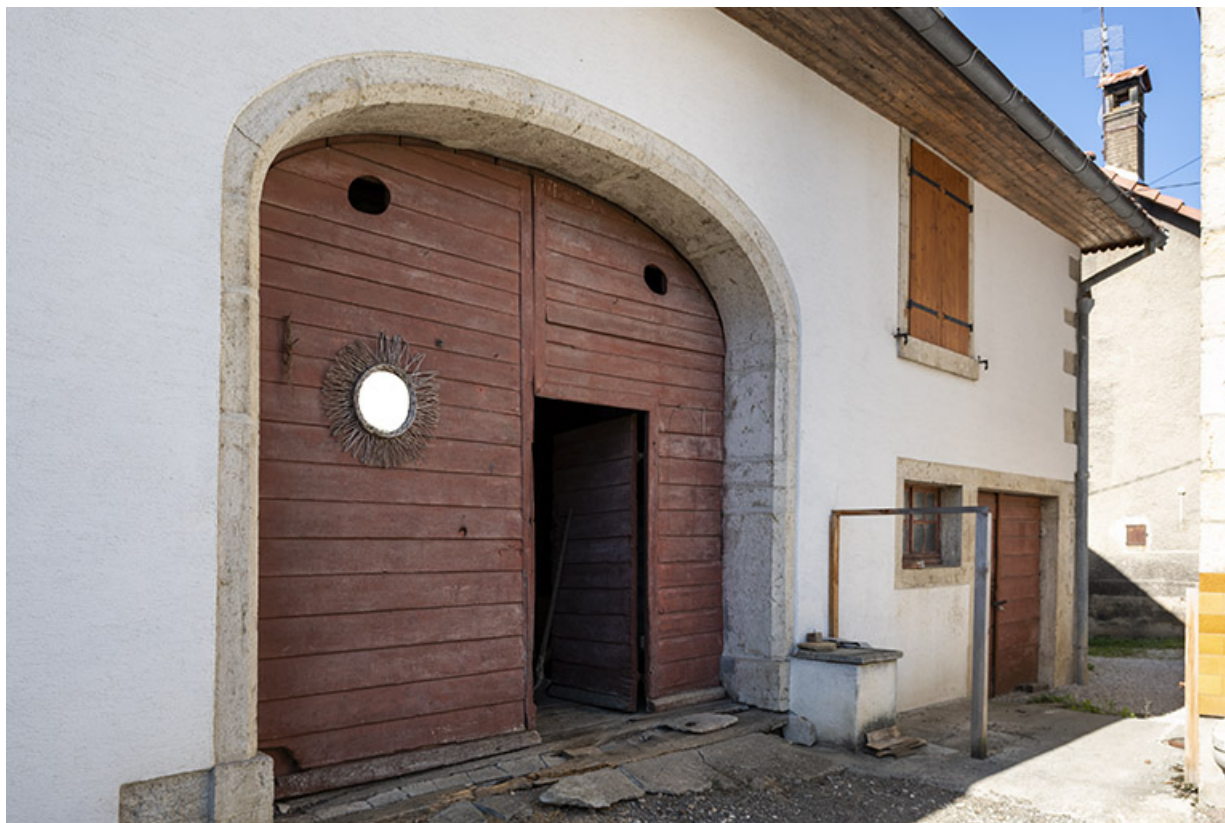
Grange : façade antérieure, de trois quarts gauche. 25, Montécheroux, 49-53 Grande Rue