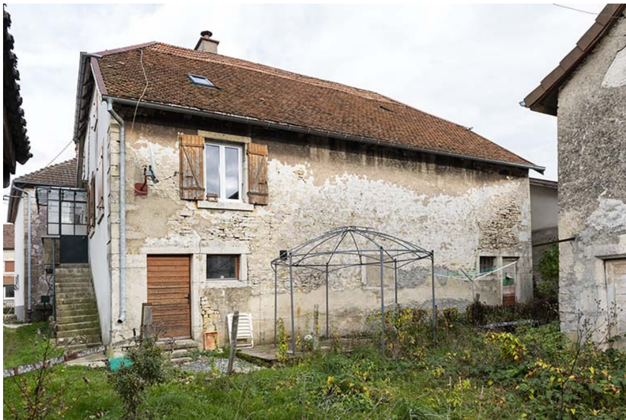
Grange : façade postérieure.