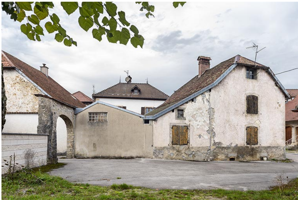
Vue d'ensemble, depuis le sud-est.