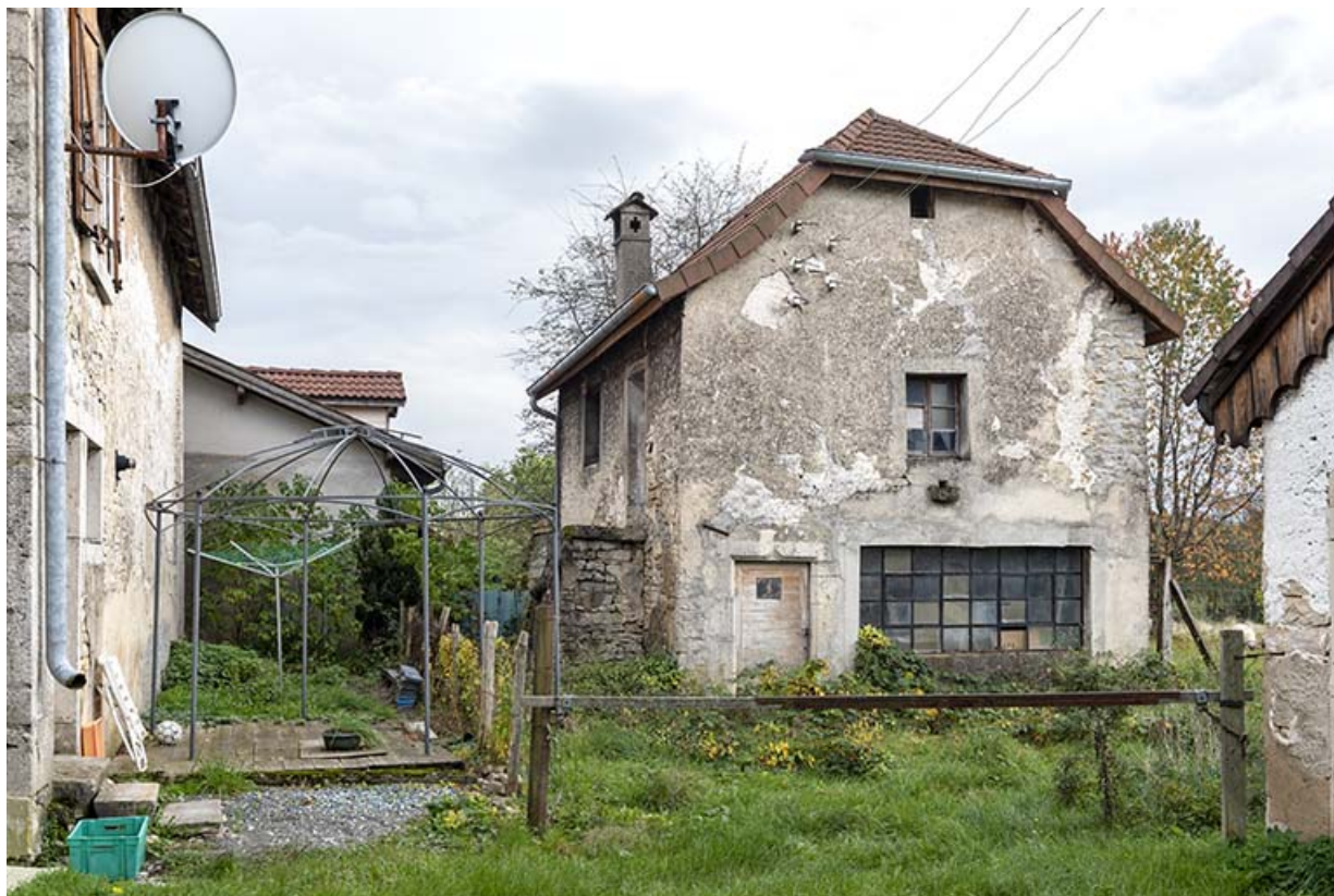
Forge. Façade postérieure de la grange à gauche. 25, Montécheroux, 49-53 Grande Rue