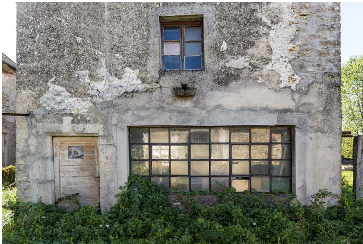
Forge, façade antérieure : porte et fenêtres.