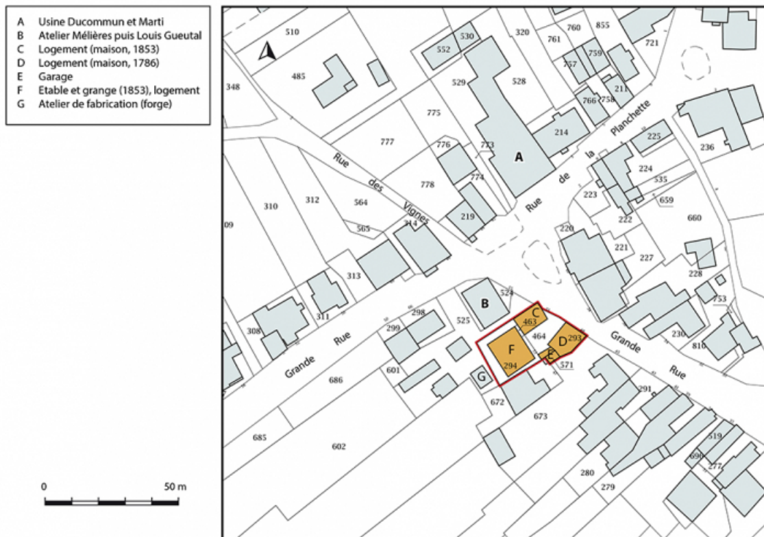
Plan-masse et de situation. Extrait du plan cadastral, 2019, section D. 25, Montécheroux, 49-53 Grande Rue