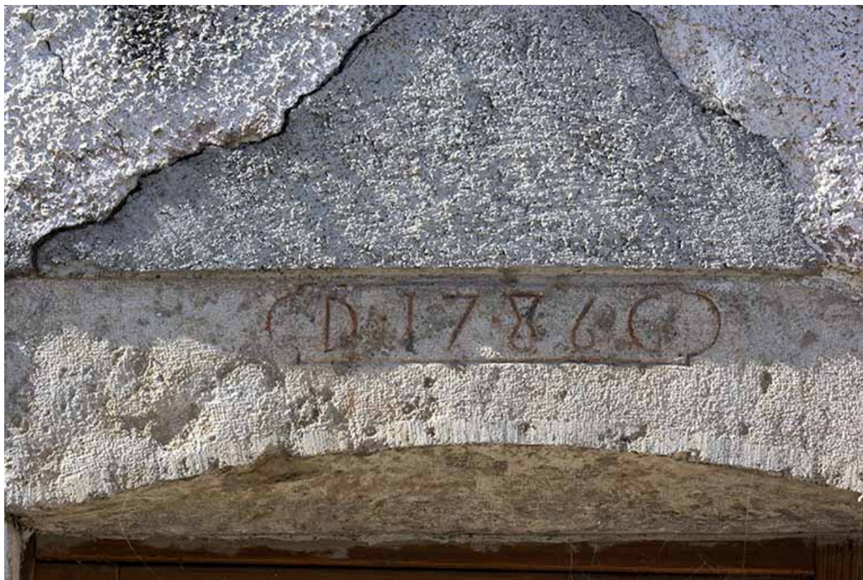
Maison de 1786, façade antérieure : linteau daté.