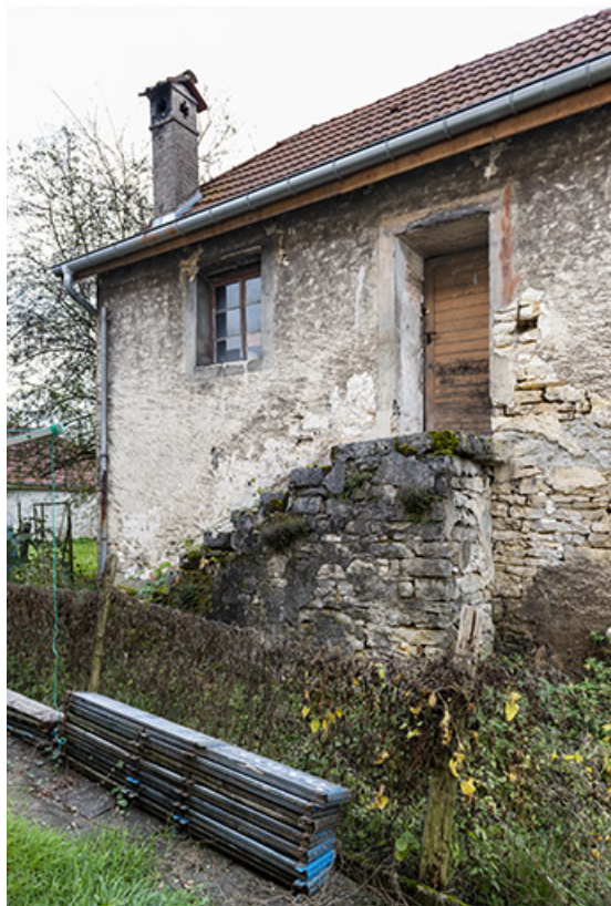
Forge : façade latérale gauche.