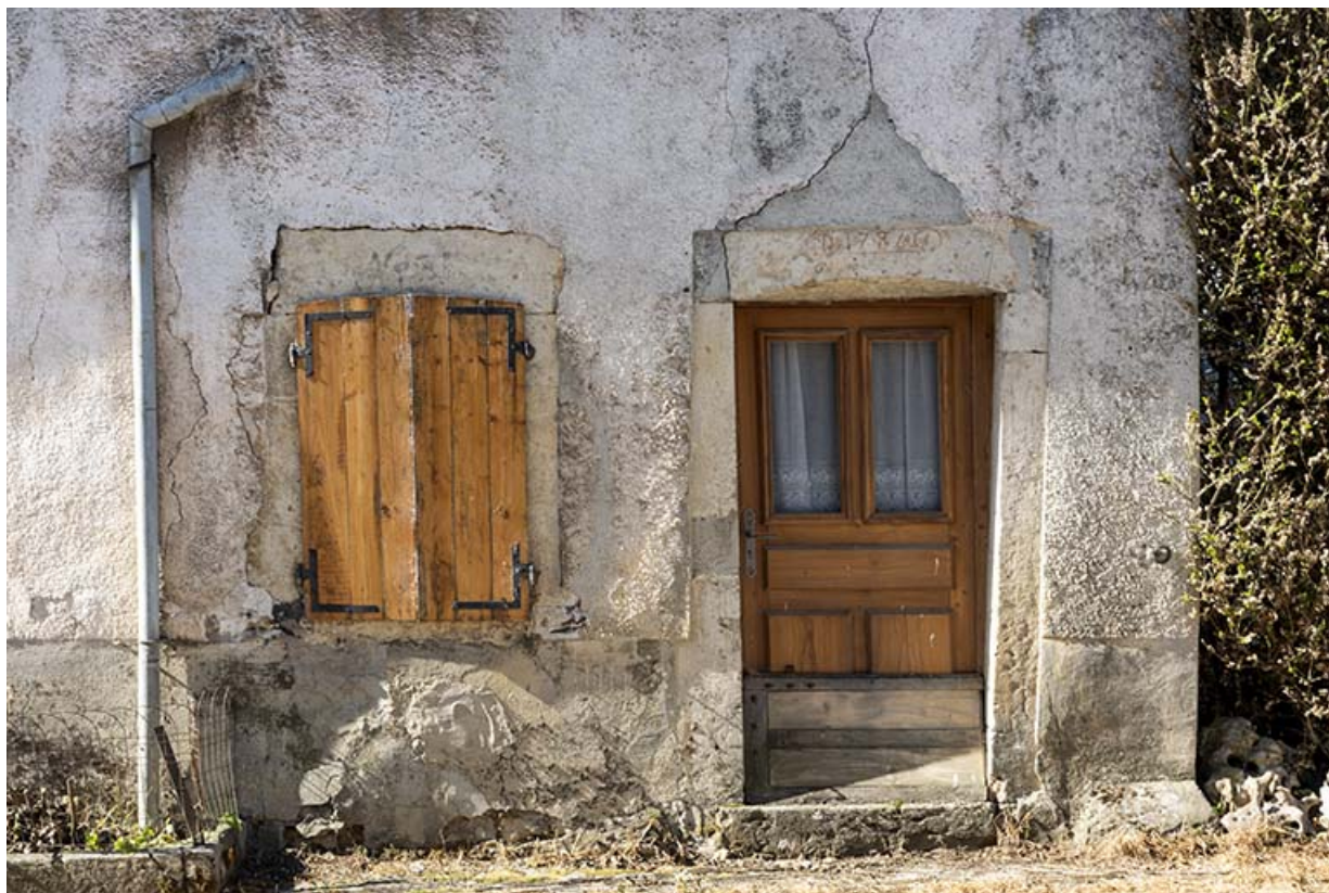
Maison de 1786, façade antérieure : porte et fenêtre.