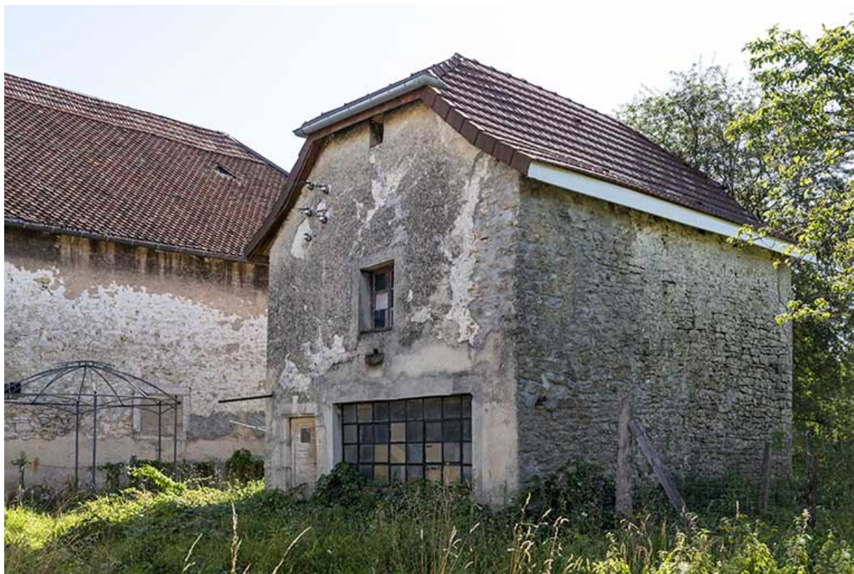
Forge : façades antérieure et latérale droite.