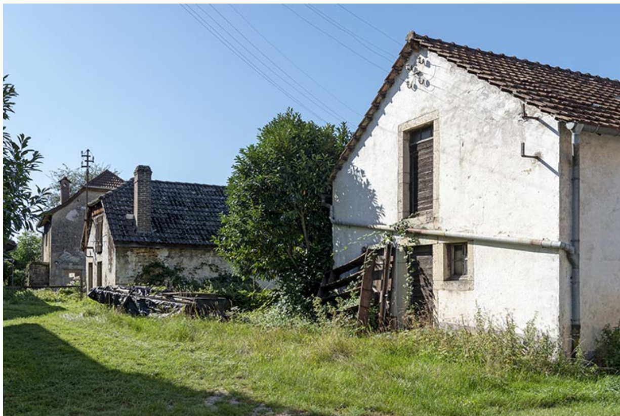
Vue d'ensemble de la forge, depuis la rue au nord. A droite, l'extrémité du bloc grange-écurie (également forge ?). 25, Montécheroux, 55, 66 Grande Rue