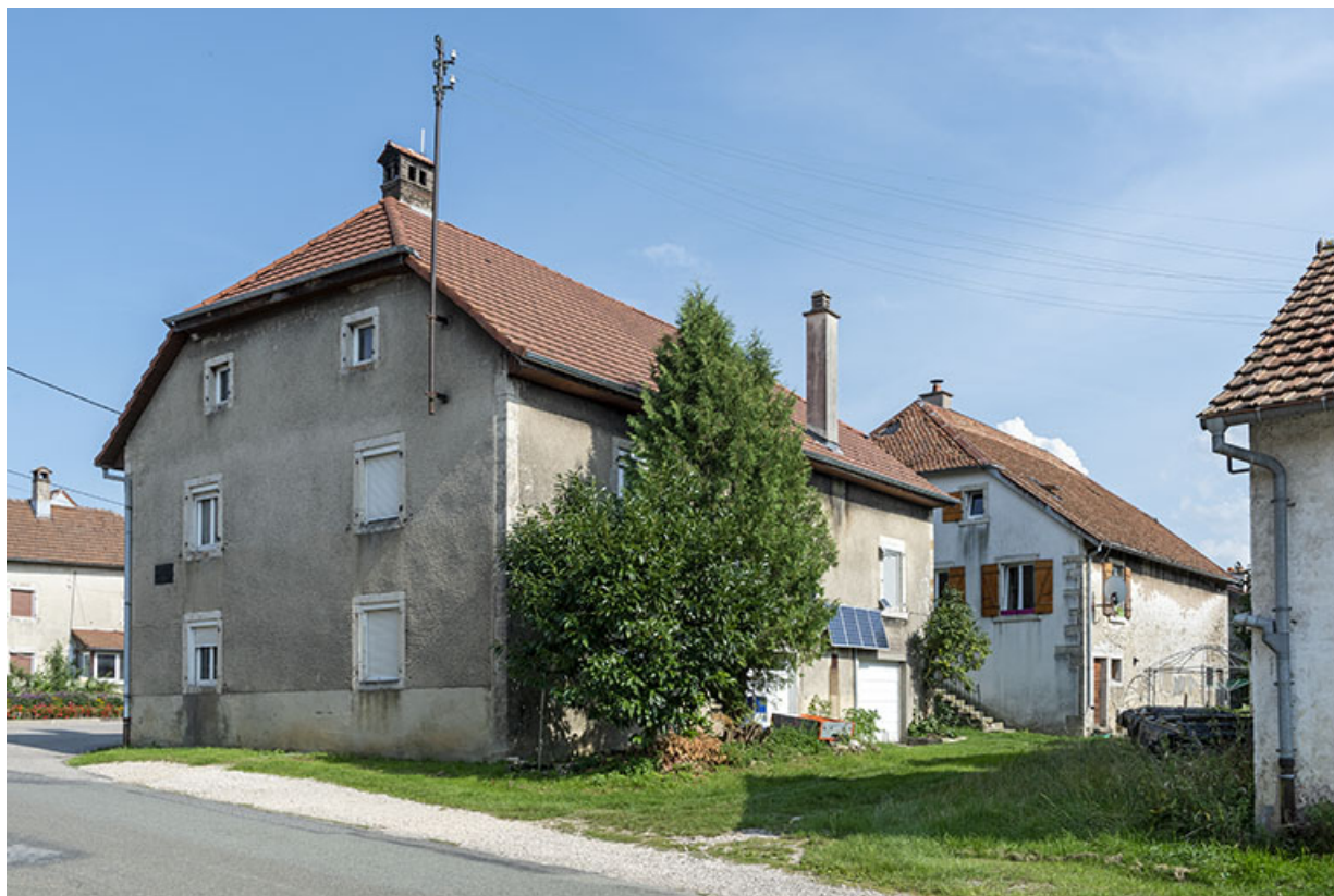
Bureau et logement : façades postérieure et latérale droite.