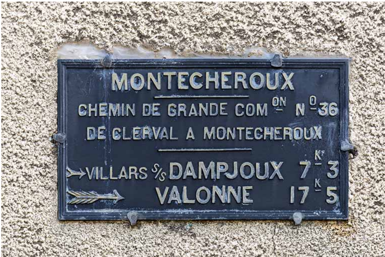
Bureau et logement : panneau indicateur sur la façade latérale droite. 25, Montécheroux, 55, 66 Grande Rue