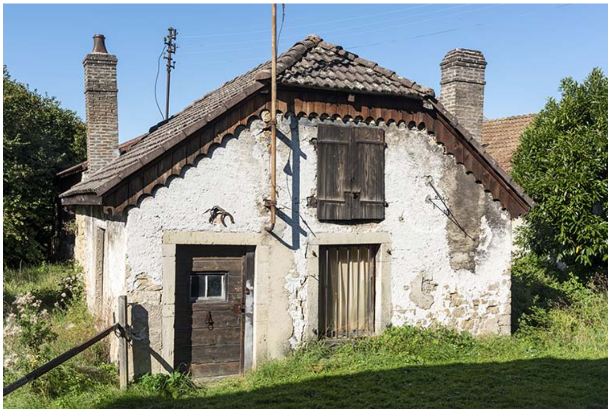
Forge, de trois quarts gauche.