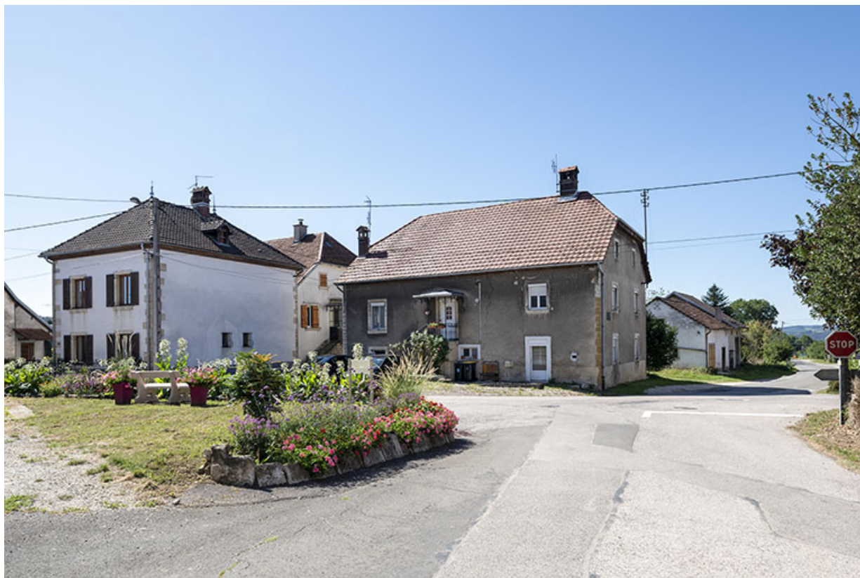
Vue d'ensemble, depuis le nord.

25, Montécheroux, 1-3 rue de la Planchette