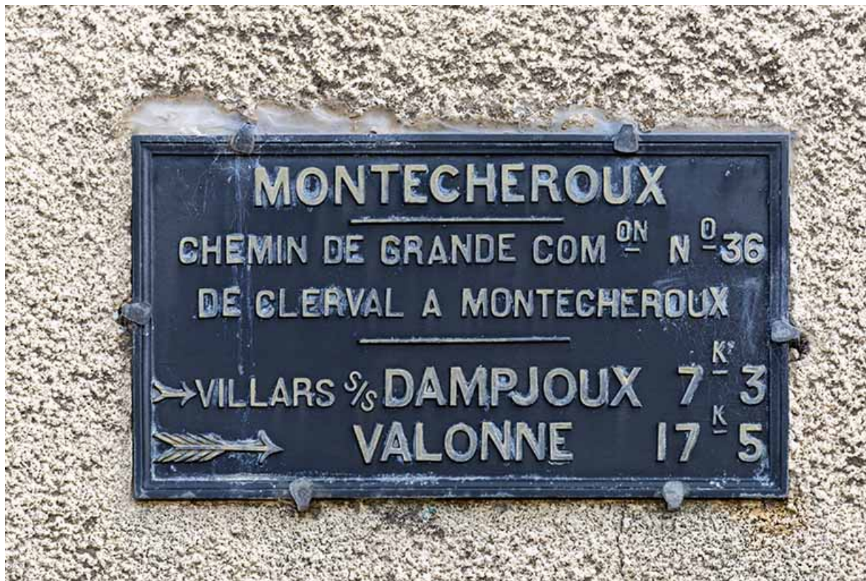
Bureau et logement : panneau indicateur sur la façade latérale droite.