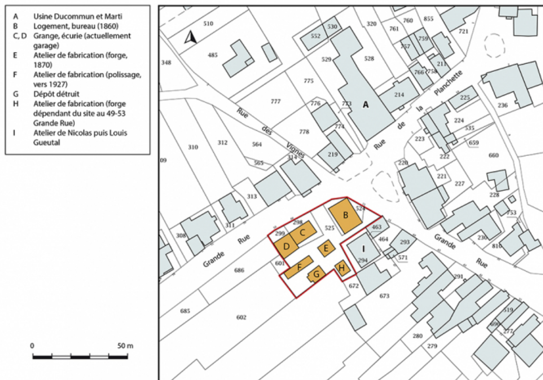
Plan-masse et de situation. Extrait du plan cadastral, 2019, section D. 25, Montécheroux, 55, 66 Grande Rue