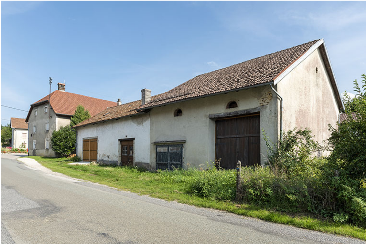
Anciennes grange et écurie, de trois quarts droite.