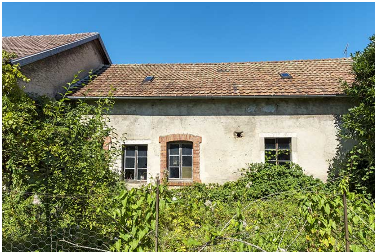
Anciennes grange et écurie : façade postérieure.