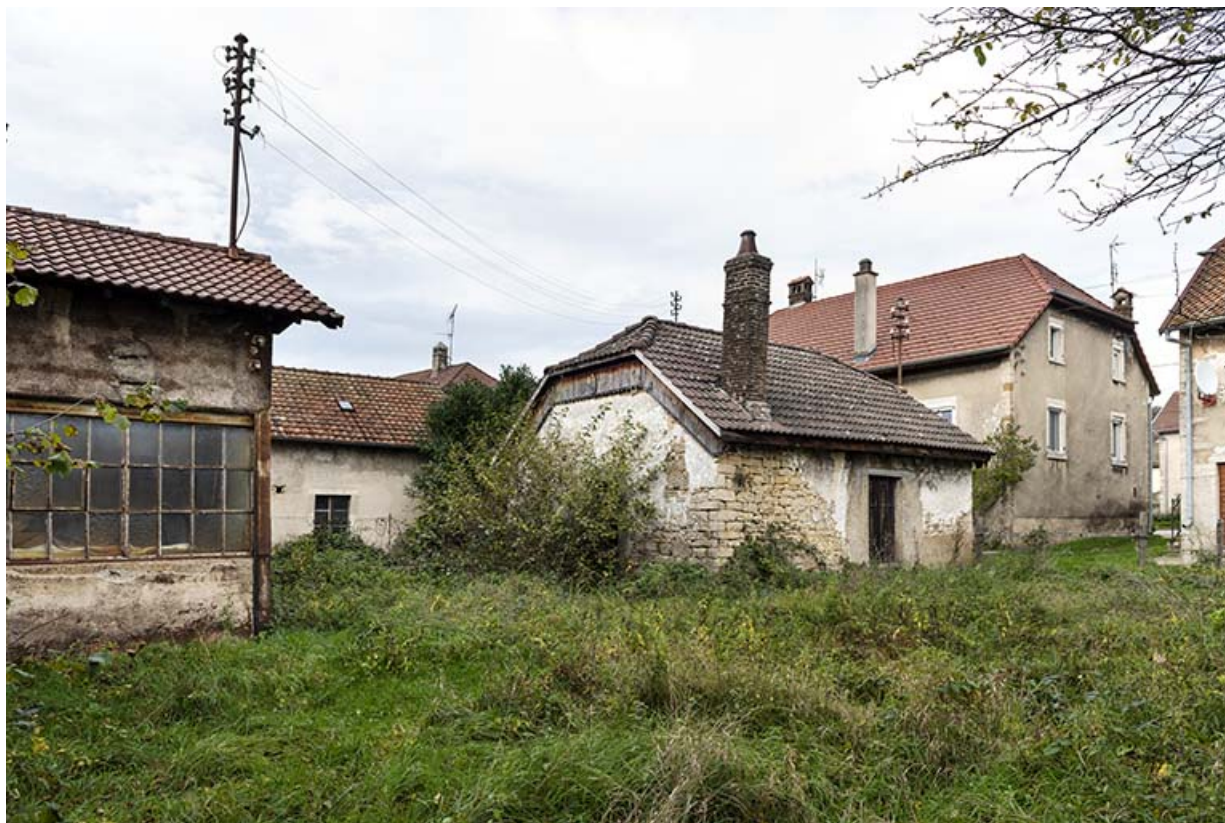
Forge : façades postérieure et latérale gauche.