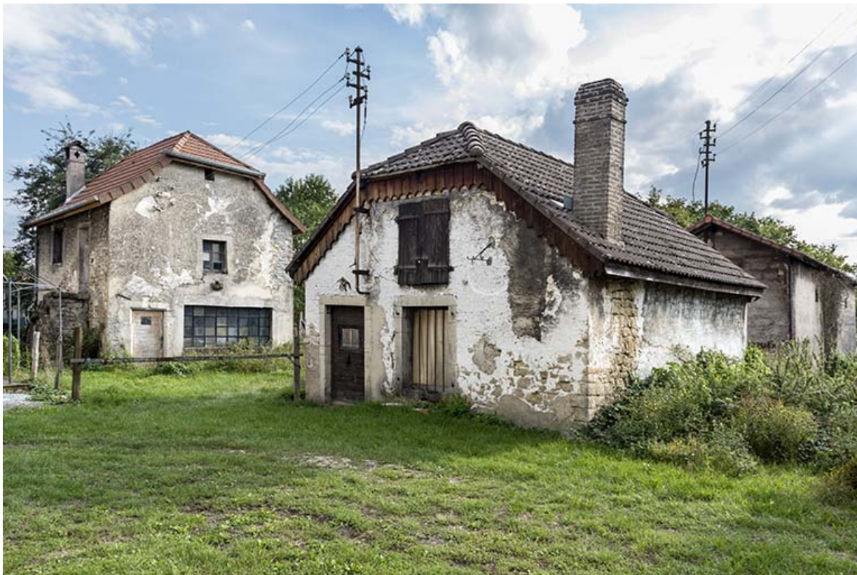
Forge, de trois quarts droite. A gauche celle dépendant du site aux 49-53 Grande Rue, à droite bâtiment du polissage.