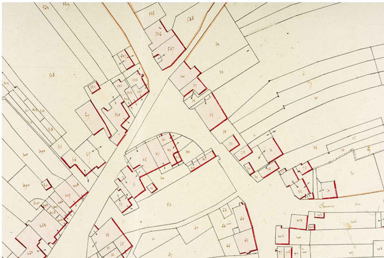
Cadastré de la commune de Montécheroux. Atlas parcellaire, 1830, section D en une feuille [détail : quartier de la rue de la Planchette], 1/1 250.