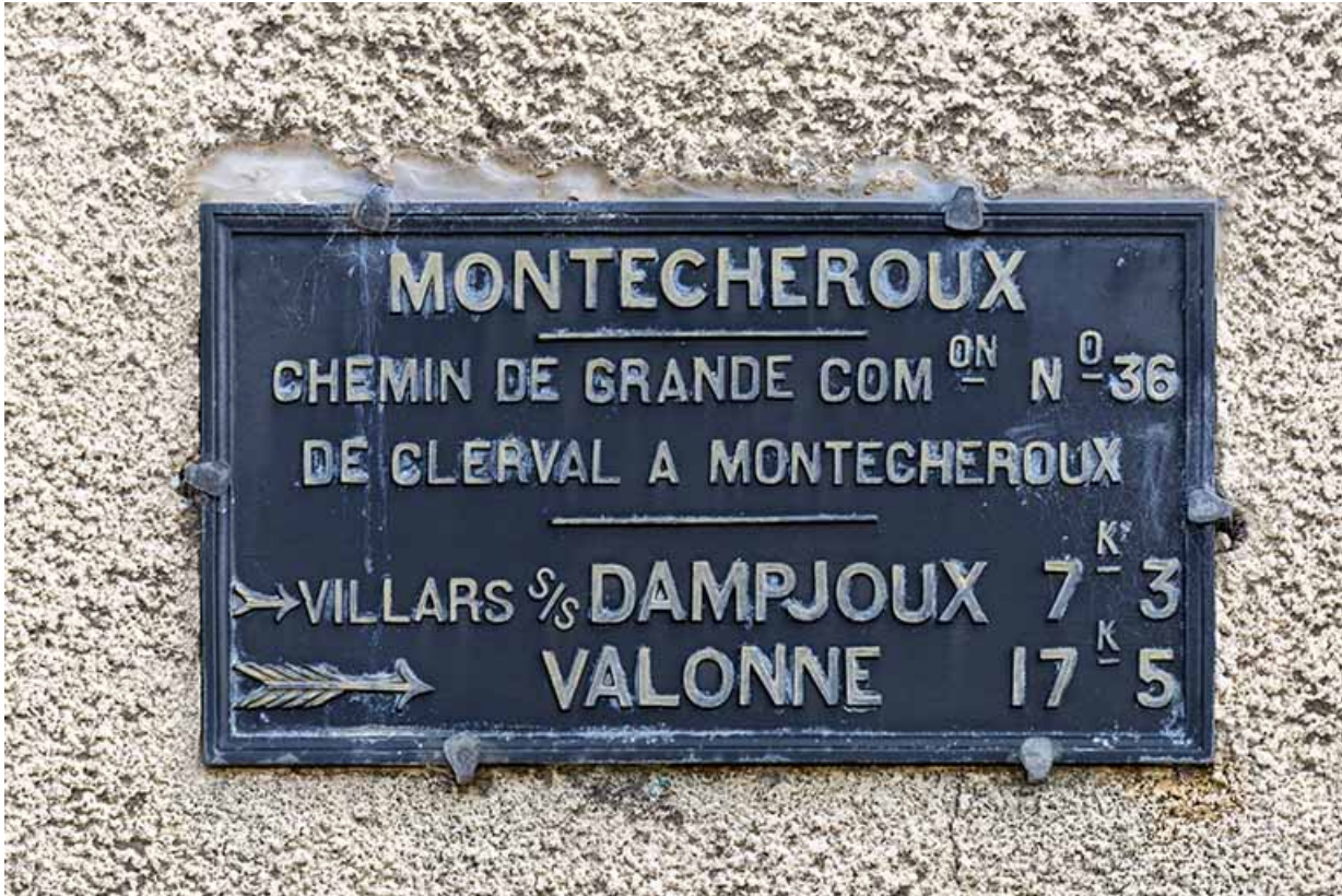
Bureau et logement : panneau indicateur sur la façade latérale droite. 25, Montécheroux, 55, 66 Grande Rue