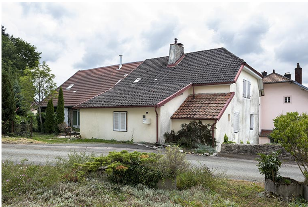
Vue d'ensemble, depuis le nord-ouest.