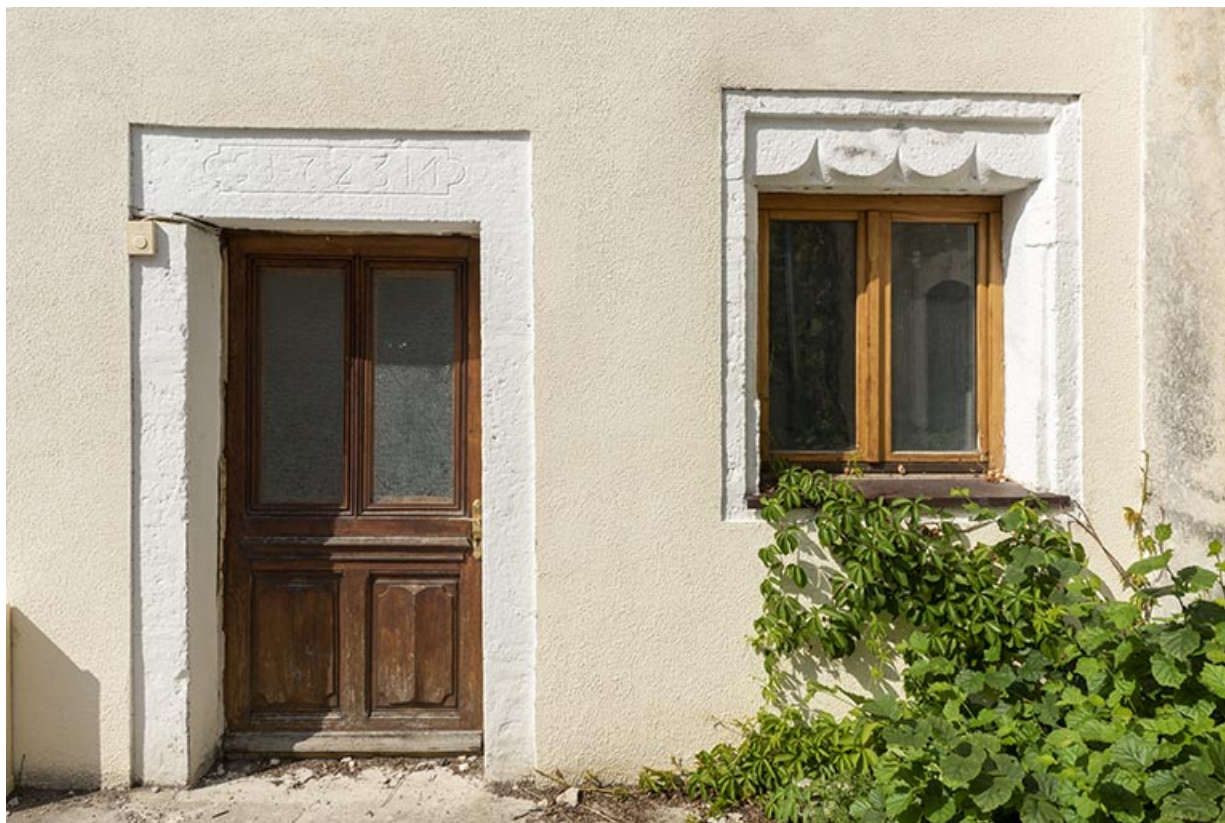
Bâtiment de 1723, façade antérieure : linteau daté et linteau à arcs en accolade. 25, Montécheroux, 4-6 rue du Chêne