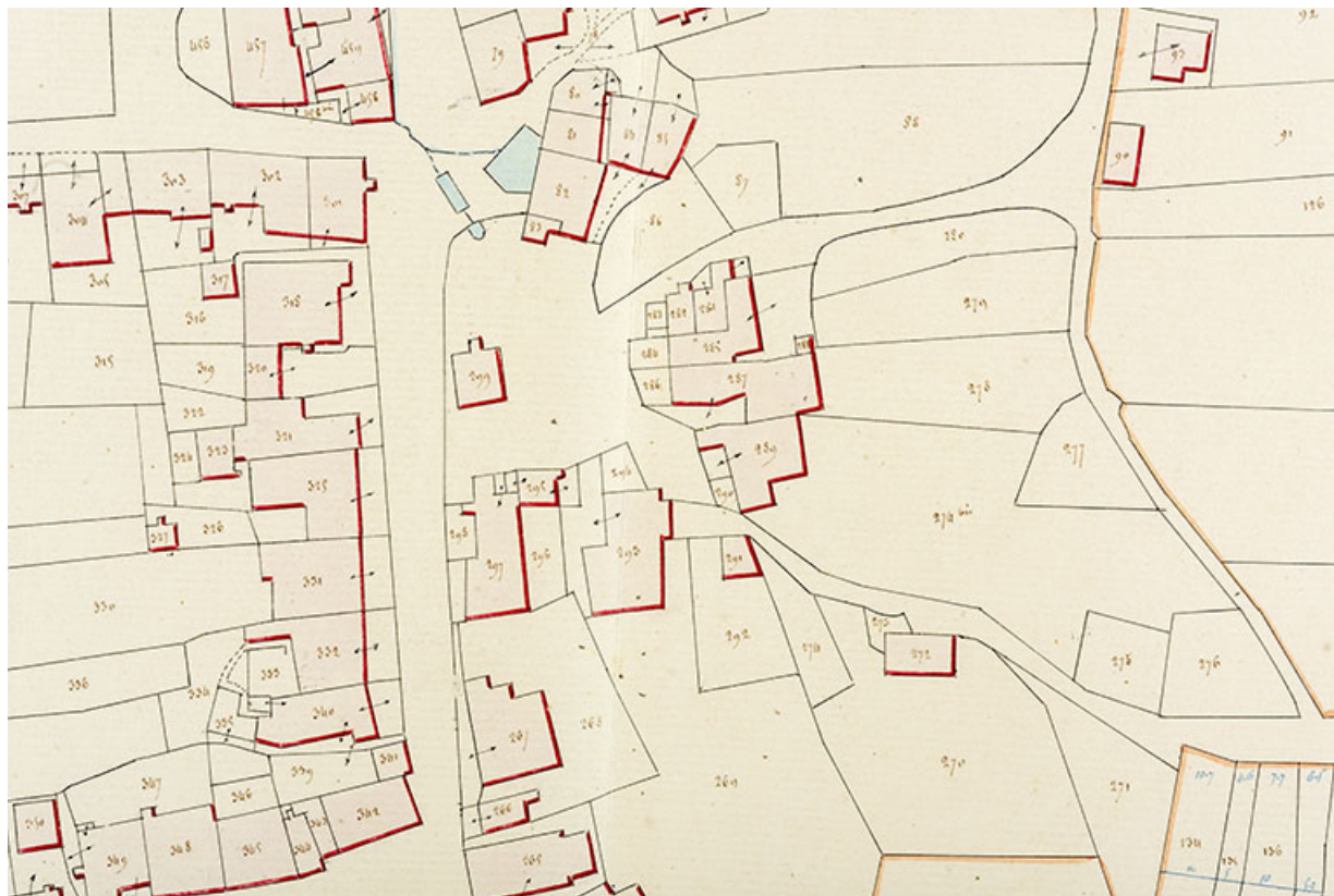
Cadastré de la commune de Montécheroux. Atlas parcellaire, 1830, section D en une feuille [détail : quartier de la mairie], 1/1 250. 25, Montécheroux