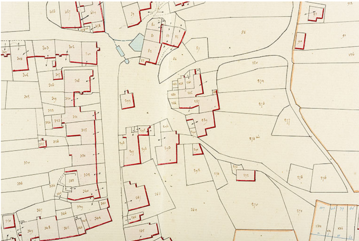
Cadastre de la commune de Montécheroux. Atlas parcellaire, 1830, section D en une feuille [détail : quartier de la mairie], 1/1 250. 25, Montécheroux