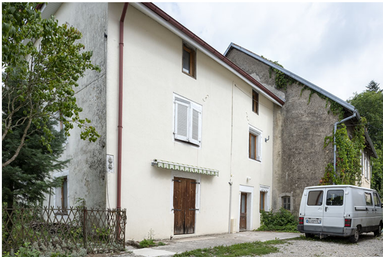
Bâtiment de 1723 : façade antérieure, de trois quarts.