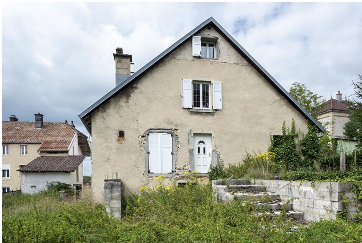
Deuxième bâtiment : façade orientale. L'atelier de fabrication est visible à gauche.