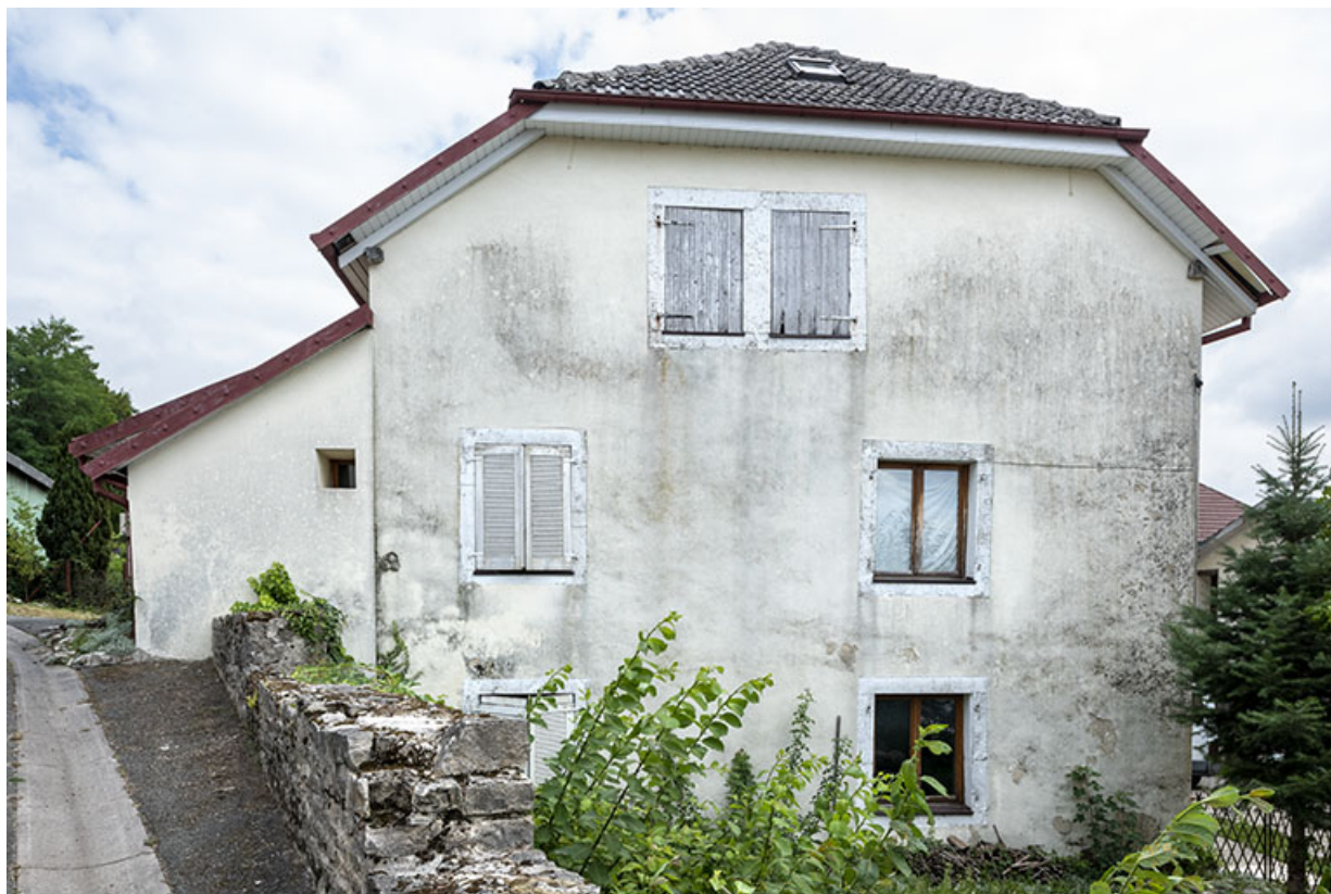
Bâtiment de 1723 : façade latérale gauche. 25, Montécheroux, 4-6 rue du Chêne