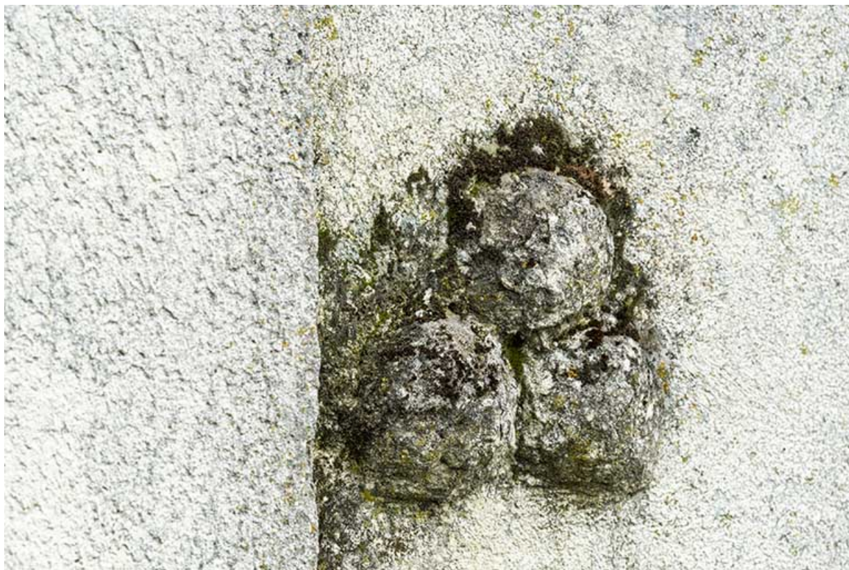
Bâtiment de 1723, façade latérale gauche : boules apotropaiques. 25, Montécheroux, 4-6 rue du Chêne