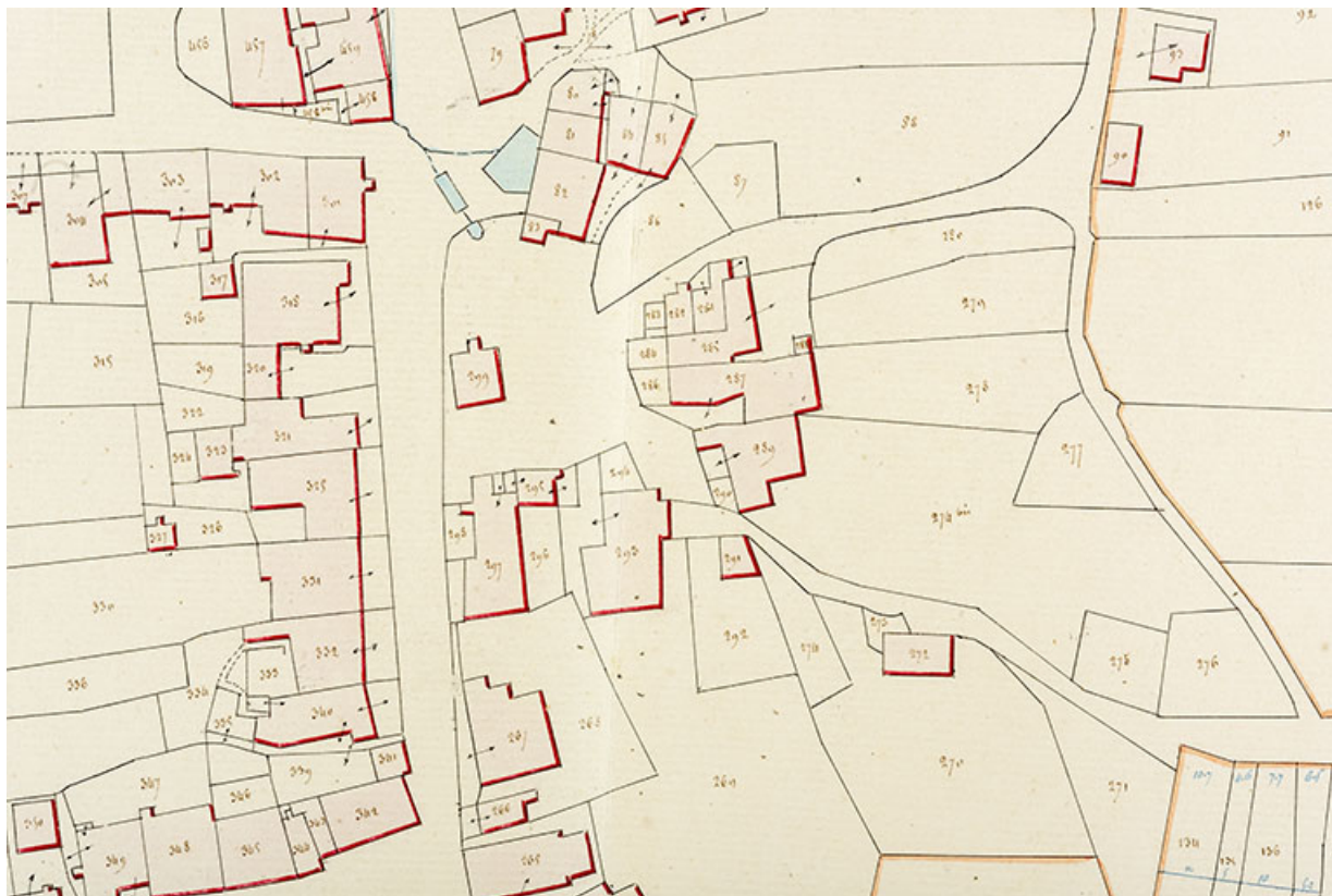
Cadastre de la commune de Montécheroux. Atlas parcellaire, 1830, section D en une feuille [détail : quartier de la mairie], 1/1 250. 25, Montécheroux

3 P 394 Cadastre de la commune de Montécheroux, 1830-1934