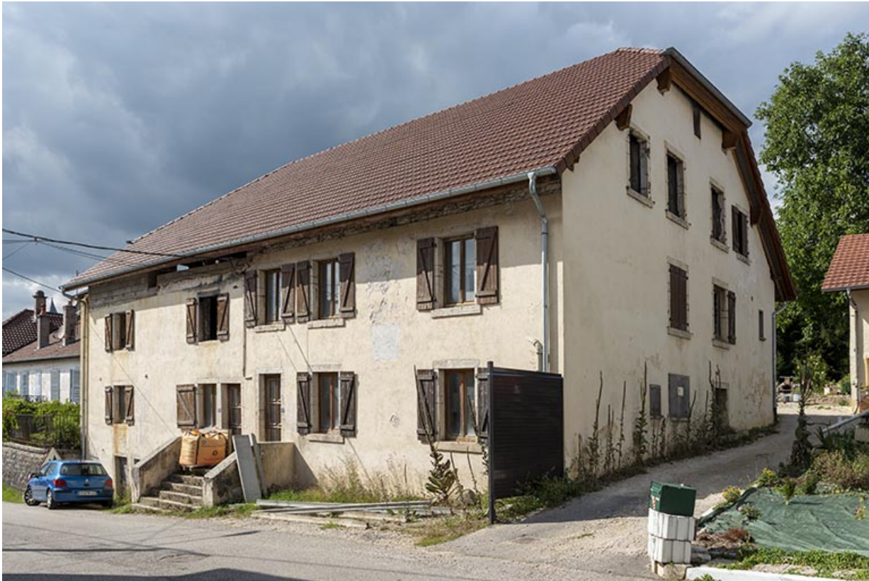
Usine d'outillage Besançon (la "Caserne"), 2-6 Grande Rue. 25, Montécheroux