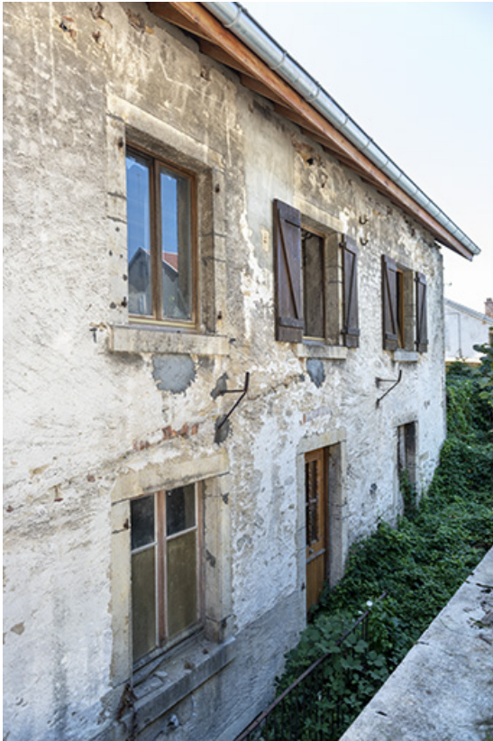
Façade postérieure de la partie gauche (n° 6), vue en enfilade. 25, Montécheroux, 2-6 Grande Rue