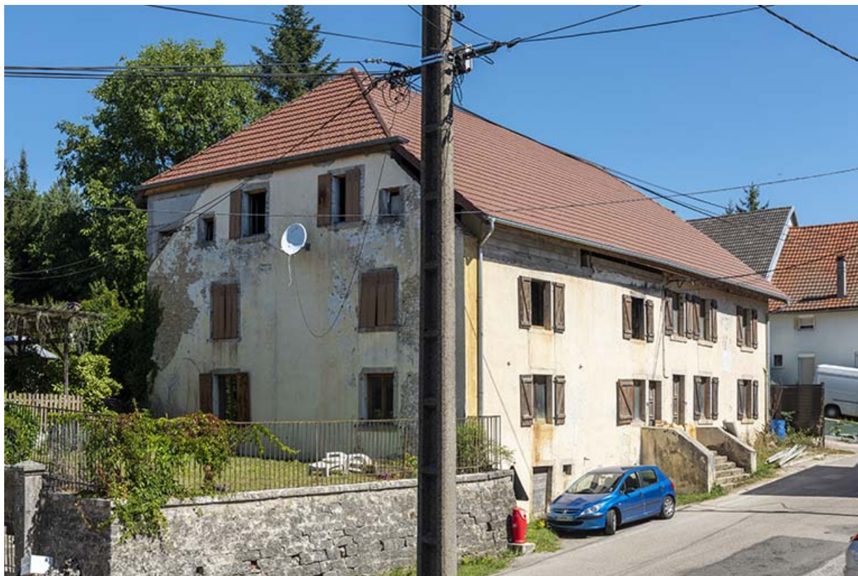
Vue d'ensemble, de trois quarts gauche. 25, Montécheroux, 2-6 Grande Rue