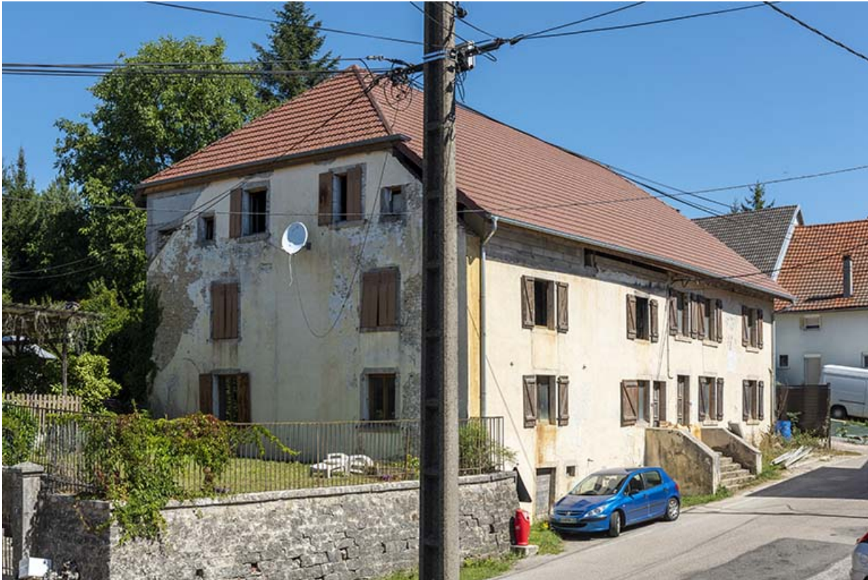
Vue d'ensemble, de trois quarts gauche.