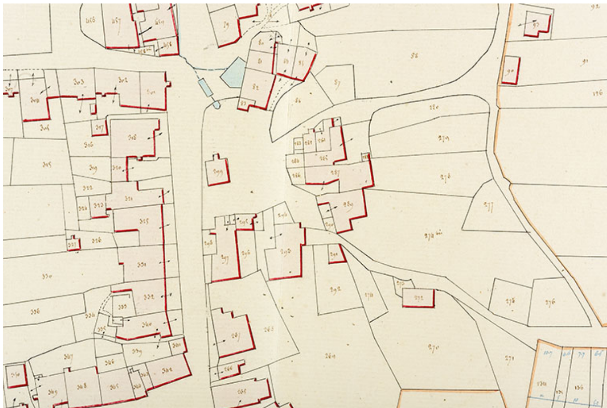
Cadastré de la commune de Montécheroux. Atlas parcellaire, 1830, section D en une feuille [détail : quartier de la mairie], 1/1 250. 25, Montécheroux