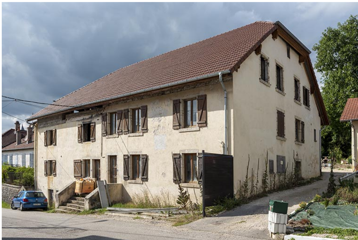
Usine d'outillage Besançon (la "Caserne"), 2-6 Grande Rue. 25, Montécheroux