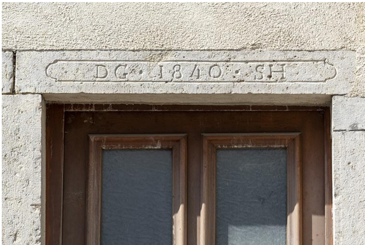
Linteau daté (au n° 6).