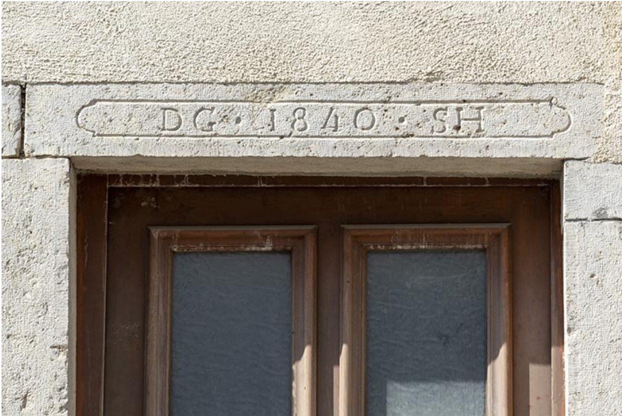
Linteau daté (au n° 6).