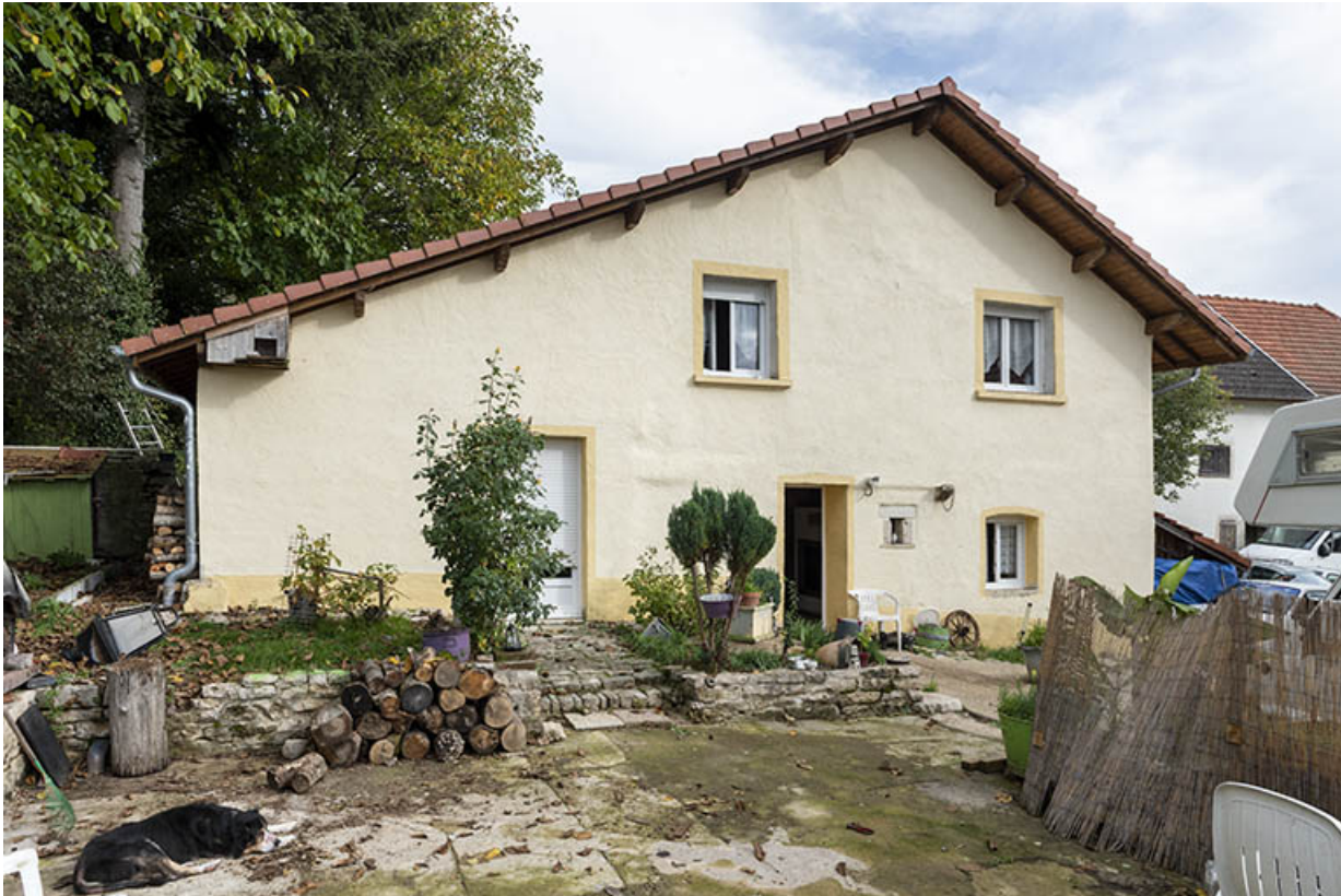
Maison en fond de cour.