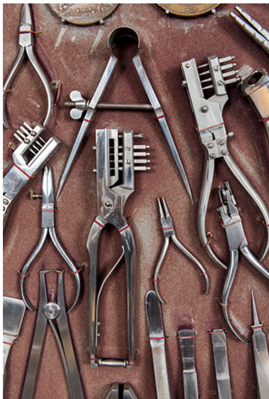
Meuble d'exposition Hugoniot-Tissot : pinces, brucelles et compas.

25, Montécheroux, 12 rue de la Pommeraie