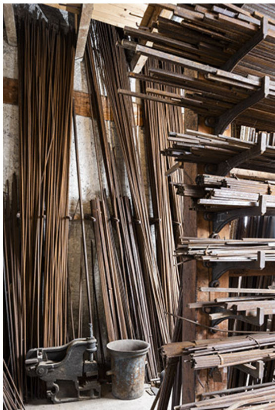
Entrepôt industriel : barres de fer en stock. 25, Montécheroux, 12 rue de la Pommeraie