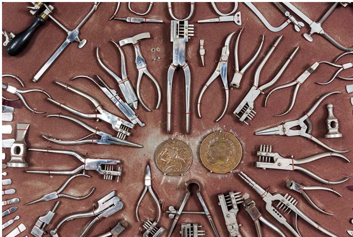
Meuble d'exposition Hugoniot-Tissot : assortiment de pinces, brucelles, etc. (vue rapprochée). 25, Montécheroux, 12 rue de la Pommeraie