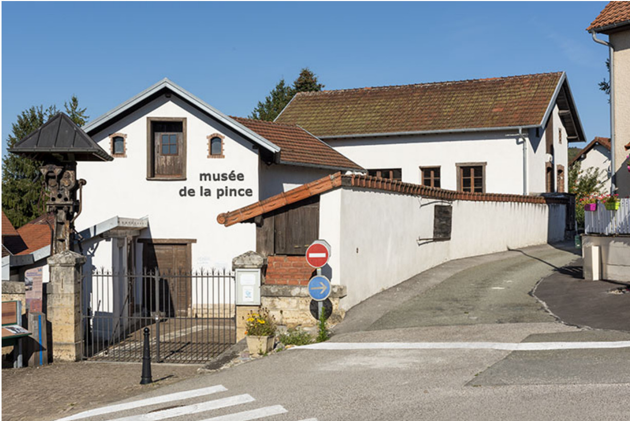
Usine d'outillage (actuel musée de la Pince), 12 rue de la Pommeraie. 25, Montécheroux