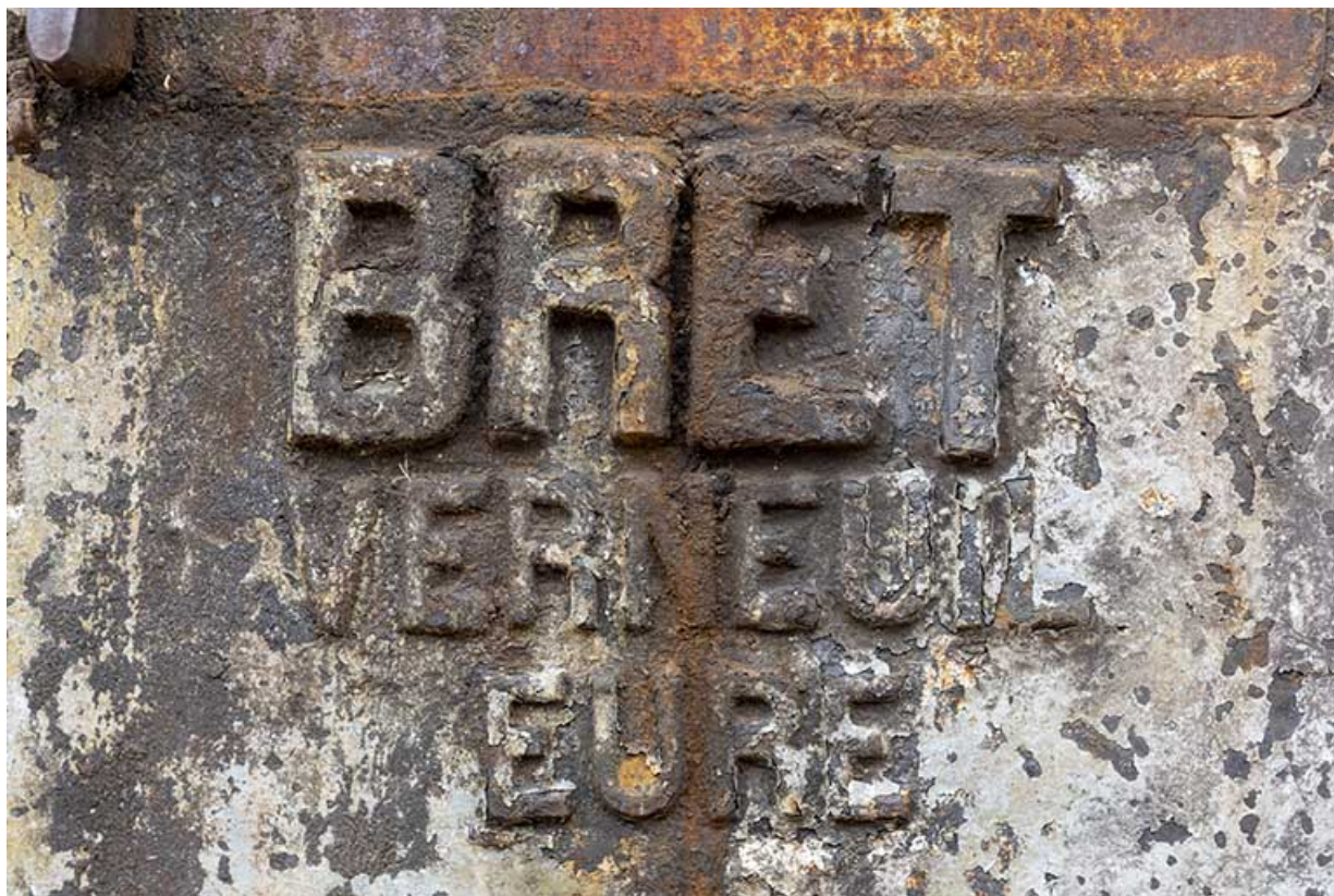
Marteau-pilon de la "Fabriquee : marque du constructeur Bret. 25, Montécheroux, 12 rue de la Pommeraie