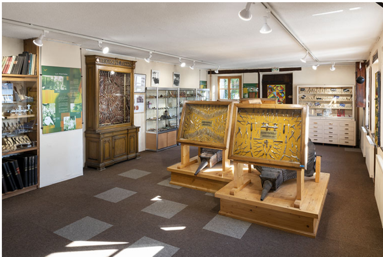
Atelier de fabrication : salle d'exposition du musée au rez-de-chaussée surélevé. 25, Montécheroux