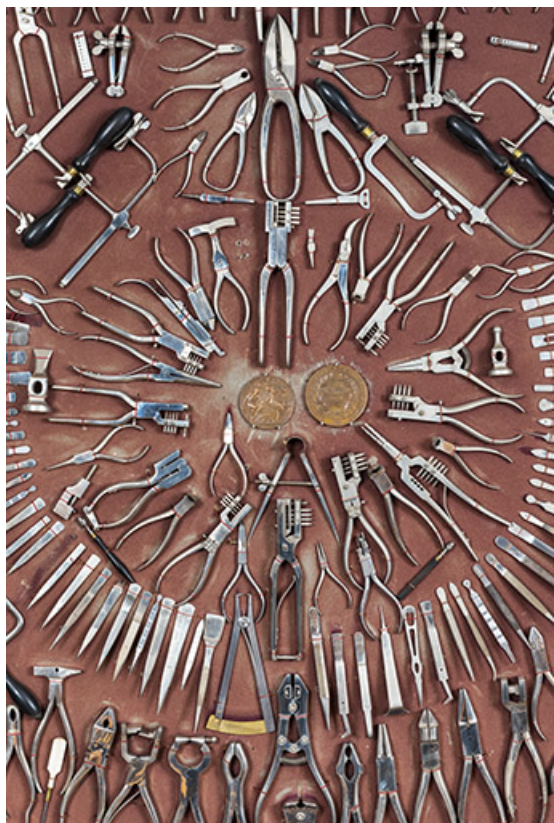
Meuble d'exposition Hugoniot-Tissot (musée de la Pince, Montécheroux) : assortiment de pinces, brucelles, etc. 25, Montécheroux