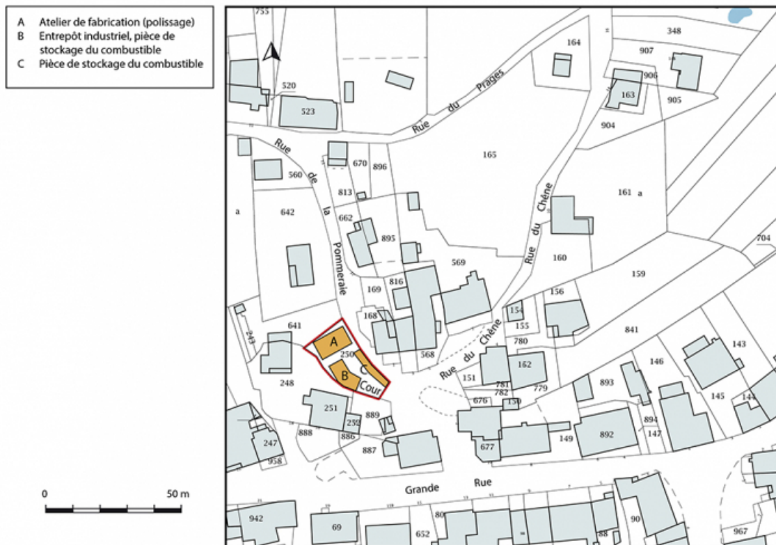
Plan-masse et de situation. Extrait du plan cadastral, 2019, section D. 25, Montécheroux, 12 rue de la Pommeraie