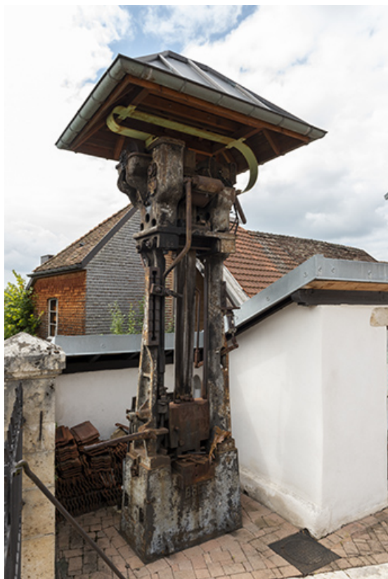
Marteau-pilon de la "Fabrique".

25, Montécheroux, 31-33 rue de Saint-Hippolyte