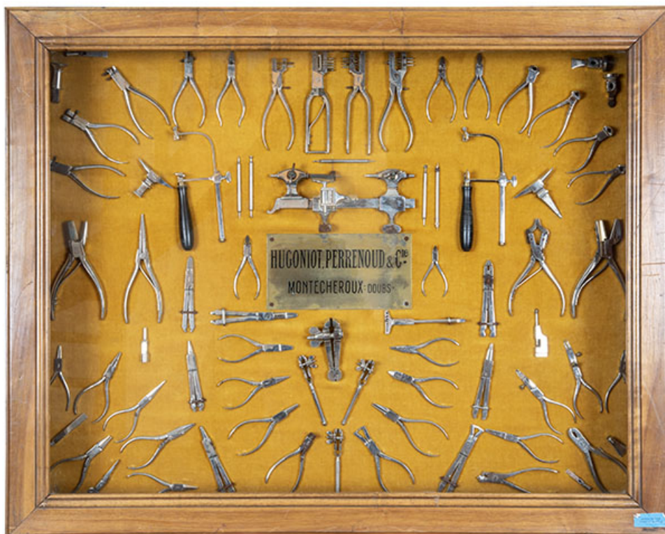
Vitrine Hugoniot-Perrenoud (musée de la Pince, Montécheroux) : assortiment de pinces et outils, dont un tour d'horloger. 25, Montécheroux