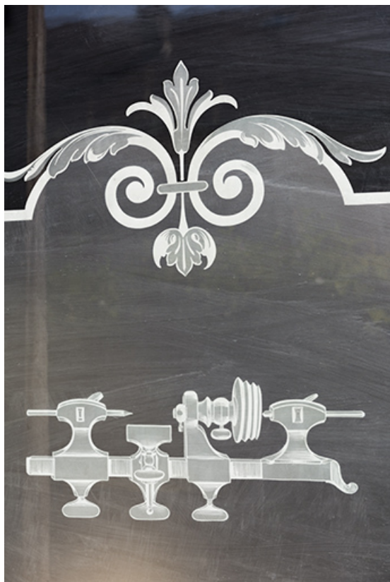
Bâtiment au 8 Grande Rue : tour d'horloger gravé sur verre.