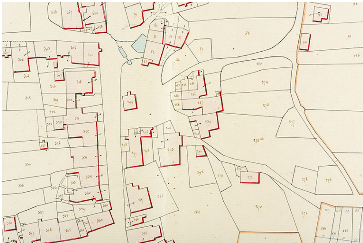
Cadastré de la commune de Montécheroux. Atlas parcellaire, 1830, section D en une feuille [détail : quartier de la mairie], 1/1 250. 25, Montécheroux