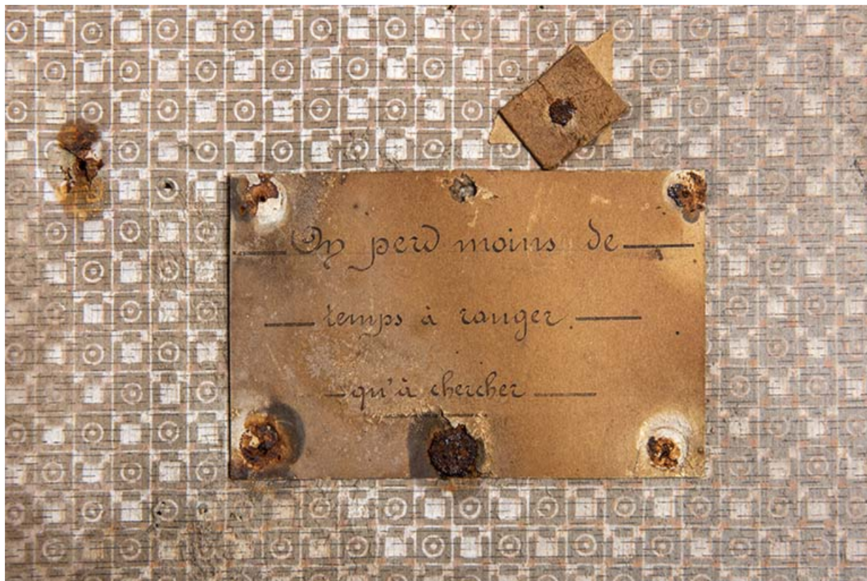
Bâtiment au 2 rue du Chêne, étage de soubassement (magasin industriel) : affichette. 25, Montécheroux, 8-10 Grande Rue