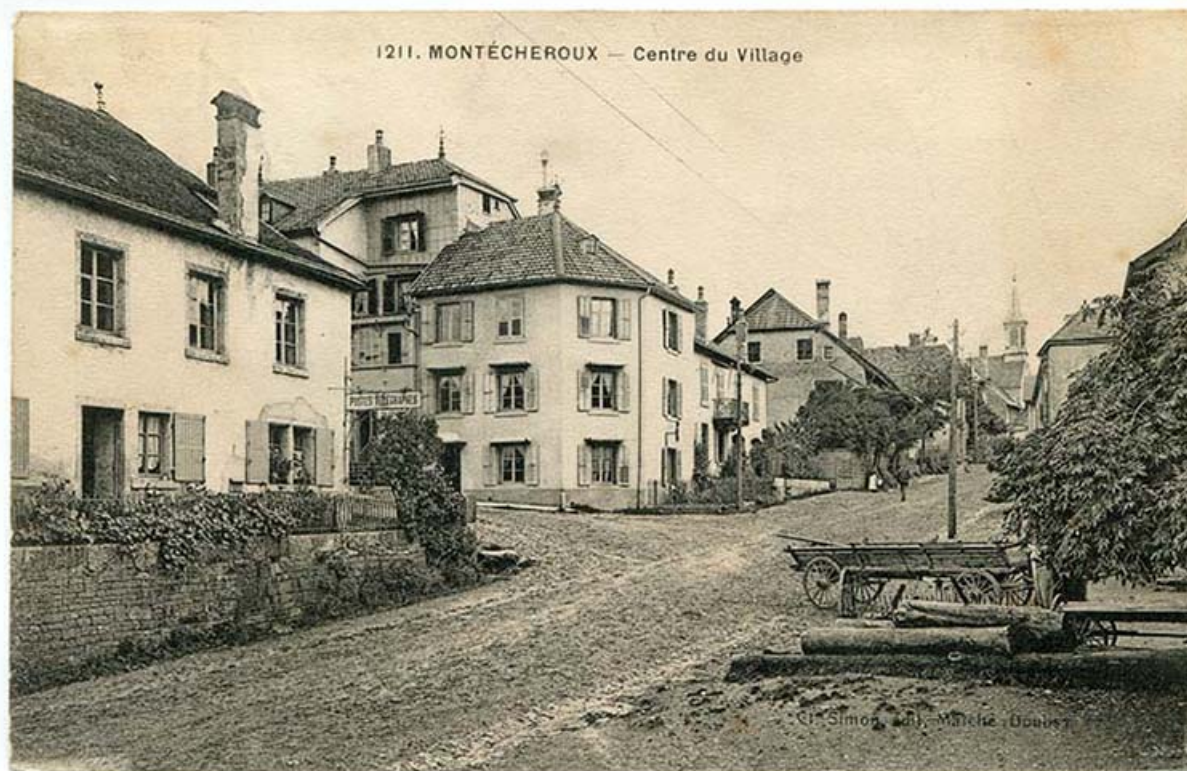
1211. Montécheroux - Centre du village, 1er quart 20e siècle [avant 1921].