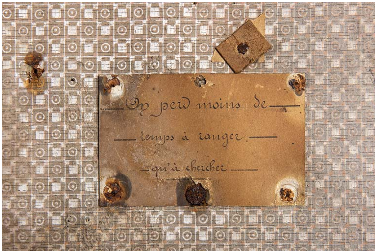
Bâtiment au 2 rue du Chêne, étage de soubassement (magasin industriel) : affichette. 25, Montécheroux, 8-10 Grande Rue