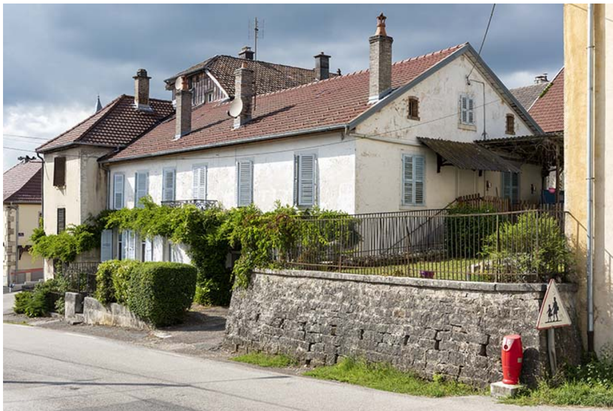
Bâtiment au 8 Grande Rue, de trois quarts droite. 25, Montécheroux, 8-10 Grande Rue