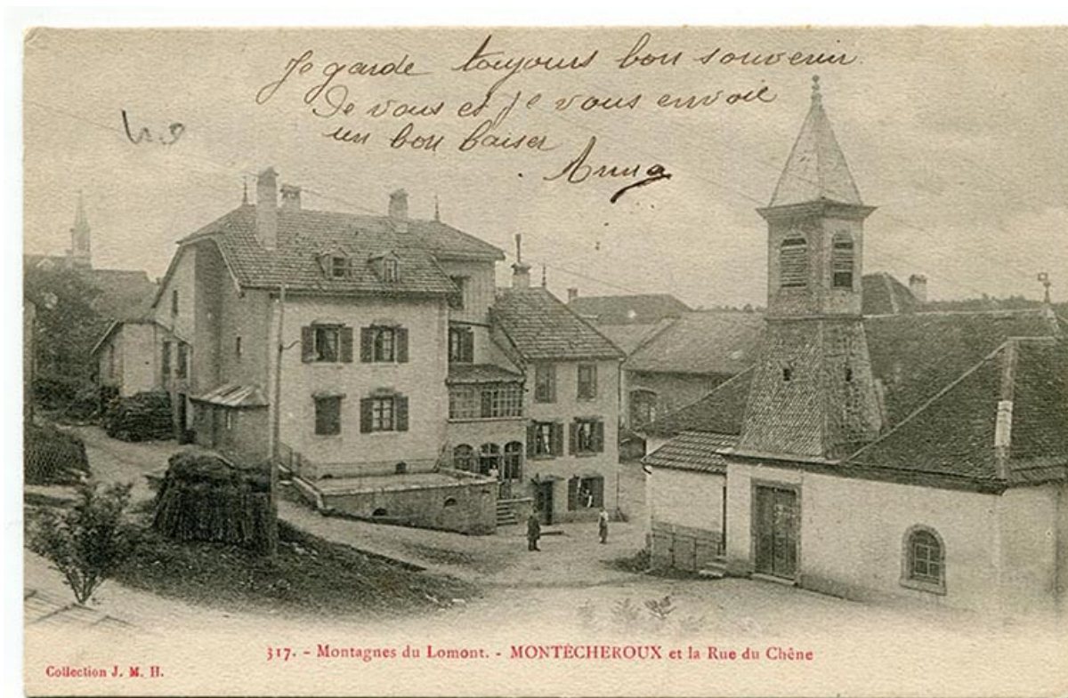
317. - Montagnes du Lomont. - Montécheroux et la rue du Chêne, limite 19e siècle 20e siècle. 25, Montécheroux, 8-10 Grande Rue