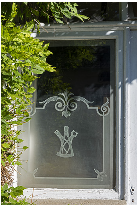
Bâtiment au 8 Grande Rue : fenêtre ornée d'un dessin de pinces gravé sur le verre. 25, Montécheroux