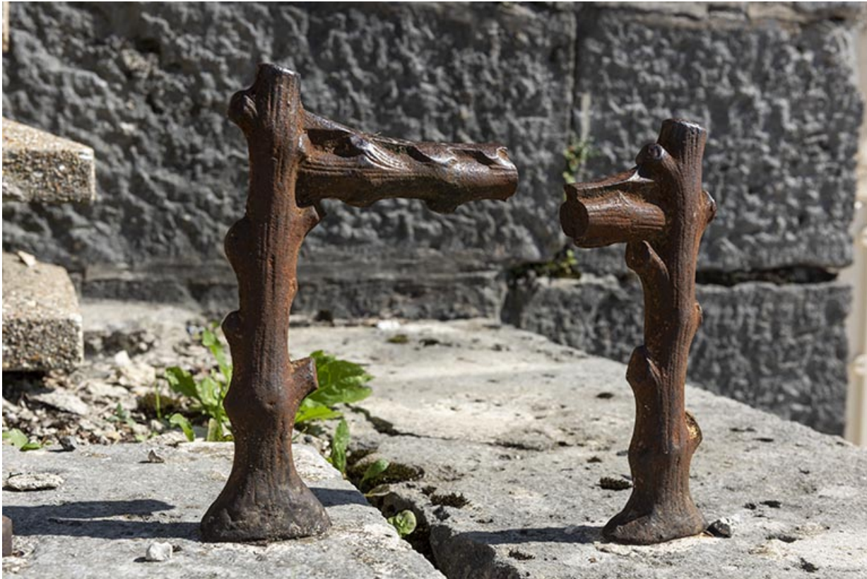
Magasin industriel rue du Chêne : décrottoir. 25, Montécheroux, 8-10 Grande Rue