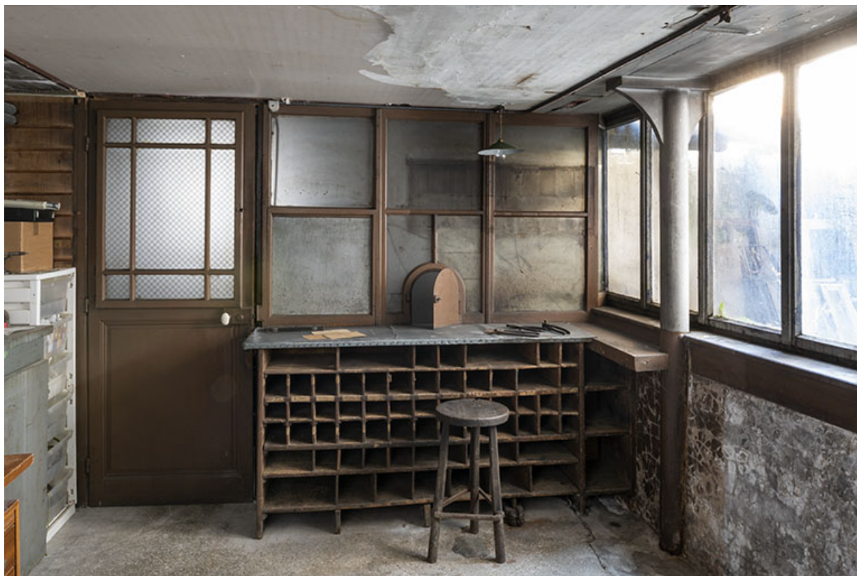
Bâtiment au 2 rue du Chêne, étage de soubassement (magasin industriel) : guichet pour la paie des artisans. 25, Montécheroux