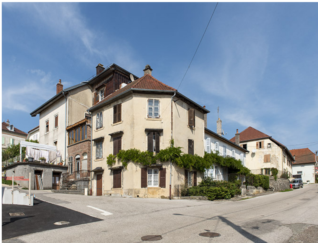
Vue d'ensemble à l'angle de la Grande Rue et de la rue du Chêne. 25, Montécheroux