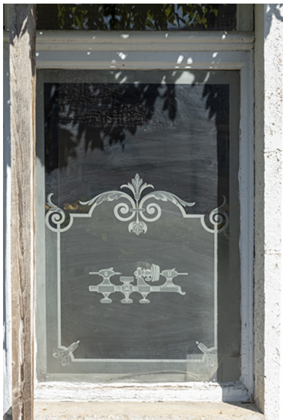
Bâtiment au 8 Grande Rue : fenêtre ornée d'un dessin de tour d'horloger gravé sur le verre. 25, Montécheroux