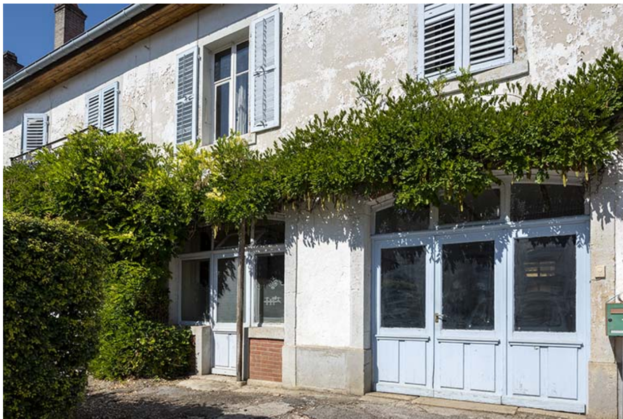
Bâtiment au 8 Grande Rue : portes du magasin. 25, Montécheroux, 8-10 Grande Rue