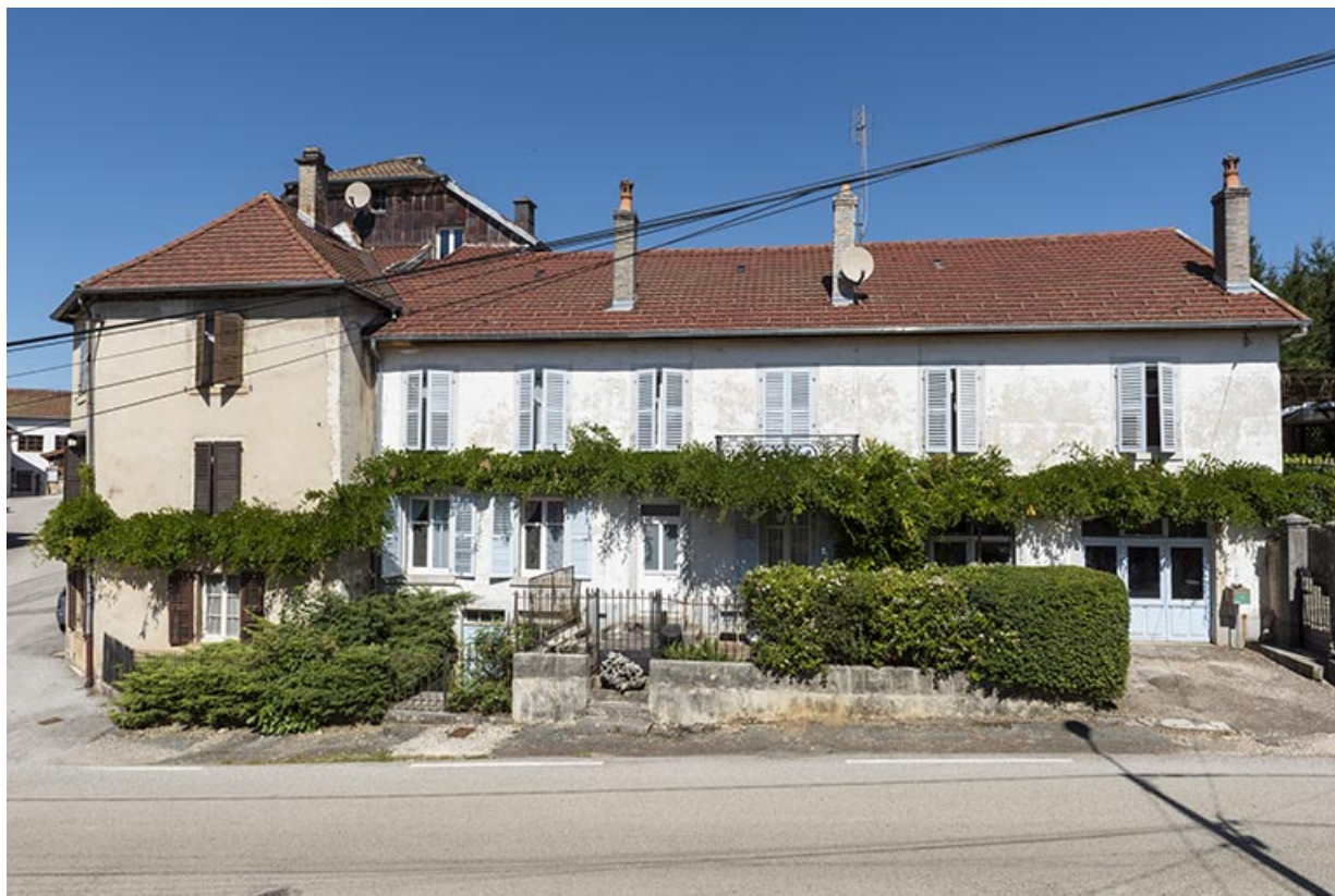
Comptoir d'outillage Hugoniot-Tissot, 8-10 Grande Rue. 25, Montécheroux