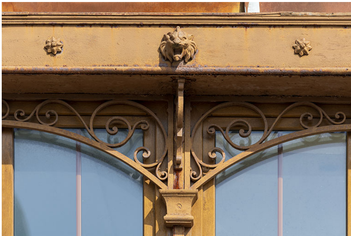
Magasin industriel rue du Chêne : détail de ferronnerie.