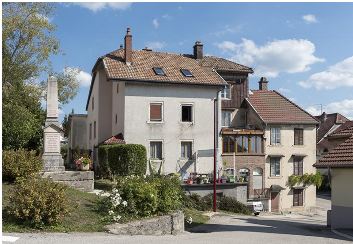
Comptoir d'outillage Hugoniot-Tissot, 2 rue du Chêne. 25, Montécheroux