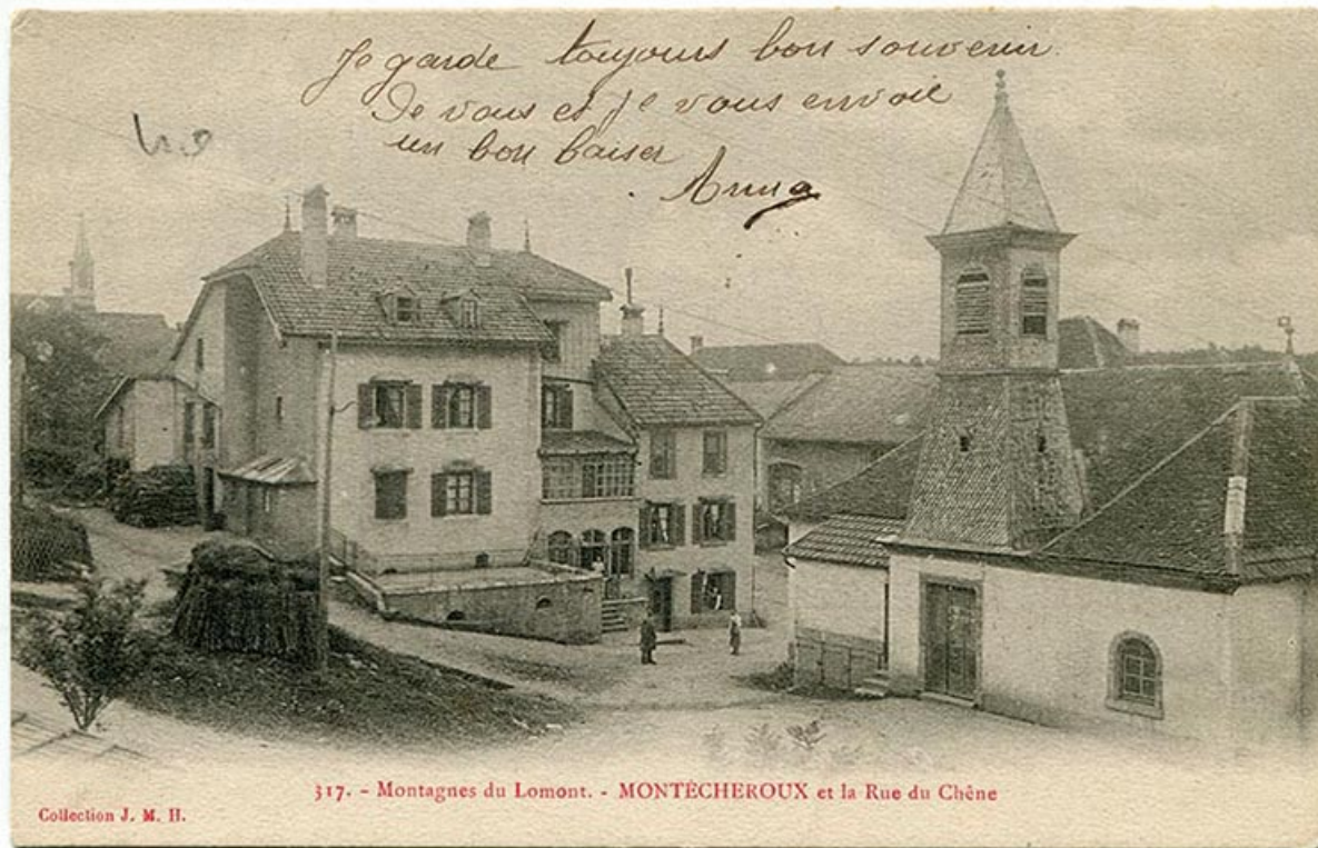
317. - Montagnes du Lomont. - Montécheroux et la rue du Chêne, limite 19e siècle 20e siècle. 25, Montécheroux, 8-10 Grande Rue