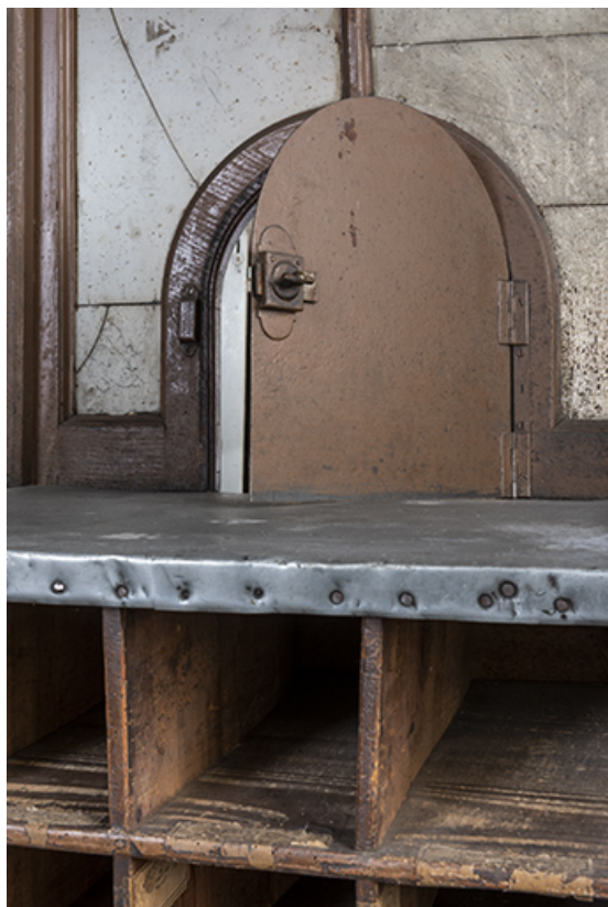
Bâtiment au 2 rue du Chêne, étage de soubassement (magasin industriel) : guichet pour la paie des artisans (détail). 25, Montécheroux, 8-10 Grande Rue