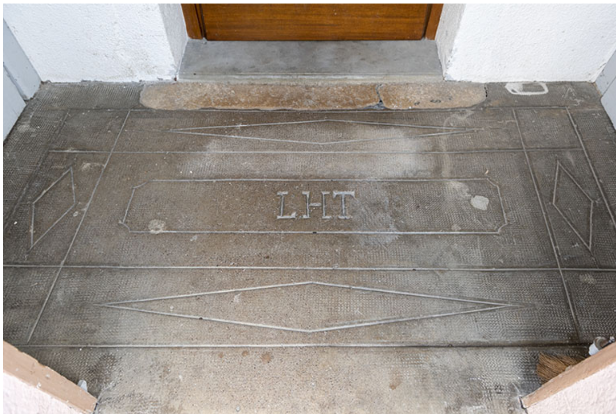
Bâtiment au 2 rue du Chêne : initiales de Lucien Hugoniot-Tissot sur le sol de l'entrée. 25, Montécheroux, 8-10 Grande Rue