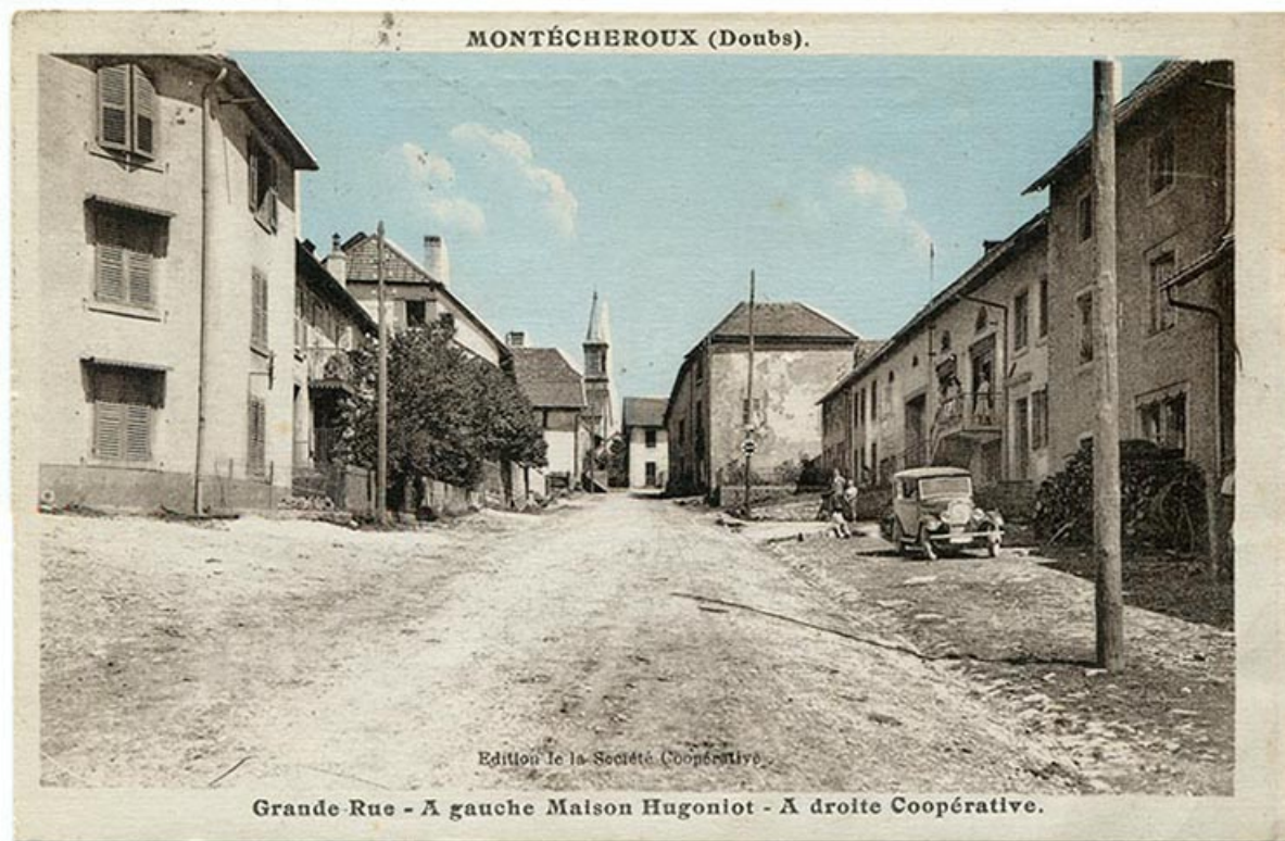
Montécheroux (Doubs). Grande Rue - A gauche Maison Hugoniot - A droite Coopérative, 2e quart 20e siècle [avant 1935]. 25, Montécheroux, 8-10 Grande Rue