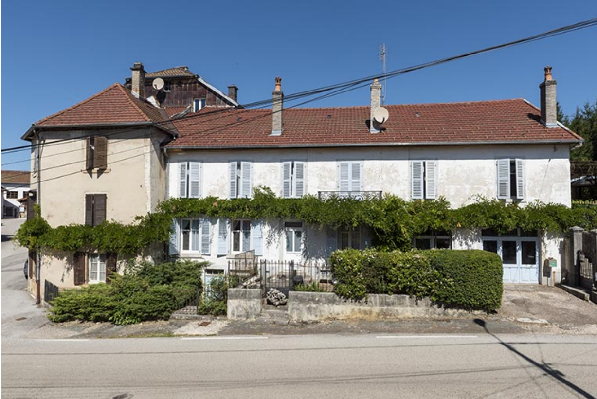
Comptoir d'outillage Hugoniot-Tissot, 8-10 Grande Rue. 25, Montécheroux