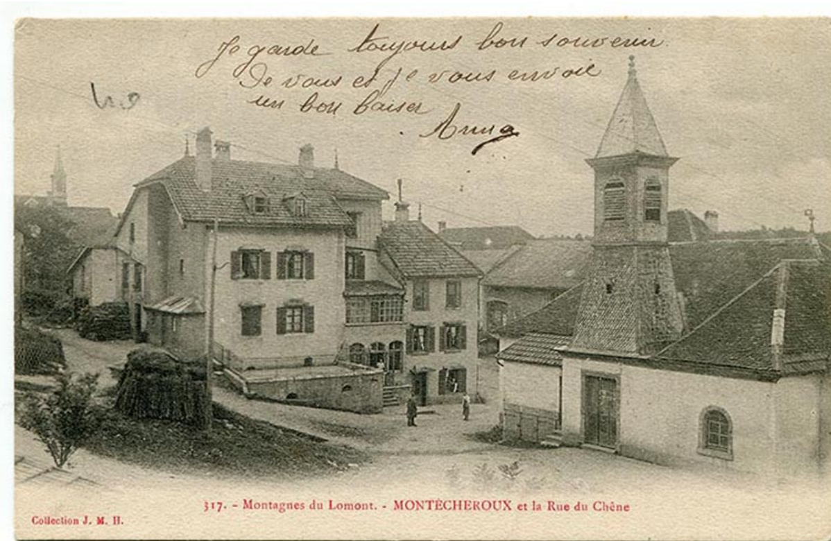
317. - Montagnes du Lomont. - Montécheroux et la rue du Chêne, limite 19e siècle 20e siècle. 25, Montécheroux, 8-10 Grande Rue