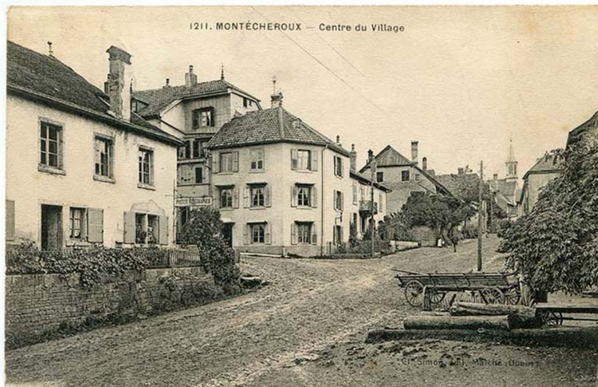
1211. Montécheroux - Centre du village, 1er quart 20e siècle [avant 1921].