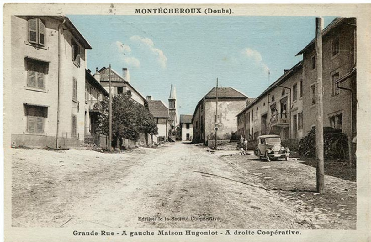
Montécheroux (Doubs). Grande Rue - A gauche Maison Hugoniot - A droite Coopérative, 2e quart 20e siècle [avant 1935]. 25, Montécheroux, 8-10 Grande Rue