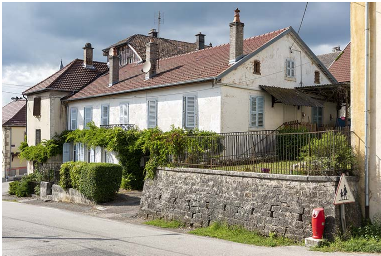
Bâtiment au 8 Grande Rue, de trois quarts droite. 25, Montécheroux, 8-10 Grande Rue