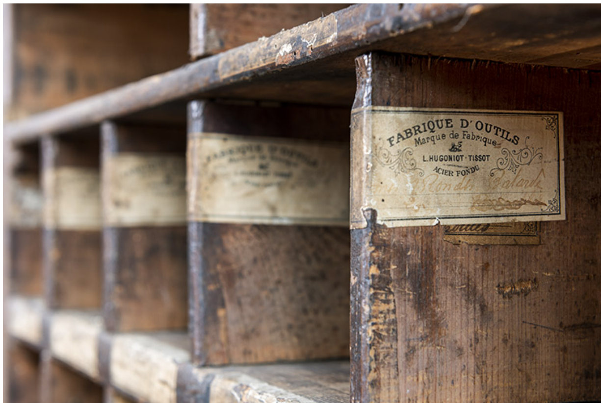
Bâtiment au 2 rue du Chêne, étage de soubassement (magasin industriel) : étiquettes sur les parois du meuble servant au stockage des outils.