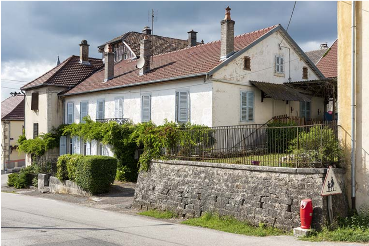
Bâtiment au 8 Grande Rue, de trois quarts droite. 25, Montécheroux, 8-10 Grande Rue