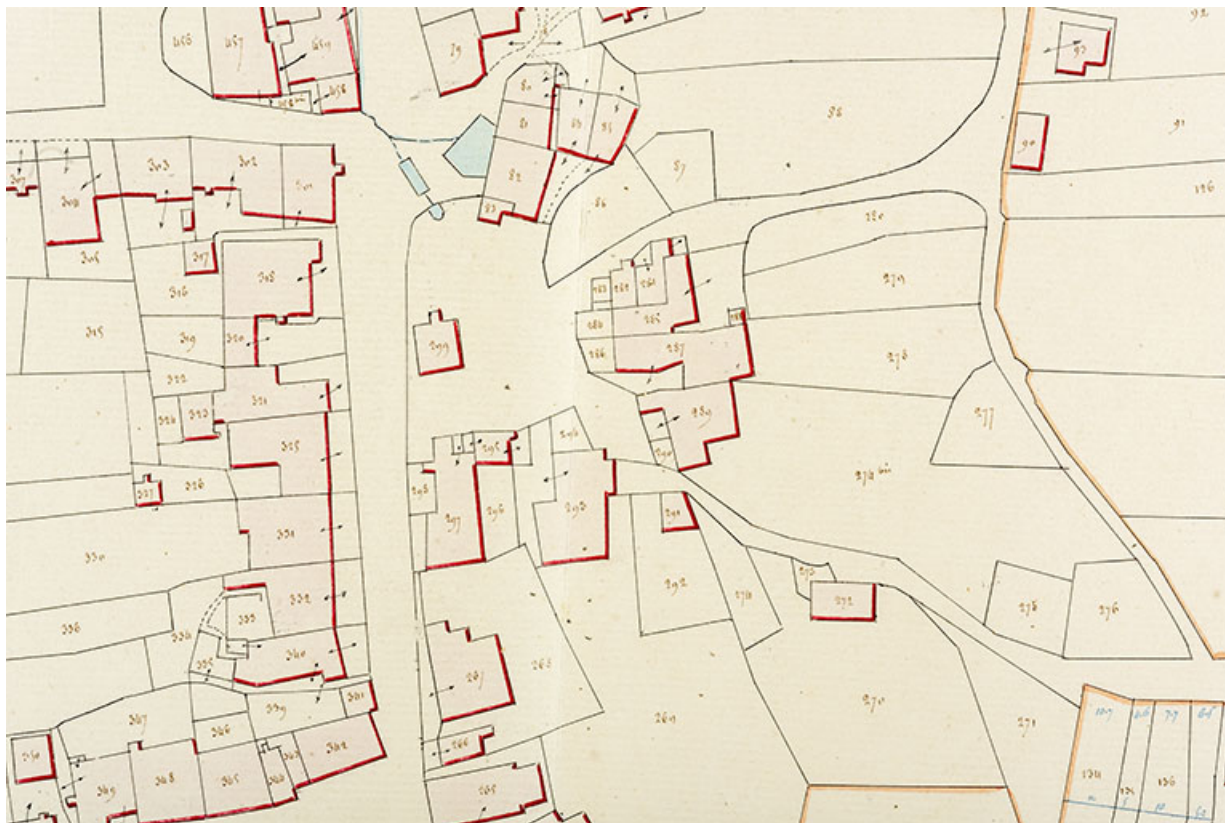
Cadastre de la commune de Montécheroux. Atlas parcellaire, 1830, section D en une feuille [détail : quartier de la mairie], 1/1 250. 25, Montécheroux