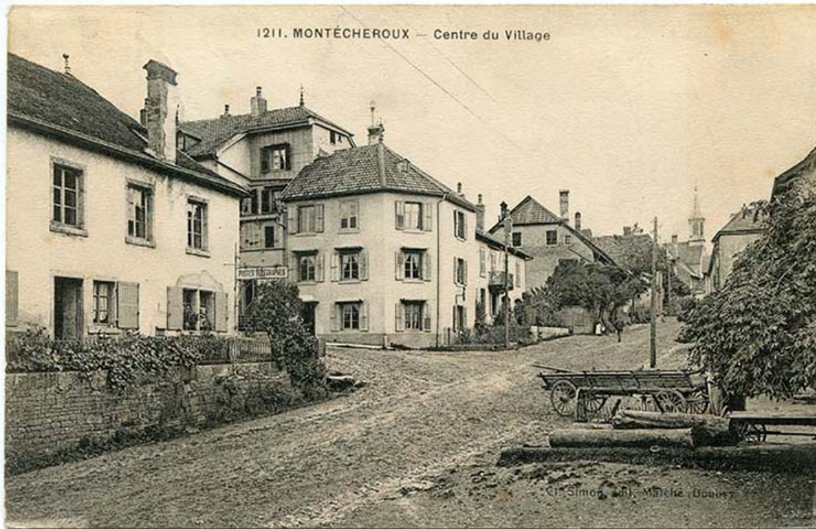
1211. Montécheroux - Centre du village, 1er quart 20e siècle [avant 1921].