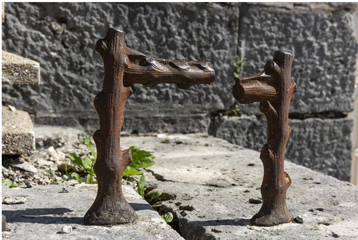
Magasin industriel rue du Chêne : décrottoir. 25, Montécheroux, 8-10 Grande Rue