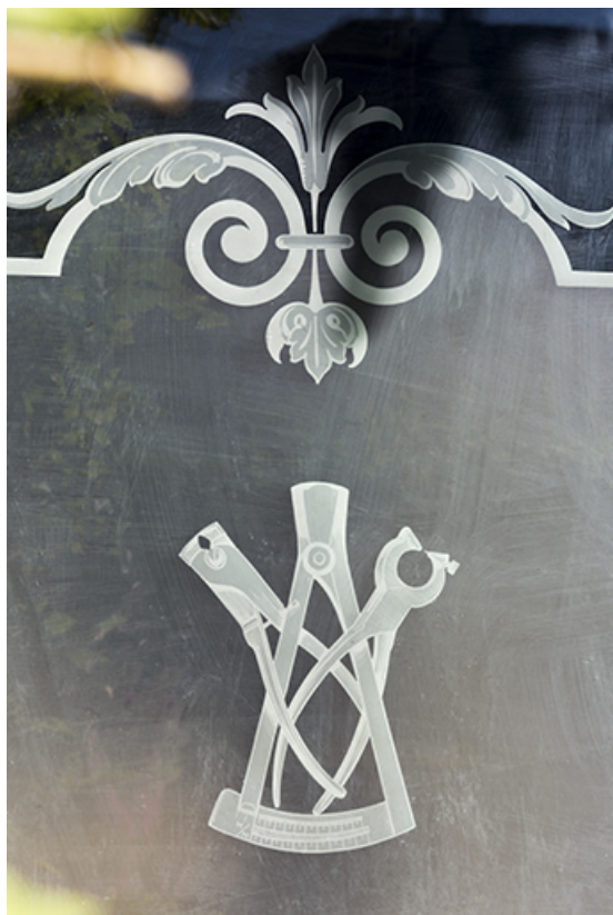
Bâtiment au 8 Grande Rue : pinces gravées sur verre. 25, Montécheroux, 8-10 Grande Rue