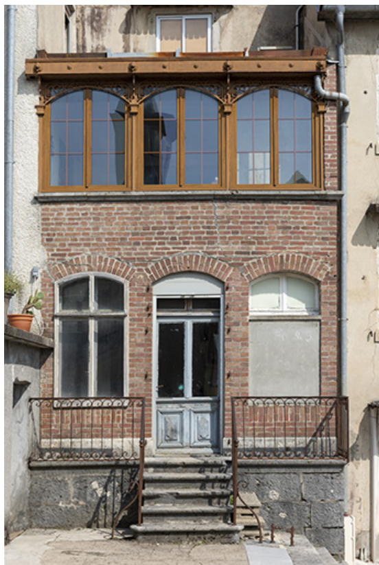
Magasin industriel rue du Chêne, de face. 25, Montécheroux, 8-10 Grande Rue