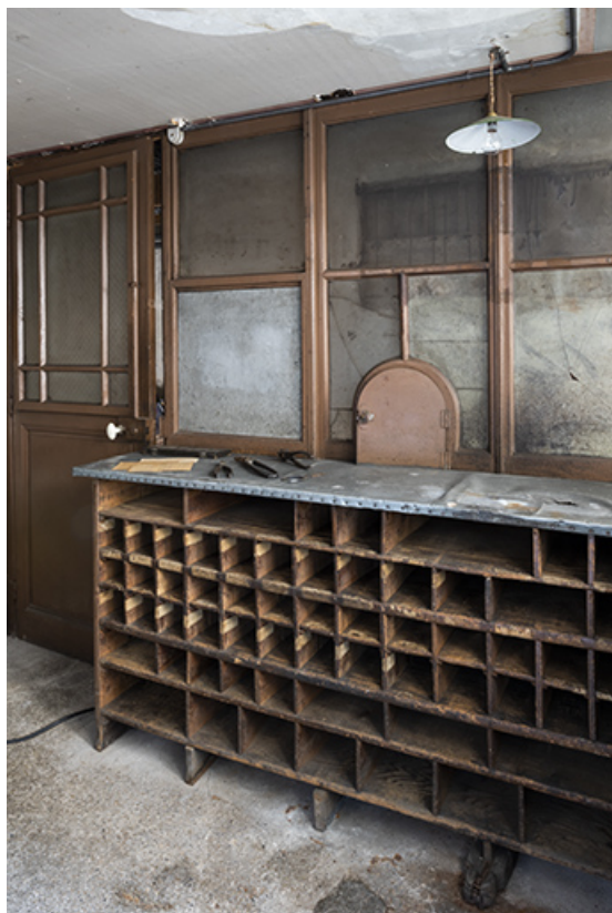
Bâtiment au 2 rue du Chêne, étage de soubassement (magasin industriel) : guichet pour la paie des artisans, de trois quarts. 25, Montécheroux, 8-10 Grande Rue