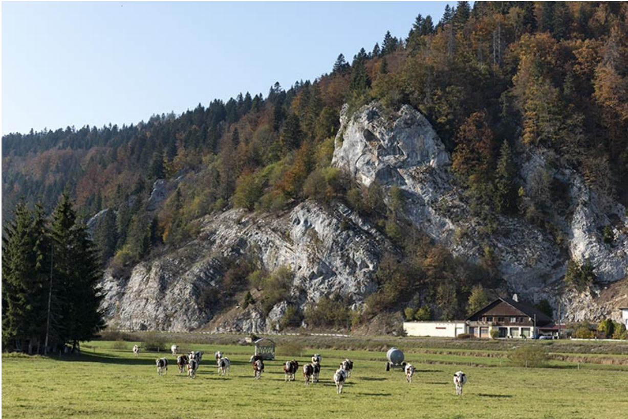
Vue d'ensemble éloignée, depuis le sud-est.

25, Grand'Combe-Châteleu R.N. 437, lieudit : Côte Brune