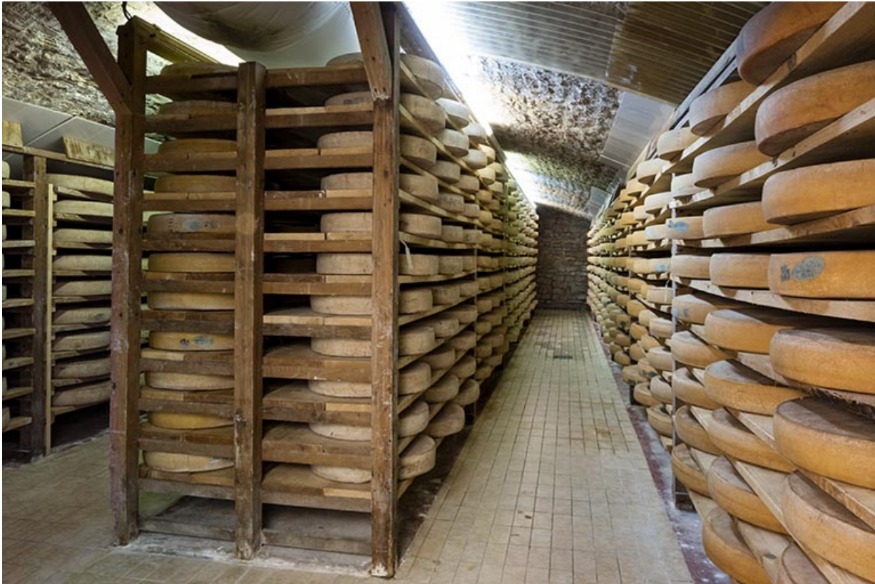
Cave d'affinage au nord.

25, Grand'Combe-Châteleu R.N. 437, lieudit : Côte Brune