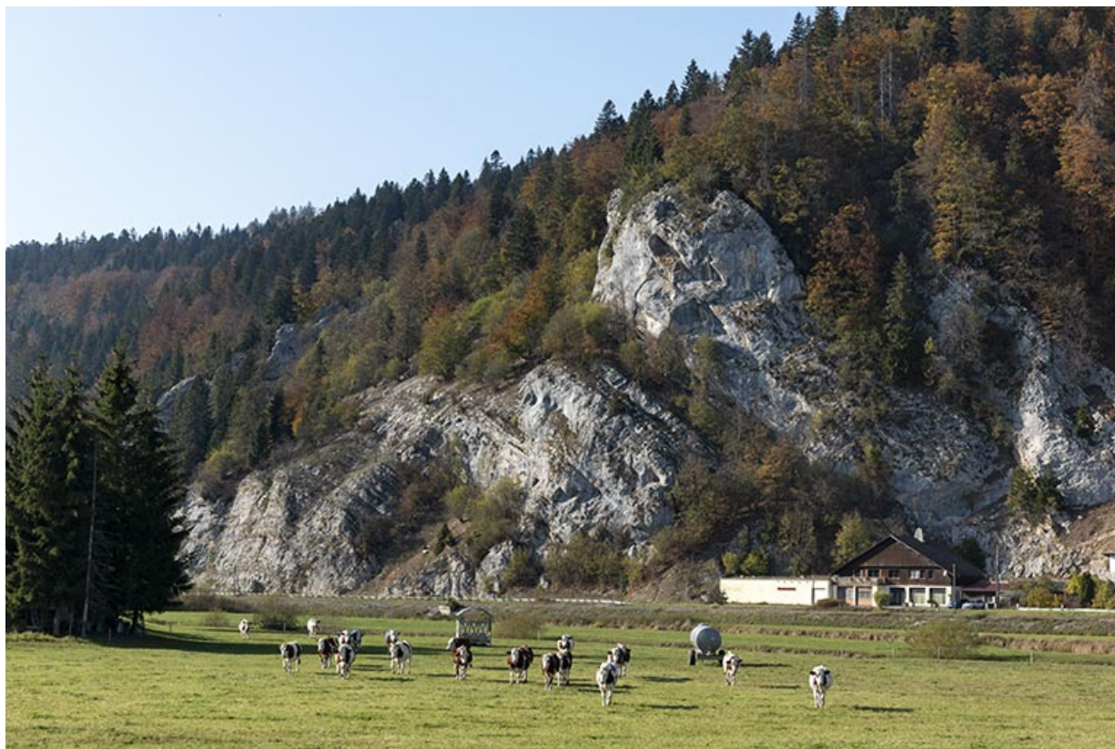
Vue d'ensemble éloignée, depuis le sud-est.

25, Grand'Combe-Châteleu R.N. 437, lieudit : Côte Brune