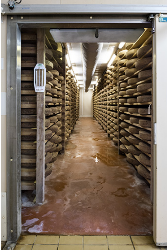
Cave d'affinage à l'ouest.

25, Grand'Combe-Châteleu R.N. 437, lieudit : Côte Brune