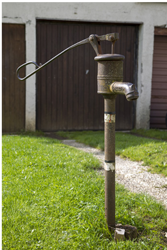
Pompe à eau Renaud, aux Fontenelles.