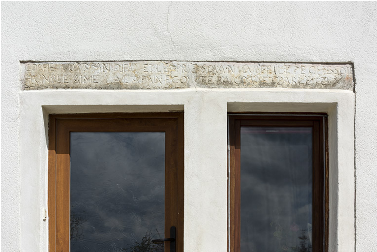
Linteau avec sentence gravée.

25, Les Fontenelles, 59 rue Principale, lieudit : chez Pagnot des Prés