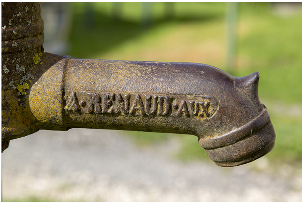
Pompe à eau : inscription donnant le nom du fabricant.