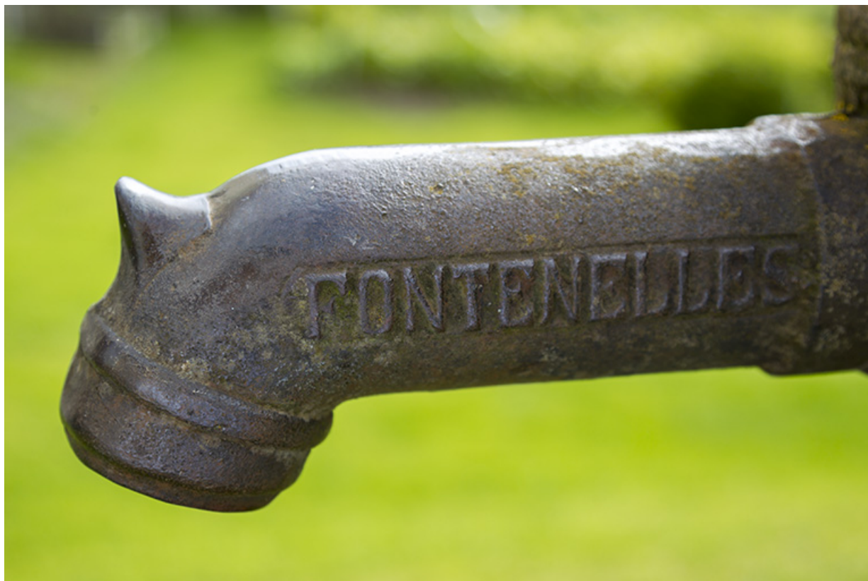
Pompe à eau : inscription donnant le lieu de fabrication.