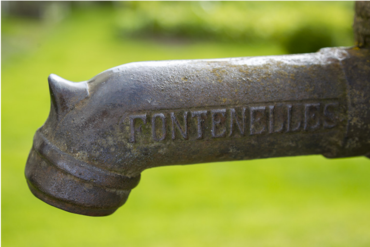
Pompe à eau : inscription donnant le lieu de fabrication.