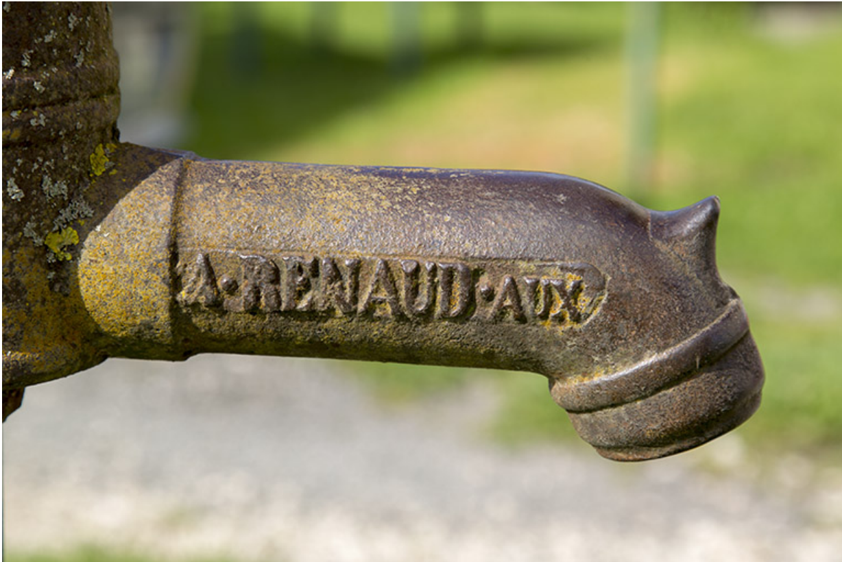
Pompe à eau : inscription donnant le nom du fabricant.