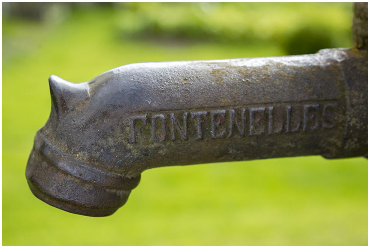
Pompe à eau : inscription donnant le lieu de fabrication.