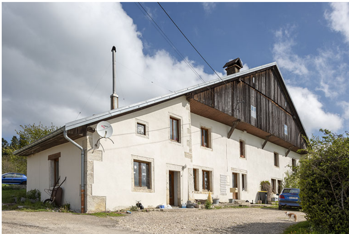
Façade antérieure, de trois quarts gauche. La forge occupait l'extension à gauche.

25, Les Fontenelles, 59 rue Principale, lieudit : chez Pagnot des Prés