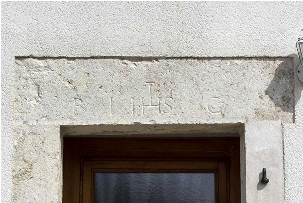
Linteau avec initiales et IHS.

25, Les Fontenelles, 59 rue Principale, lieudit : chez Pagnot des Prés