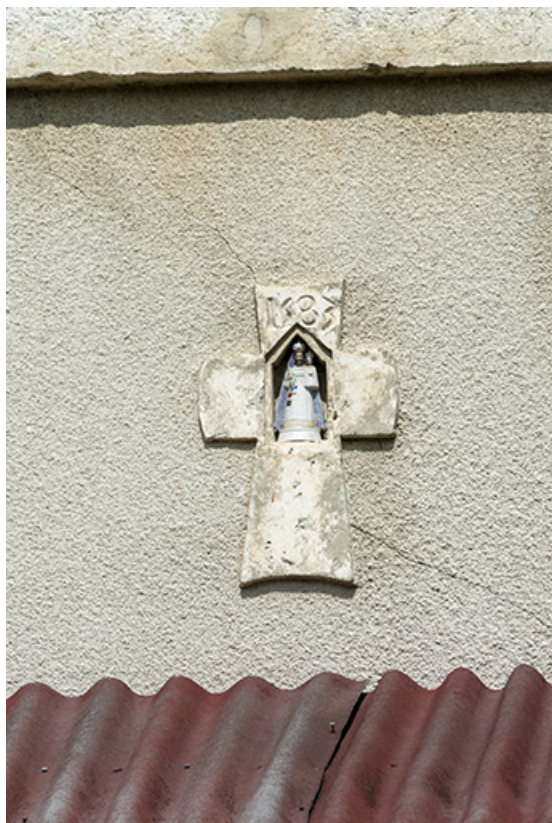
Façade antérieure : croix portant la date 1583, avec niche et statuette de la Vierge. 25, Les Fontenelles, 33 rue Principale