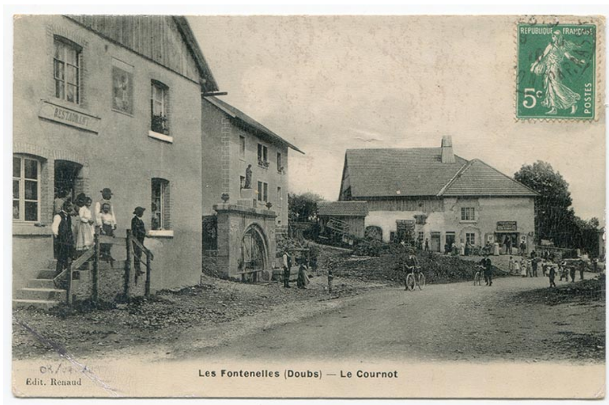
Les Fontenelles (Doubs) - Le Cournot, 1er quart 20e siècle [avant 1910 ?].