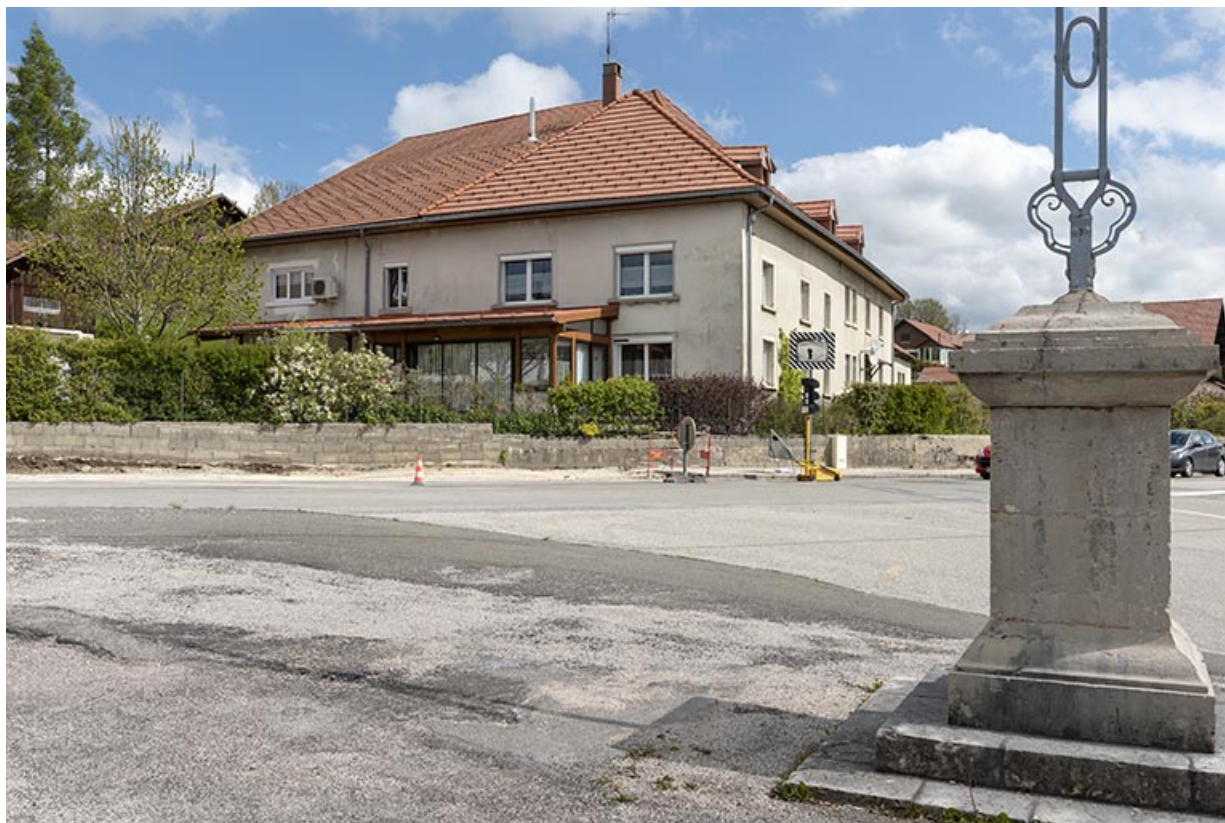
Vue d'ensemble, depuis le sud-ouest.