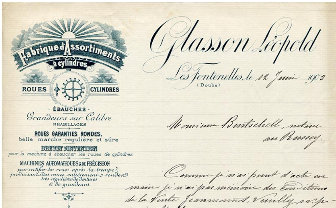
Papier à en-tête de Léopold Glasson (détail), 12 juin 1903. 25, Les Fontenelles, 5 rue Principale