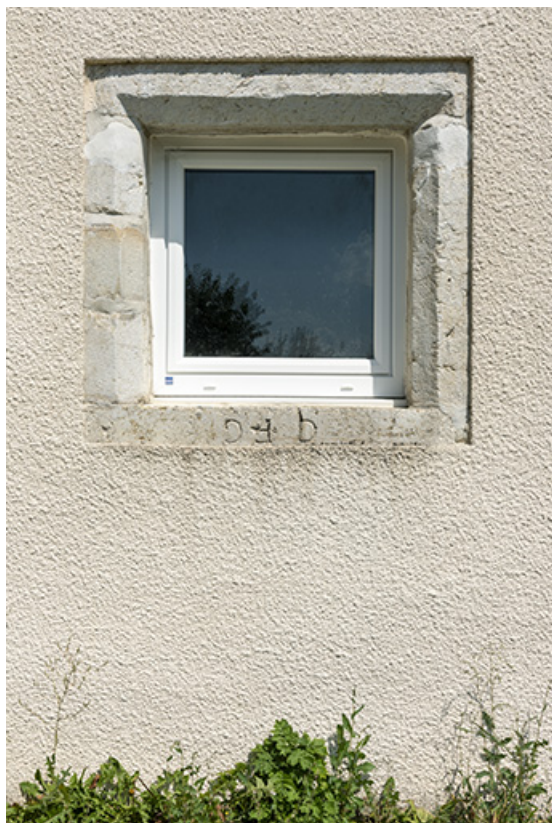
Fenêtre avec pierre en remploi, sur la façade postérieure.