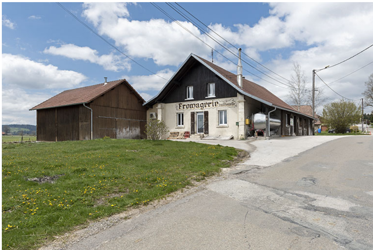
Vue d'ensemble, depuis le sud-est (avec la pièce d'affinage récente à gauche). 25, Bonnétagé, 6 route de Cerneux-Monnot, lieudit : les Cerneux-Monnots