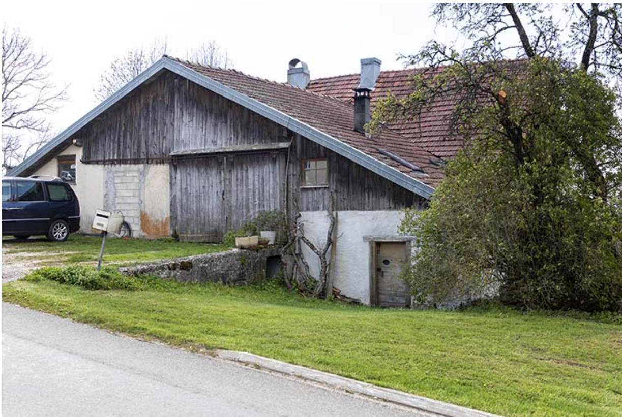
Façade nord (côté rue), de trois quarts droite.

25, Bonnétagé, 1 rue de la Fontaine, lieudit : le Village Bas