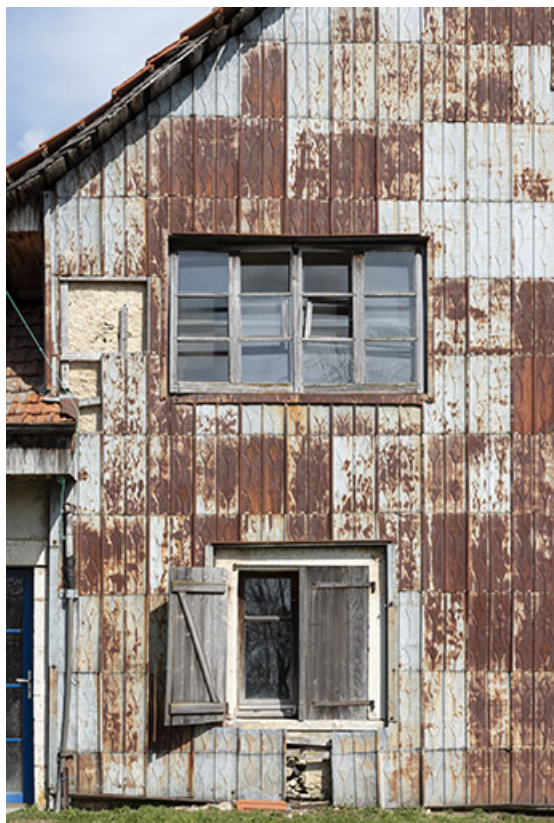
Façade ouest : essentage de tôle et fenêtre d'atelier.

25, Bonnétagé, 1 rue de la Fontaine, lieudit : le Village Bas