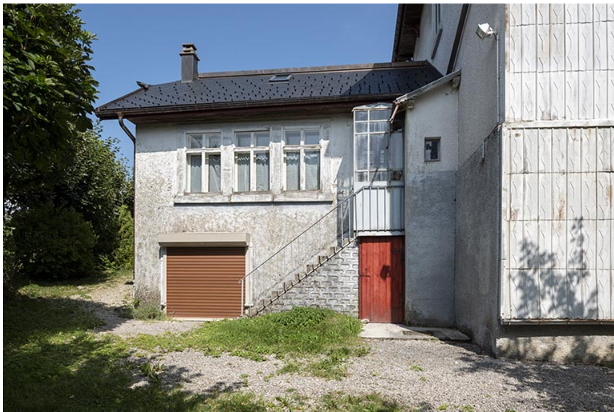
Façade postérieure de l'atelier.

25, Bonnétagé, 23 route du Village Bas, lieudit : le Village Bas