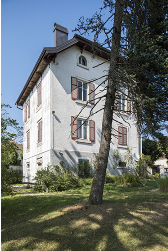
Façades postérieure et latérale gauche de la maison.

25, Bonnétagé, 23 route du Village Bas, lieudit : le Village Bas