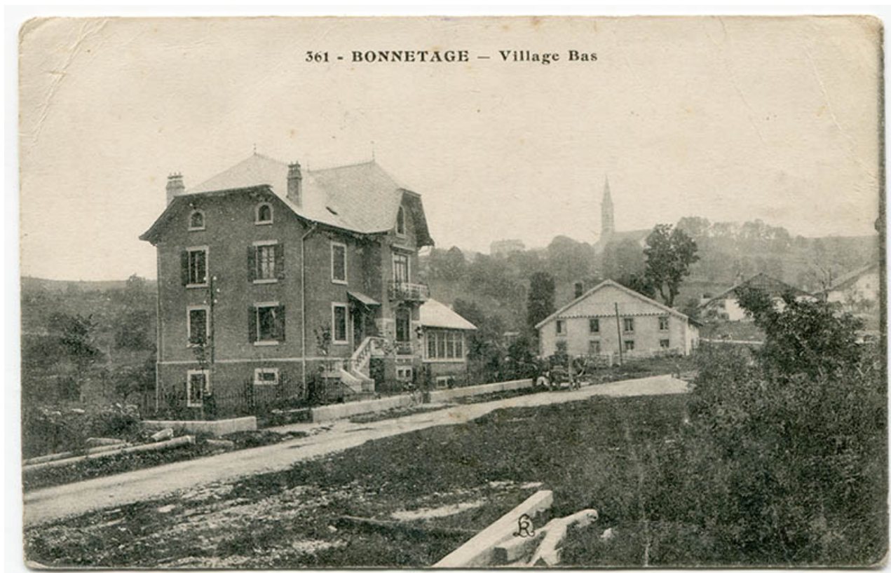
361. Bonnetage - Village Bas, 1er quart 20e siècle.

25, Bonnetage, 23 route du Village Bas, lieudit : le Village Bas