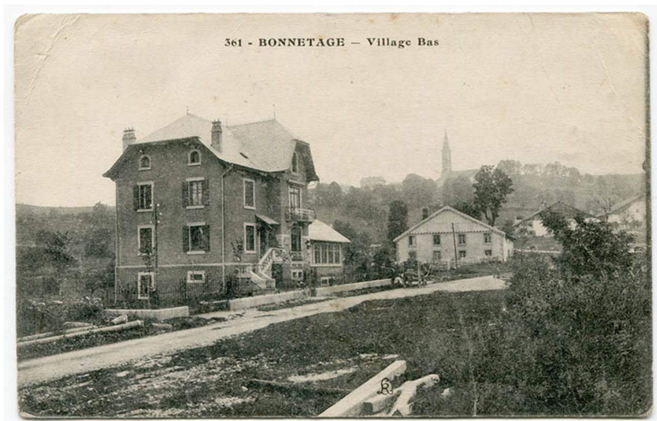
361. Bonnetage - Village Bas, 1er quart 20e siècle.

25, Bonnetage, 23 route du Village Bas, lieudit : le Village Bas