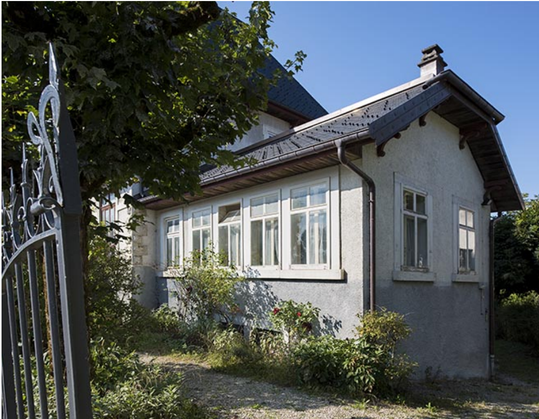
Façades antérieure et latérale droite de l'atelier.

25, Bonnétagé, 23 route du Village Bas, lieudit : le Village Bas