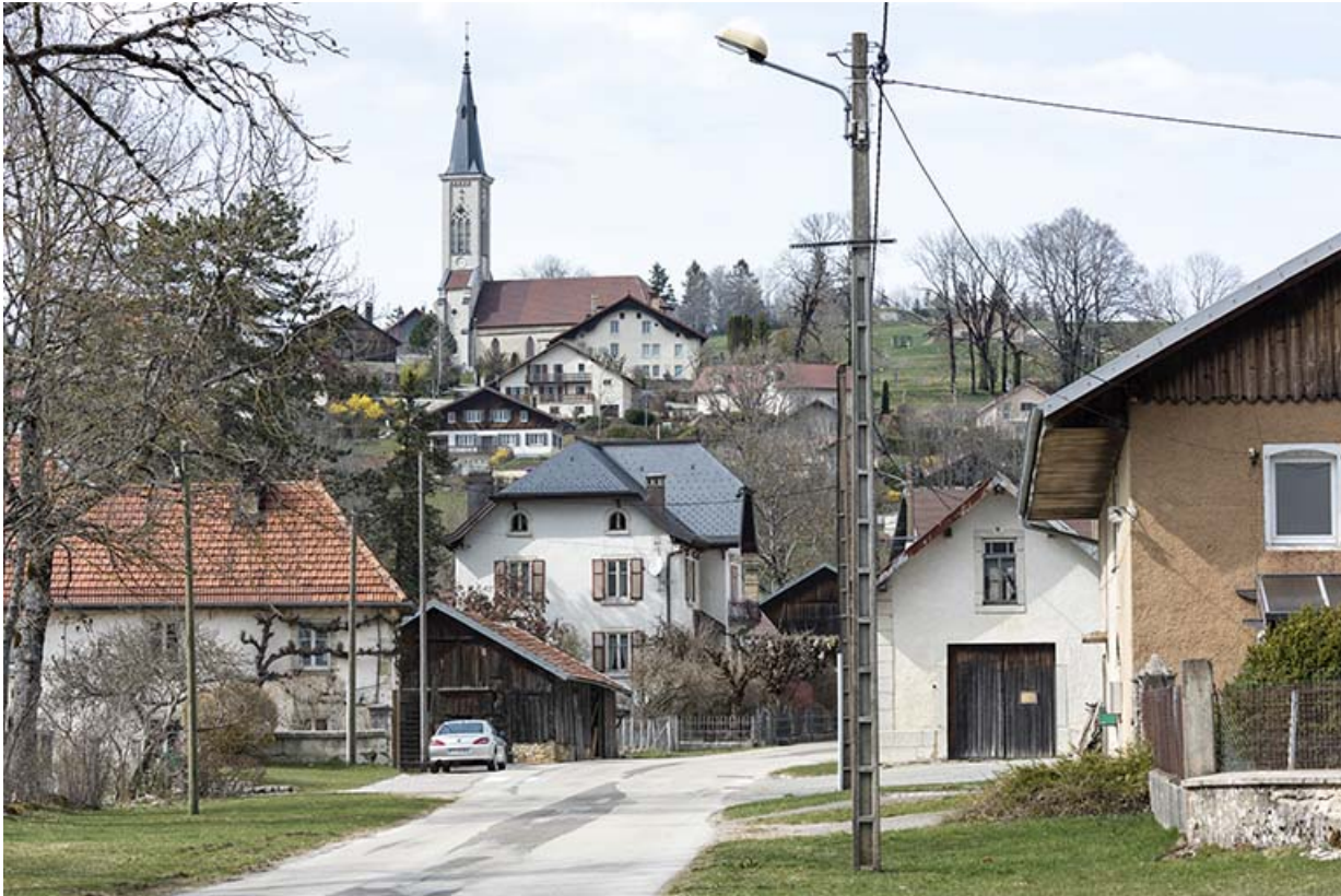
Vue d'ensemble éloignée, depuis le sud.

25, Bonnétagé, 23 route du Village Bas, lieudit : le Village Bas