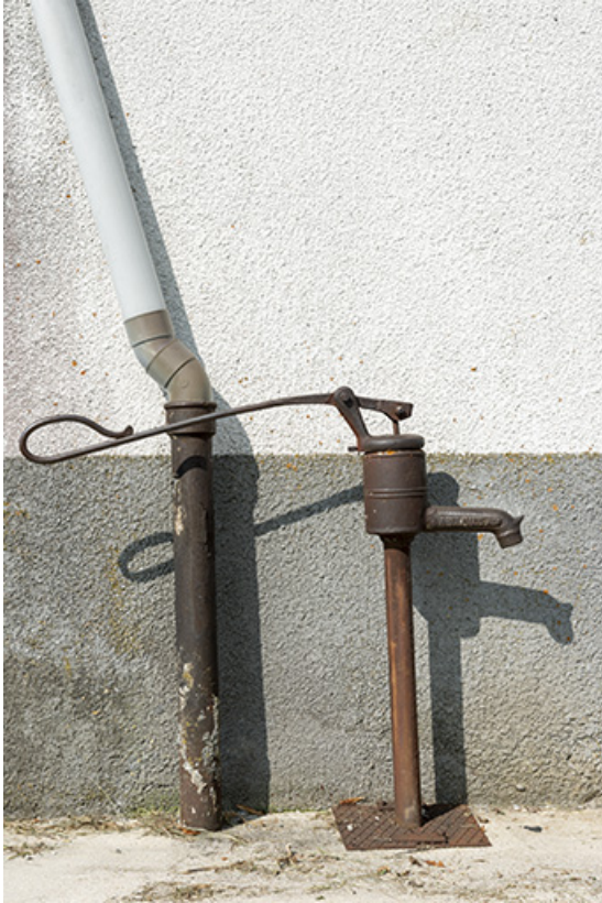
Pompe à eau Renaud (aux Fontenelles).

25, Bonnétagé, 1 allée du Tilleul, lieudit : le Grand Communal