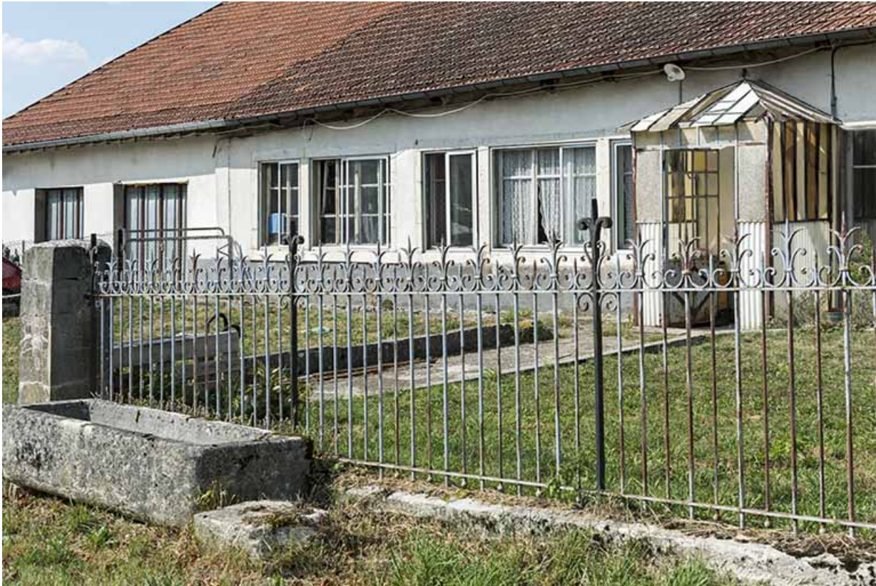
Fenêtres de l'atelier sur la façade antérieure.

25, Bonnétagé, 1 allée du Tilleul, lieudit : le Grand Communal