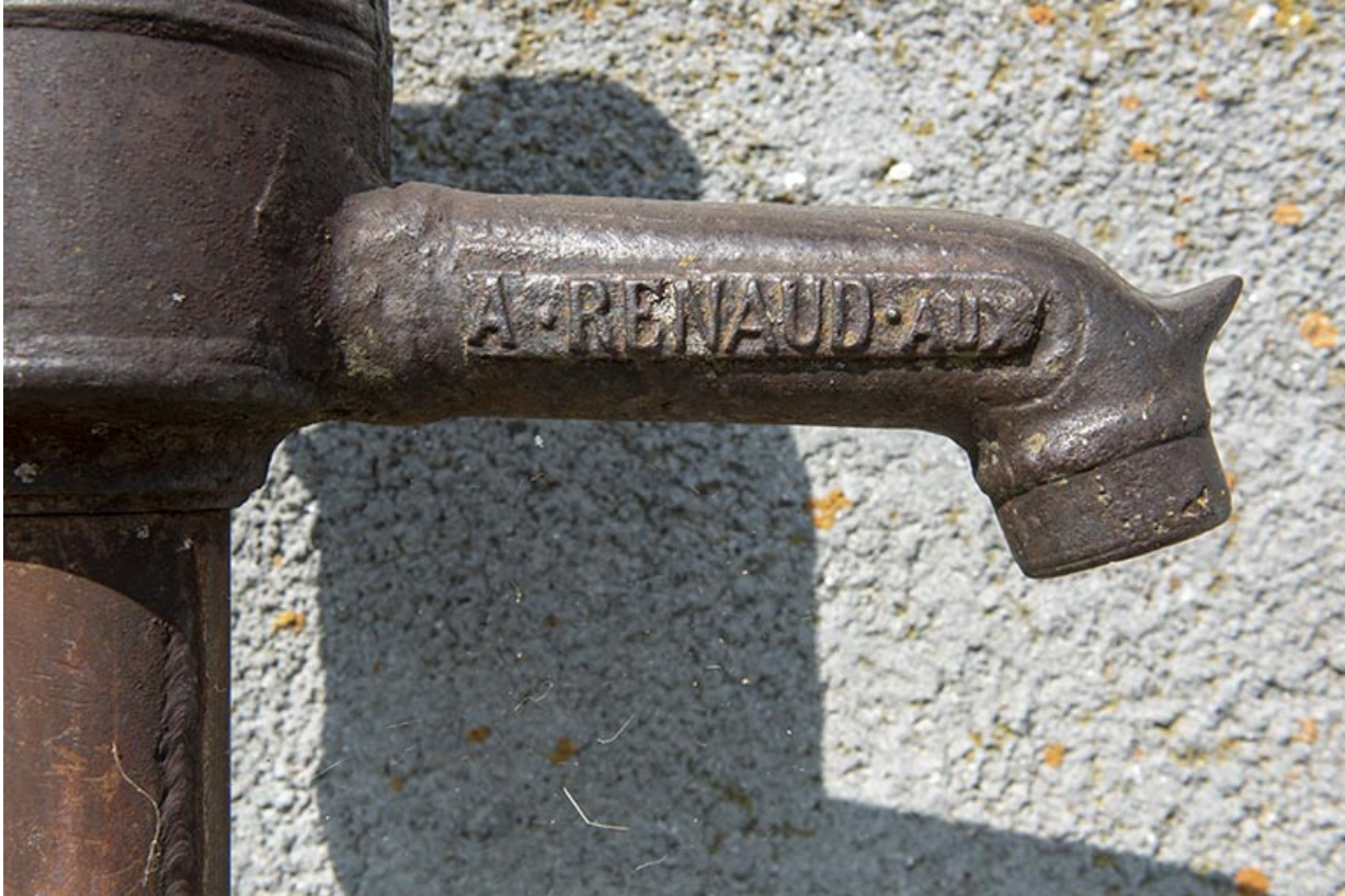
Pompe à eau Renaud (aux Fontenelles) : inscription.

25, Bonnétagé, 1 allée du Tilleul, lieudit : le Grand Communal