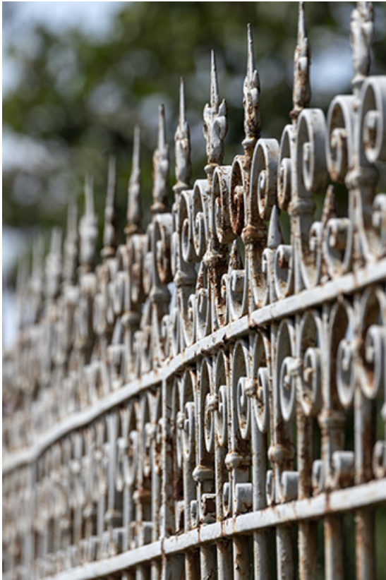
Clôture : détail de ferronnerie de la grille, vue en enfilade.

25, Bonnétagé, 1 rue de l' Helvétie, lieudit : le Grand Communal