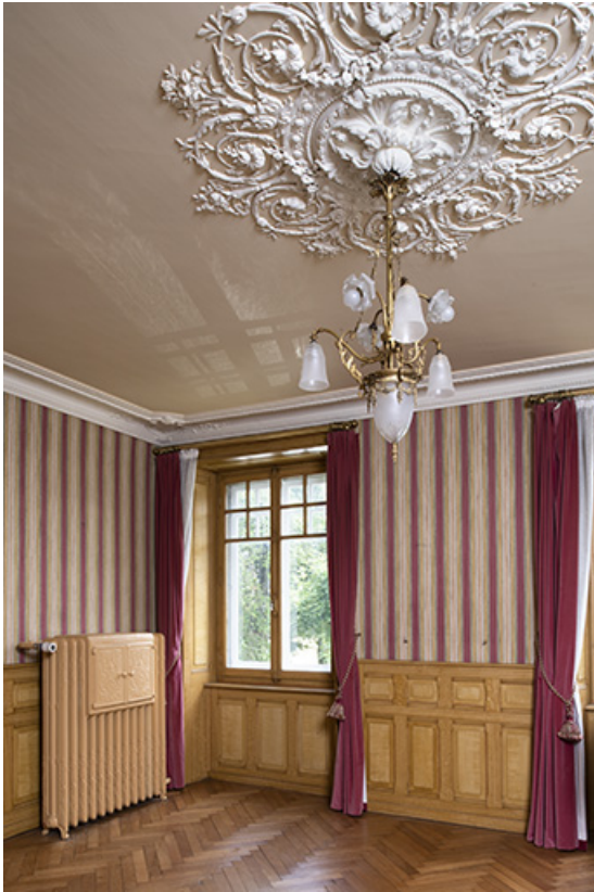
Maison : salon.

25, Bonnétagé, 1 rue de l' Helvétie, lieudit : le Grand Communal