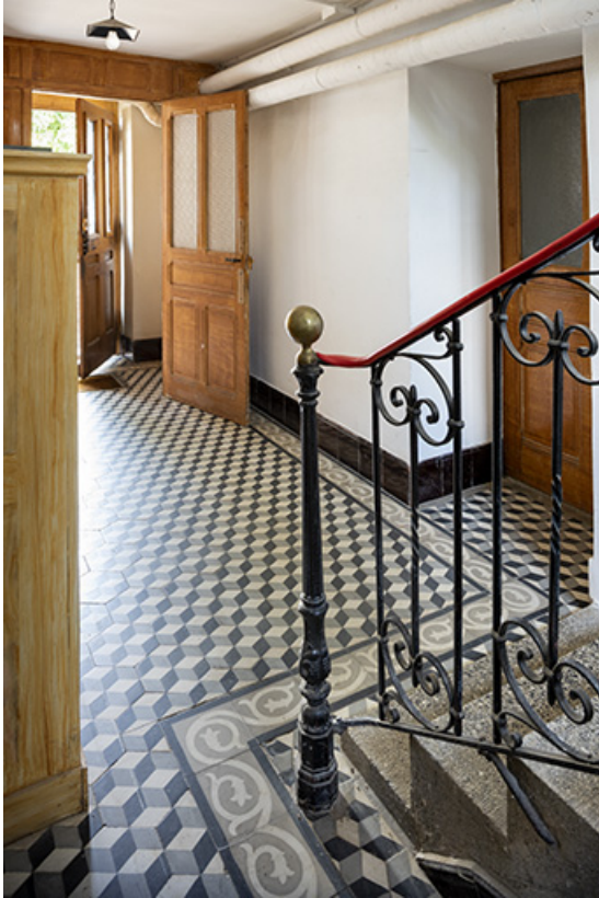
Usine : entrée et départ d'escalier.

25, Bonnétagé, 1 rue de l' Helvétie, lieudit : le Grand Communal