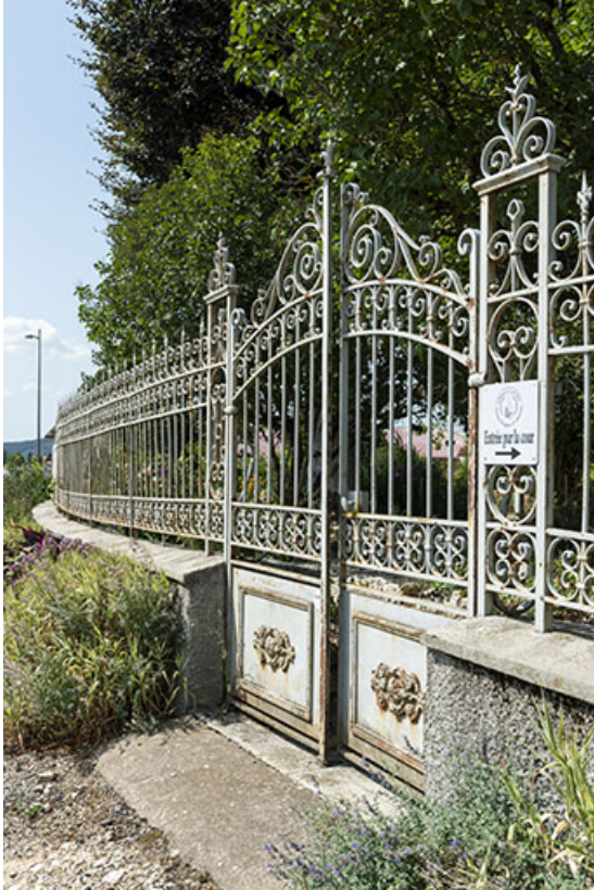
Clôture : grille et porte, vues en enfilade.

25, Bonnetage, 1 rue de l' Helvétie, lieudit : le Grand Communal