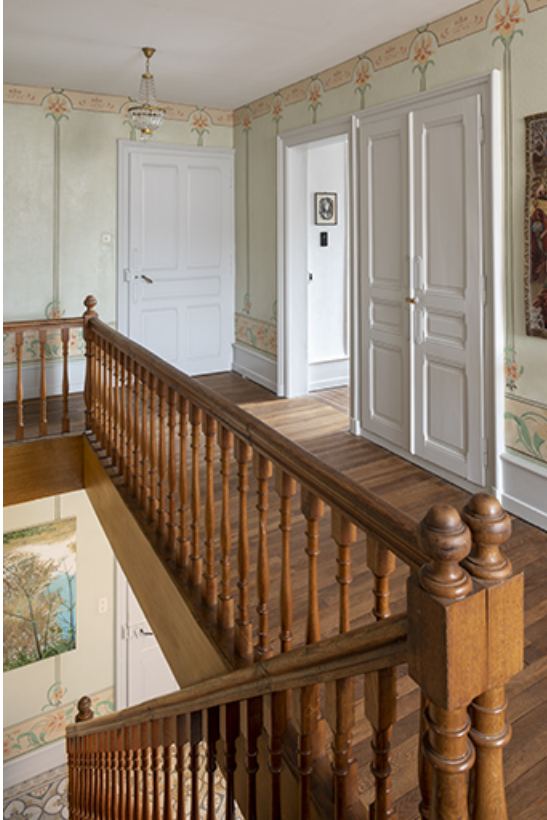
Maison : décor du palier à l'étage.

25, Bonnétable, 1 rue de l' Helvétie, lieudit : le Grand Communal