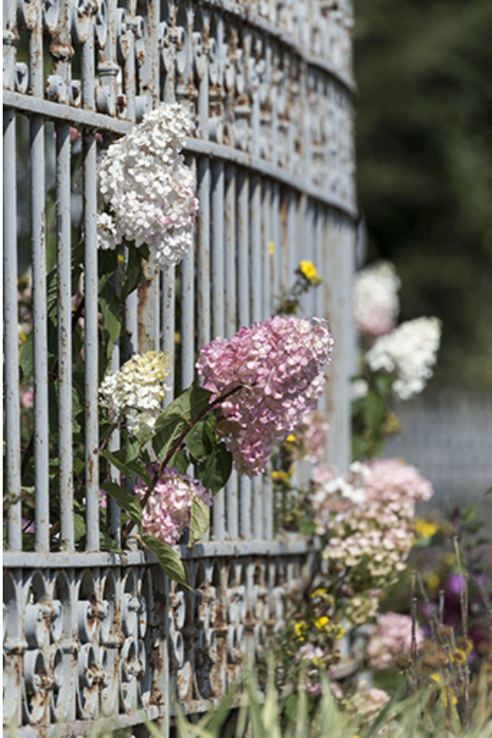
Clôture : lilas dépassant de la grille.

25, Bonnétagé, 1 rue de l' Helvétie, lieudit : le Grand Communal