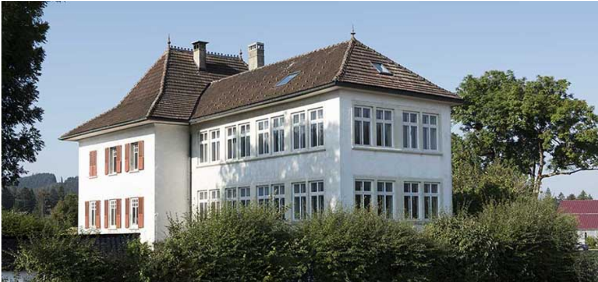
Vue d'ensemble, depuis le nord-est.

25, Bonnétagé, 1 rue de l' Helvétie, lieudit : le Grand Communal