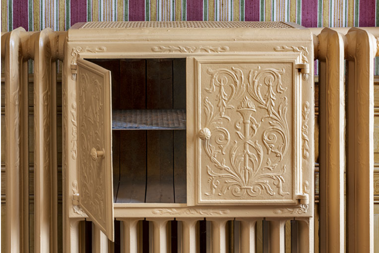
Maison, salon : chauffe-plat du radiateur.

25, Bonnétagé, 1 rue de l' Helvétie, lieudit : le Grand Communal