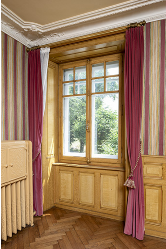
Maison, salon : fenêtre et boiseries avec décor de faux bois.

25, Bonnétable, 1 rue de l' Helvétie, lieudit : le Grand Communal