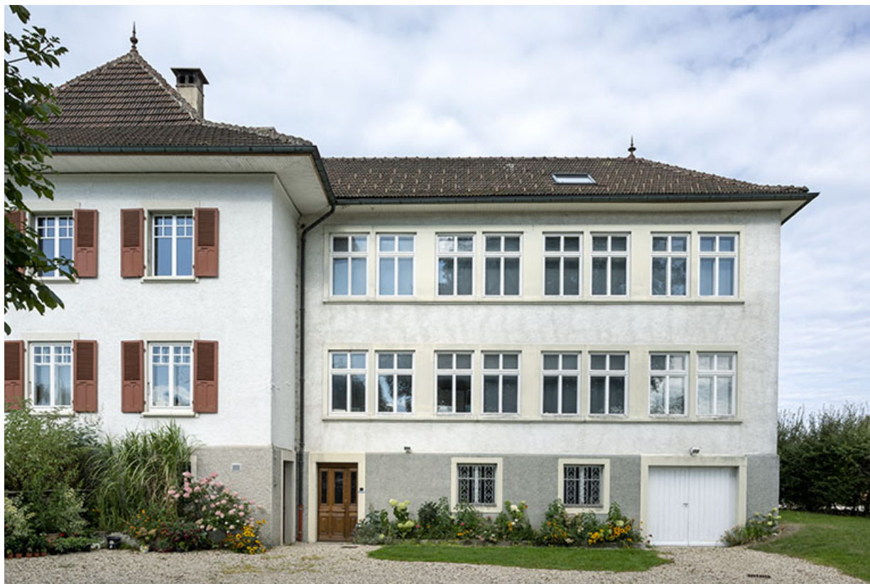
Usine : façade antérieure.

25, Bonnétagé, 1 rue de l' Helvétie, lieudit : le Grand Communal