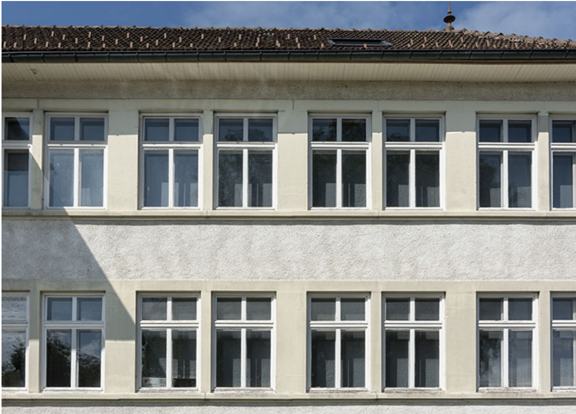
Usine : fenêtres horlogères sur la façade antérieure.

25, Bonnétagé, 1 rue de l' Helvétie, lieudit : le Grand Communal