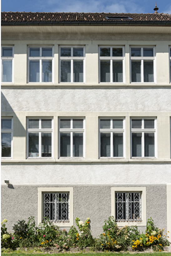
Usine : travées centrales de la façade antérieure.

25, Bonnétable, 1 rue de l' Helvétie, lieudit : le Grand Communal