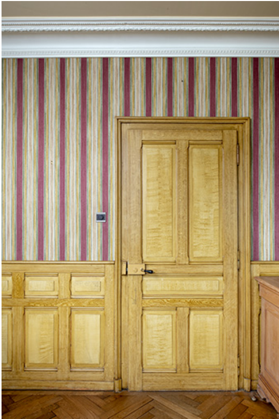
Maison, salon : porte et boiseries avec décor de faux bois.

25, Bonnétagé, 1 rue de l' Helvétie, lieudit : le Grand Communal