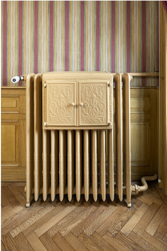
Maison, salon : radiateur avec chauffe-plat.

25, Bonnétable, 1 rue de l' Helvétie, lieudit : le Grand Communal