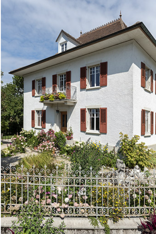
Maison : façade antérieure, de trois quarts droite.

25, Bonnétable, 1 rue de l' Helvétie, lieudit : le Grand Communal