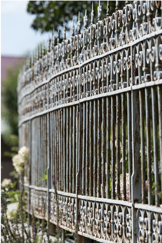
Clôture : grille, vue en enfilade.

25, Bonnétable, 1 rue de l' Helvétie, lieudit : le Grand Communal