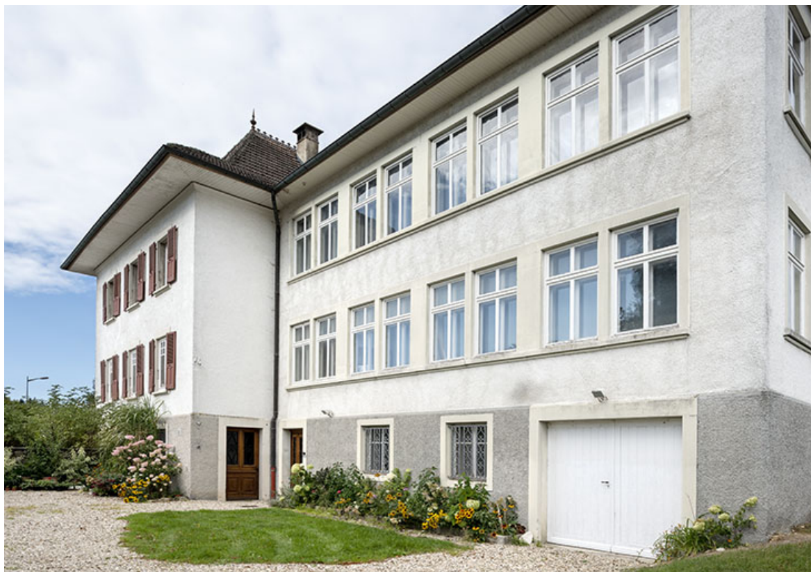
Usine d'échappements à ancre Gaston puis Yvonne Cuenin, à Bonnétagé.

25, Bonnétagé, 1 rue de l' Helvétie, lieudit : le Grand Communal