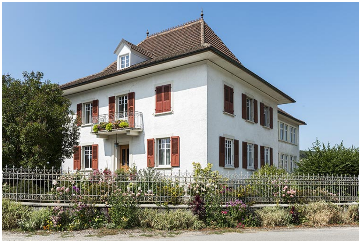
Maison : façades antérieure et latérale droite.

25, Bonnétagé, 1 rue de l' Helvétie, lieudit : le Grand Communal