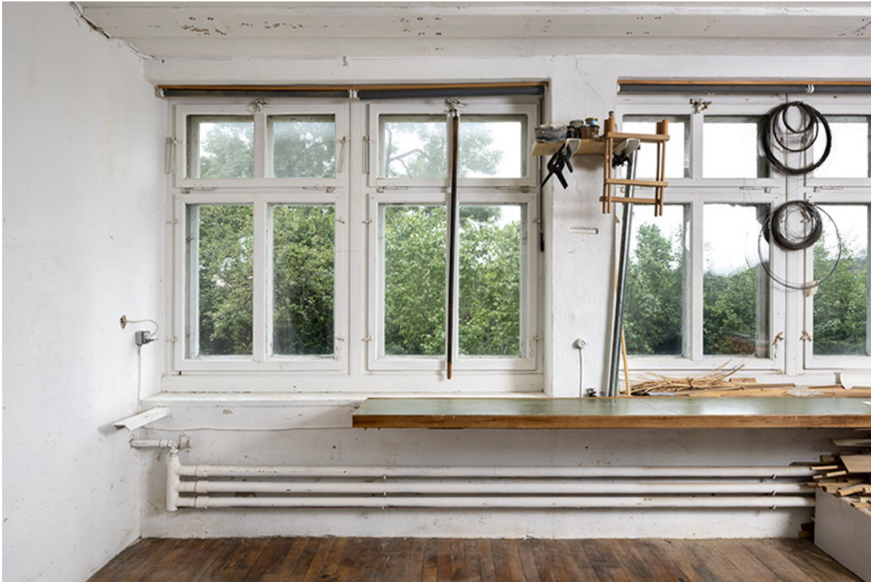
Usine, atelier : fenêtres horlogères, établi et chauffage.

25, Bonnétagé, 1 rue de l' Helvétie, lieudit : le Grand Communal