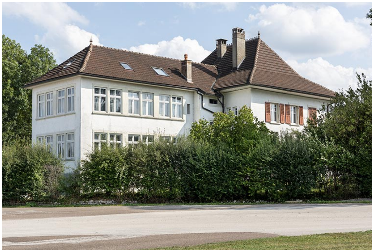
Vue d'ensemble, depuis le nord-ouest.

25, Bonnétagé, 1 rue de l' Helvétie, lieudit : le Grand Communal