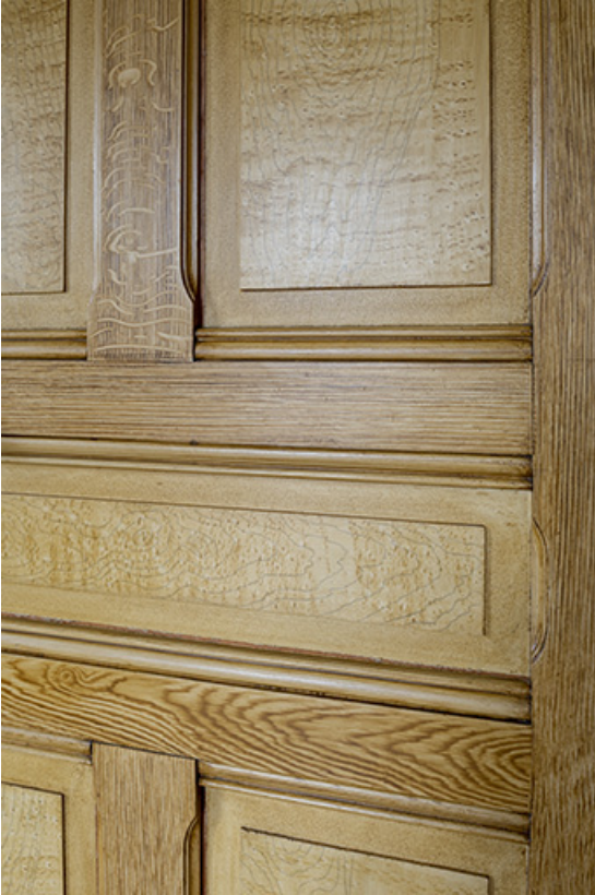
Maison, salon : décor de faux bois de la porte.

25, Bonnétagé, 1 rue de l' Helvétie, lieudit : le Grand Communal