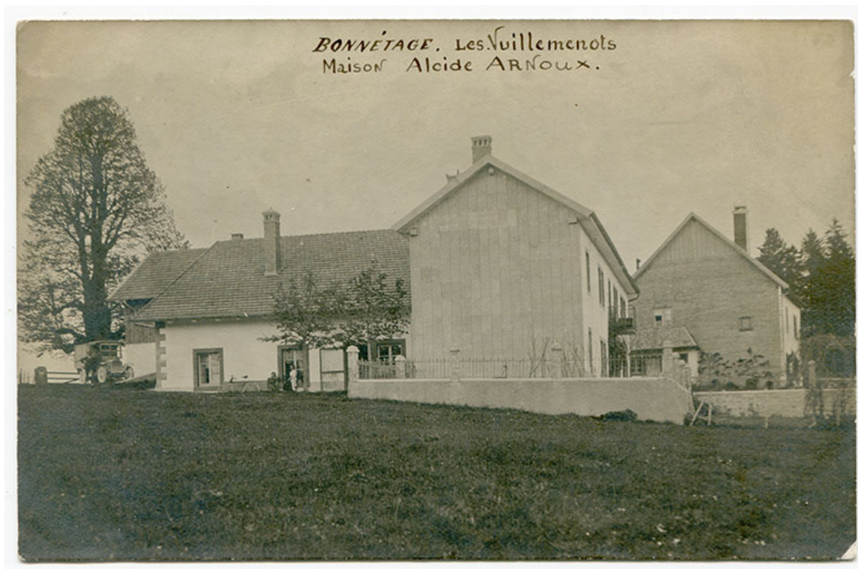
Bonnetage. Les Vuillemenots. Maison Alcide Arnoux, 1er quart 20e siècle.

25, Bonnetage, 12 rue de Vuillemenots, lieudit : le Grand Communal