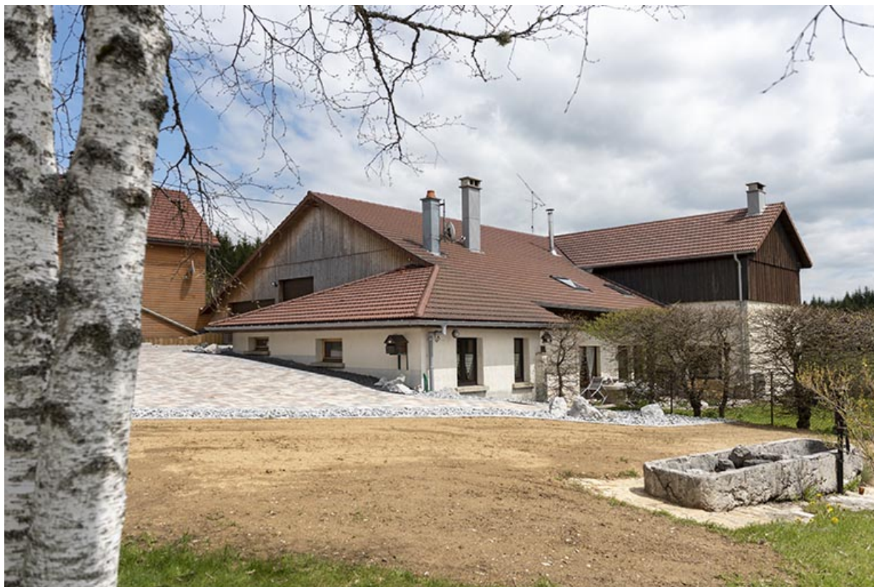
Vue d'ensemble, depuis l'ouest (façades antérieure et latérale droite). L'abreuvoir est visible à droite. 25, Bonnétagé, 12 rue de Vuillemenots, lieudit : le Grand Communal