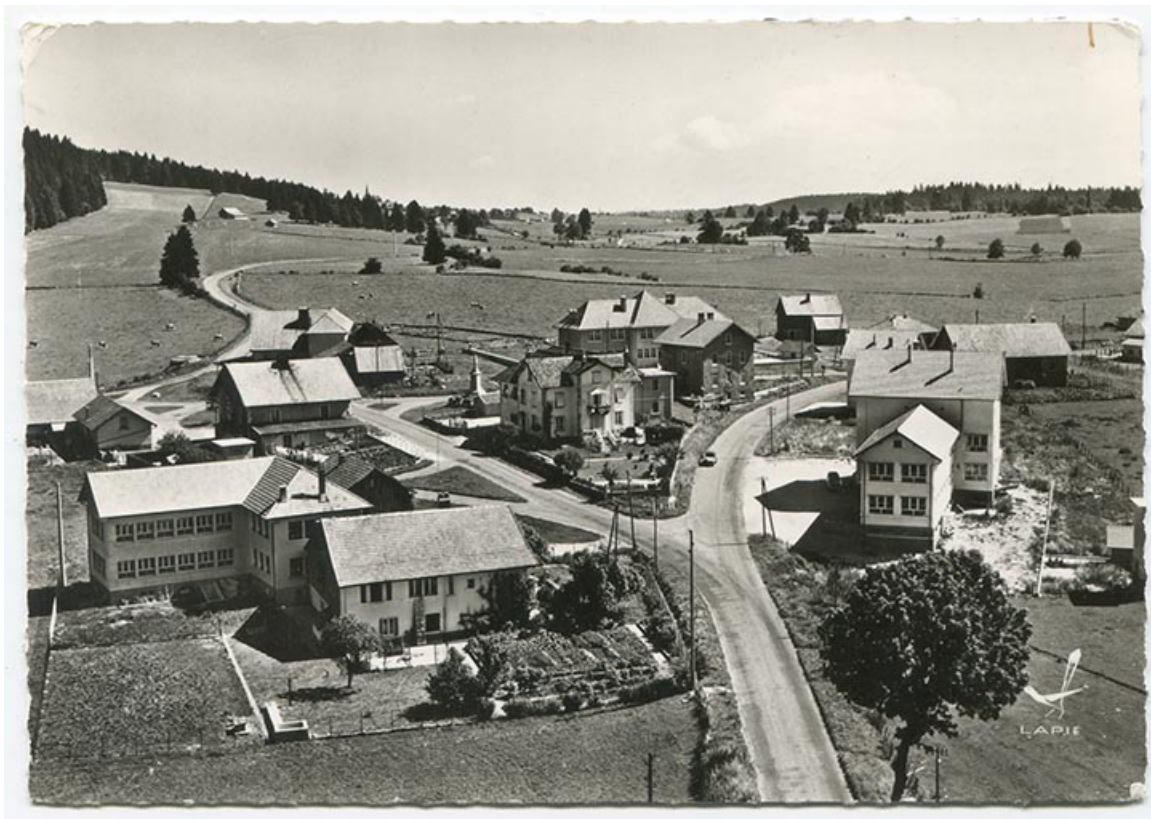
En avion au-dessus de... 2. Bonnétagé (Doubs). Le grand communal, 1951-1952.

25, Bonnétagé, 4 route de Besançon, lieudit : le Grand Communal