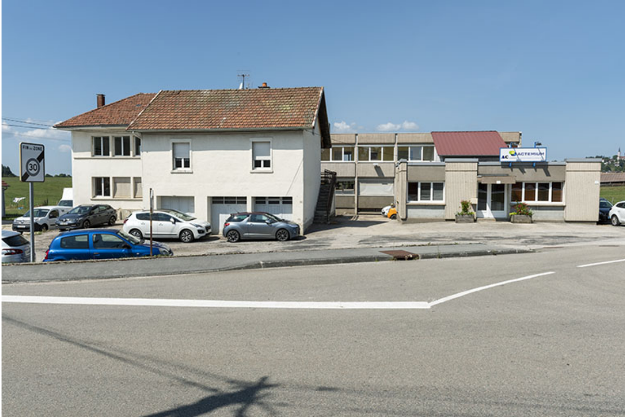
Vue d'ensemble depuis l'est : bâtiments anciens à gauche, récents à droite.

25, Bonnétable, 8-10 route de Besançon, lieudit : le Grand Communal