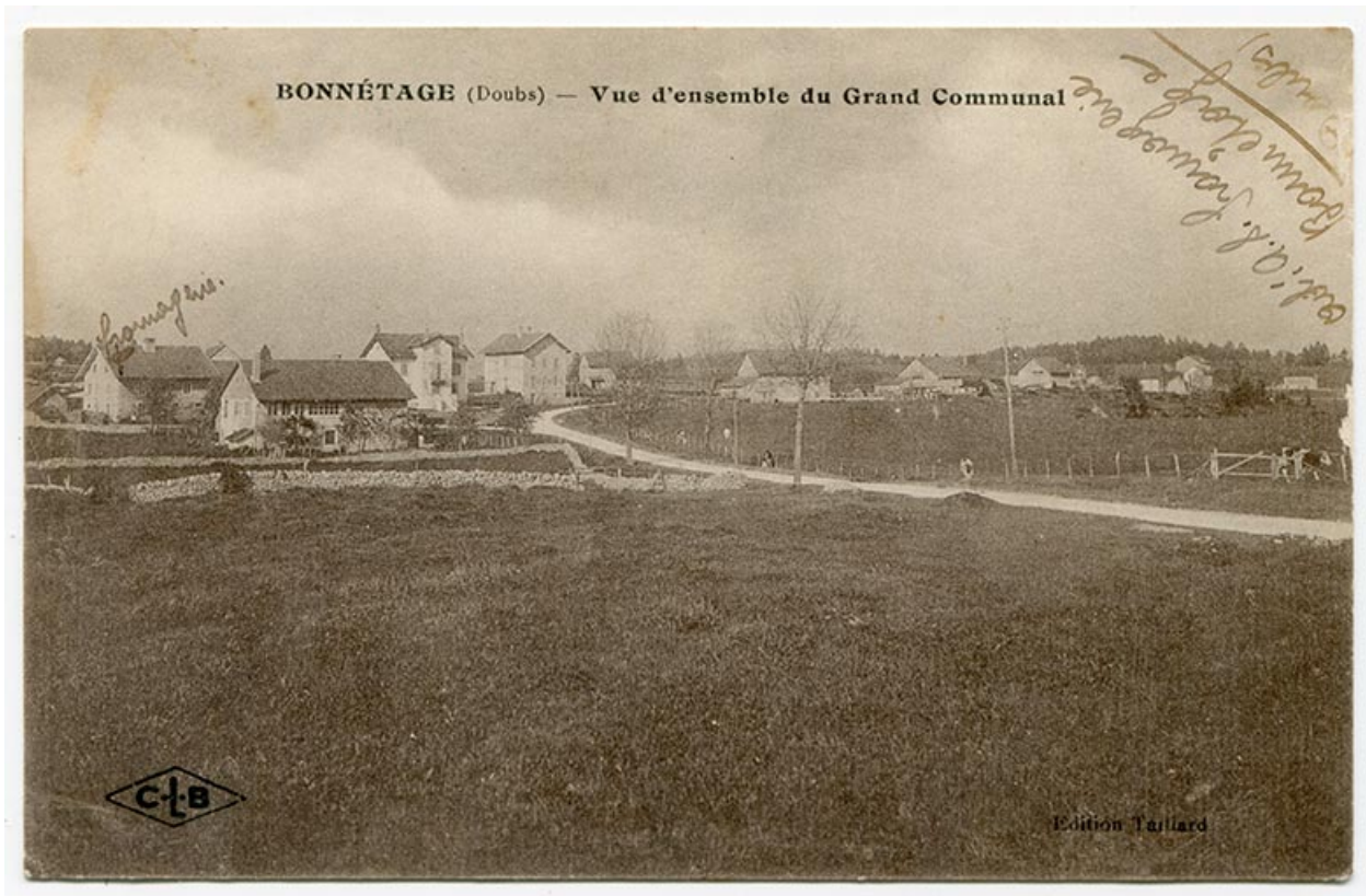
Bonnétagé (Doubs) - Vue d'ensemble du Grand Communal, 1er quart 20e siècle [entre 1914 et 1920].

25, Bonnétagé, 4 route de Besançon, lieudit : le Grand Communal