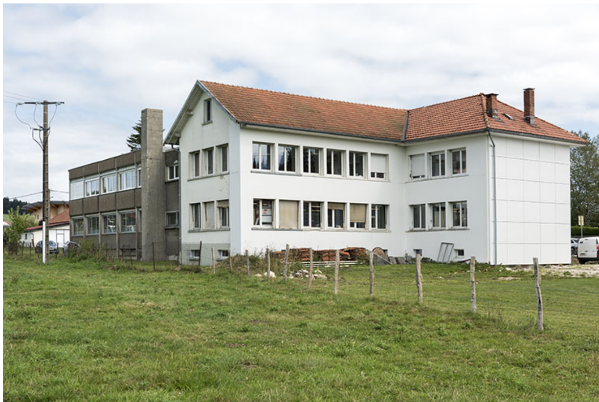
Bâtiments anciens : façade postérieure, de trois quarts droite.

25, Bonnétagé, 8-10 route de Besançon, lieudit : le Grand Communal