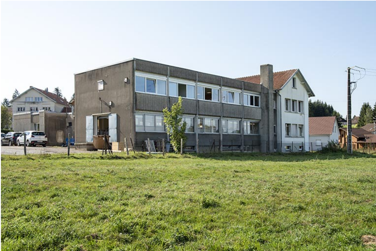
Bâtiments récents : façade postérieure, de trois quarts gauche.

25, Bonnétagé, 8-10 route de Besançon, lieudit : le Grand Communal