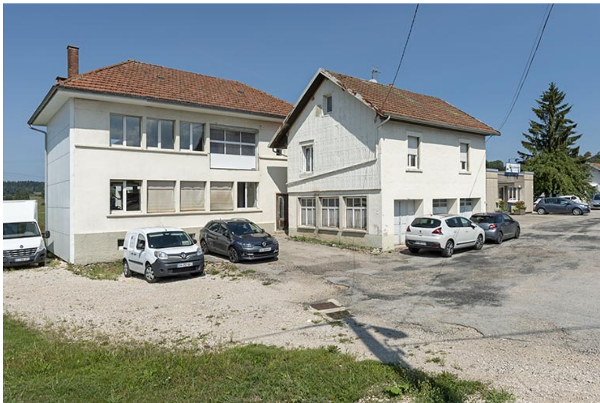
Bâtiments anciens : façade antérieure, de trois quarts gauche.

25, Bonnétagé, 8-10 route de Besançon, lieudit : le Grand Communal