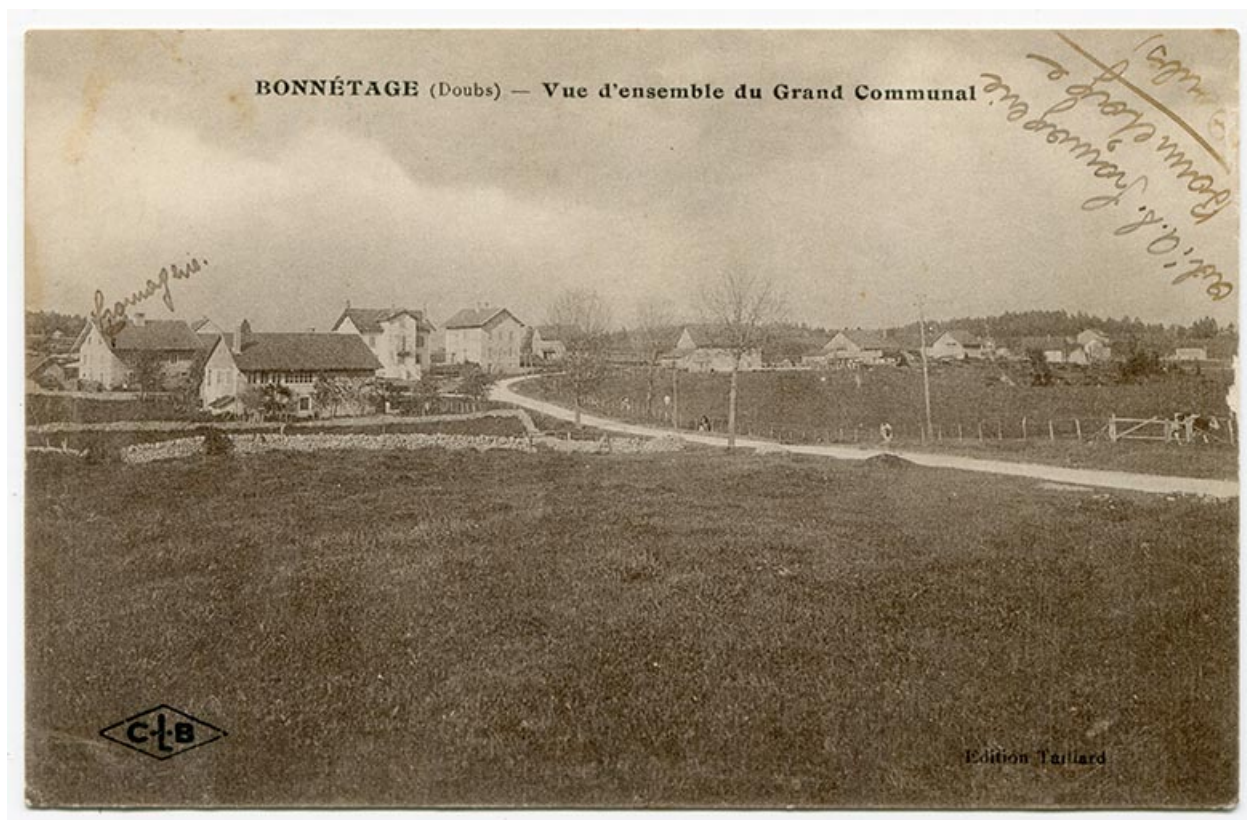
Bonnétagé (Doubs) - Vue d'ensemble du Grand Communal, 1er quart 20e siècle [entre 1914 et 1920].

25, Bonnétagé, 4 route de Besançon, lieudit : le Grand Communal