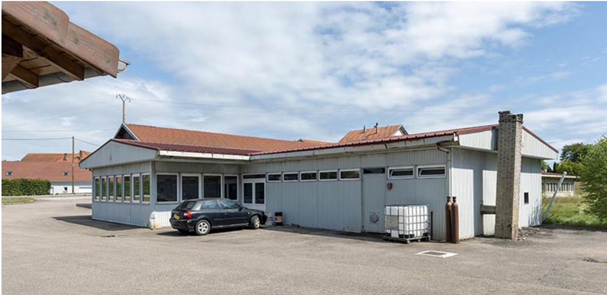
Façade latérale droite, de trois quarts droite.

25, Bonnétagé, 7 route de Besançon, lieudit : le Grand Communal