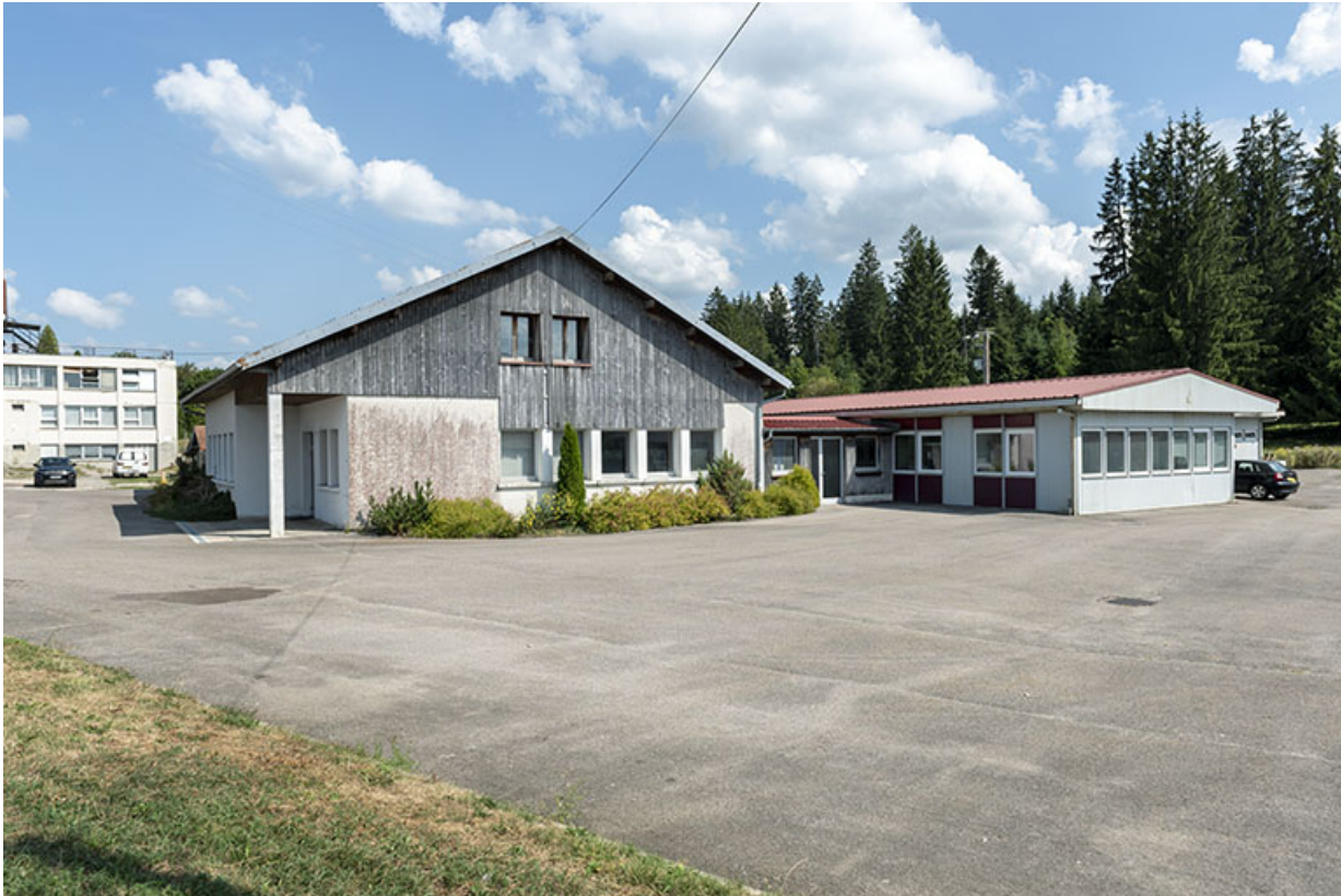
Façade latérale droite, de trois quarts gauche.

25, Bonnétagé, 7 route de Besançon, lieudit : le Grand Communal