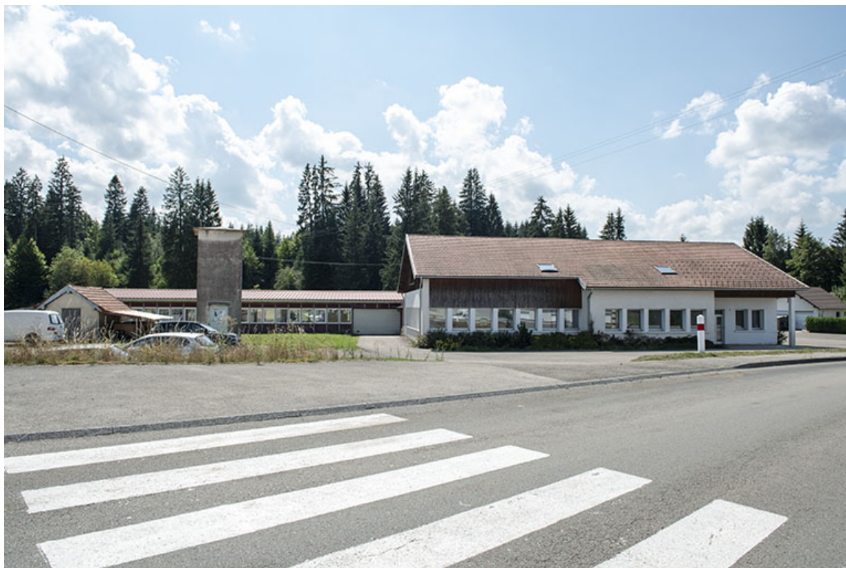
Vue d'ensemble, depuis le nord.

25, Bonnétable, 7 route de Besançon, lieudit : le Grand Communal