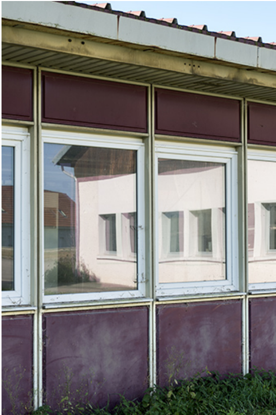
Deux travées de la façade antérieure.

25, Bonnétagé, 7 route de Besançon, lieudit : le Grand Communal