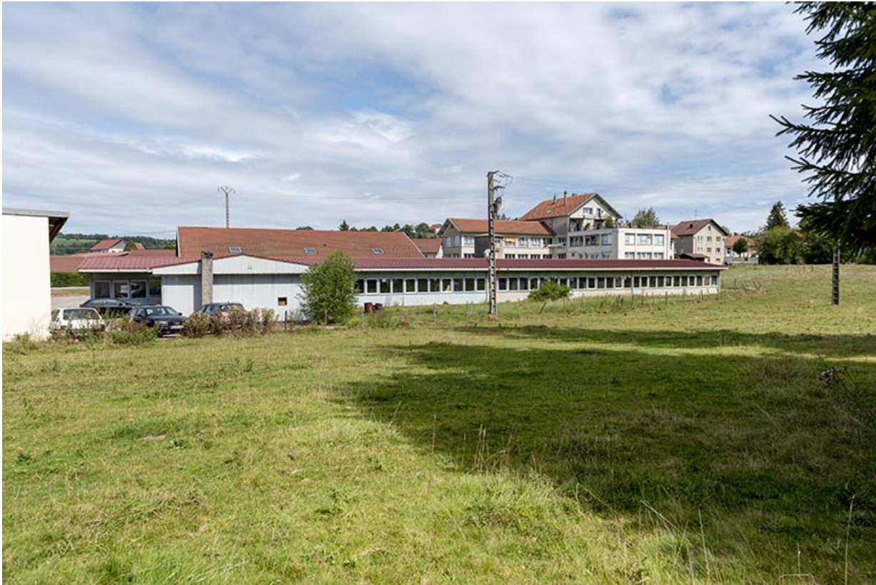
Façade postérieure, de trois quarts gauche.

25, Bonnétagé, 7 route de Besançon, lieudit : le Grand Communal