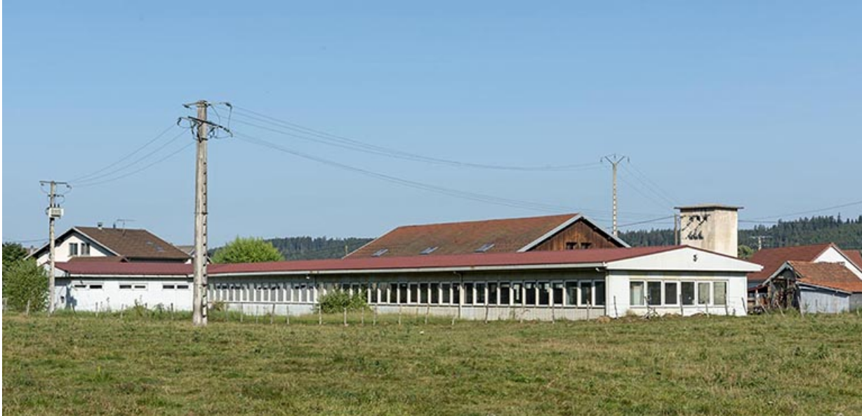
Façade postérieure, de trois quarts droite.

25, Bonnétable, 7 route de Besançon, lieudit : le Grand Communal