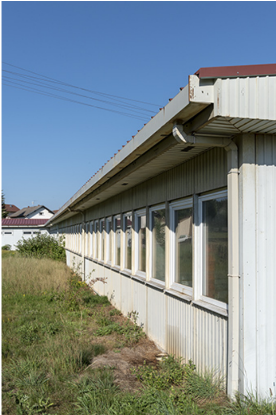
Façade postérieure, vue en enfilade.

25, Bonnétable, 7 route de Besançon, lieudit : le Grand Communal