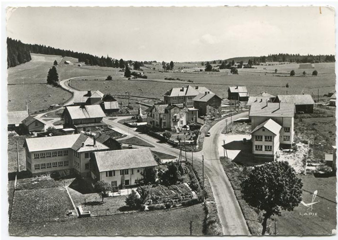
En avion au-dessus de... 2. Bonnetage (Doubs). Le grand communal, 1951-1952.

25, Bonnetage, 4 route de Besançon, lieudit : le Grand Communal