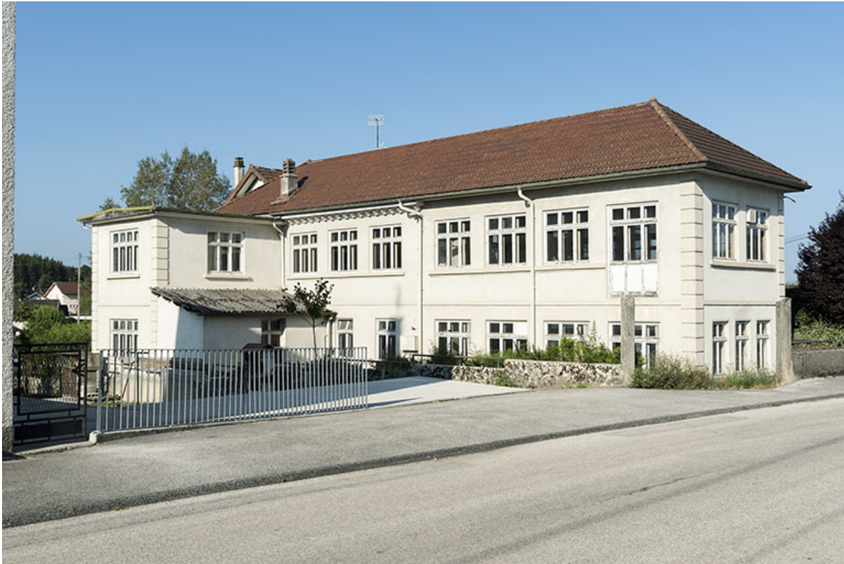
Site d'origine : façade postérieure de l'usine, de trois quarts droite.

25, Bonnetage, 5 route de Besançon, lieudit : le Grand Communal