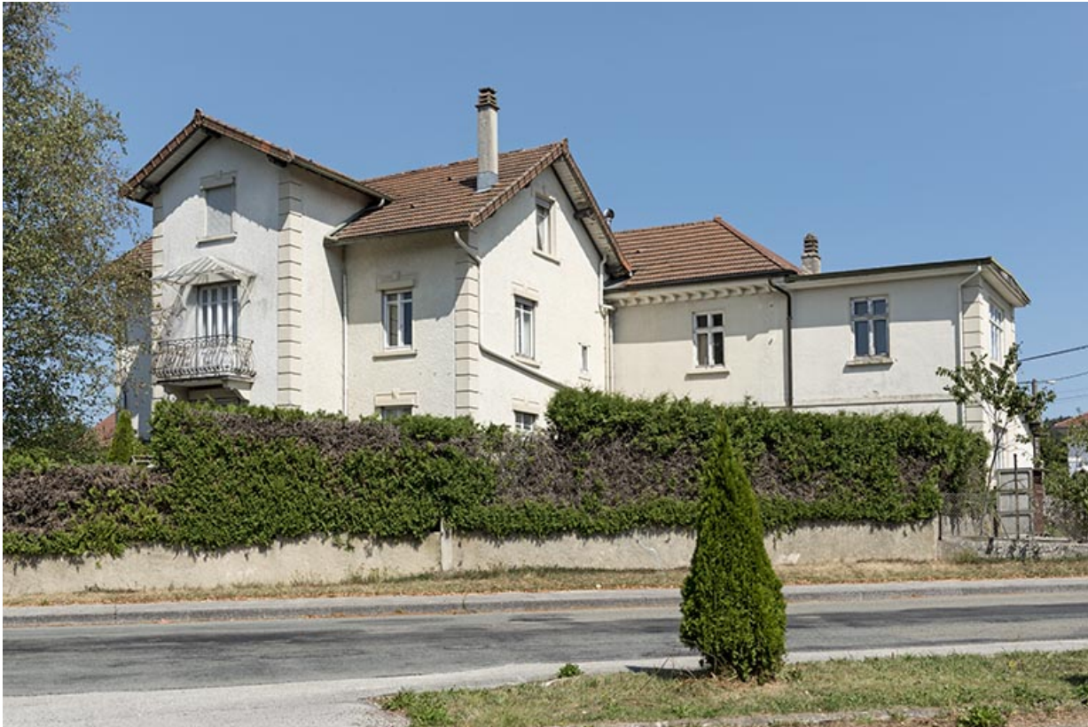
Site d'origine : vue d'ensemble, depuis le sud.

25, Bonnétagé, 5 route de Besançon, lieudit : le Grand Communal