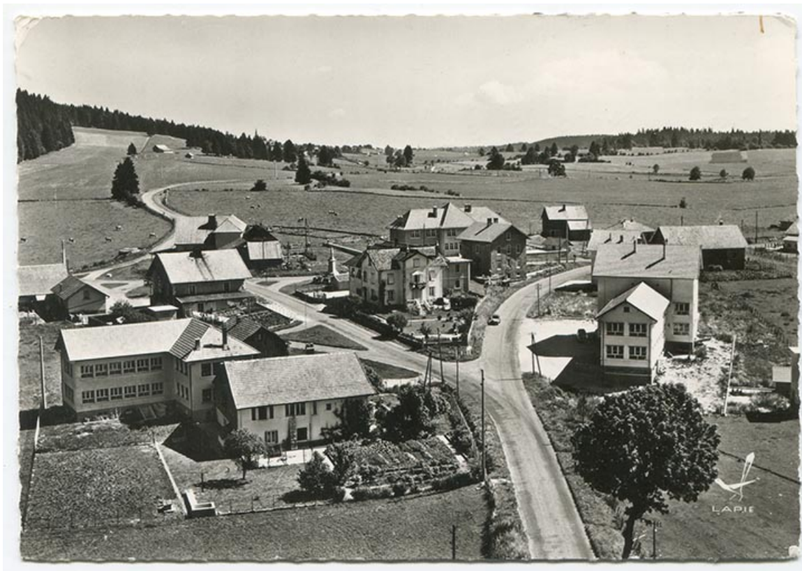
En avion au-dessus de... 2. Bonnétagé (Doubs). Le grand communal, 1951-1952.

25, Bonnétagé, 8-10 route de Besançon, lieudit : le Grand Communal