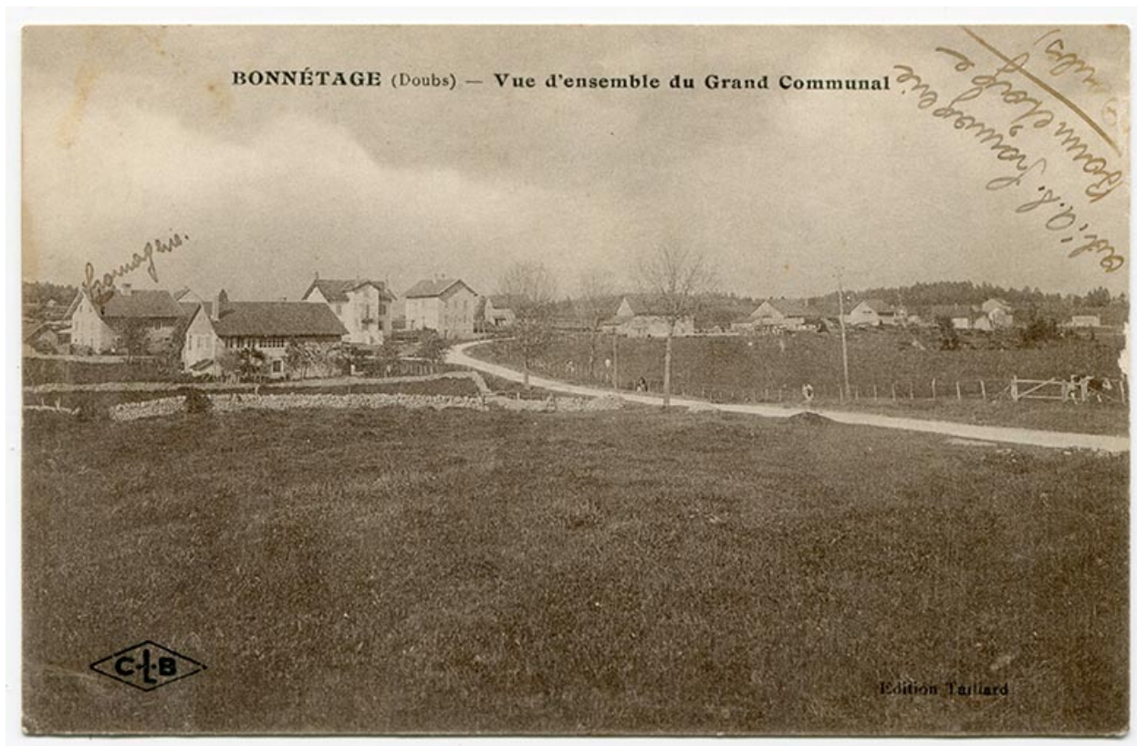
Bonnétagé (Doubs) - Vue d'ensemble du Grand Communal, 1er quart 20e siècle [entre 1914 et 1920].

25, Bonnétagé, 4 route de Besançon, lieudit : le Grand Communal