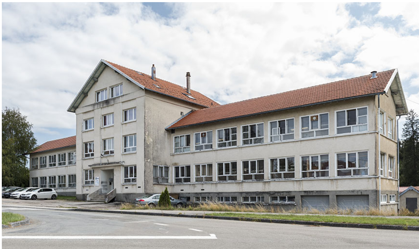
Deuxième usine : façade antérieure, de trois quarts droite.

25, Bonnétagé, 5 route de Besançon, lieudit : le Grand Communal