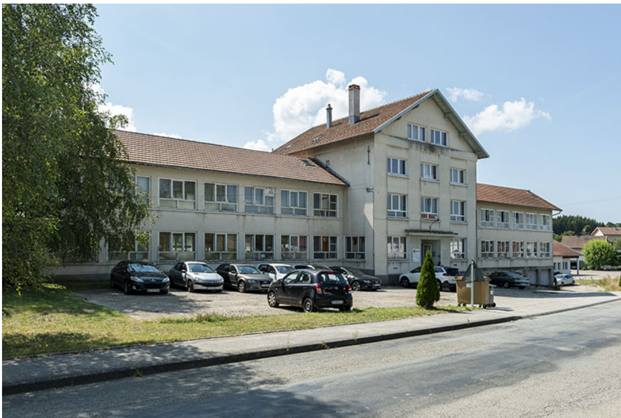
Deuxième usine : façade antérieure, de trois quarts gauche. 25, Bonnétagé, 5 route de Besançon, lieudit : le Grand Communal