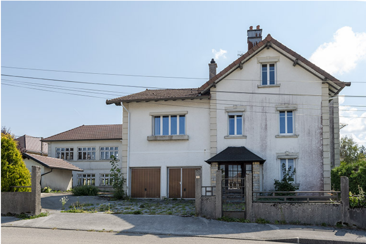
Site d'origine : façade antérieure de l'usine et de la maison.

25, Bonnétagé, 5 route de Besançon, lieudit : le Grand Communal