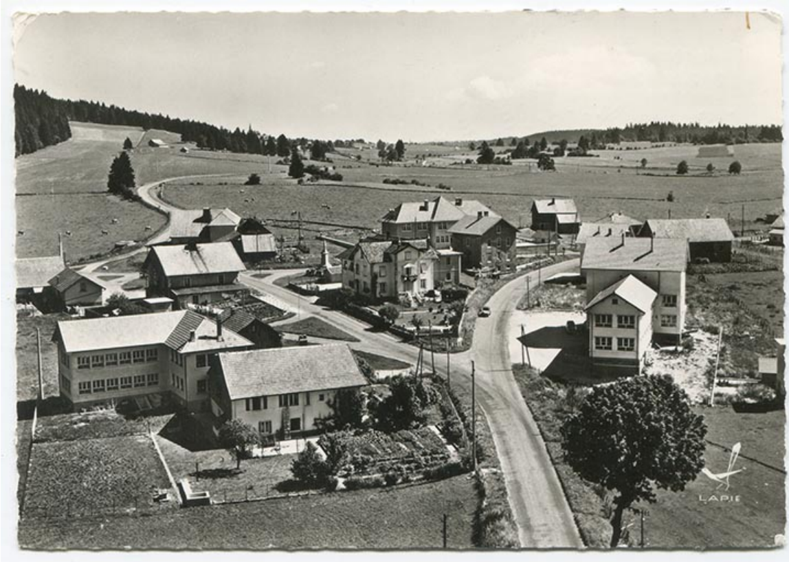
En avion au-dessus de... 2. Bonnétagé (Doubs). Le grand communal, 1951-1952.

25, Bonnétagé, 4 route de Besançon, lieudit : le Grand Communal