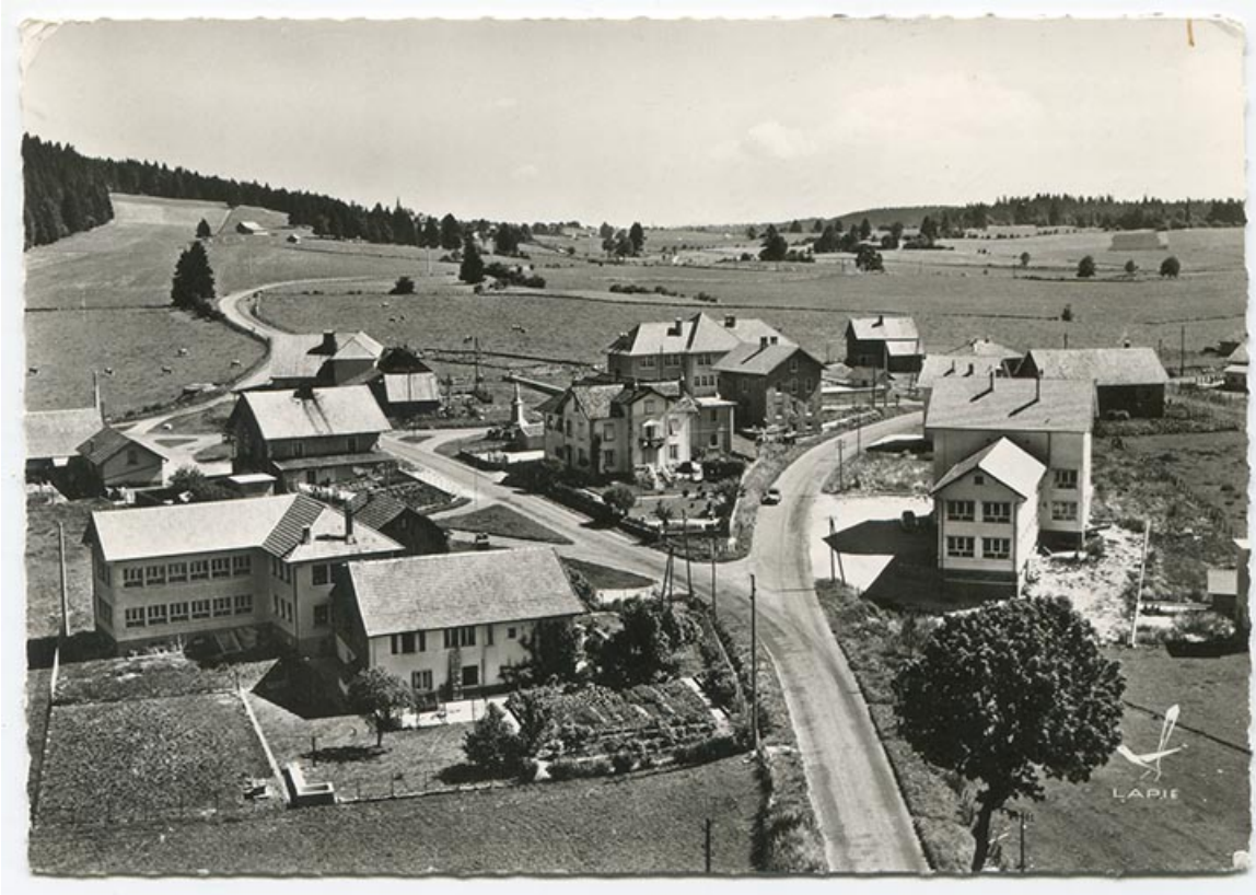
En avion au-dessus de... 2. Bonnétagé (Doubs). Le grand communal, 1951-1952. 25, Bonnétagé, 8-10 route de Besançon, lieudit : le Grand Communal