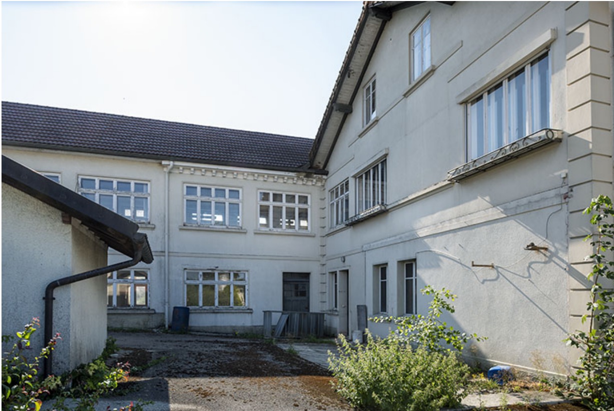
Site d'origine : façades antérieure de l'usine et latérale gauche de la maison.

25, Bonnetage, 5 route de Besançon, lieudit : le Grand Communal