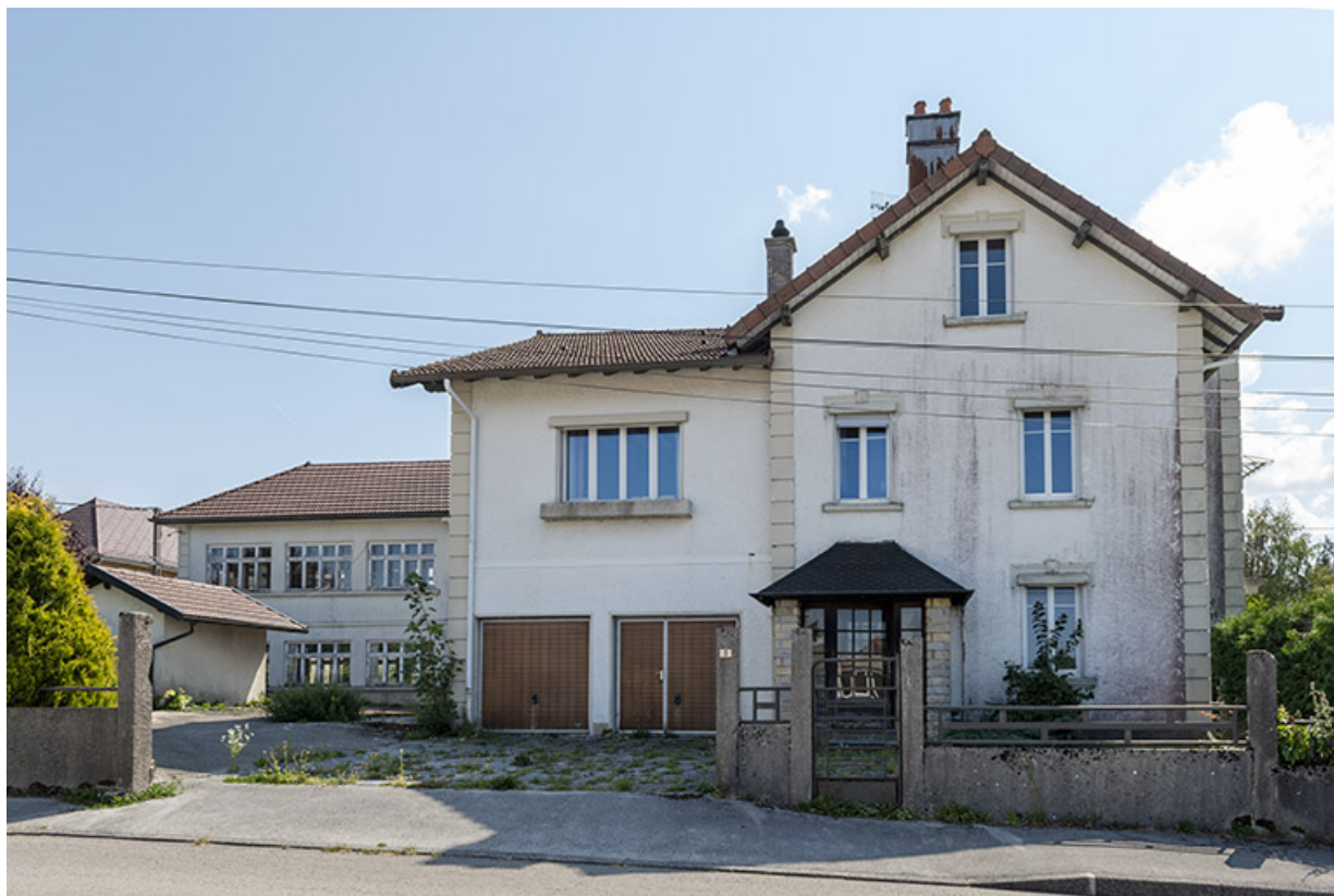
Site d'origine : façade antérieure de l'usine et de la maison.

25, Bonnétagé, 5 route de Besançon, lieudit : le Grand Communal