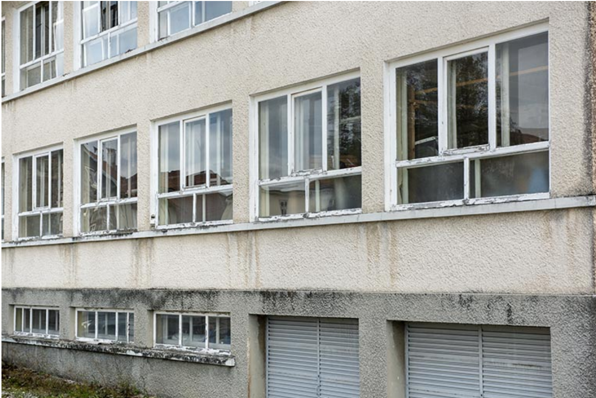
Deuxième usine : baies vers l'extrémité occidentale de la façade antérieure.

25, Bonnétagé, 5 route de Besançon, lieudit : le Grand Communal