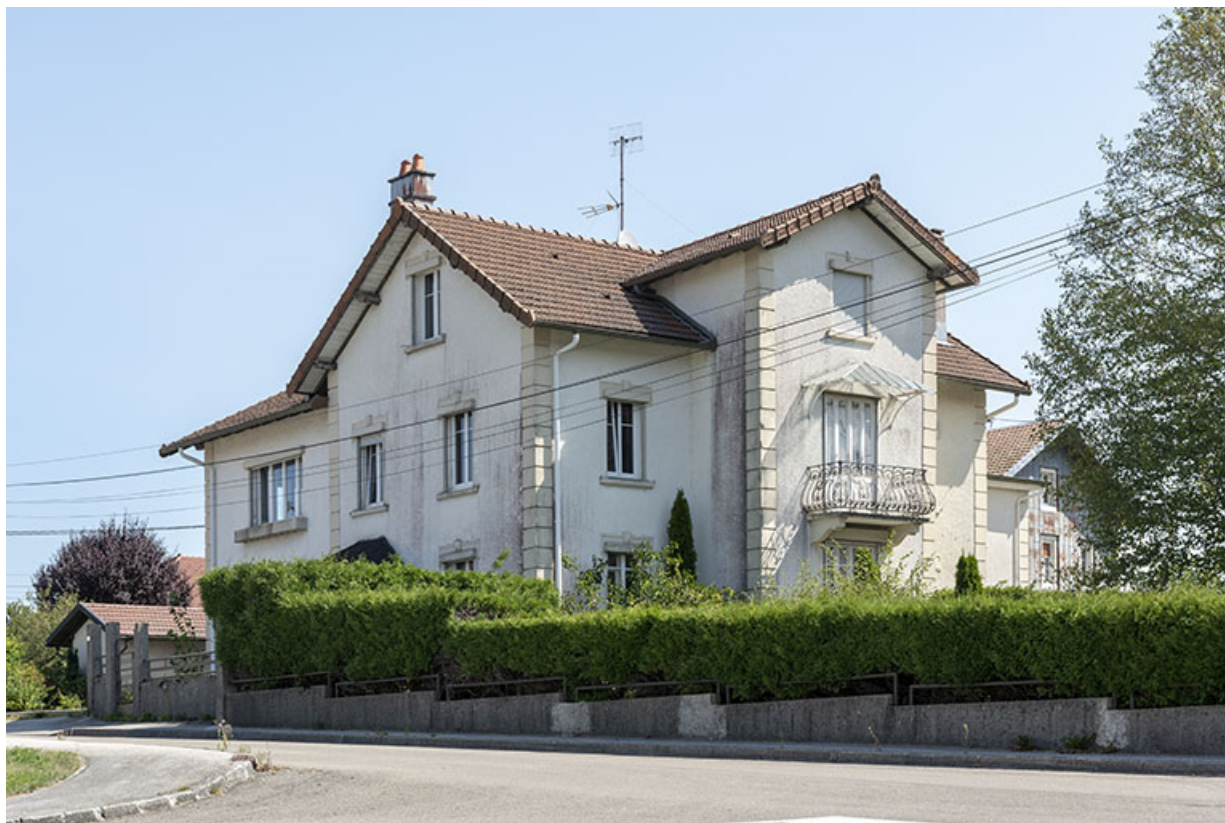
Site d'origine : façades antérieure et latérale droite de la maison.

25, Bonnétagé, 5 route de Besançon, lieudit : le Grand Communal