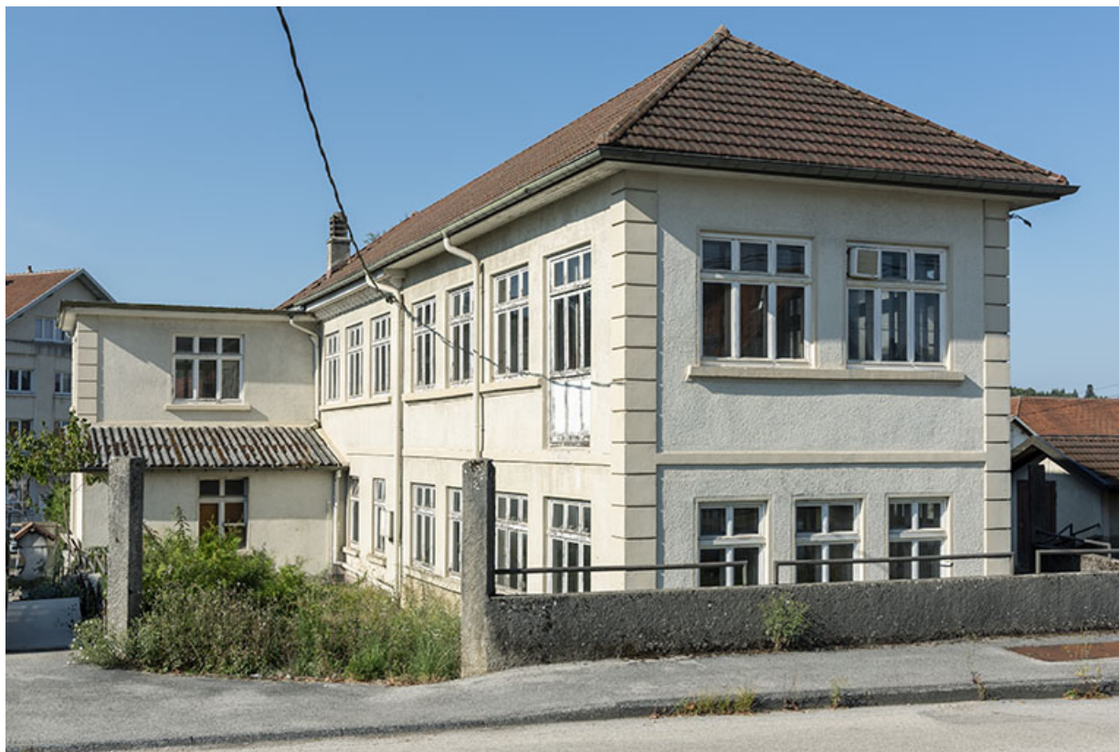
Site d'origine : façades latérale droite et postérieure de l'usine. 25, Bonnétagé, 5 route de Besançon, lieudit : le Grand Communal