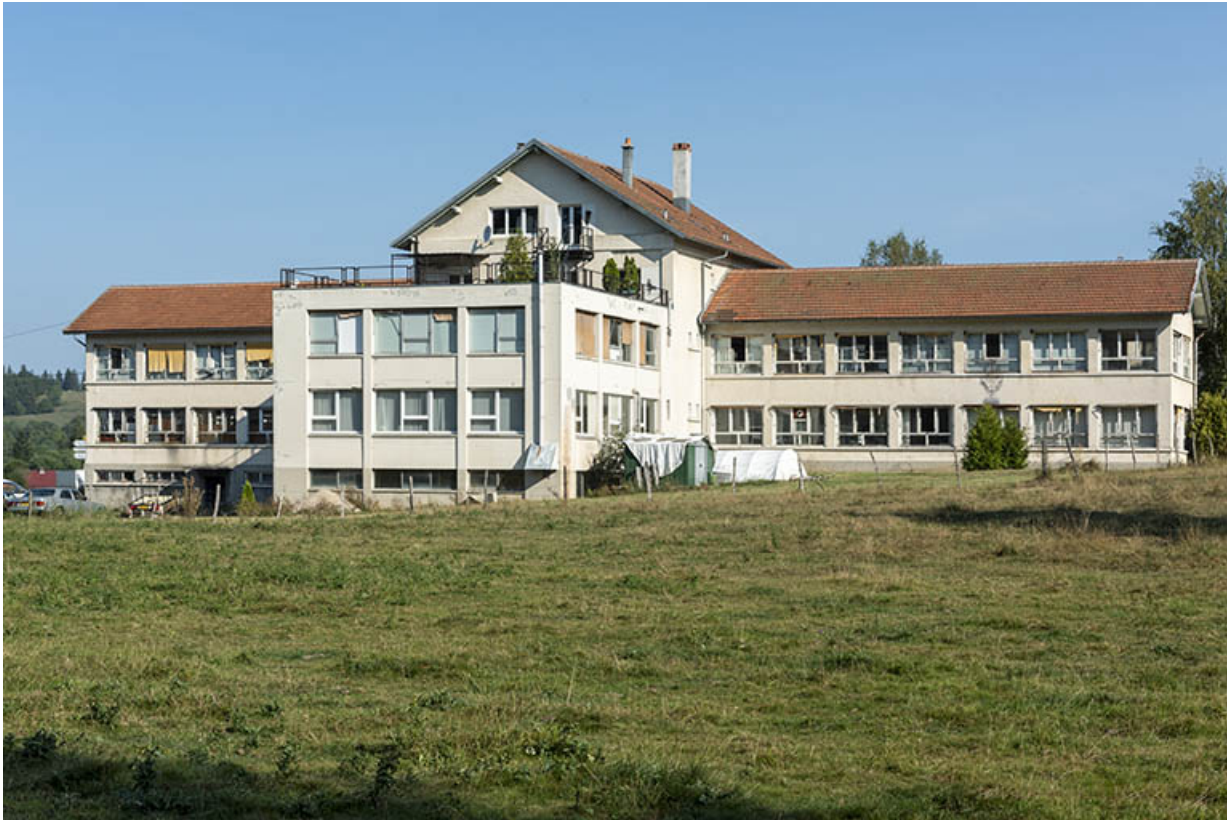
Deuxième usine : façade postérieure, de trois quarts droite.

25, Bonnétagé, 5 route de Besançon, lieudit : le Grand Communal