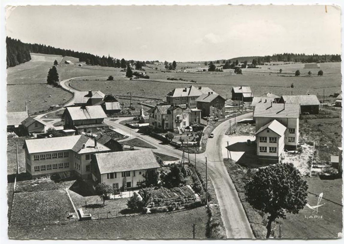
En avion au-dessus de... 2. Bonnétagé (Doubs). Le grand communal, 1951-1952.

25, Bonnétagé, 4 route de Besançon, lieudit : le Grand Communal