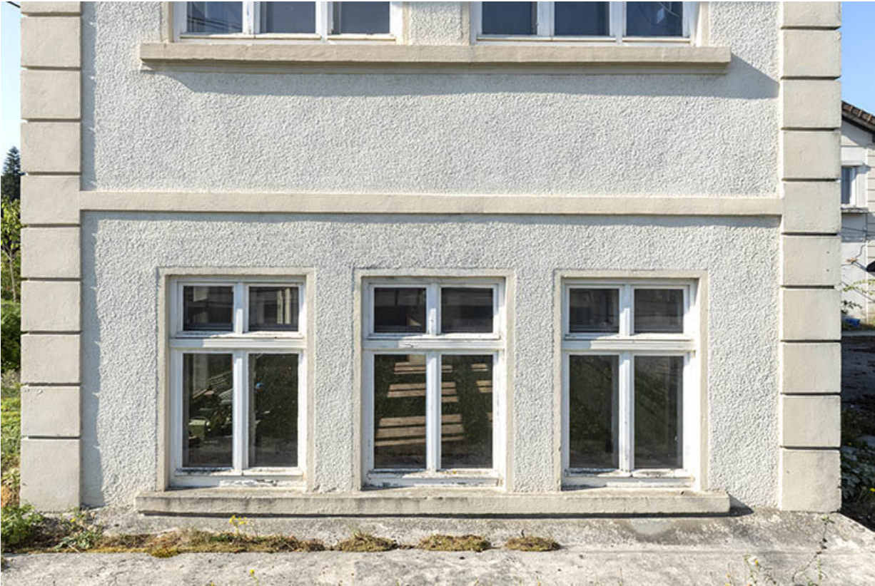
Site d'origine : fenêtres au rez-de-chaussée sur la façade latérale droite de l'usine.

25, Bonnétagé, 5 route de Besançon, lieudit : le Grand Communal