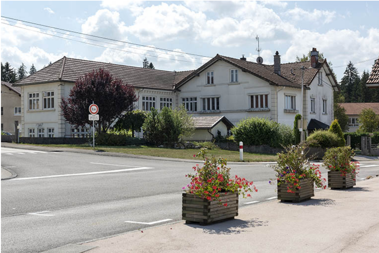
Site d'origine : vue d'ensemble, depuis le nord.

25, Bonnétagé, 5 route de Besançon, lieudit : le Grand Communal