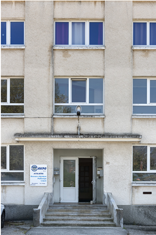
Deuxième usine : travée d'entrée sur la façade antérieure.

25, Bonnétable, 5 route de Besançon, lieudit : le Grand Communal