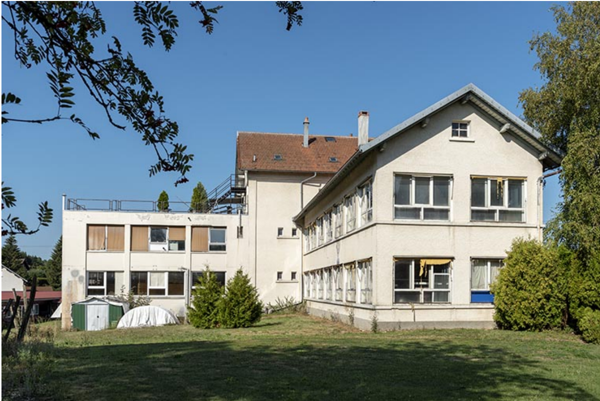
Deuxième usine : façade latérale gauche.

25, Bonnétagé, 5 route de Besançon, lieudit : le Grand Communal