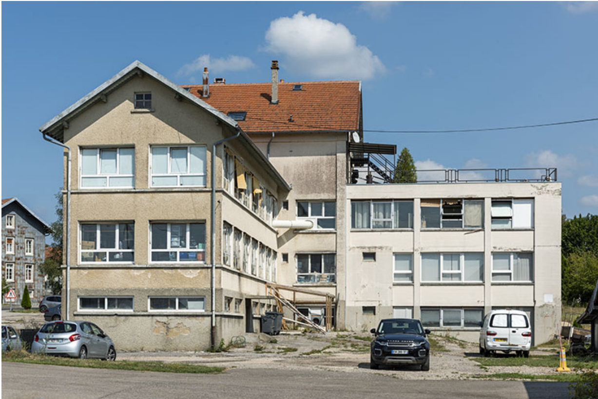
Deuxième usine : façade latérale droite.

25, Bonnétagé, 5 route de Besançon, lieudit : le Grand Communal