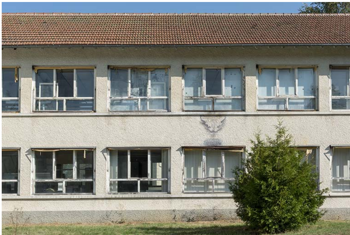
Deuxième usine : baies vers l'extrémité orientale de la façade antérieure.

25, Bonnetage, 5 route de Besançon, lieudit : le Grand Communal