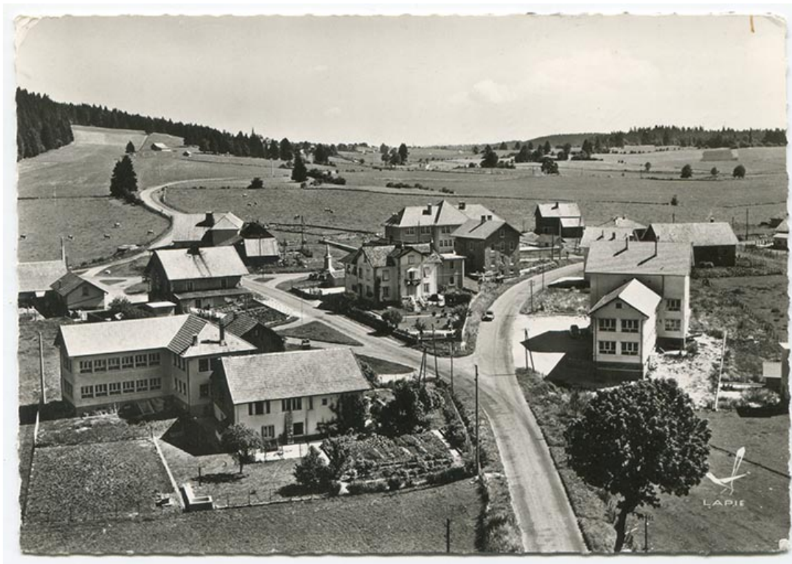
En avion au-dessus de... 2. Bonnétagé (Doubs). Le grand communal, 1951-1952. 25, Bonnétagé, 8-10 route de Besançon, lieudit : le Grand Communal