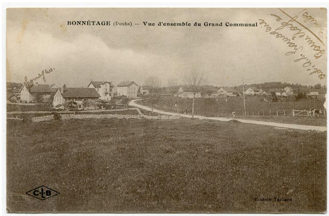
Bonnétagé (Doubs) - Vue d'ensemble du Grand Communal, 1er quart 20e siècle [entre 1914 et 1920].

25, Bonnétagé, 8-10 route de Besançon, lieudit : le Grand Communal