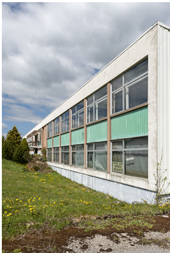
Façade antérieure, vue en enfilade.

25, Le Russey, 67 avenue de Lattre de Tassigny