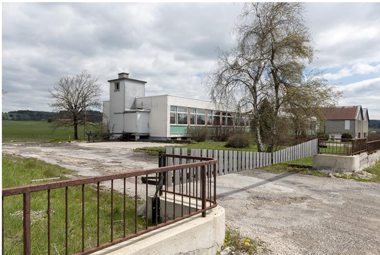
Vue d'ensemble depuis le nord (façades antérieure et latérale gauche).

25, Le Russey, 67 avenue de Lattre de Tassigny