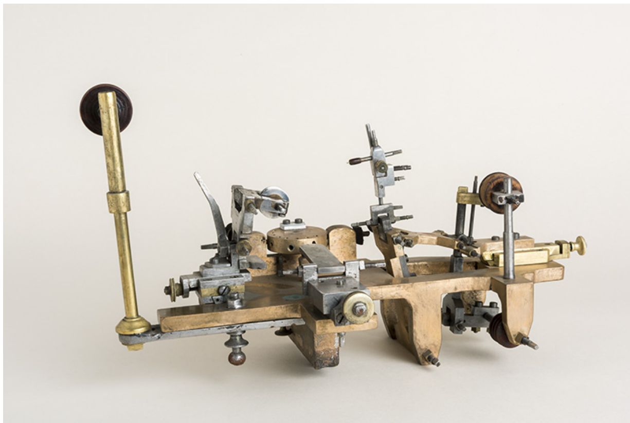
Machine à "passer les levées".

25, Le Russey, 64 avenue de Lattre de Tassigny