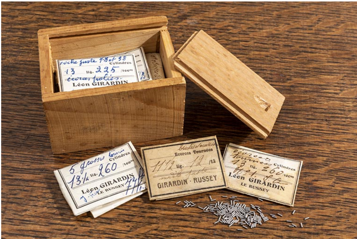
Boîte pour expédition d'écorces de cylindres et de cylindres.