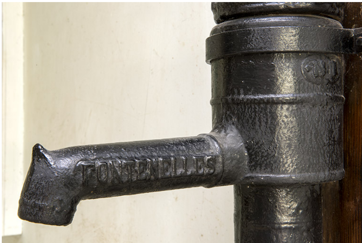
Intérieur : inscription sur la pompe Renaud. 25, Le Russey, 64 avenue de Lattre de Tassigny