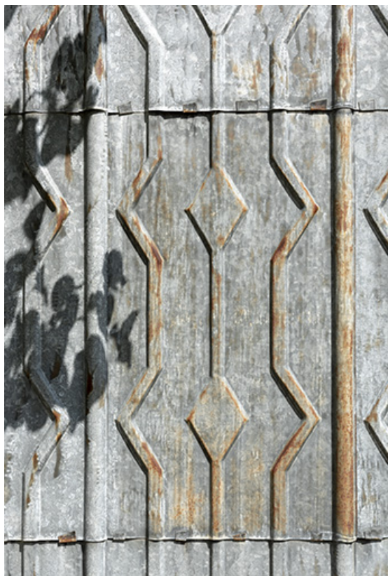
Façade latérale gauche : détail de l'essentage métallique.

25, Le Russey, 64 avenue de Lattre de Tassigny