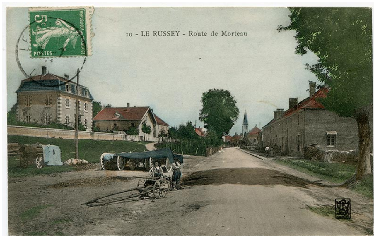
10 - Le Russey - Route de Morteau, 1er quart 20e siècle [entre 1904 et 1909]. La maison est la deuxième à gauche. Les fenêtres multiples ne sont pas encore percées à l'étage de la façade latérale gauche.

25, Le Russey, 64 avenue de Lattre de Tassigny