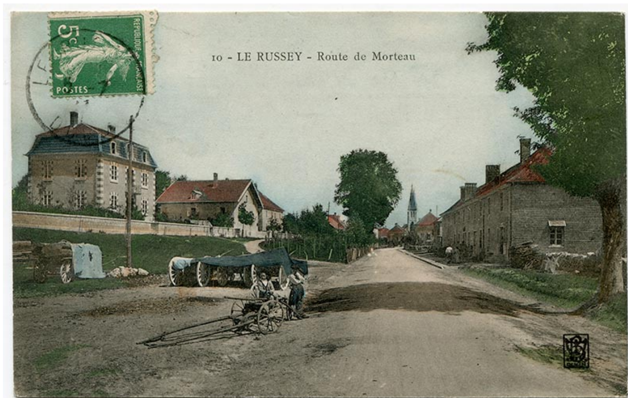
10 - Le Russey - Route de Morteau, 1er quart 20e siècle [entre 1904 et 1909]. La maison est la deuxième à gauche. Les fenêtres multiples ne sont pas encore percées à l'étage de la façade latérale gauche.

25, Le Russey, 64 avenue de Lattre de Tassigny