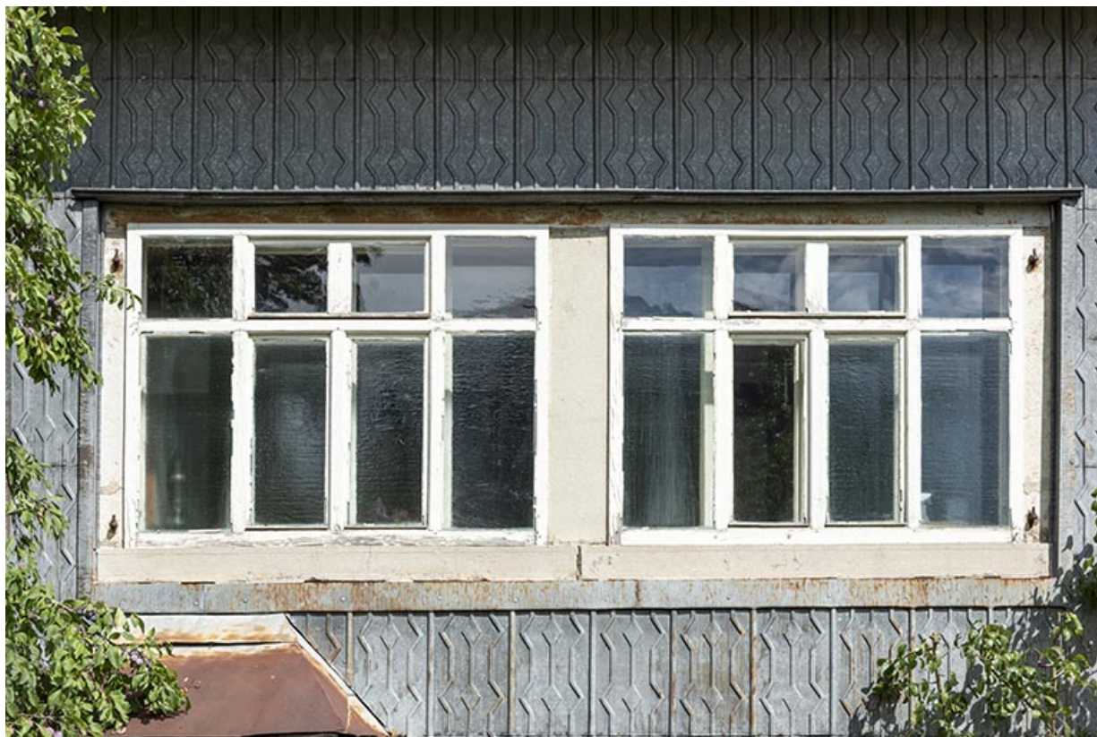
Façade latérale gauche : fenêtres de l'atelier. 25, Le Russey, 64 avenue de Lattre de Tassigny