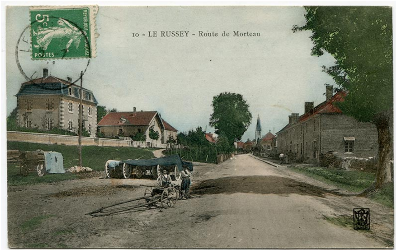
10 - Le Russey - Route de Morteau, 1er quart 20e siècle [entre 1904 et 1909]. La maison est la deuxième à gauche. Les fenêtres multiples ne sont pas encore percées à l'étage de la façade latérale gauche.

25, Le Russey, 64 avenue de Lattre de Tassigny