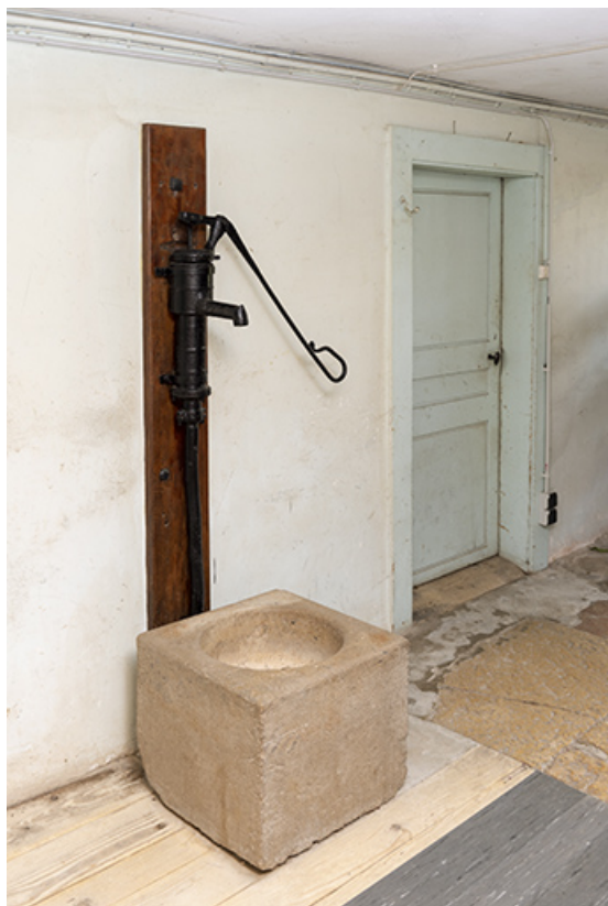
Intérieur : pompe manuelle Renaud, des Fontenelles. 25, Le Russey, 64 avenue de Lattre de Tassigny