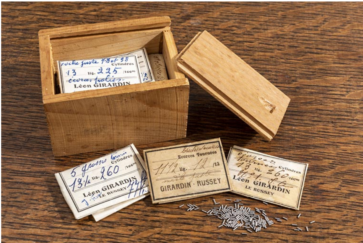
Boîte pour expédition d'écorces de cylindres et de cylindres.