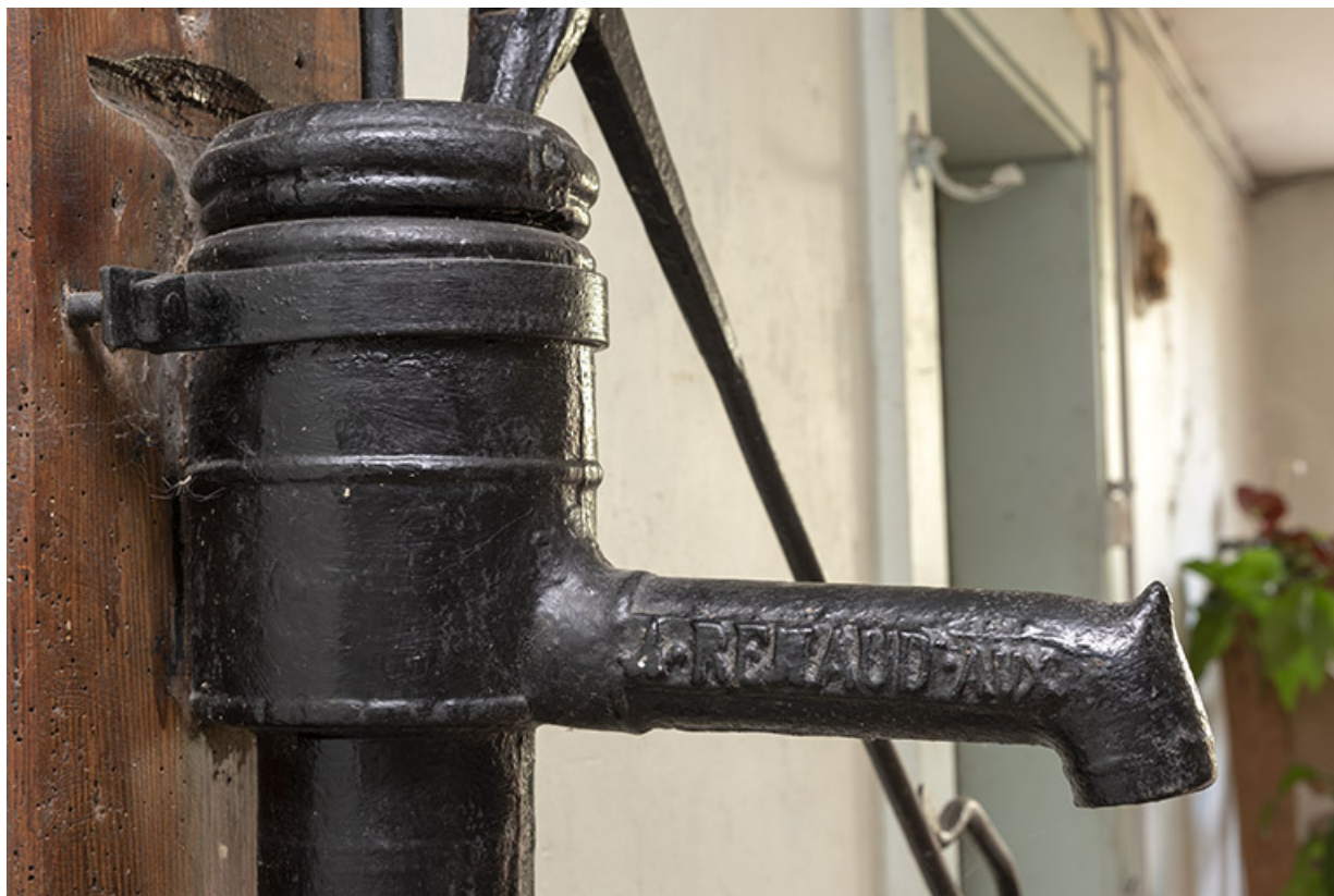
Intérieur : inscription sur la pompe Renaud. 25, Le Russey, 64 avenue de Lattre de Tassigny