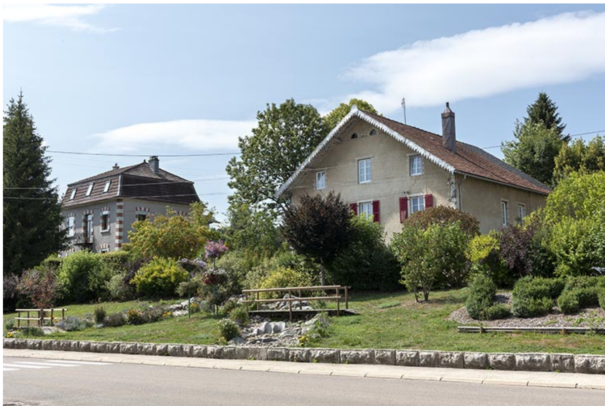
Vue d'ensemble, depuis le nord-est.

25, Le Russey, 64 avenue de Lattre de Tassigny