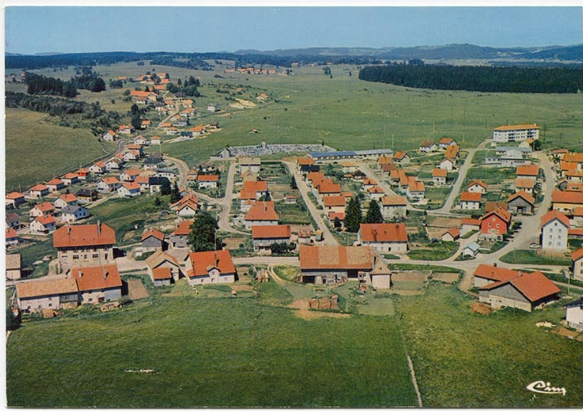
Le Russey (Doubs) - Vue aérienne [lotissements à l'est du village], 4e quart 20e siècle. 25, Le Russey, 15 rue des Trois Sapins