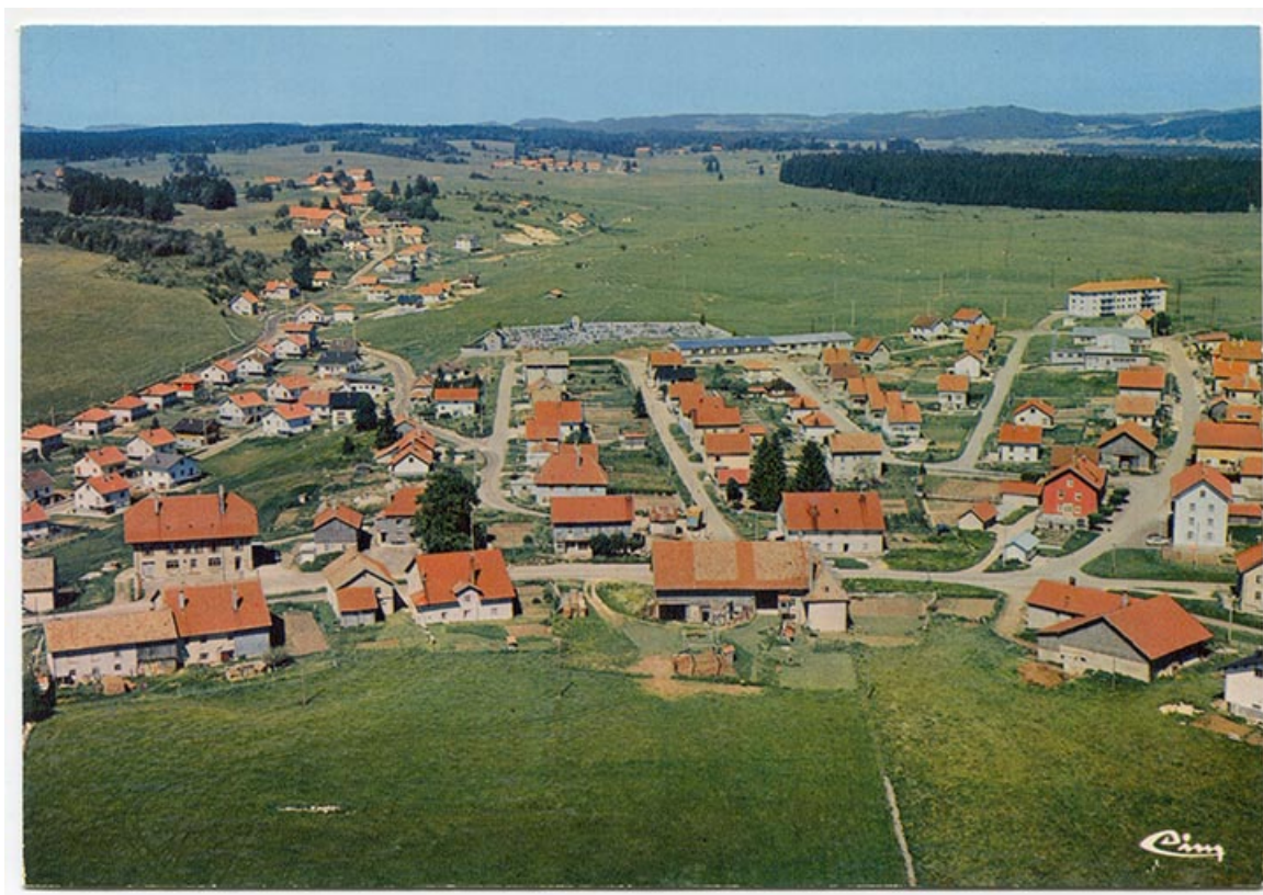
Le Russey (Doubs) - Vue aérienne [lotissements à l'est du village], 4e quart 20e siècle. 25, Le Russey, 15 rue des Trois Sapins