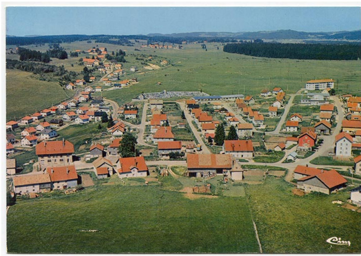
Le Russey (Doubs) - Vue aérienne [lotissements à l'est du village], 4e quart 20e siècle. 25, Le Russey, 15 rue des Trois Sapins