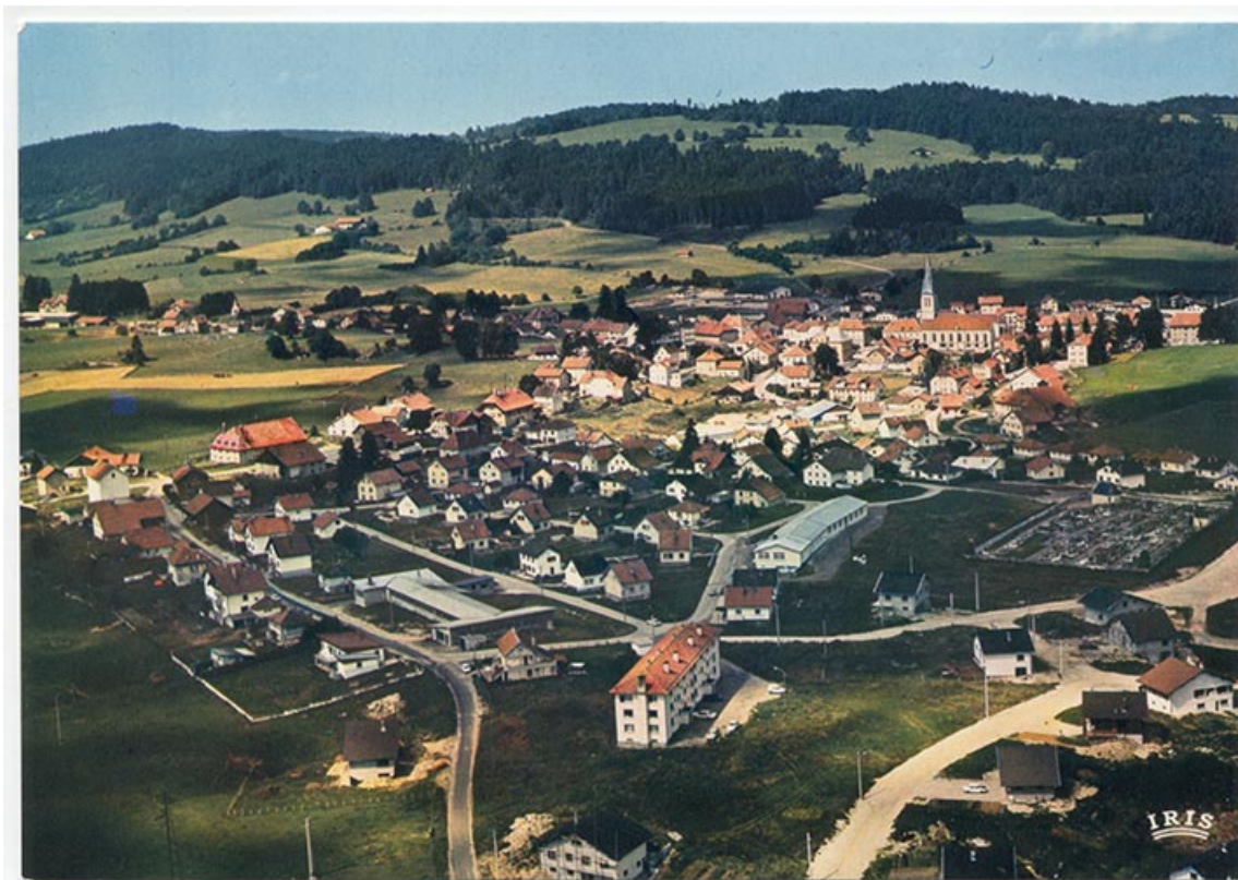
Le Russey (Doubs). Vue générale [vue aérienne des lotissements et du village depuis l'est], 4e quart 20e siècle. 25, Le Russey, 1 et 5 rue des Usines