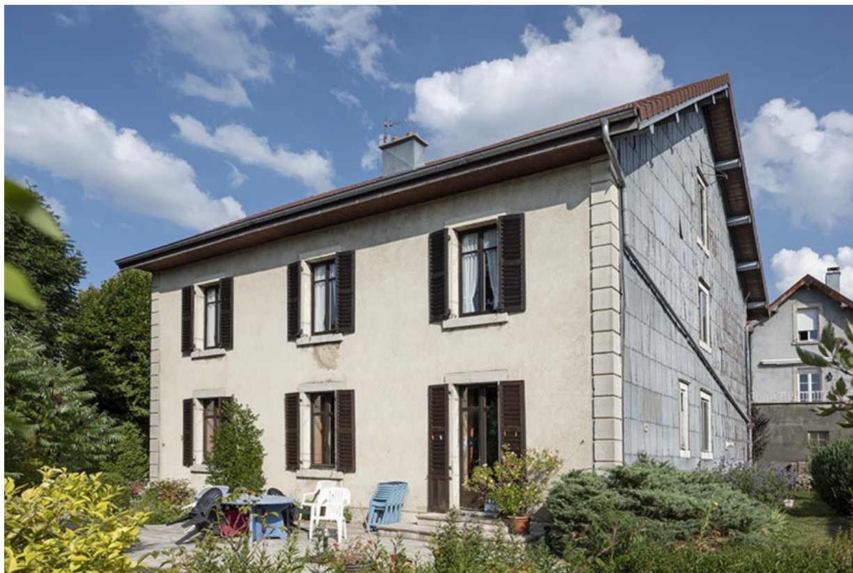
Maison : façade postérieure, de trois quarts droite.