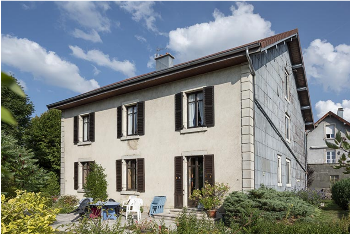
Maison : façade postérieure, de trois quarts droite.