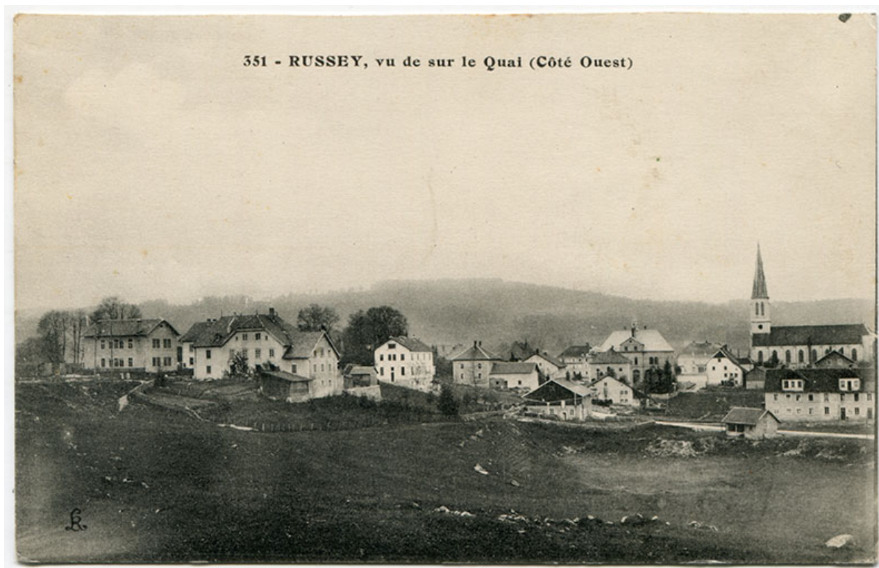
351 - Russey, vu sur le Quai (côté ouest), 1er quart 20e siècle [après 1911]. L'ateier est visible à gauche. 25, Le Russey, 5 rue Leclerc

351 - Russey, vu sur le Quai (côté ouest), carte postale, s.n., s.d. [1er quart 20e siècle, après 1911], L. R. éd. 1911 : usine Maillot et Mougin bâtie.