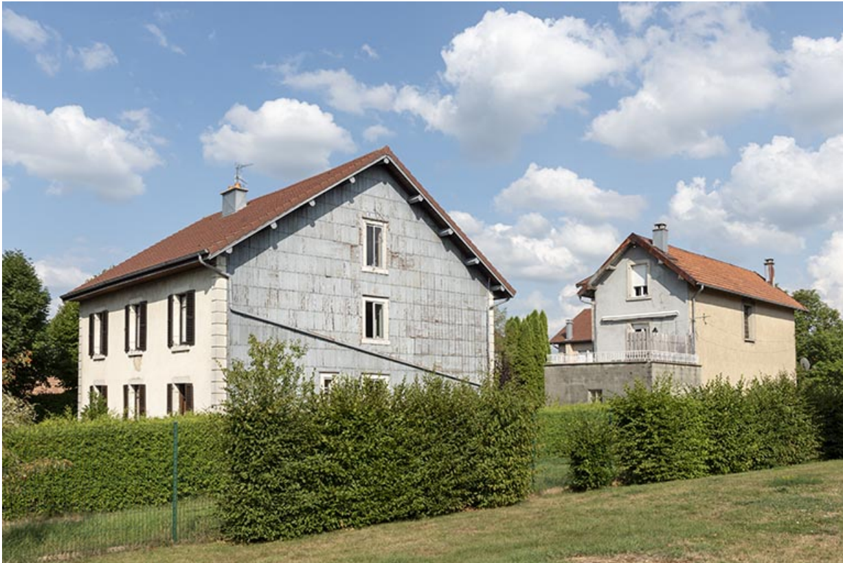
Maison et logement de contremaître, depuis le sud-ouest.