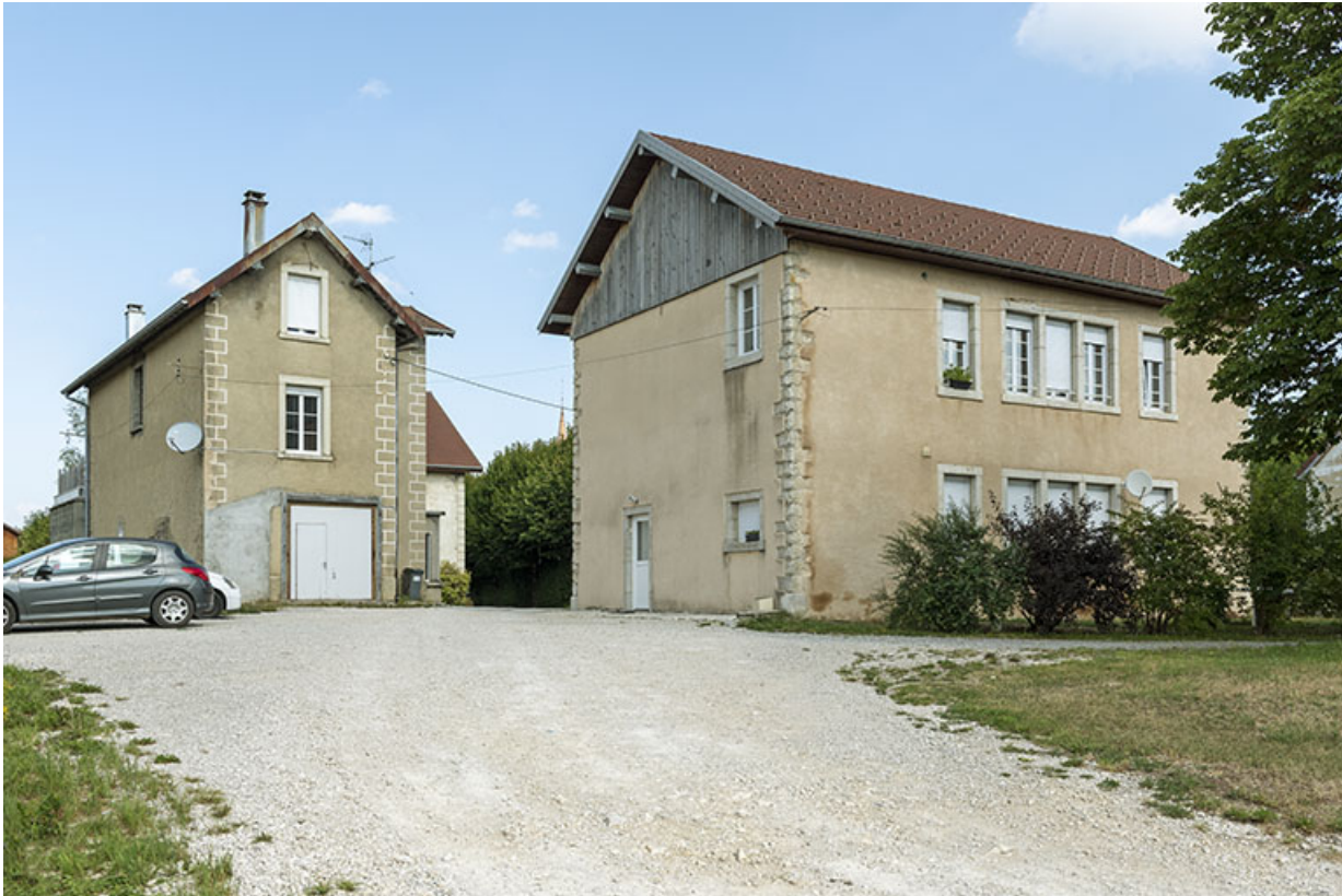
Logement de contremaître (à gauche) et atelier de fabrication.