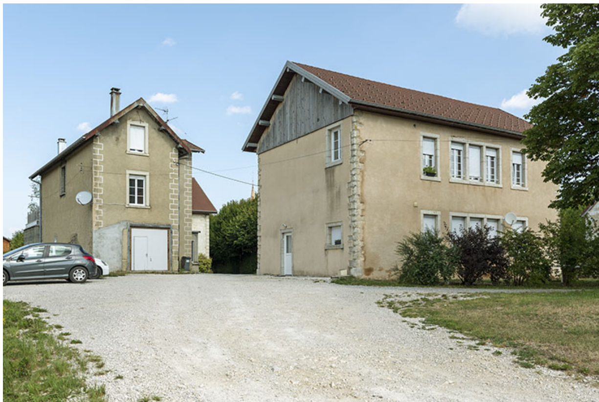
Logement de contremaître (à gauche) et atelier de fabrication. 25, Le Russey, 8-12 rue Leclerc