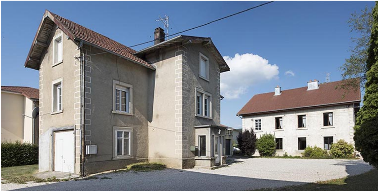
Logement de contremaître et maison, depuis l'est.