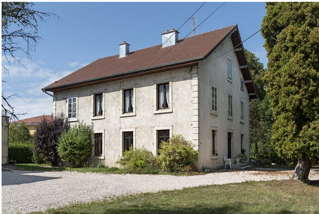
Maison : façade antérieure, de trois quarts droite.