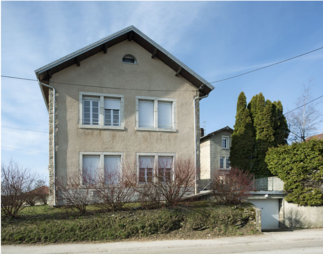
Atelier de fabrication : façade nord.