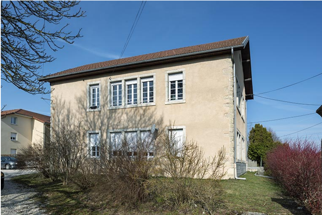
Atelier de fabrication : façade est.