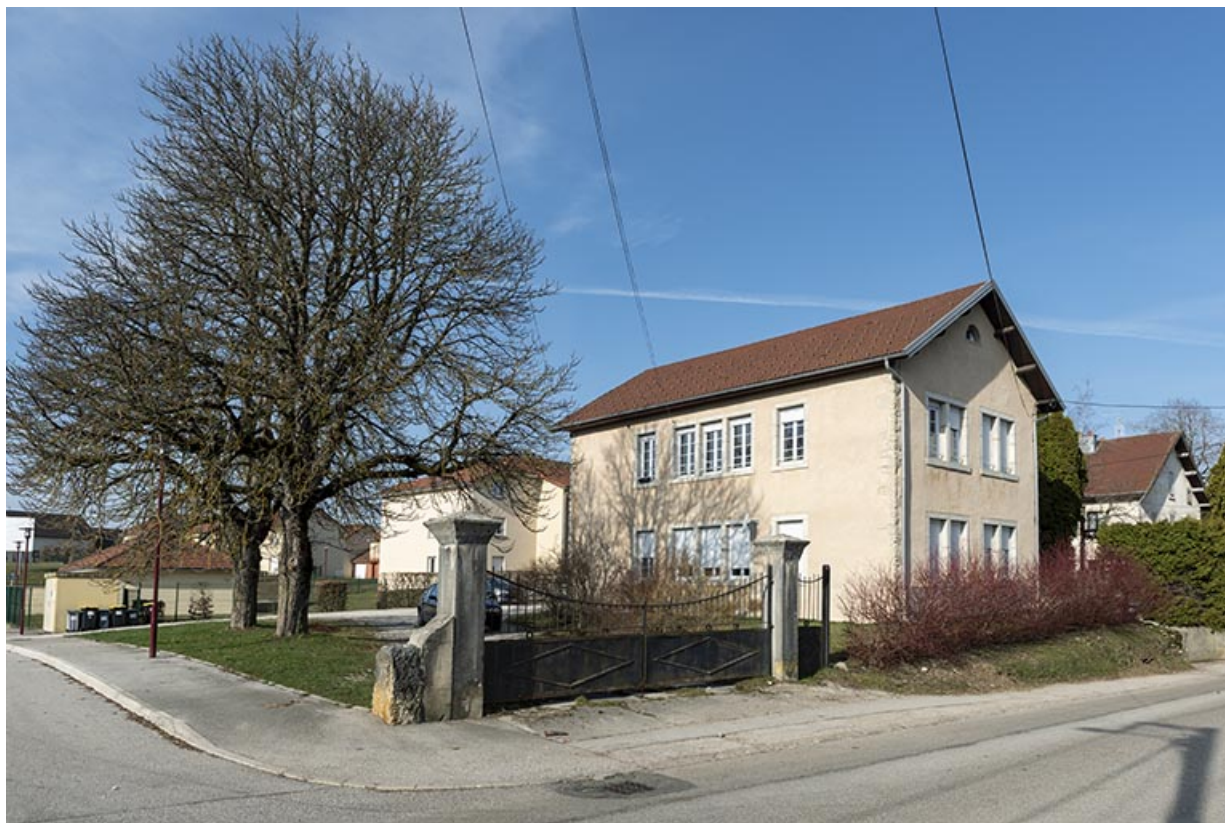
Vue d'ensemble, depuis l'est.