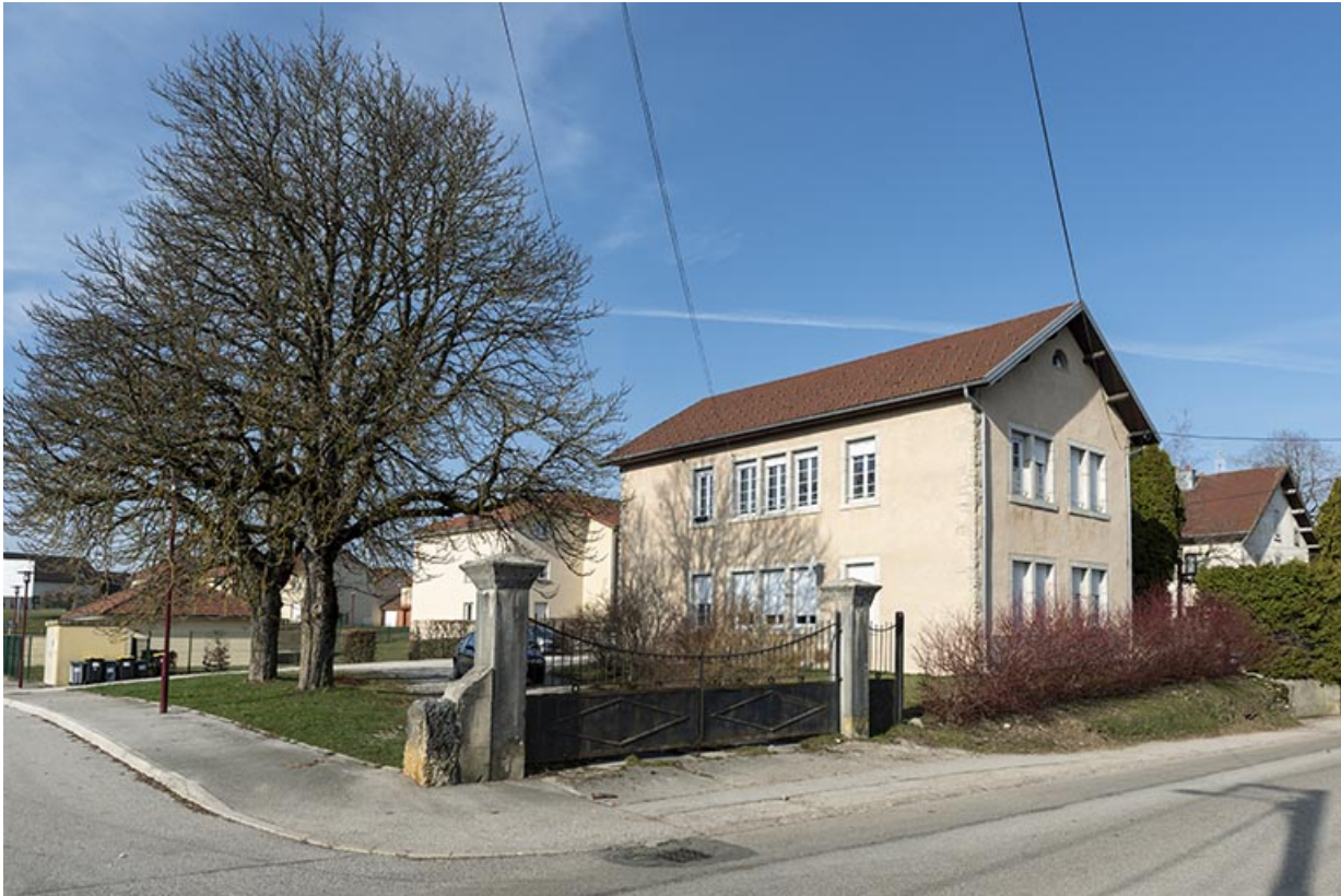
Vue d'ensemble, depuis l'est.