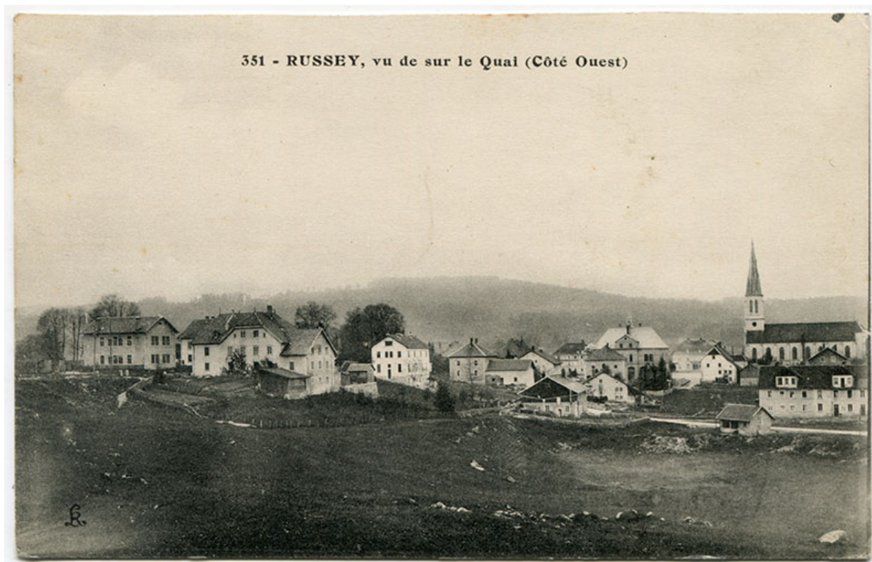
351 - Russey, vu sur le Quai (côté ouest), 1er quart 20e siècle [après 1911]. L'ateier est visible à gauche. 25, Le Russey, 5 rue Leclerc