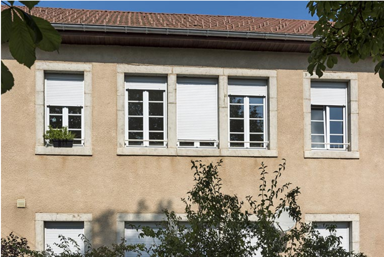
Atelier de fabrication, façade est : fenêtres multiples.