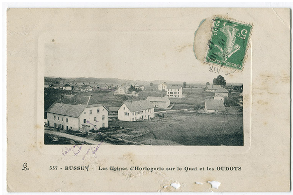
357 - Russey - Les usines d'horlogerie sur le Quai et les Oudots, 1er quart 20e siècle [entre 1911 et 1919]. 25, Le Russey, 5 rue Leclerc