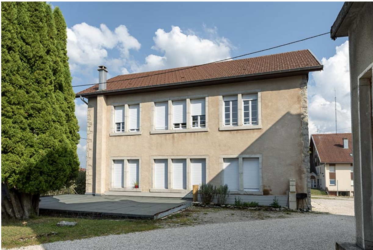
Atelier de fabrication : façade ouest.