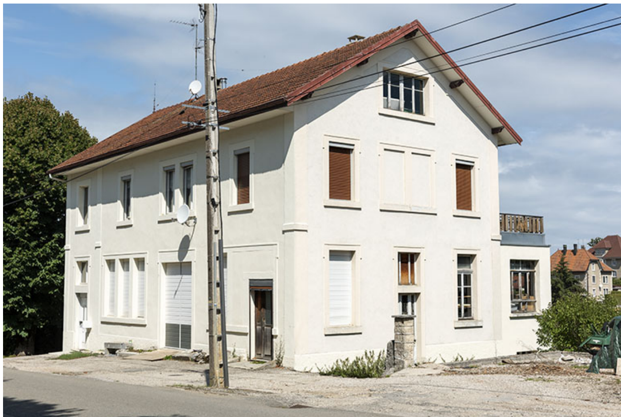
Façades antérieure et latérale droite.