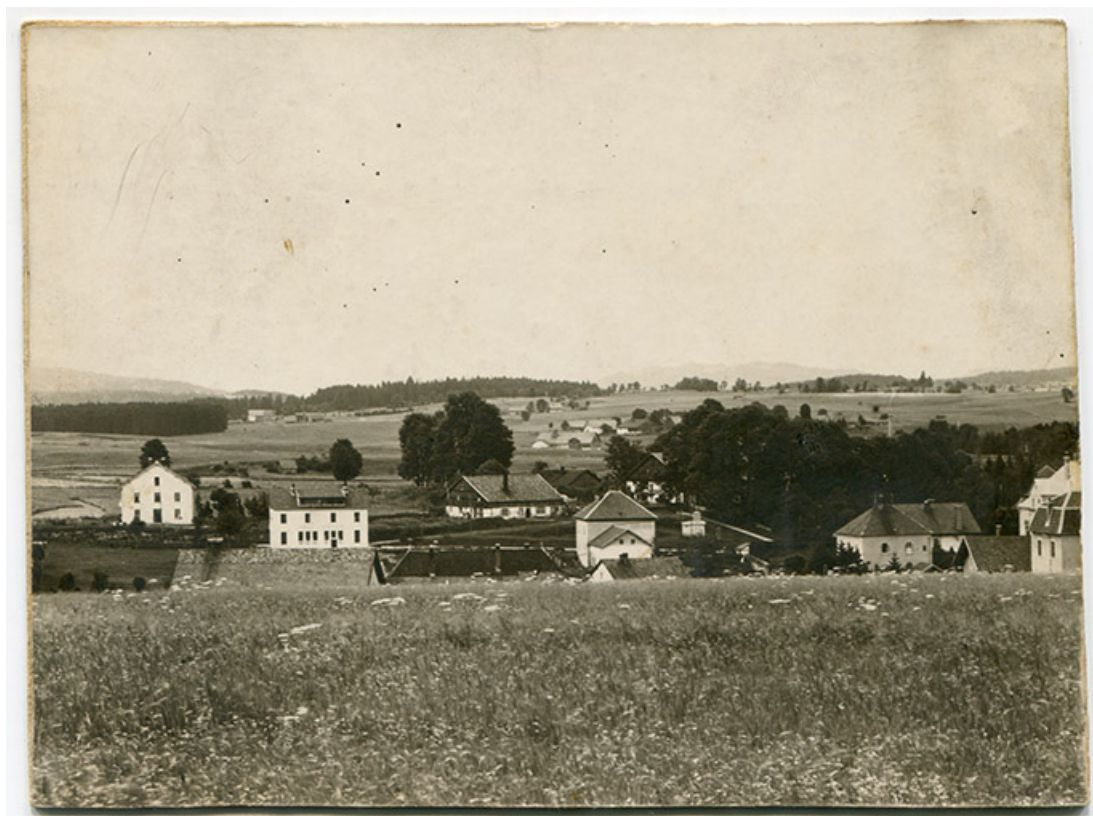
Panorama du Russey pris de Fournot, juillet 1914. La maison est visible à gauche. 25, Le Russey, 5 rue Leclerc