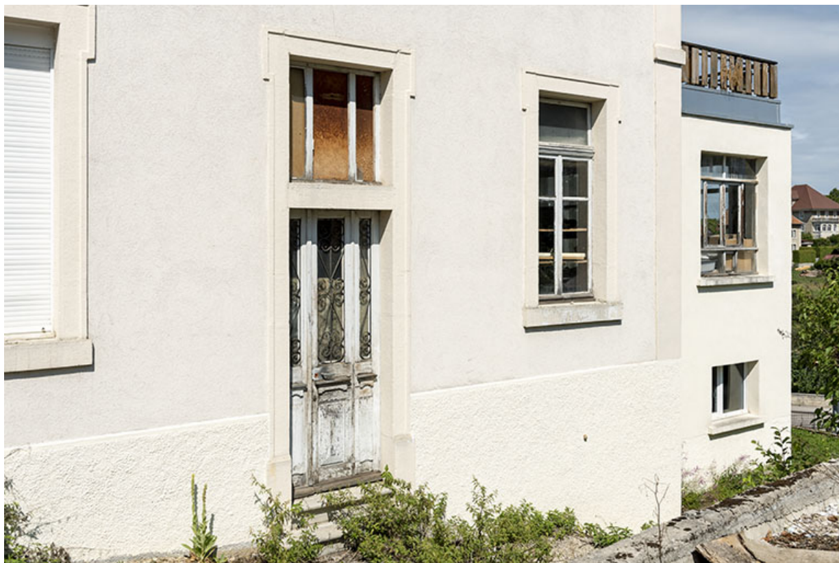
Façade latérale droite : baies du rez-de-chaussée.