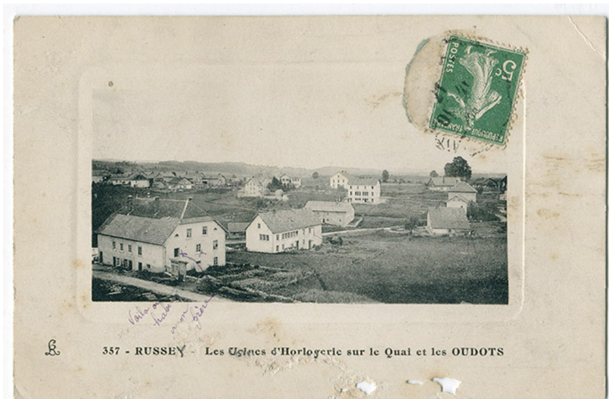
357 - Russey - Les usines d'horlogerie sur le Quai et les Oudots, 1er quart 20e siècle [entre 1911 et 1919]. 25, Le Russey, 5 rue Leclerc