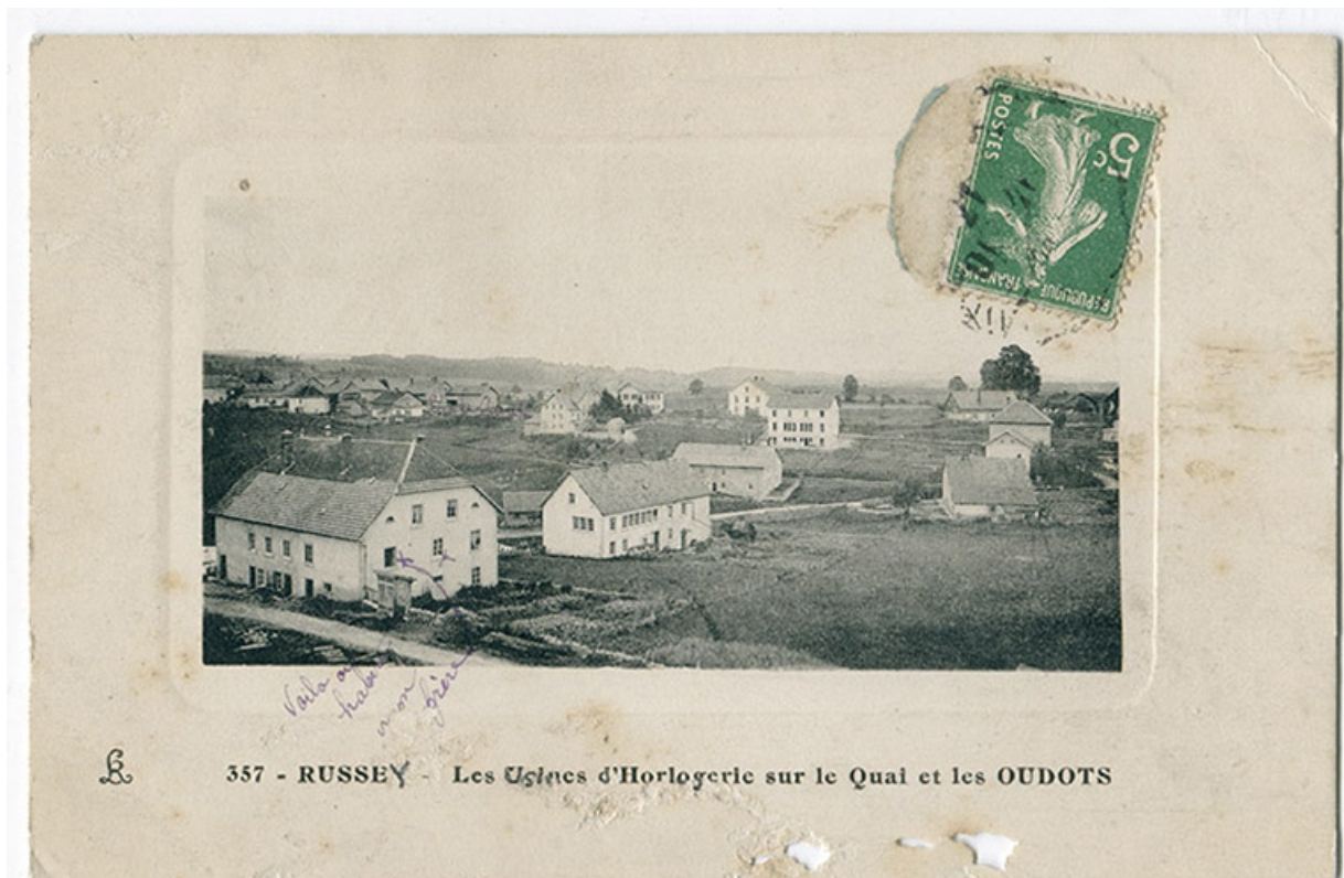
357 - Russey - Les usines d'horlogerie sur le Quai et les Oudots, 1er quart 20e siècle [entre 1911 et 1919]. 25, Le Russey, 5 rue Leclerc