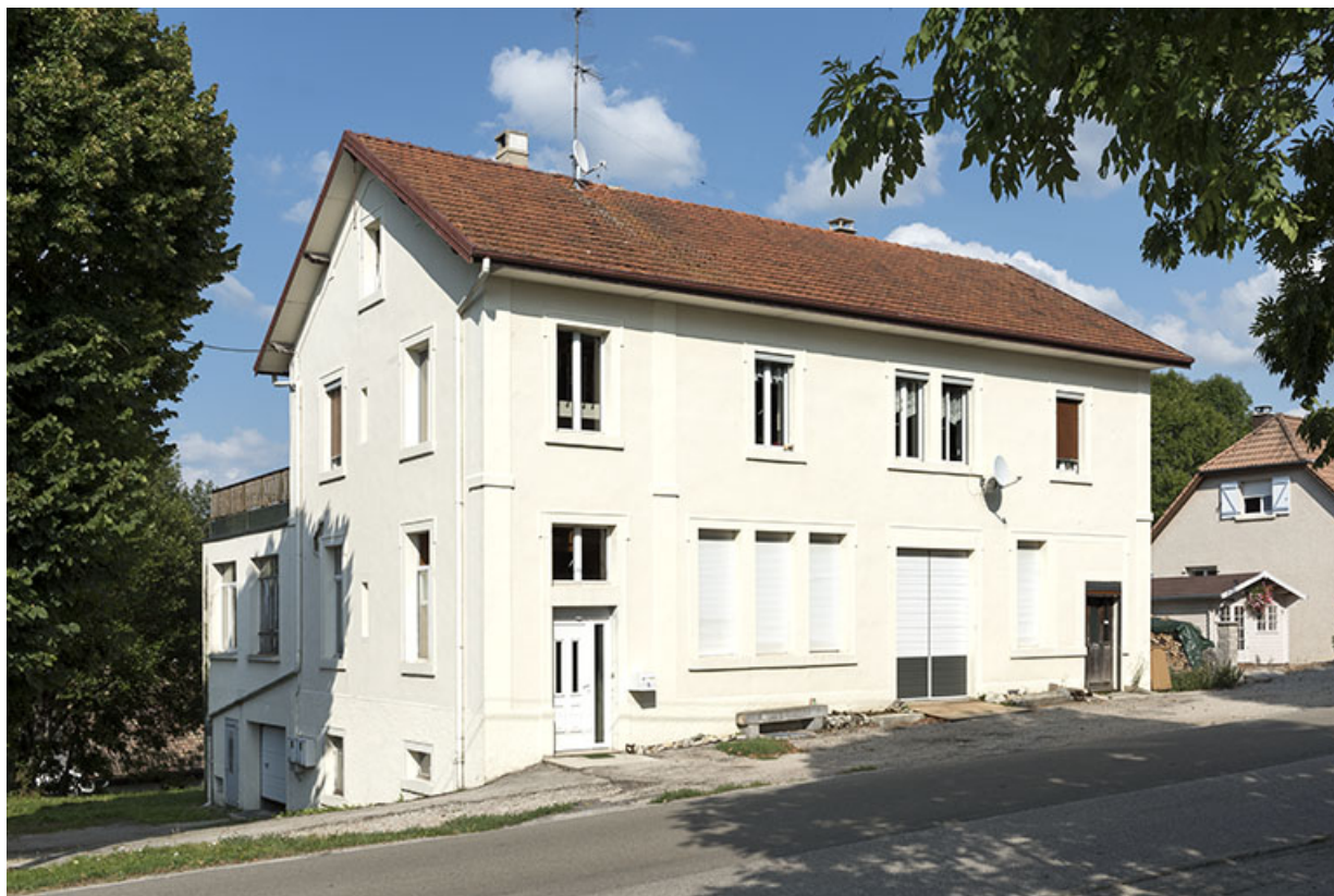
Façades antérieure et latérale gauche.