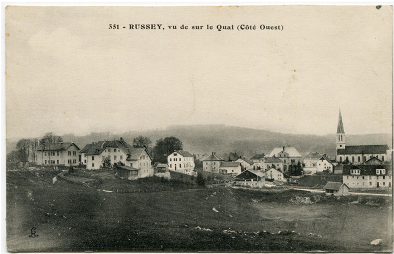
351 - Russey, vu sur le Quai (côté ouest), 1er quart 20e siècle [après 1911]. L'ateier est visible à gauche. 25, Le Russey, 5 rue Leclerc