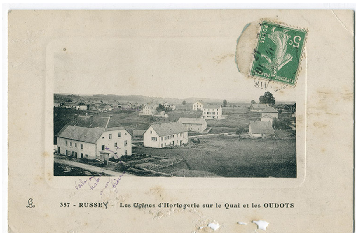
357 - Russey - Les usines d'horlogerie sur le Quai et les Oudots, 1er quart 20e siècle [entre 1911 et 1919]. 25, Le Russey, 5 rue Leclerc