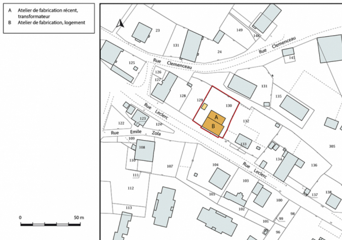
Plan-masse et de situation. Extrait du plan cadastral, 2018, section AP.