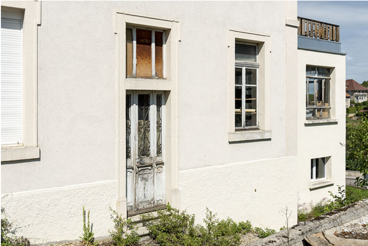
Façade latérale droite : baies du rez-de-chaussée.