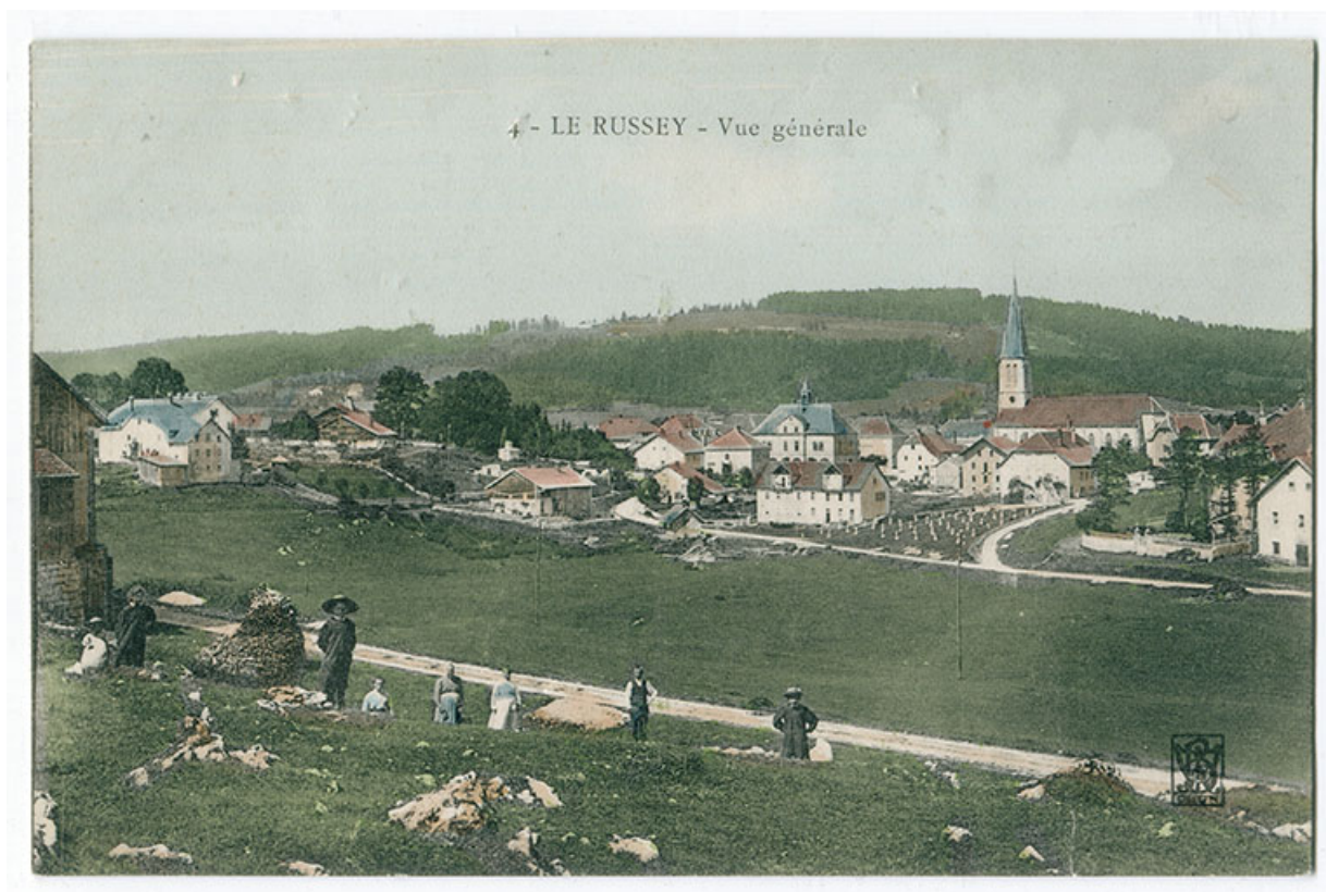
4 - Le Russey - Vue générale [depuis l'est], 1er quart 20e siècle [entre 1904 et 1909]. 25, Le Russey, 5 et 5 bis rue Clemenceau