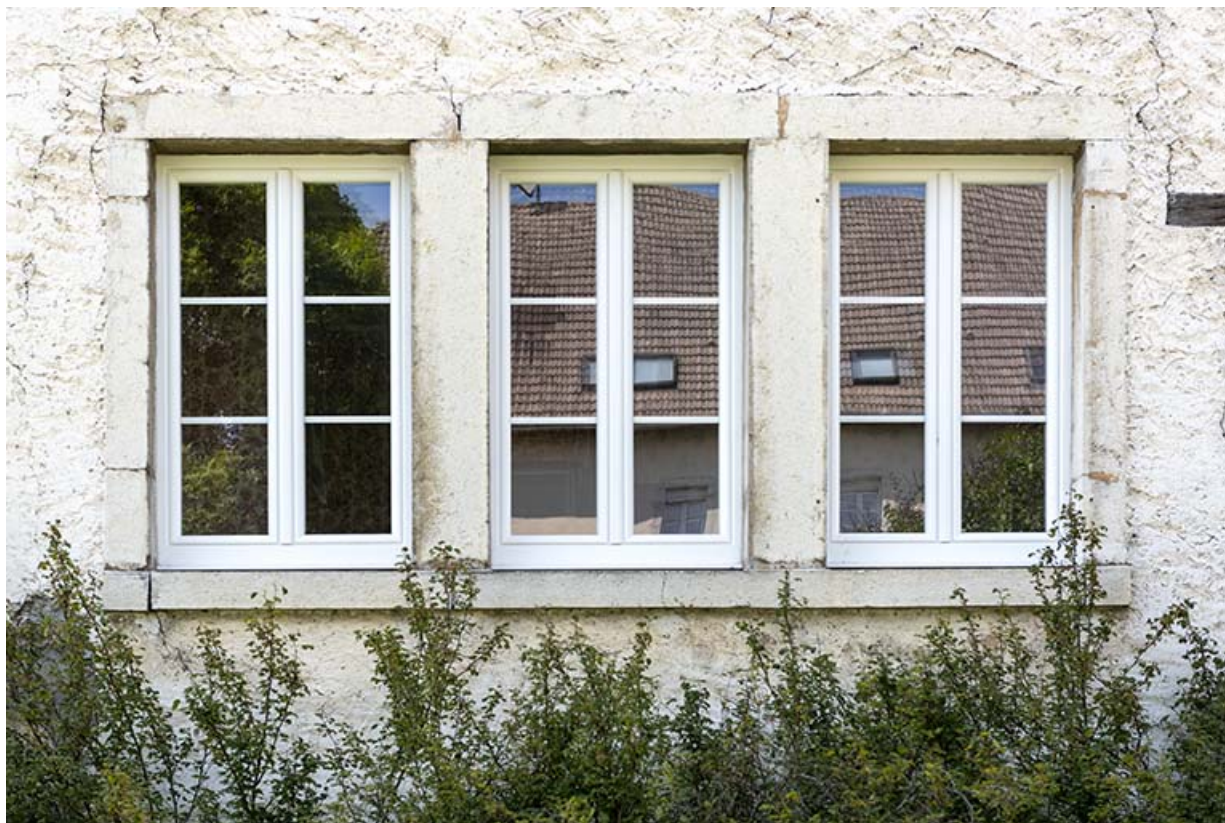
Façade latérale droite : fenêtres multiples.

25, Le Russey, 5 et 5 bis rue Clemenceau