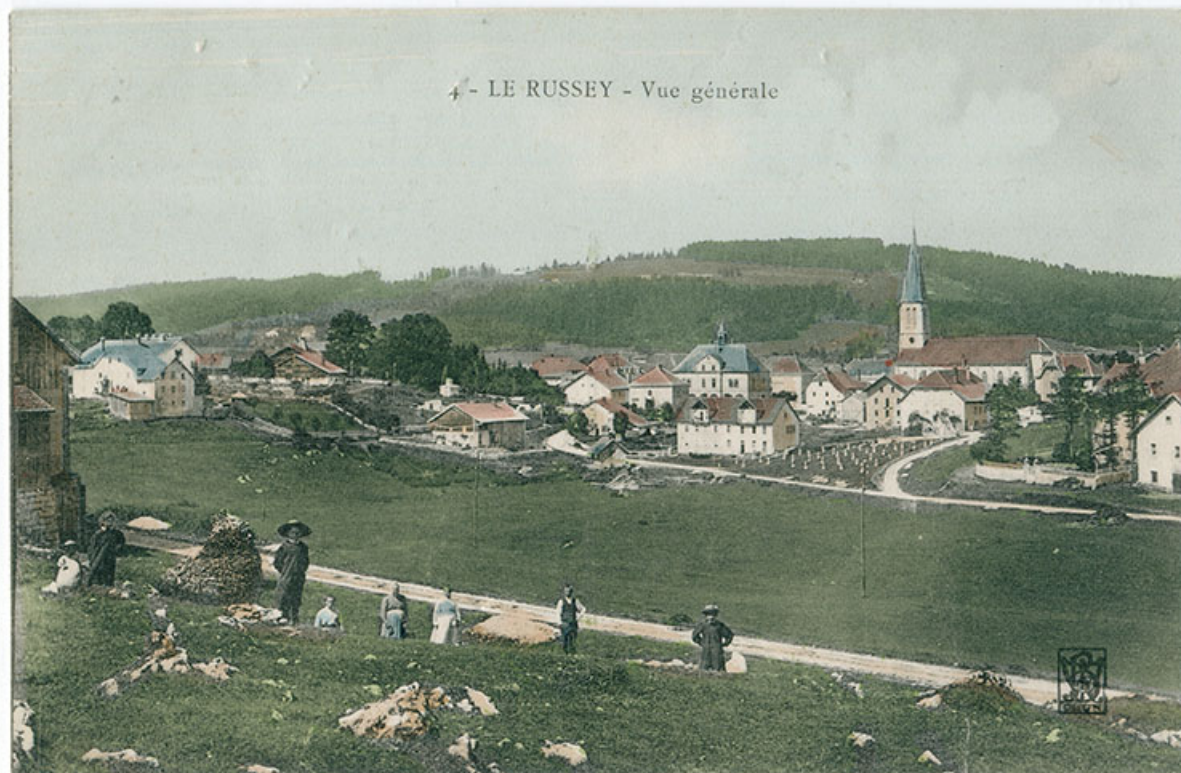
4 - Le Russey - Vue générale [depuis l'est], 1er quart 20e siècle [entre 1904 et 1909]. 25, Le Russey, 5 et 5 bis rue Clemenceau