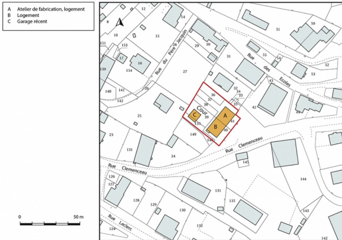
Plan-masse et de situation. Extrait du plan cadastral, 2018, section AM. 25, Le Russey, 5 et 5 bis rue Clemenceau