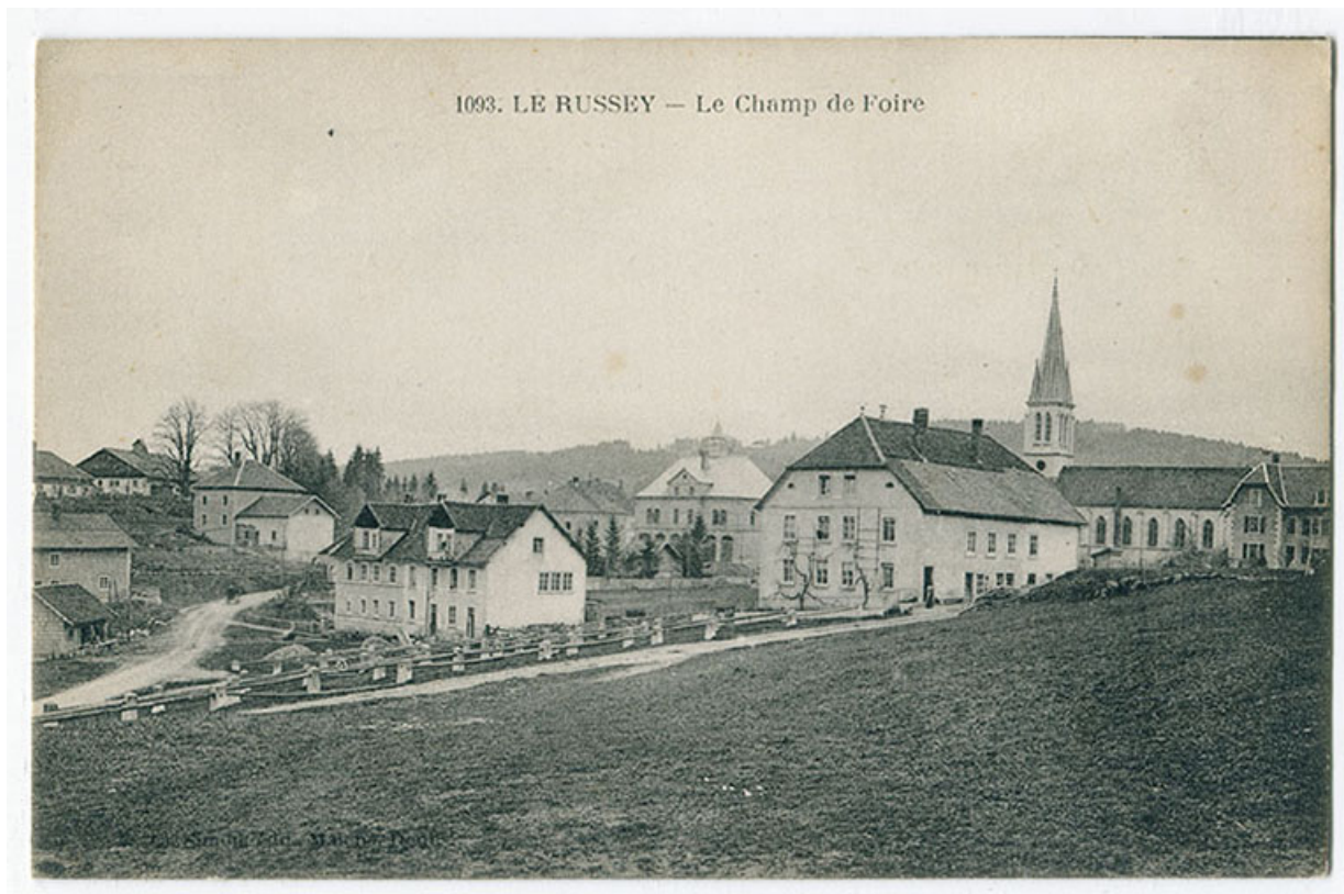
1093. Le Russey - Le champ de foire, 1er quart 20e siècle [avant 1924].

25, Le Russey, 5 et 5 bis rue Clemenceau