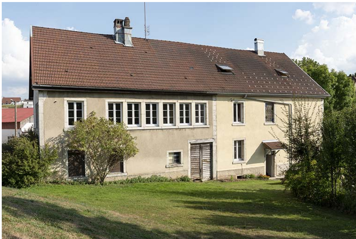
Façade postérieure, de trois quarts gauche.

25, Le Russey, 5 et 5 bis rue Clemenceau