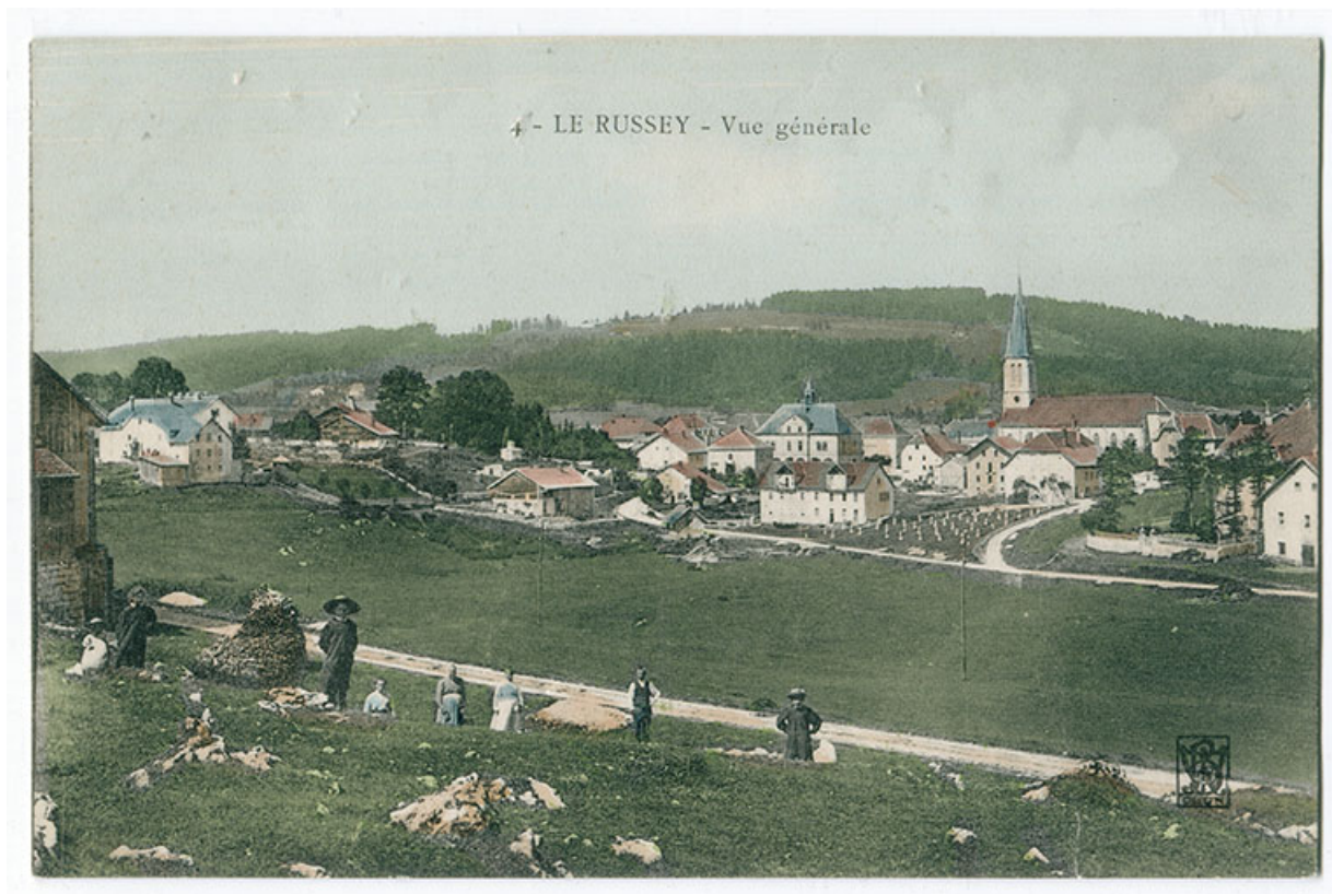
4 - Le Russey - Vue générale [depuis l'est], 1er quart 20e siècle [entre 1904 et 1909]. 25, Le Russey, 5 et 5 bis rue Clemenceau