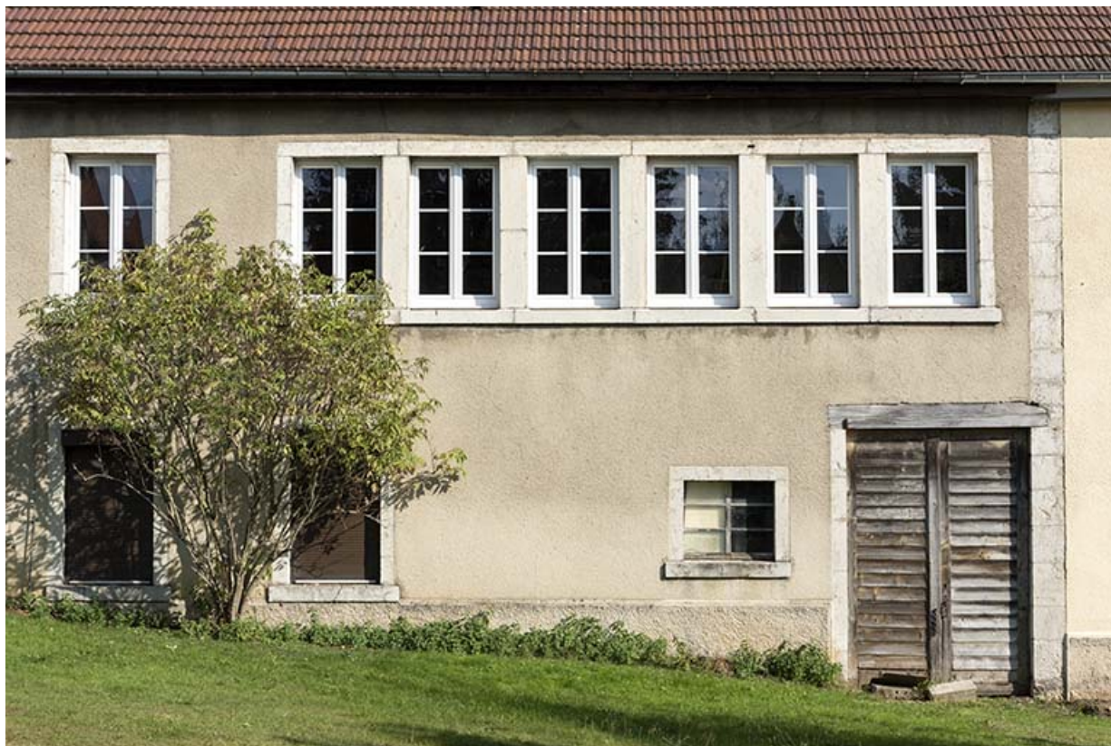
Façade postérieure : fenêtres multiples.

25, Le Russey, 5 et 5 bis rue Clemenceau