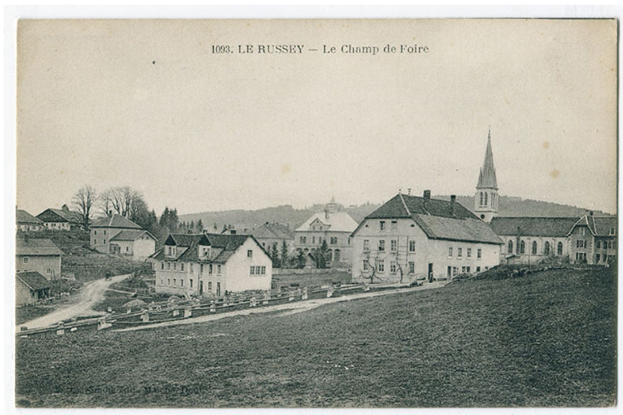
1093. Le Russey - Le champ de foire, 1er quart 20e siècle [avant 1924].

25, Le Russey, 5 et 5 bis rue Clemenceau