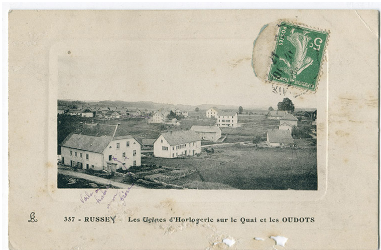
357 - Russey - Les usines d'horlogerie sur le Quai et les Oudots, 1er quart 20e siècle [entre 1911 et 1919]. 25, Le Russey, 5 rue Leclerc