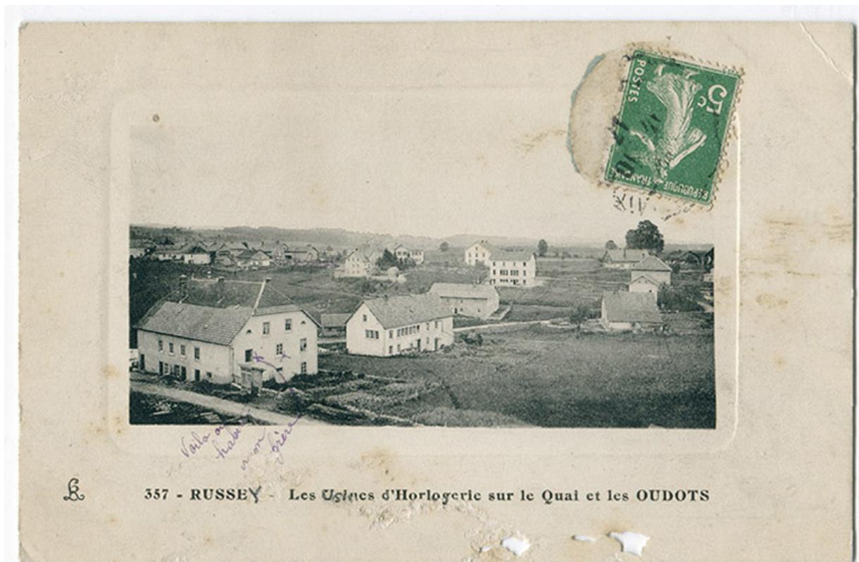
357 - Russey - Les usines d'horlogerie sur le Quai et les Oudots, 1er quart 20e siècle [entre 1911 et 1919]. 25, Le Russey, 5 rue Leclerc