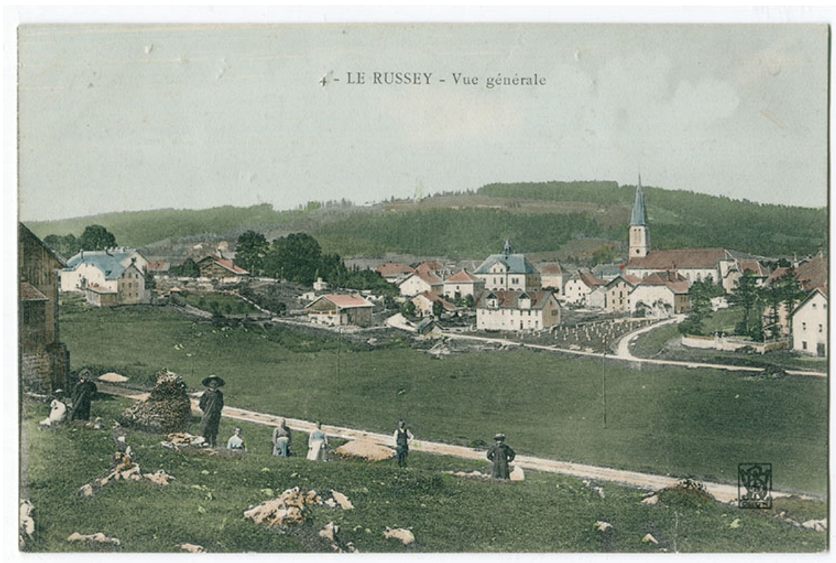
4 - Le Russey - Vue générale [depuis l'est], 1er quart 20e siècle [entre 1904 et 1909]. 25, Le Russey, 5 et 5 bis rue Clemenceau