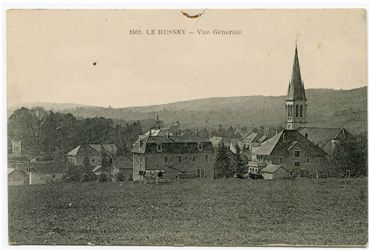
1502. Le Russey - Vue générale [depuis le nord], 1ère moitié 20e siècle. L'atelier est visible au deuxième plan à gauche. 25, Le Russey, 4 rue des Ecoles