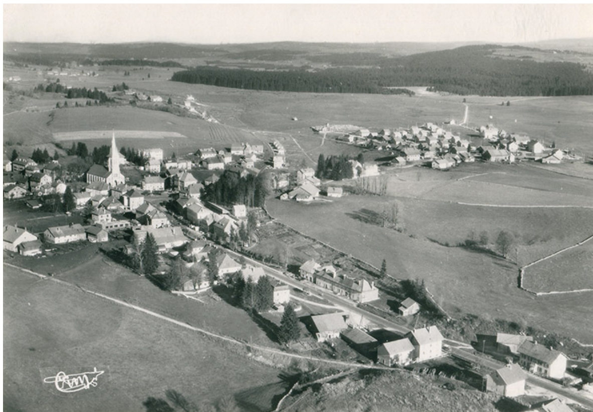
Le Russey (Doubs) - Alt. 900 m. 391-60 A - Vue panoramique aérienne [le village vu du sud-ouest], 3e quart 20e siècle. 25, Le Russey, 4 rue des Ecoles