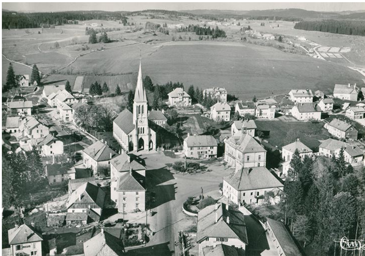
Le Russey (Doubs). 37727 - Vue panoramique aérienne [le centre du village vu du sud-ouest], 3e quart 20e siècle [avant 1966]. 25, Le Russey, 4 rue des Ecoles