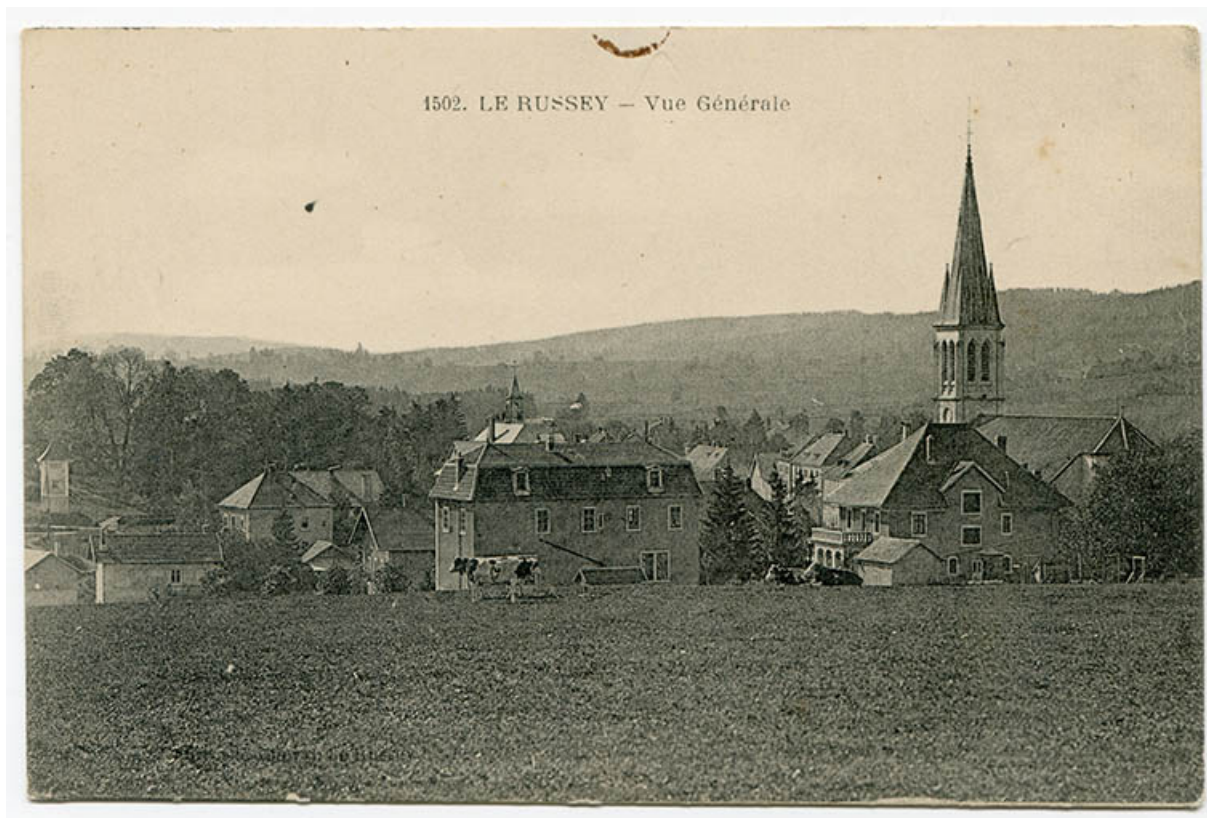
1502. Le Russey - Vue générale [depuis le nord], 1ère moitié 20e siècle. L'atelier est visible au deuxième plan à gauche. 25, Le Russey, 4 rue des Ecoles

1502. Le Russey - Vue générale [depuis le nord], carte postale, s.n., s.d. [1ère moitié 20e siècle], Cheval éd. au Russey