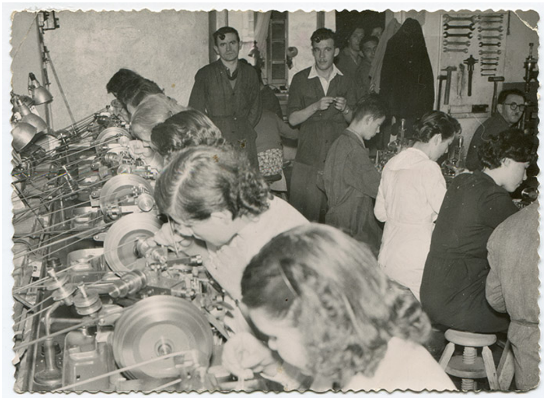
Atelier de la fabrique d'échappements à ancre Clérian, au Russey, 1950. 25, Le Russey, 4 rue des Ecoles

Etablissements Clérian. Atelier taillage. 12 novembre 1950, photographie, s.n.