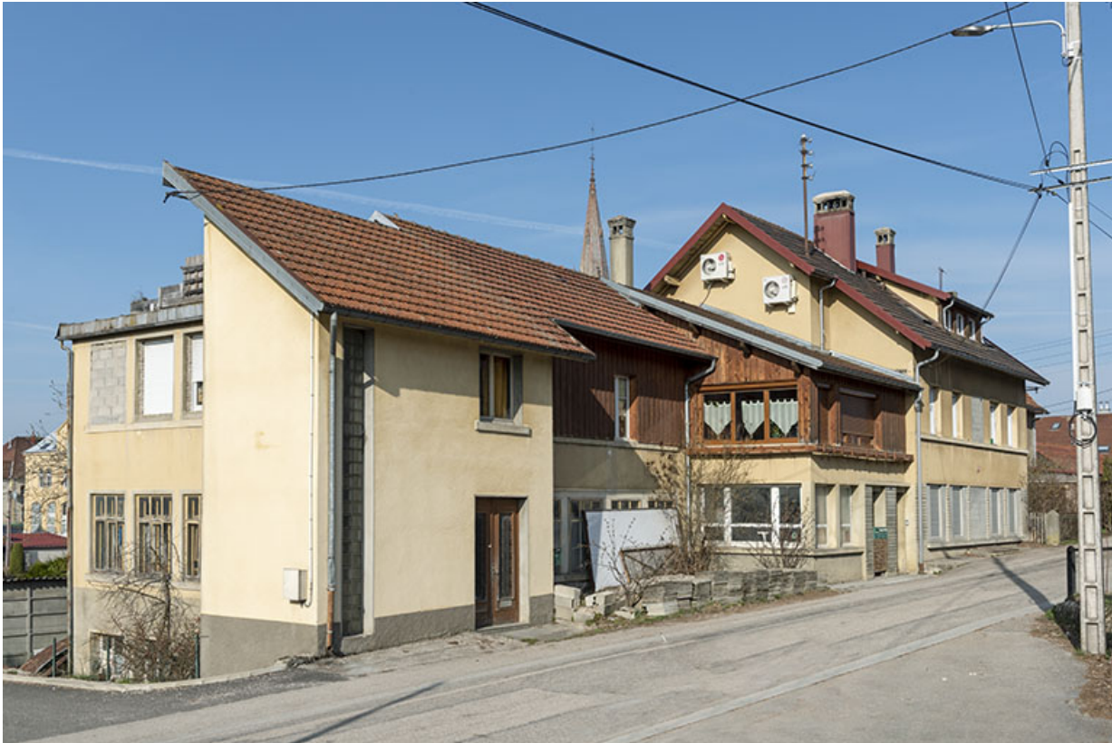
Façade antérieure, de trois quarts gauche.