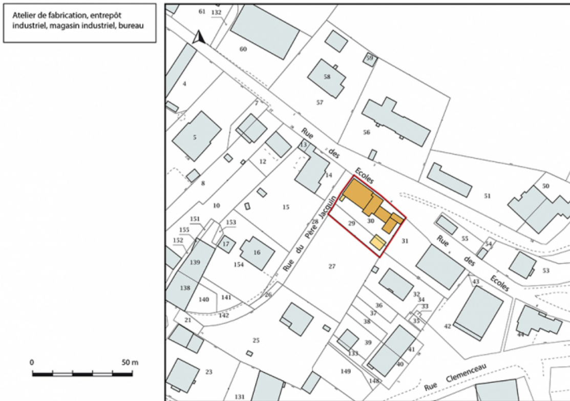
Plan-masse et de situation. Extrait du plan cadastral, 2018, section AM. 25, Le Russey, 4 rue des Ecoles