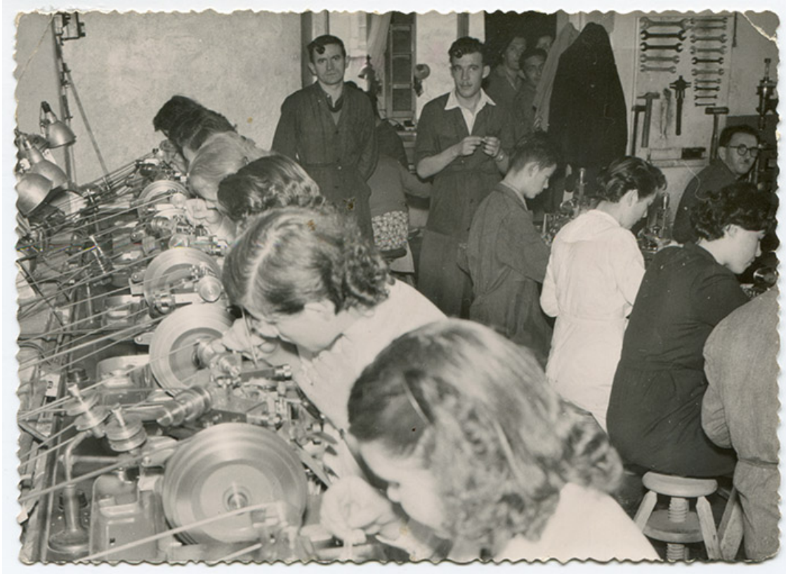
Atelier de la fabrique d'échappements à ancre Clérian, au Russey, 1950. 25, Le Russey, 4 rue des Ecoles