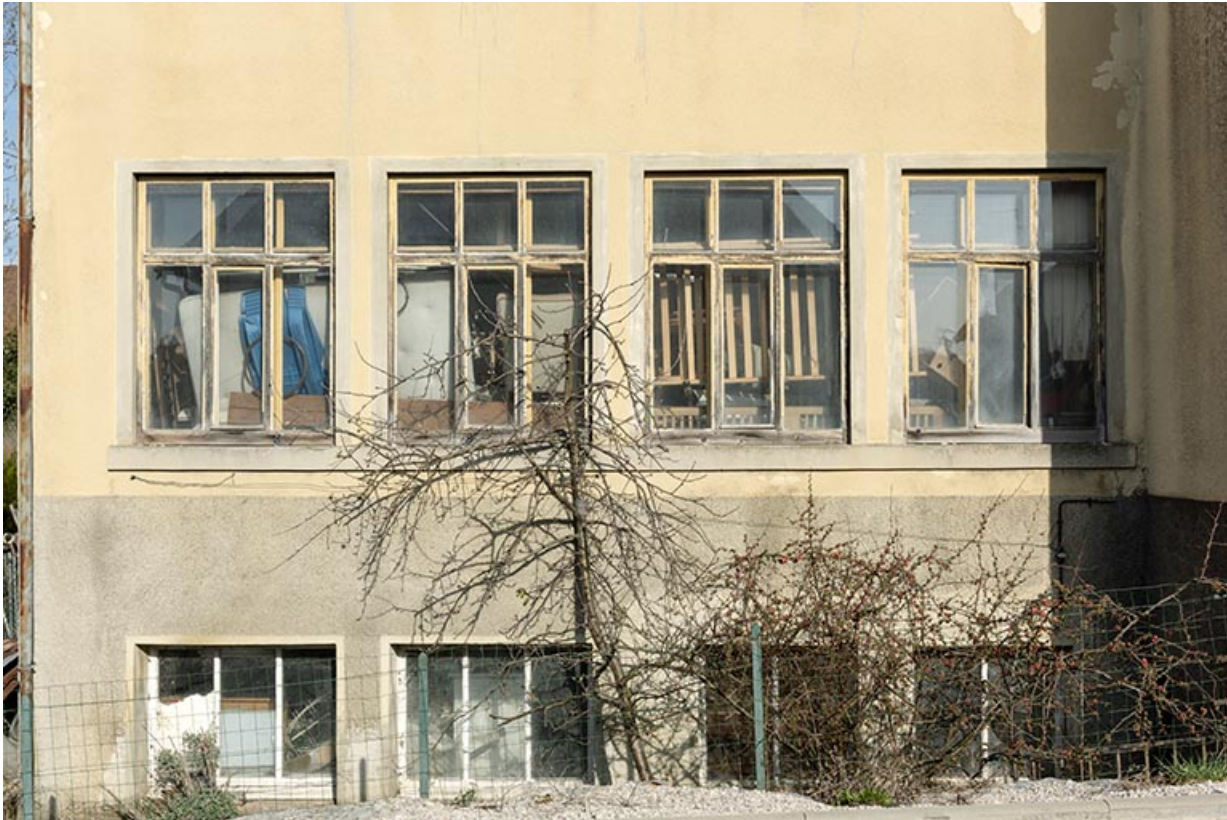
Aile orientale : fenêtres multiples.