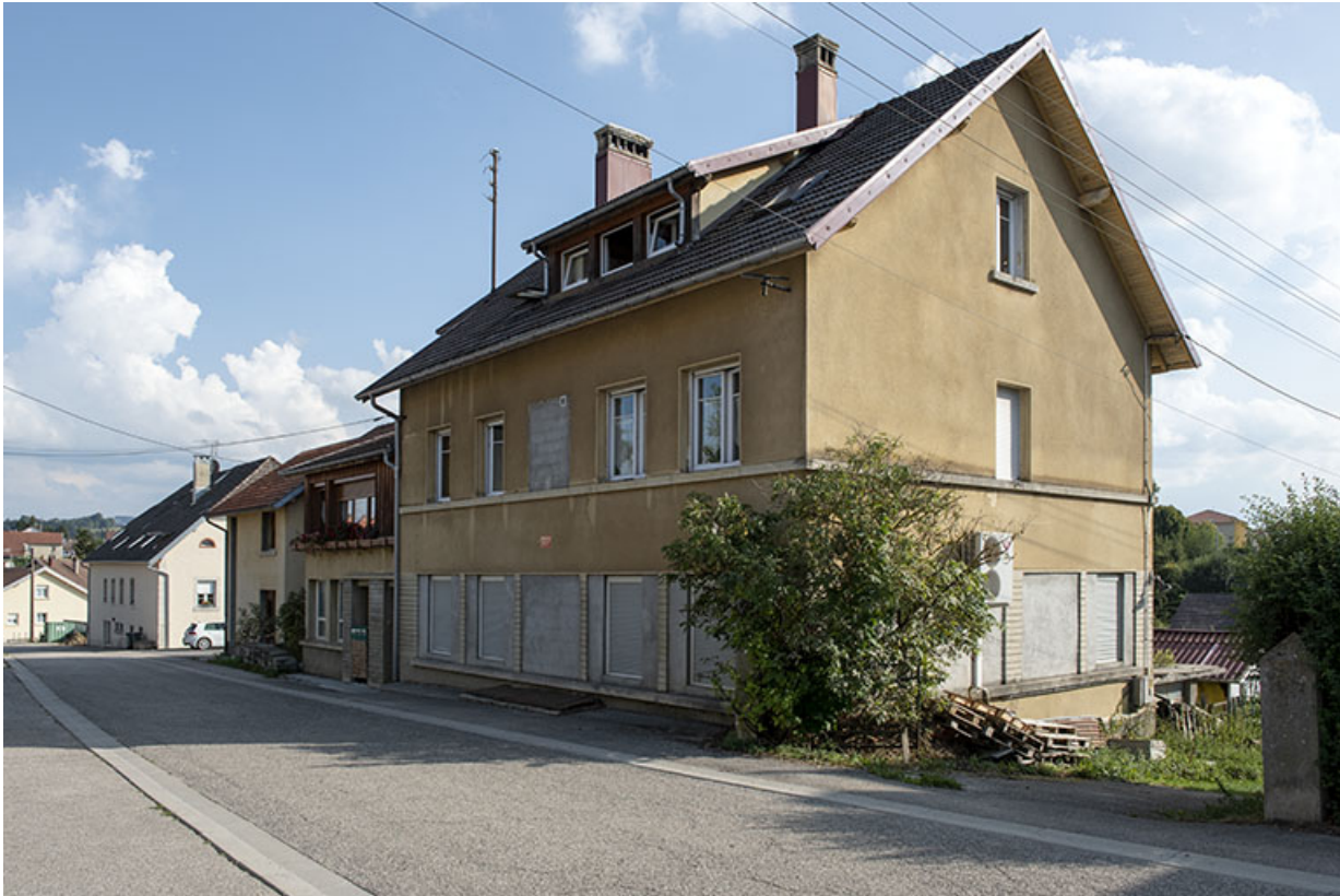
Façade antérieure, de trois quarts droite.