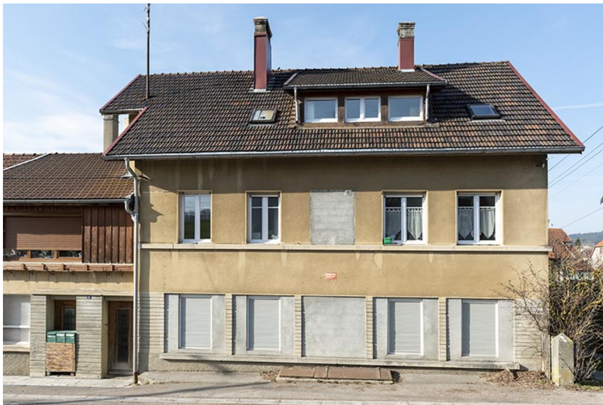
Façade antérieure de l'atelier. 25, Le Russey, 4 rue des Ecoles