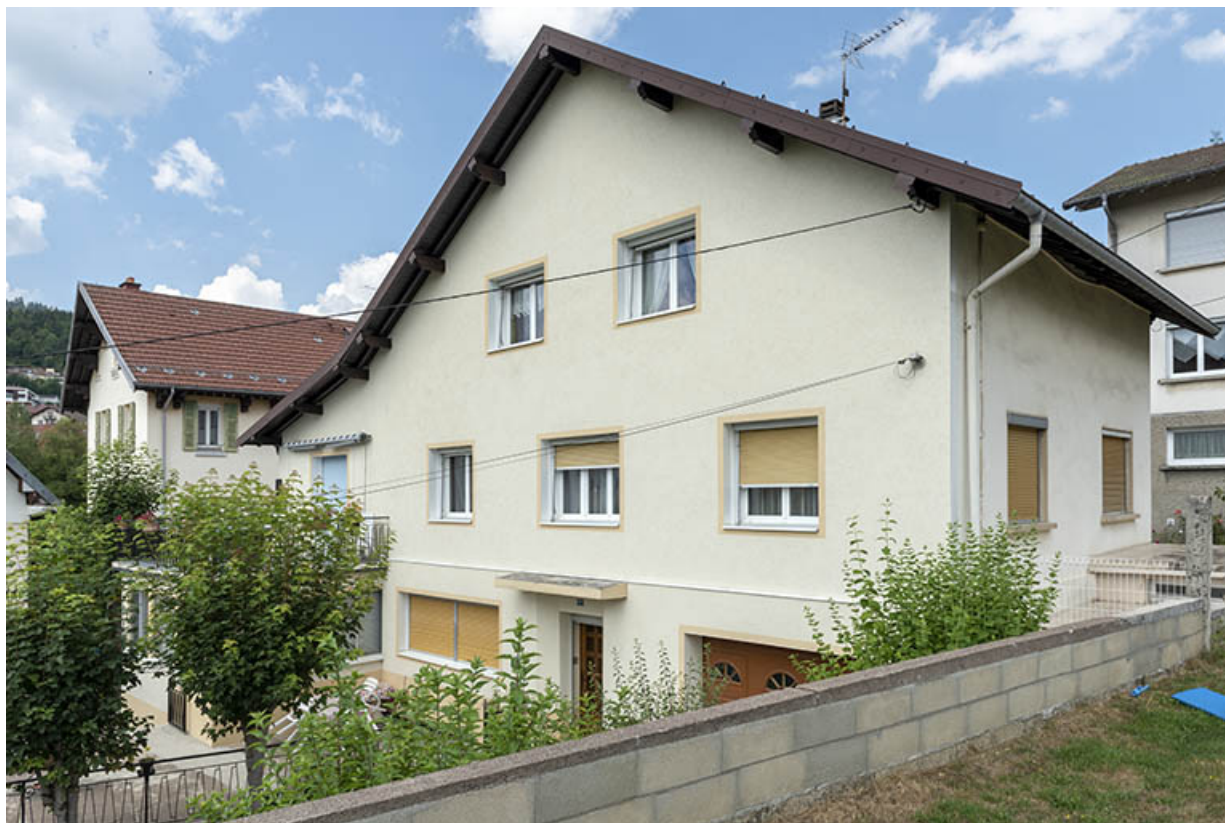
Maison, vue de trois quarts droite.