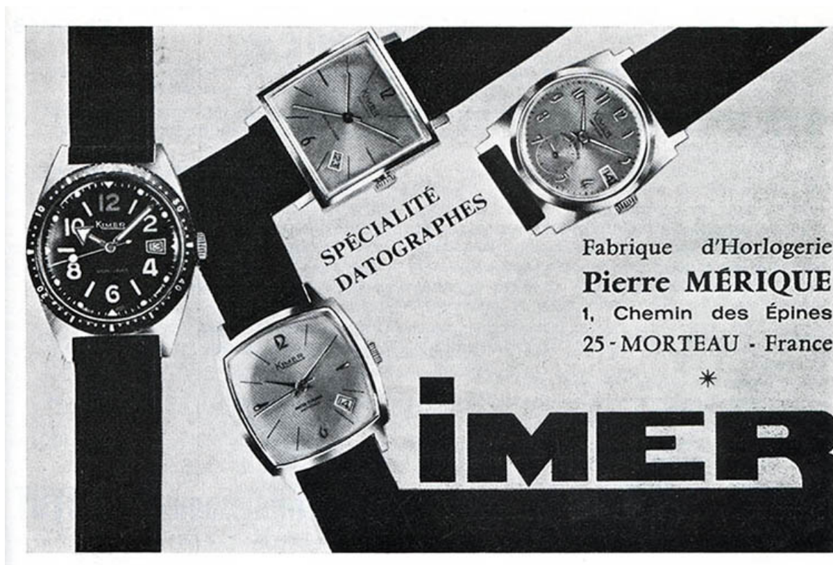
Fabrique d'horlogerie Pierre Merique. Imer [publicité], vers 1970. 25, Morteau, 1 chemin des Epines