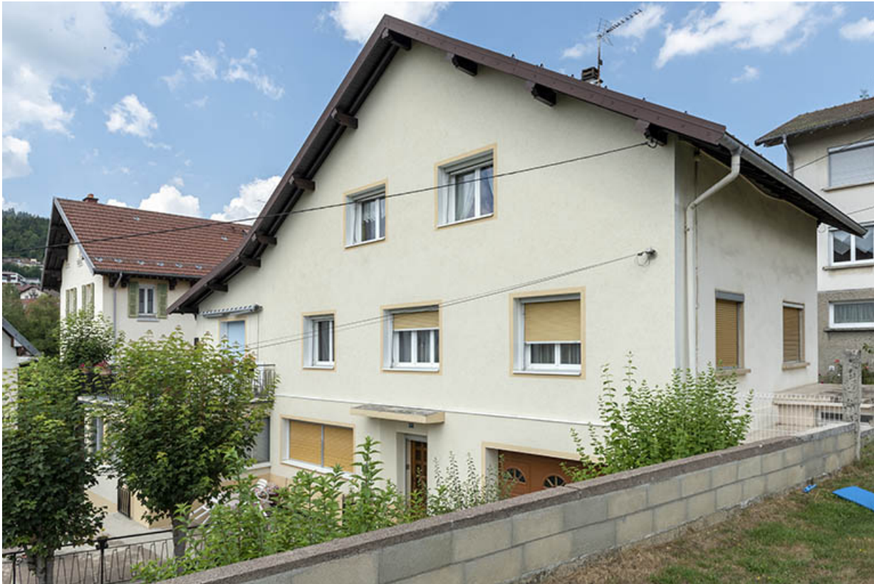
Maison, vue de trois quarts droite.