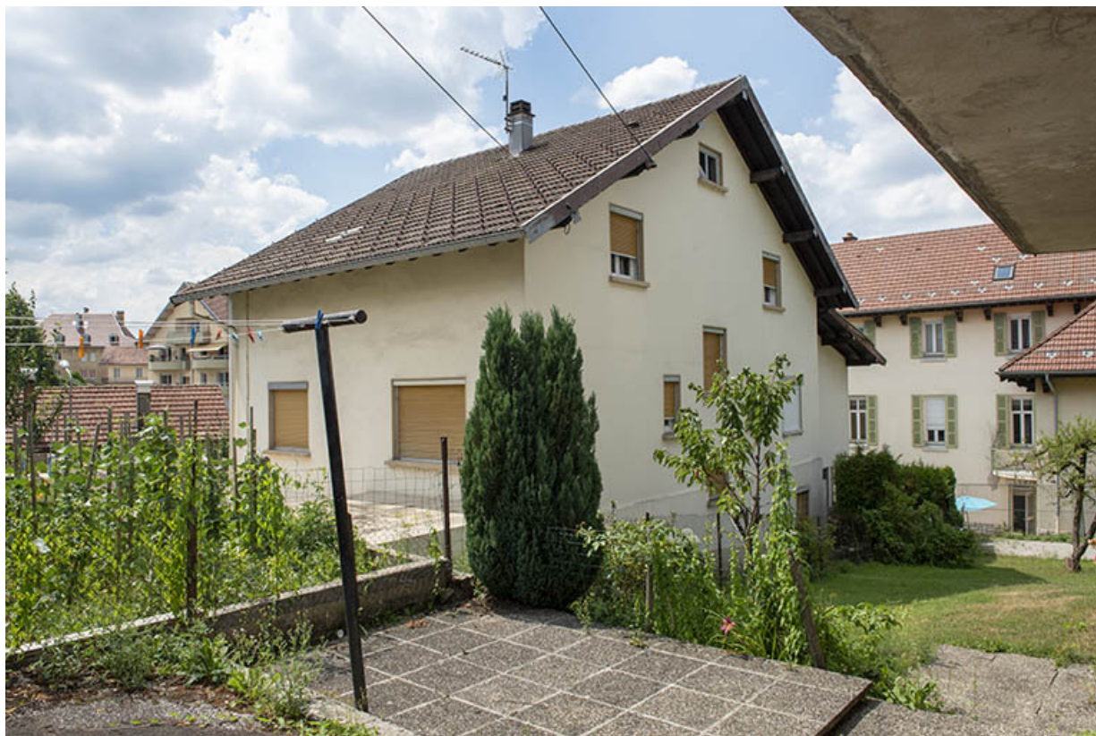
Maison : façades postérieure et latérale droite.