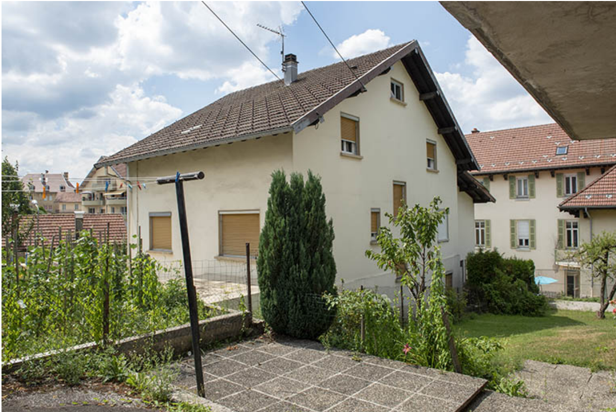
Maison : façades postérieure et latérale droite.