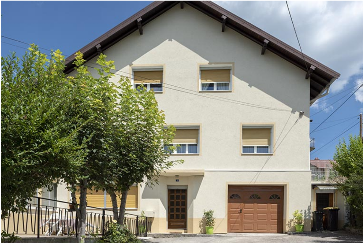
Maison : façade antérieure.