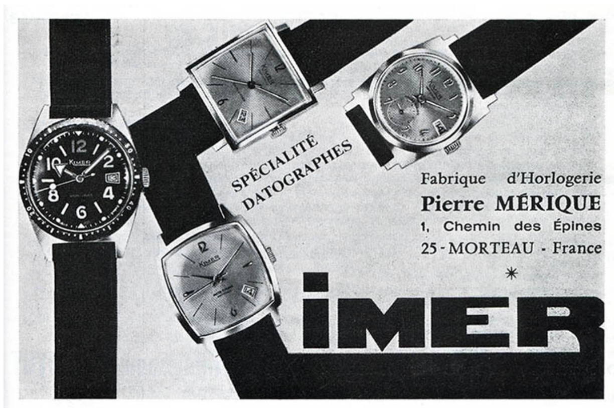
Fabrique d'horlogerie Pierre Merique. Imer [publicité], vers 1970. 25, Morteau, 1 chemin des Epines