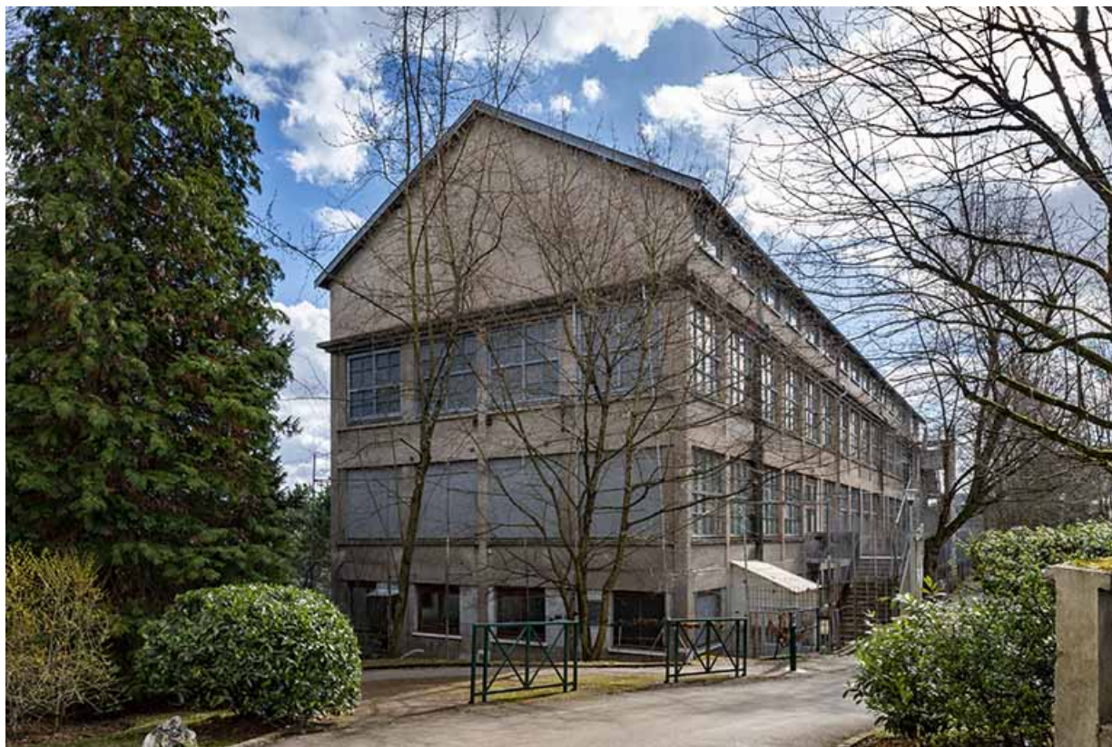
Entrepôt industriel, vu depuis le nord.