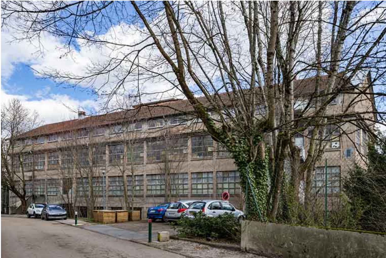
Façade ouest de l'entrepôt industriel.