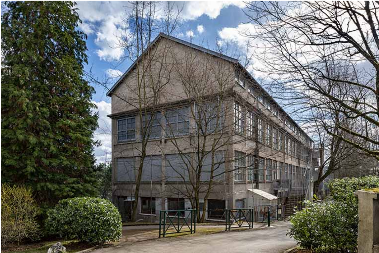
Entrepôt industriel, vu depuis le nord.