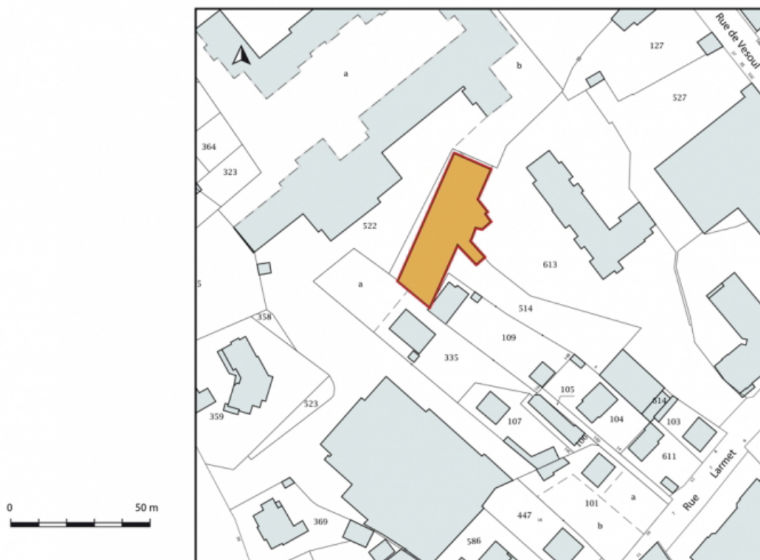
Plan-masse et de situation. Extrait du plan cadastral, 2019.