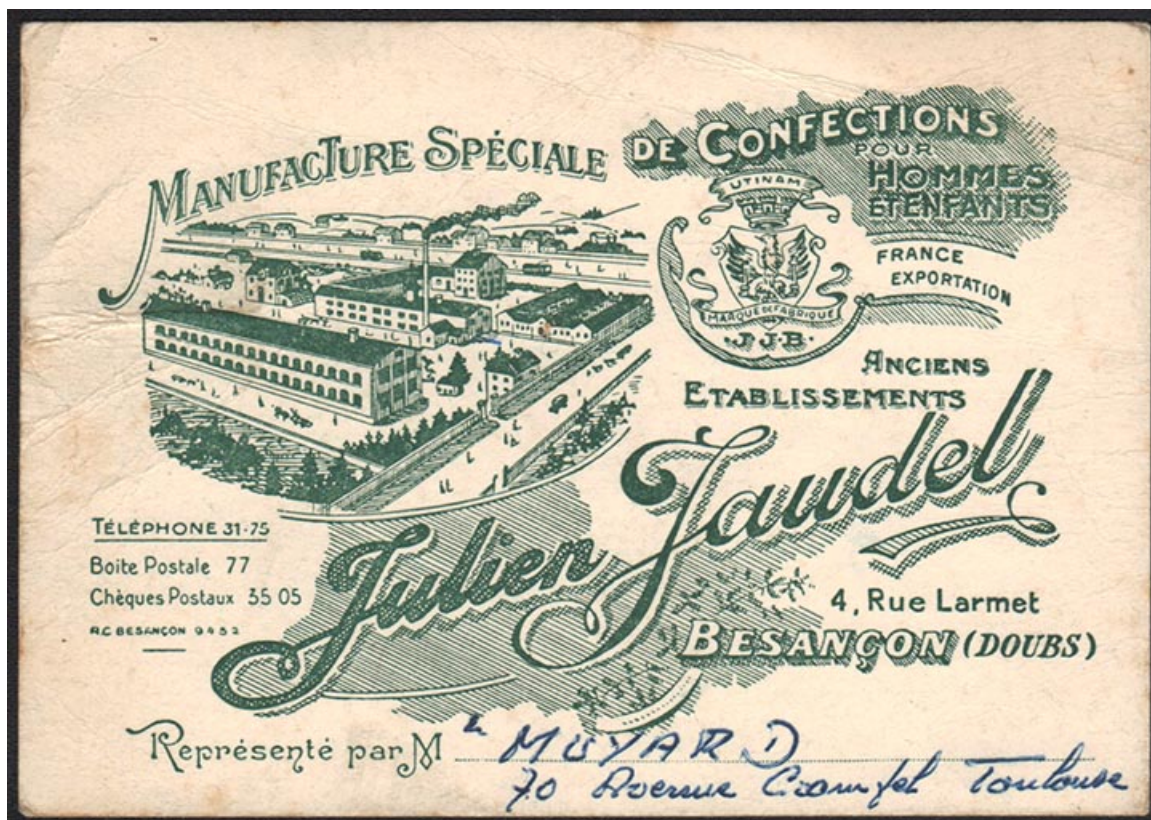
Encart publicitaire, s.d. [décennie 1920].