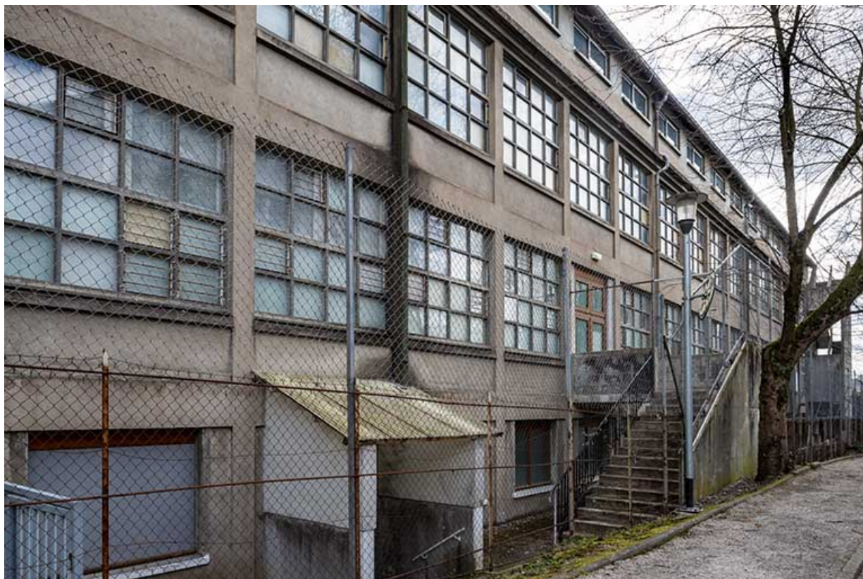
Façade ouest de l'entrepôt industriel, vue de trois quart.