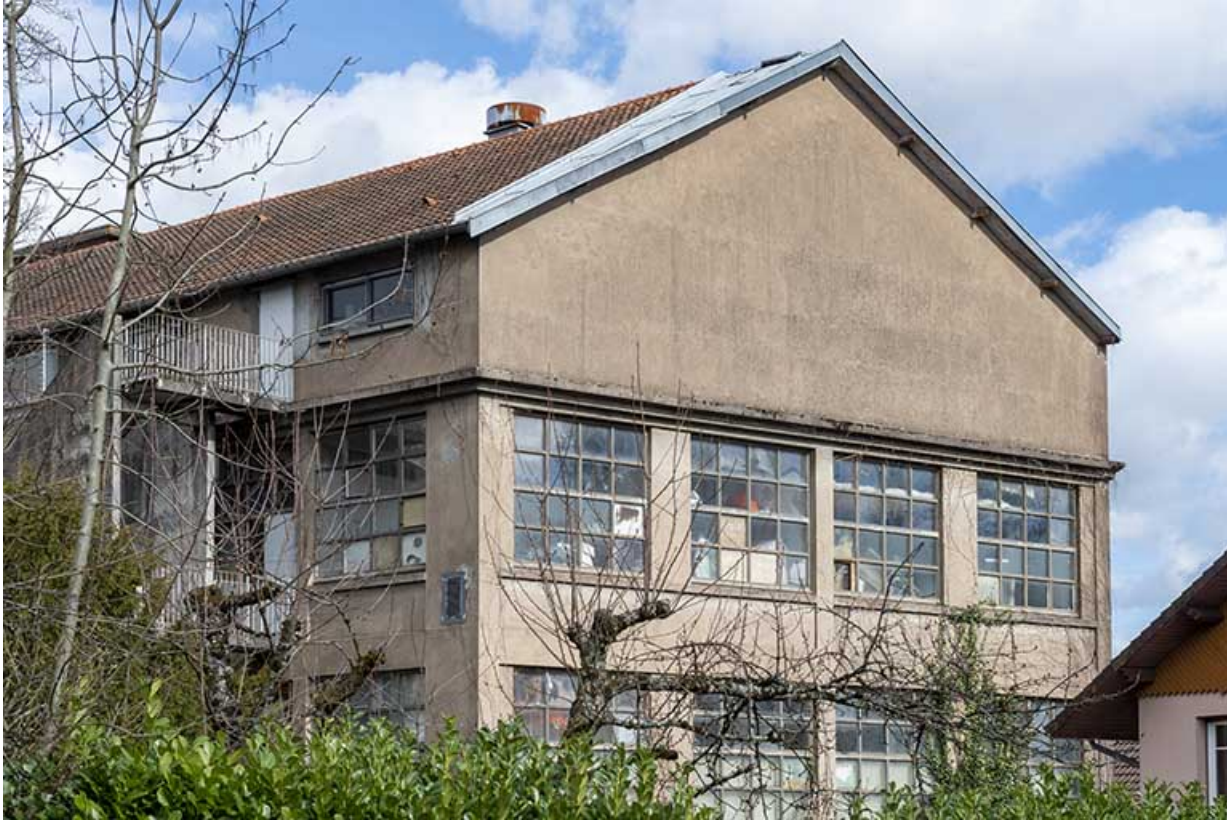
Pignon sud de l'entrepôt industriel.