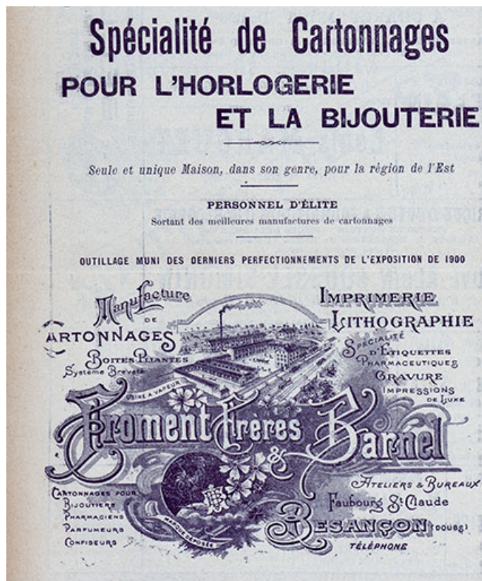
Manufacture de cartonnages Froment et Darnel, 1901.