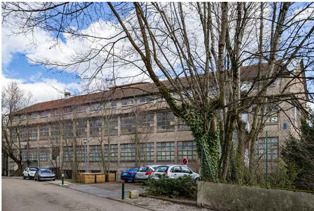
Façade ouest de l'entrepôt industriel.