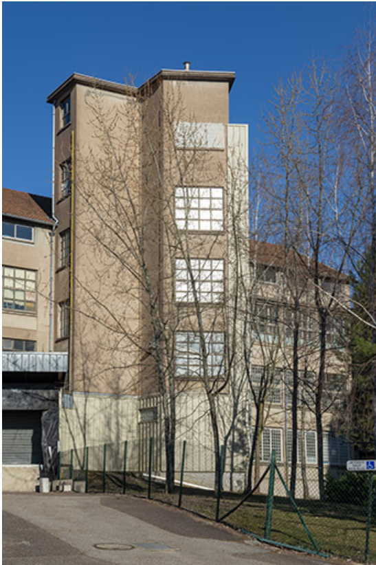
Tour du monte-charge.