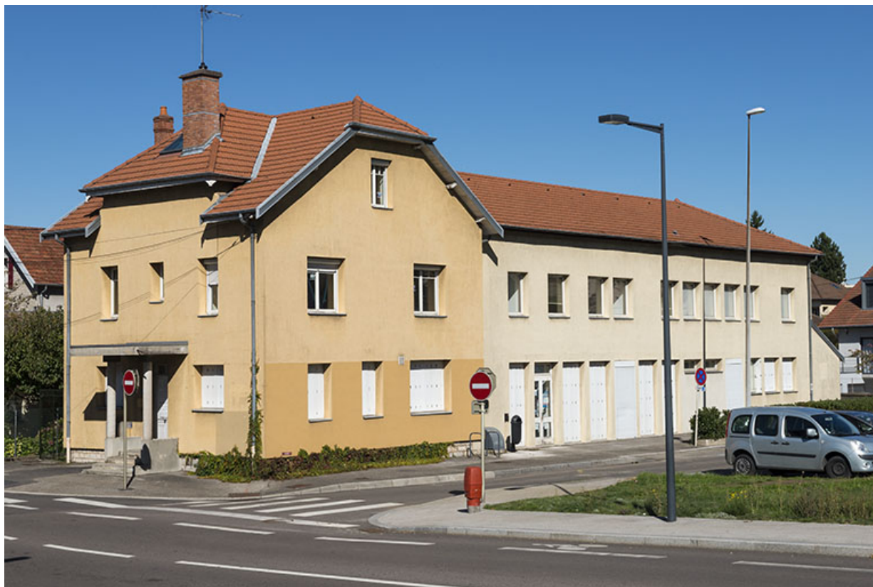
Vue de trois quarts, depuis le sud-ouest.