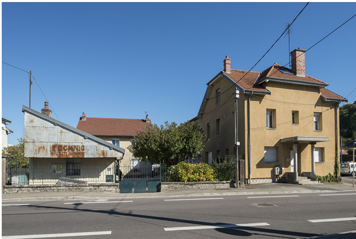
Vue de trois quarts depuis l'avenue du Polygone.