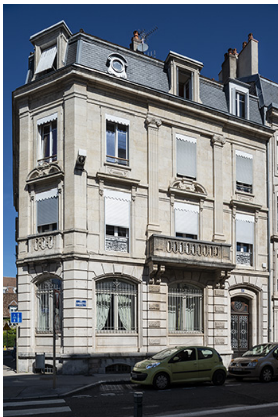
Façade sur la rue Gambetta (n°17).