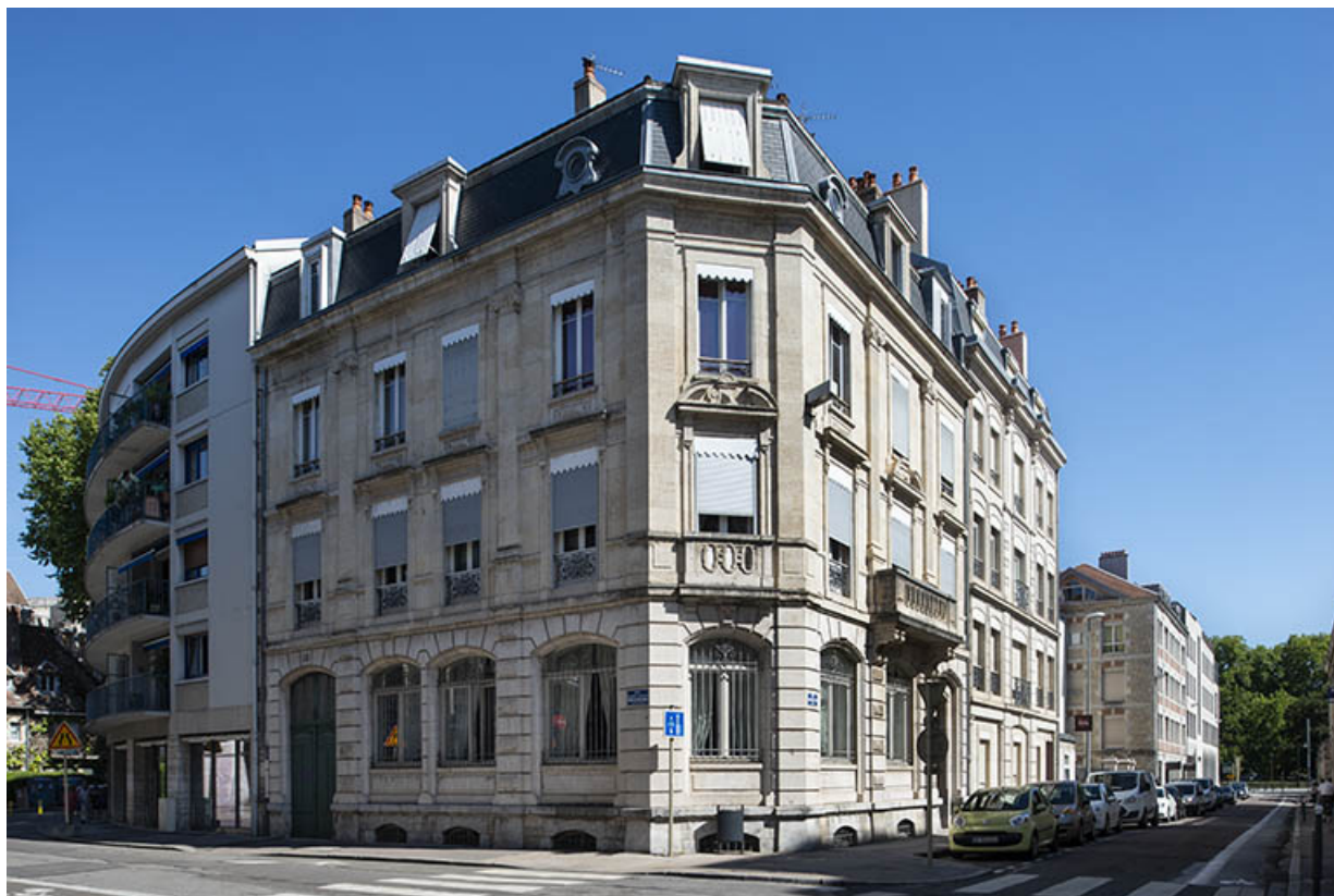
Vue d'ensemble depuis l'intersection des rues Proudhon et Gambetta. 25, Besançon