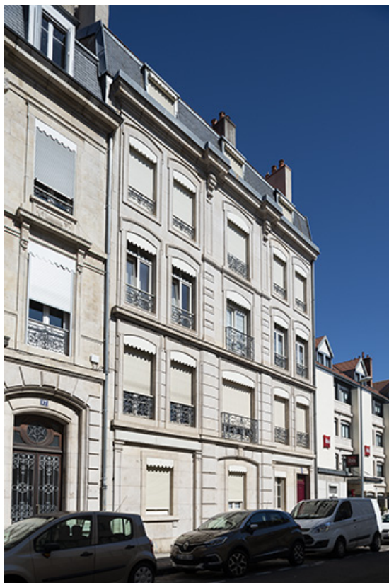
Façade vue de trois quarts (n°19). 25, Besançon, 17-19 rue Gambetta