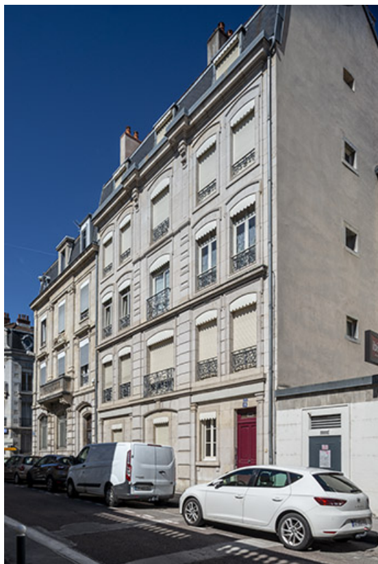
Façades (n°17 et 19) vues de trois quarts droite. 25, Besançon, 17-19 rue Gambetta