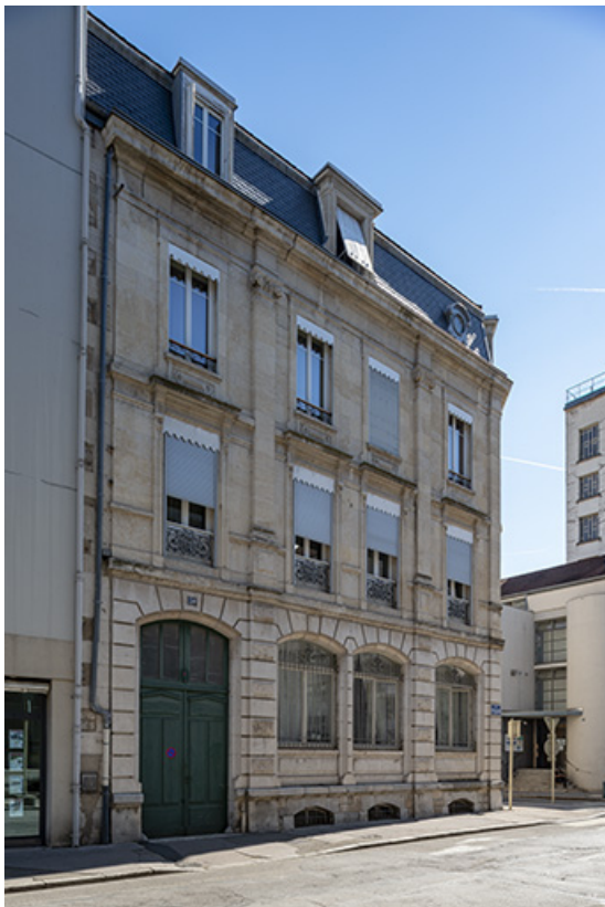
Façade sur la rue Proudhon (n°17), vue de trois quarts gauche. 25, Besançon, 17-19 rue Gambetta