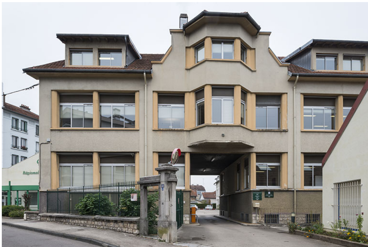
Bâtiment d'entrée. Façade antérieure.

25, Besançon, 48 avenue Georges Clemenceau