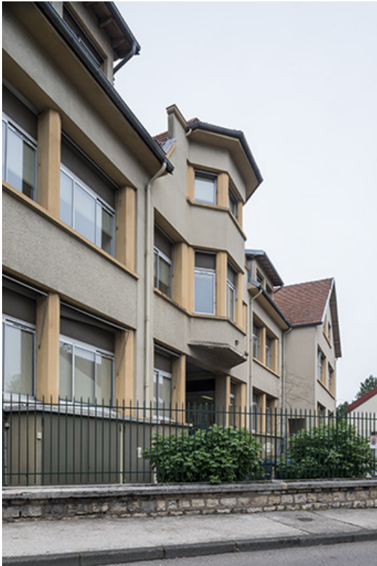
Façade antérieure vue de trois quarts gauche.

25, Besançon, 48 avenue Georges Clemenceau