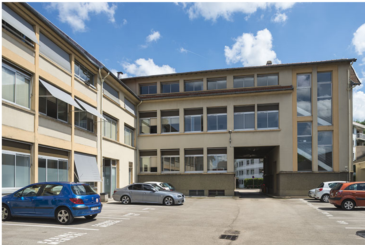
Bâtiment d'entrée. Façade nord.

25, Besançon, 48 avenue Georges Clemenceau