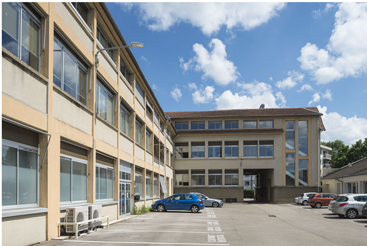
Ateliers est et bâtiment d'entrée, depuis le nord.

25, Besançon, 48 avenue Georges Clemenceau