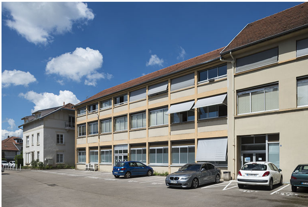
Vue d'ensemble depuis l'entrée de la cour.

25, Besançon, 48 avenue Georges Clemenceau