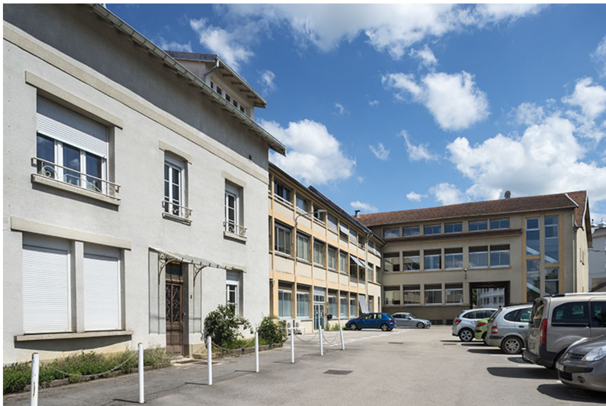
Vue d'ensemble depuis le nord-ouest de la cour.

25, Besançon, 48 avenue Georges Clemenceau