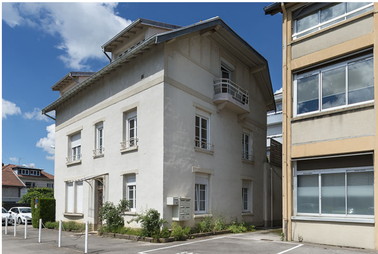
Logement vu de trois quarts droite.

25, Besançon, 48 avenue Georges Clemenceau