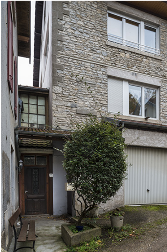
Extrémité sud de l'atelier de fabrication.

25, Besançon, 43 avenue Georges Clemenceau