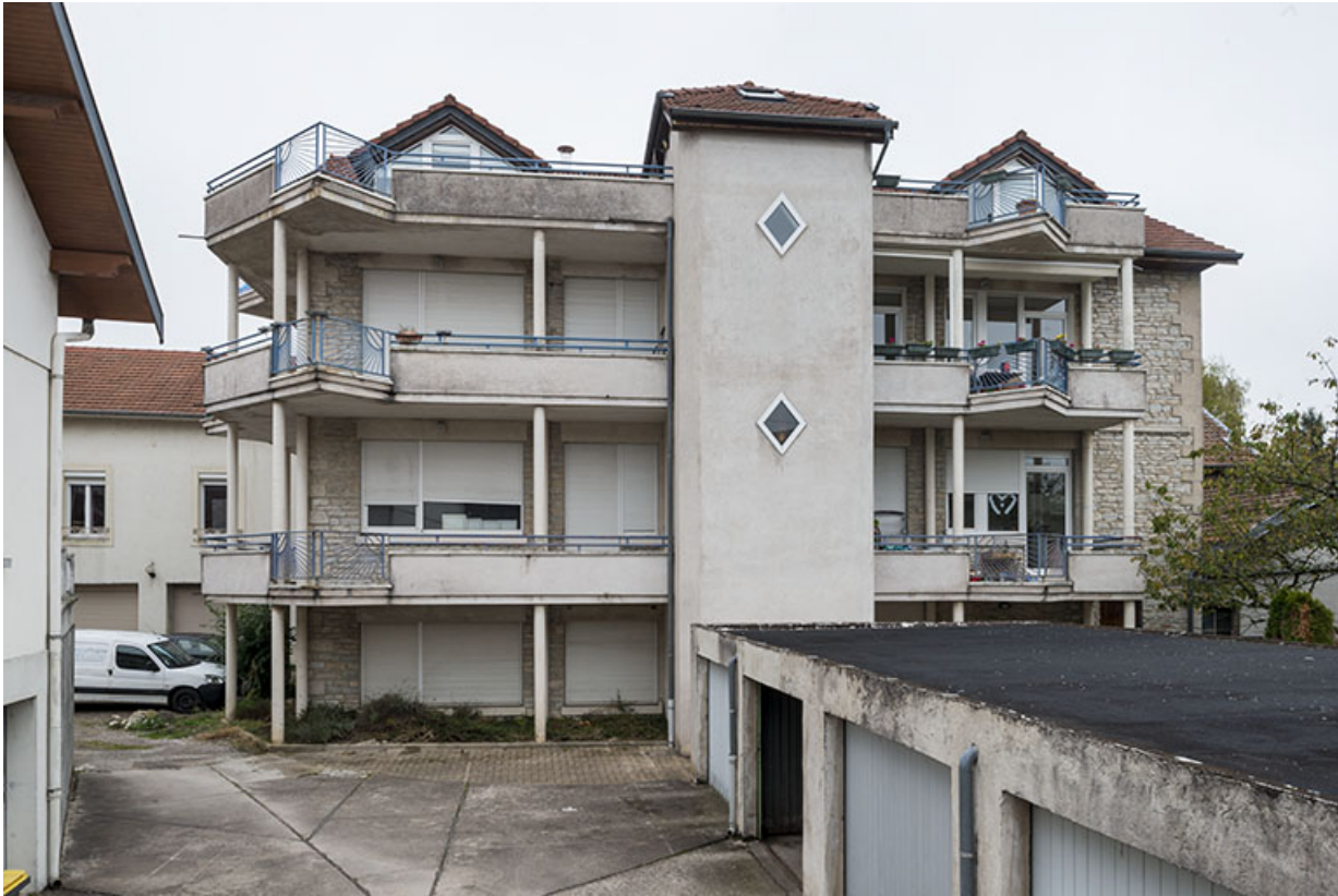
Façade ouest de l'atelier de fabrication.

25, Besançon, 43 avenue Georges Clemenceau