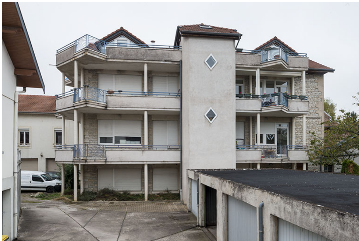
Façade ouest de l'atelier de fabrication.

25, Besançon, 43 avenue Georges Clemenceau