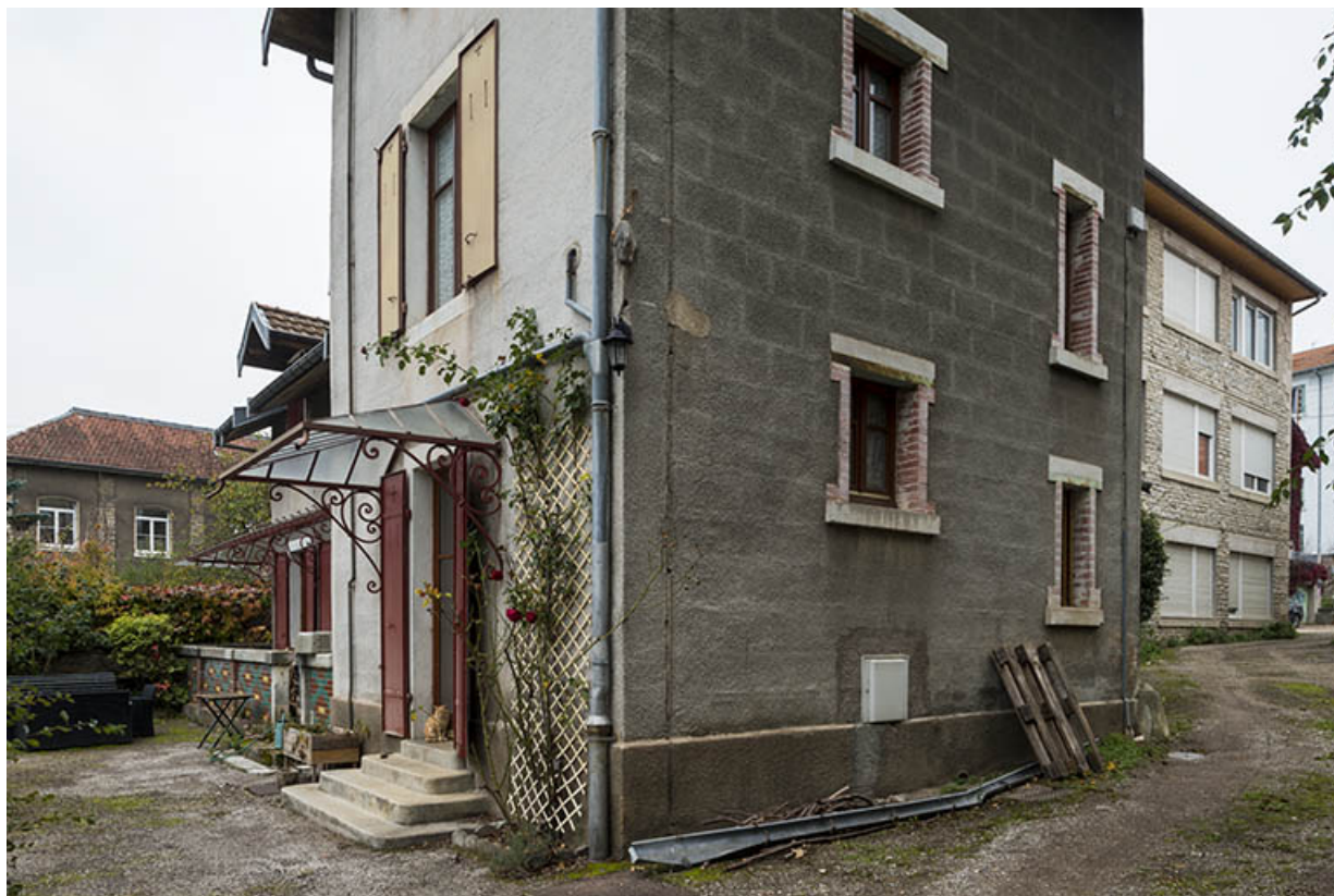
Logement, adossé au pignon sud de l'atelier. 25, Besançon, 43 avenue Georges Clemenceau