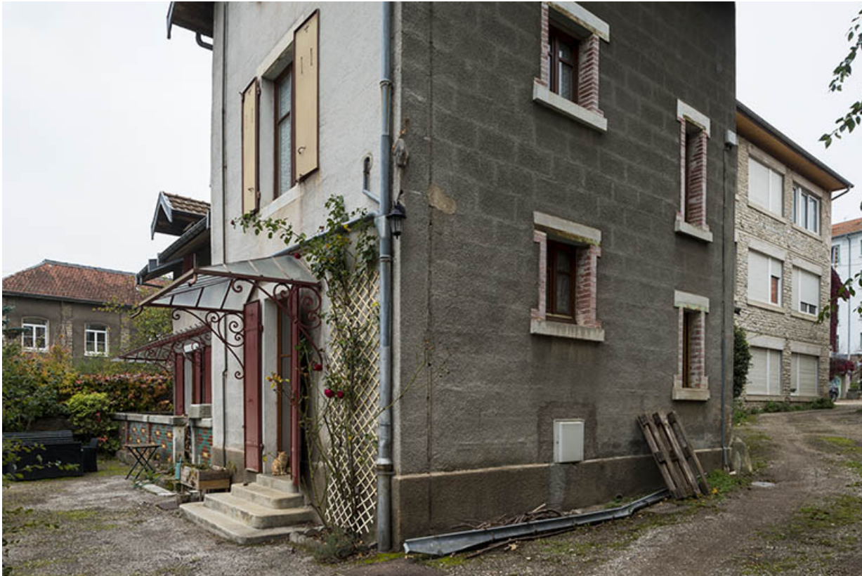
Logement, adossé au pignon sud de l'atelier. 25, Besançon, 43 avenue Georges Clemenceau