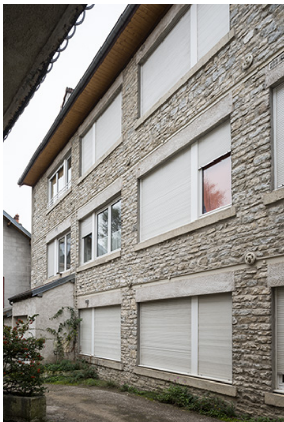
Façade est, vue de trois quarts.

25, Besançon, 43 avenue Georges Clemenceau