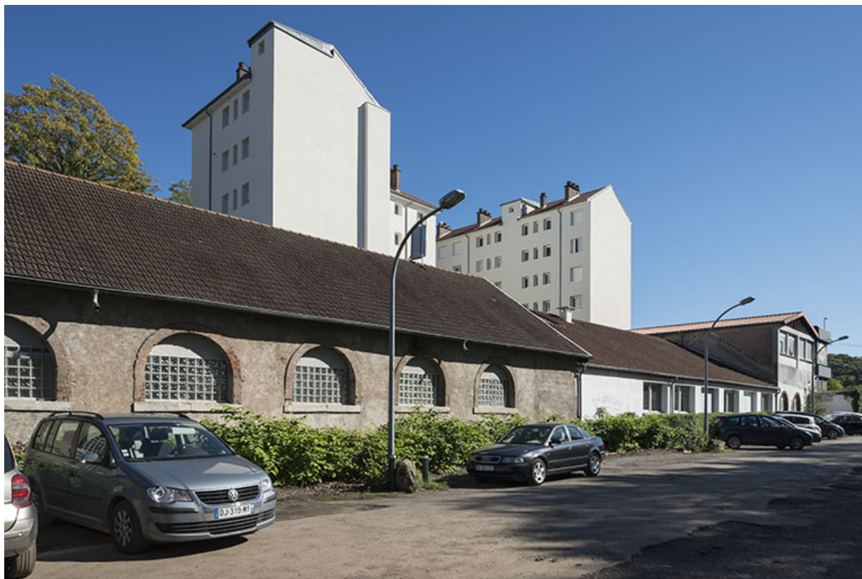
Ateliers de la fonderie. Vue depuis le nord-ouest.