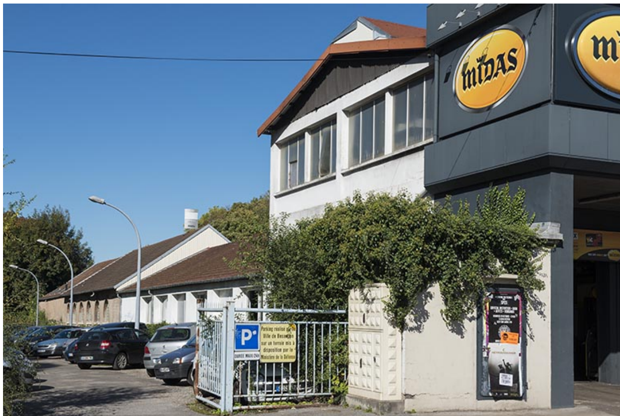
Vue d'ensemble depuis le sud-ouest.