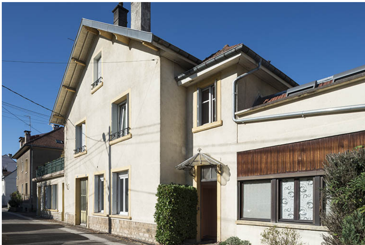
Façades sud vues de trois quarts droite.