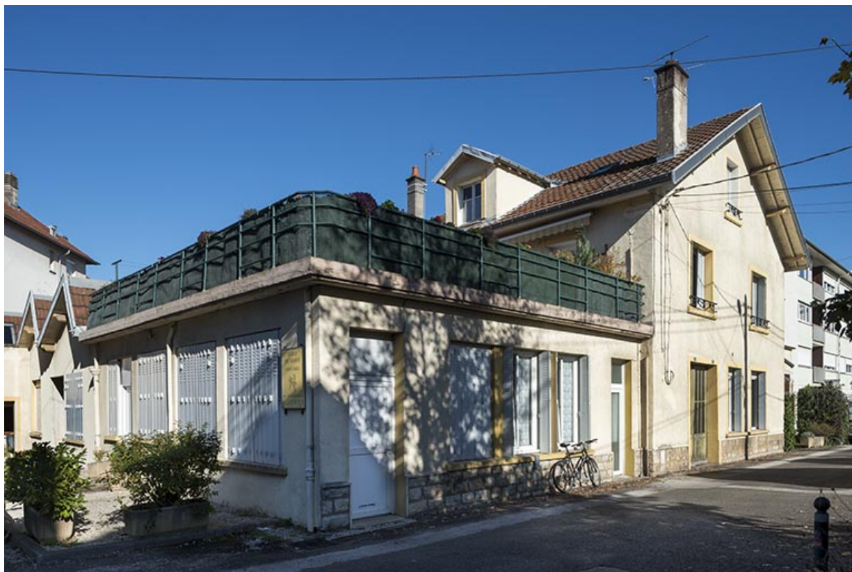
Bureau, atelier et logement vus de trois quarts gauche.