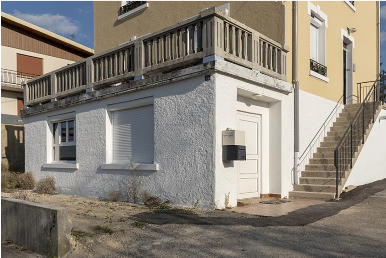
Atelier de fabrication, de trois quarts droite. 25, Morteau, 14 impasse Billard