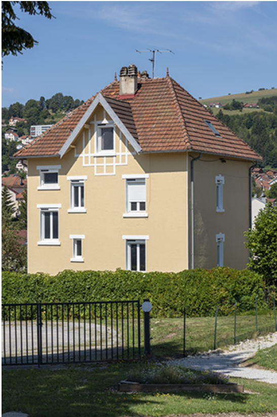
Façades postérieure et latérale gauche.