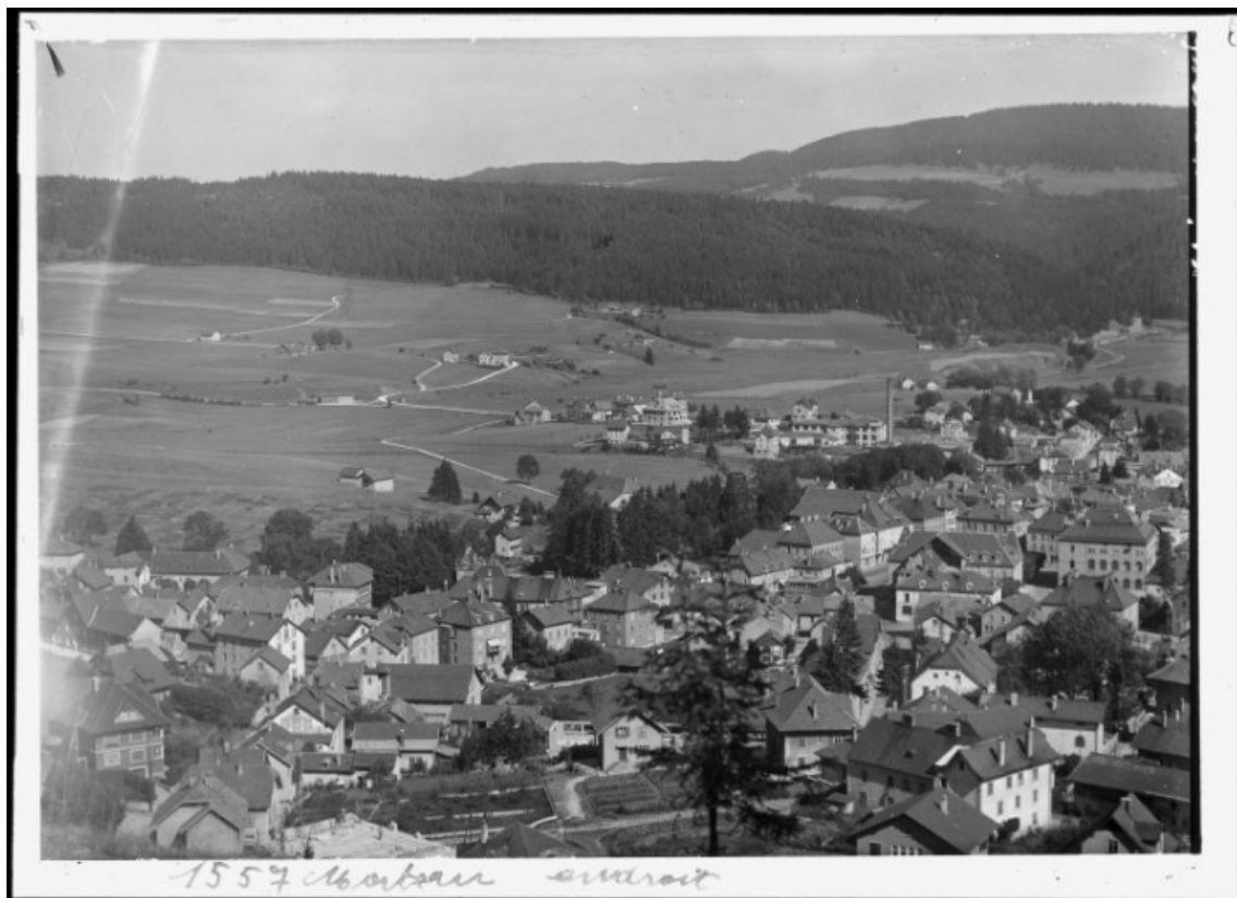
[Vue d'ensemble de la ville, depuis le nord-ouest], milieu 20e siècle.