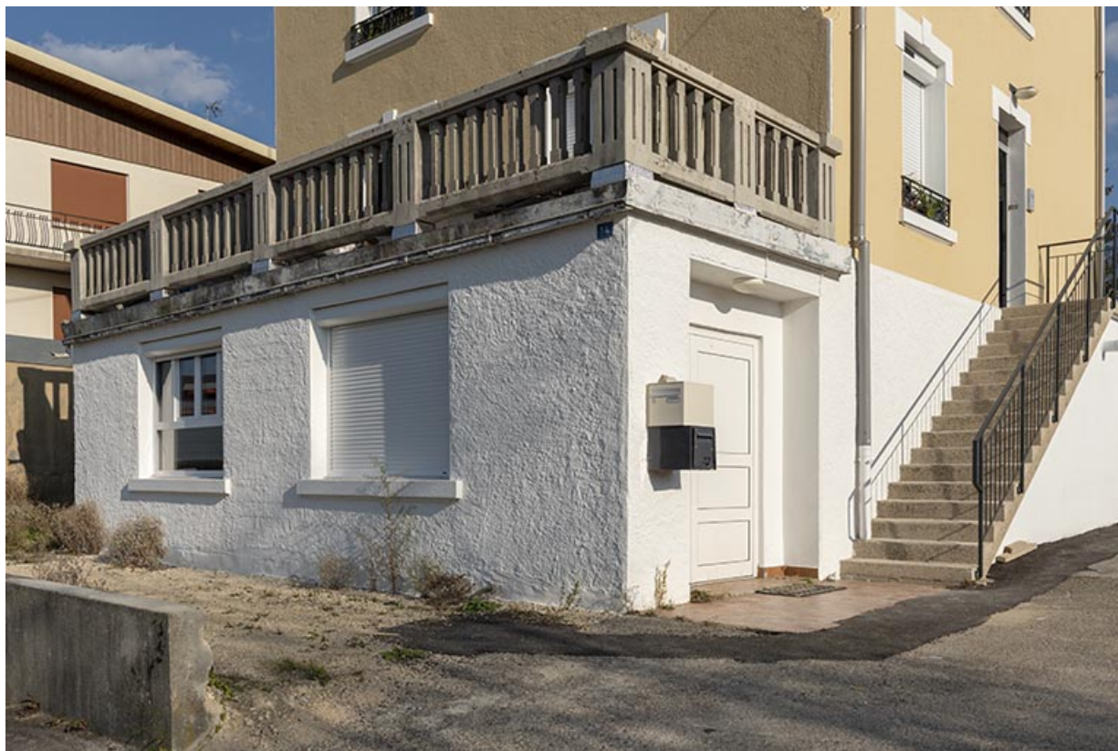
Atelier de fabrication, de trois quarts droite. 25, Morteau, 14 impasse Billard