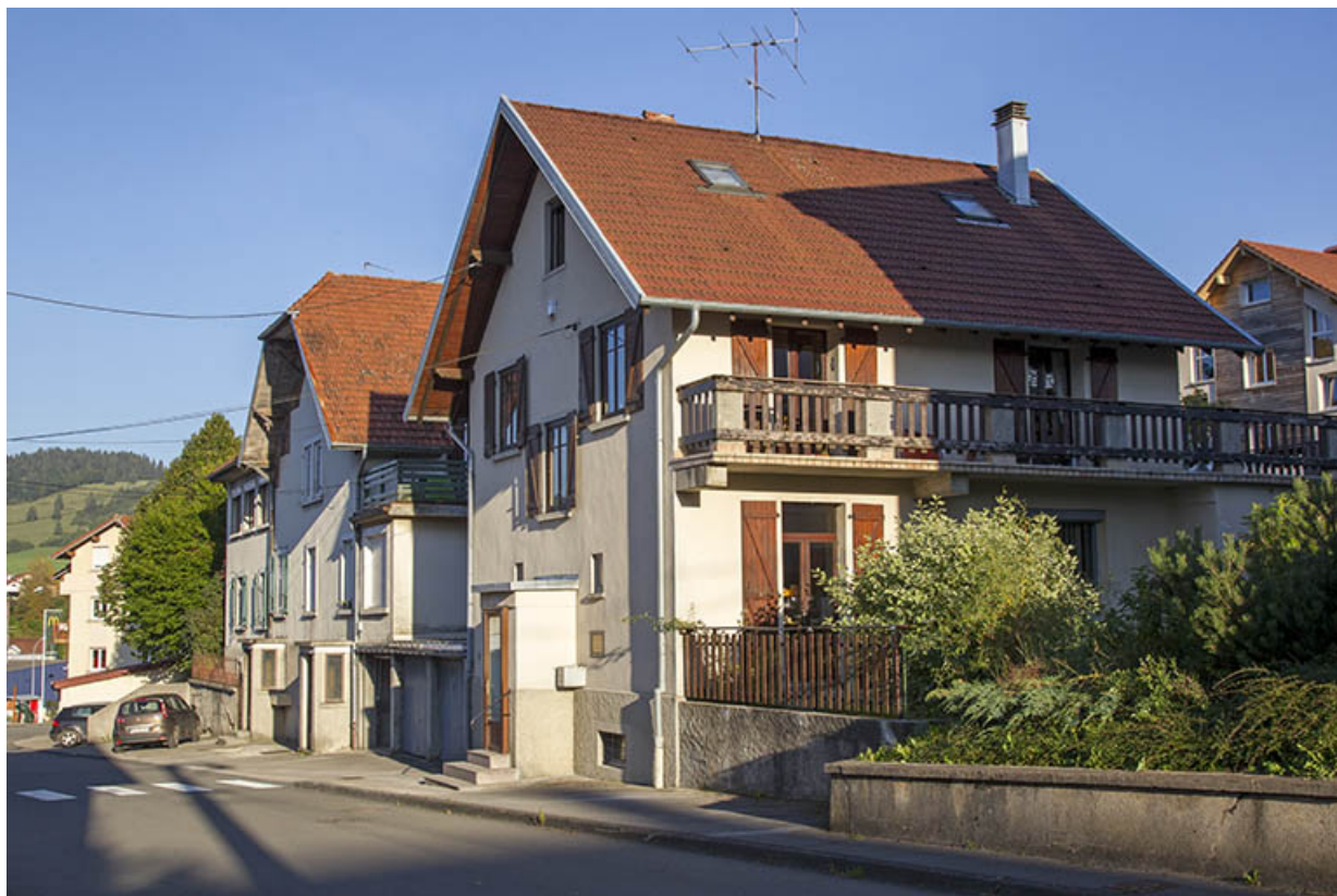
Vue d'ensemble de la rue Victor Hugo (avec le n° 24 au premier-plan). 25, Morteau, 24 rue Victor Hugo