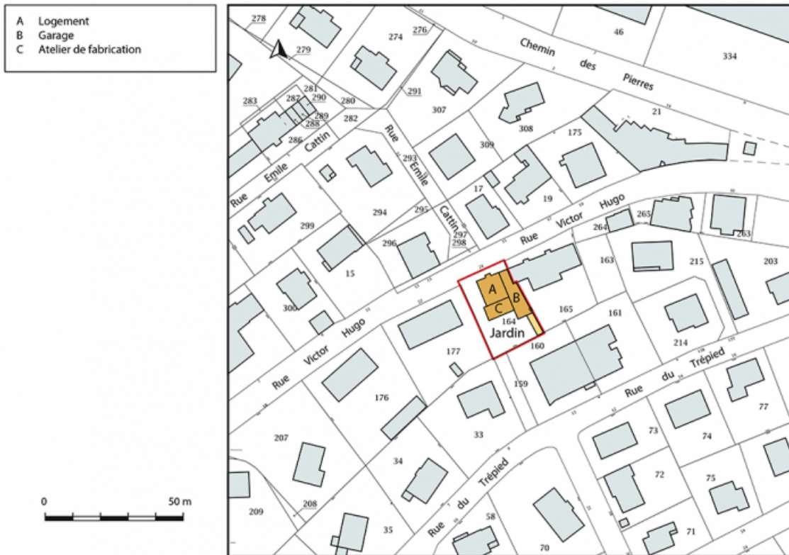
Plan-masse et de situation. Extrait du plan cadastral, 2018, section AF, 1/1 000. 25, Morteau, 24 rue Victor Hugo