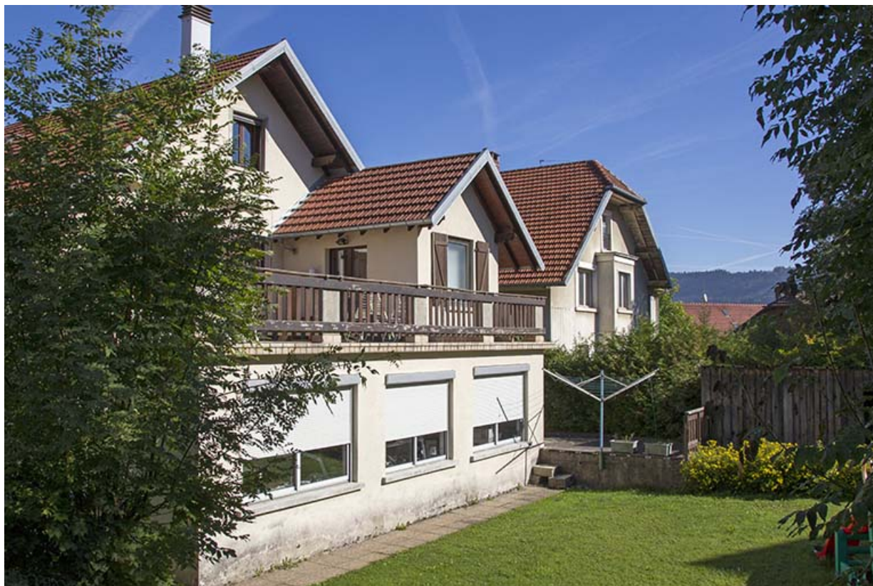
Façade postérieure, de trois quarts gauche. 25, Morteau, 24 rue Victor Hugo