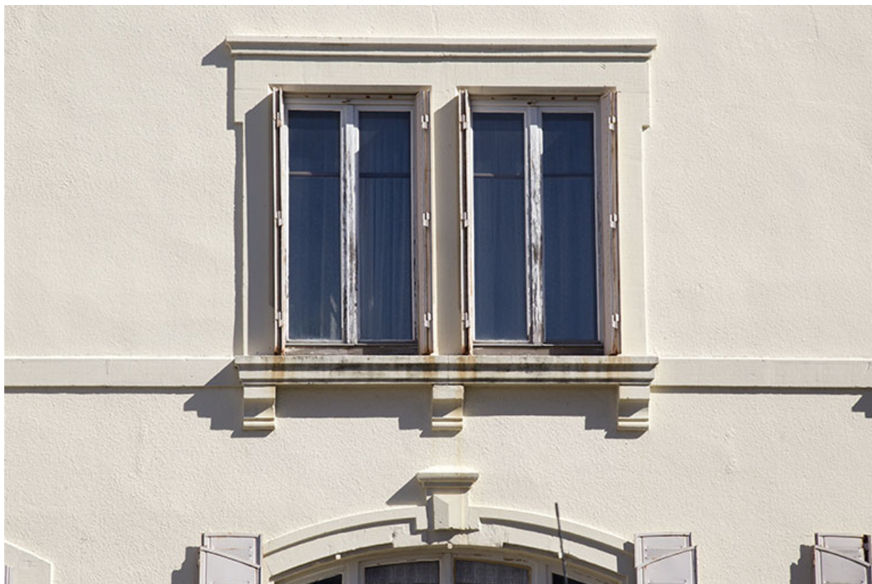
Façade antérieure : fenêtres jumelées au premier étage.