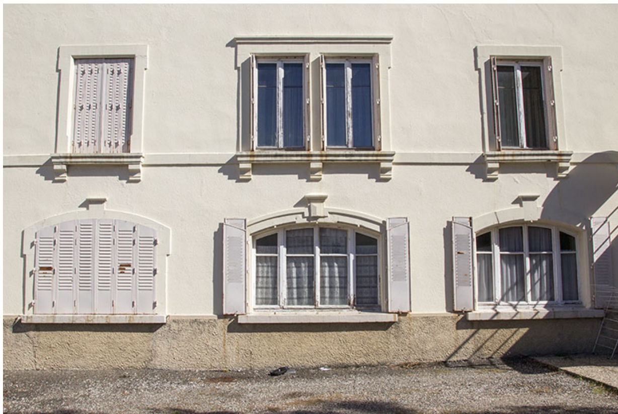
Façade antérieure : fenêtres du rez-de-chaussée et du premier étage.