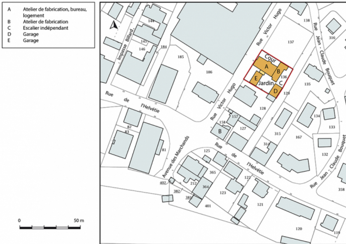
Plan-masse et de situation. Extrait du plan cadastral, 2018, section AF, 1/1 000. 25, Morteau, 8 rue Victor Hugo