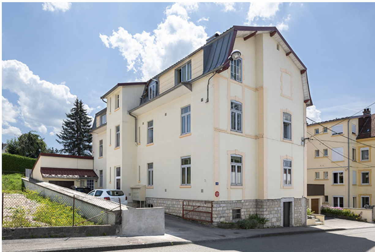
Façades postérieure et latérale gauche.