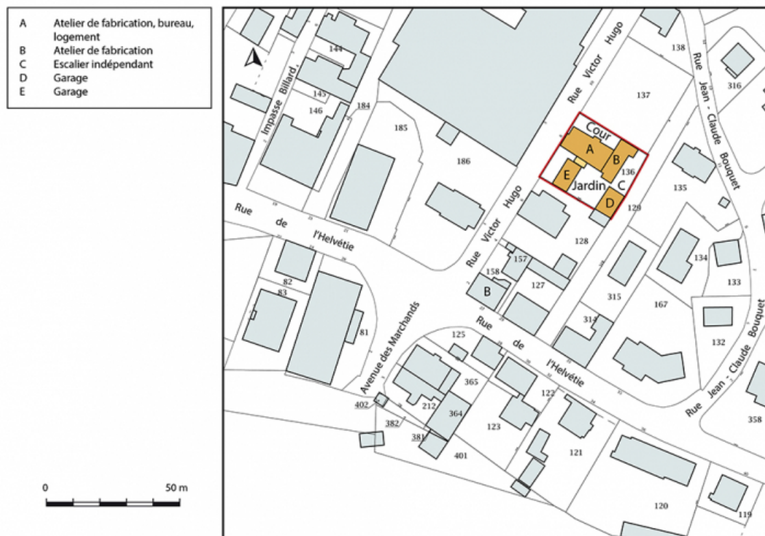
Plan-masse et de situation. Extrait du plan cadastral, 2018, section AF, 1/1 000.