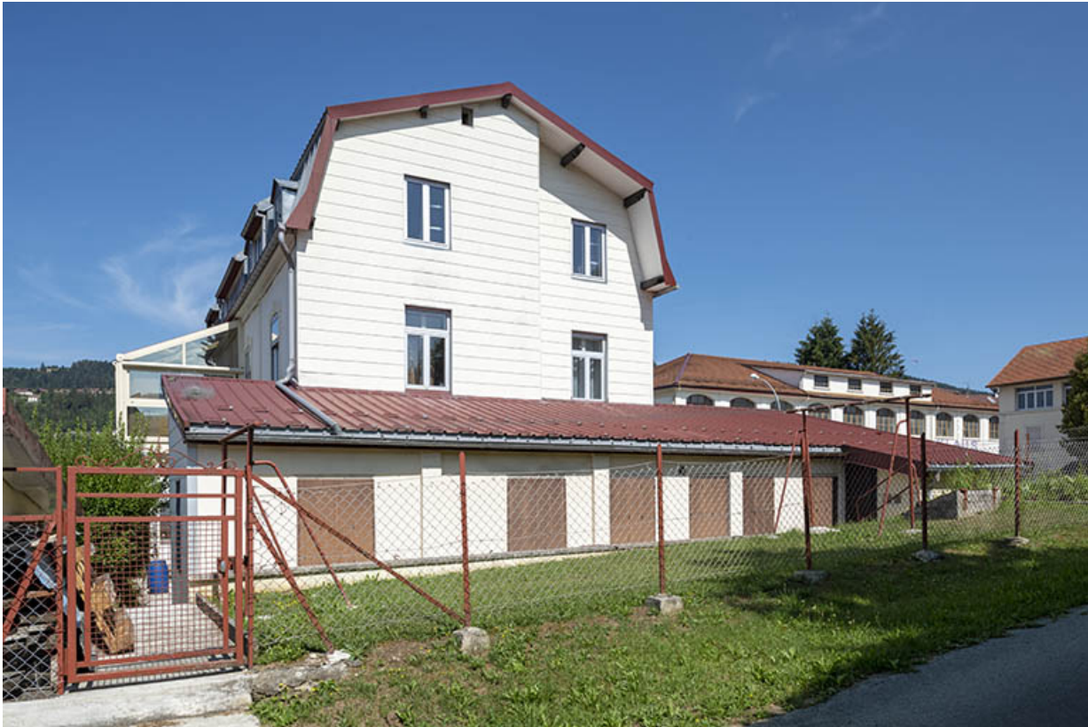
Façade latérale droite et atelier de fabrication.