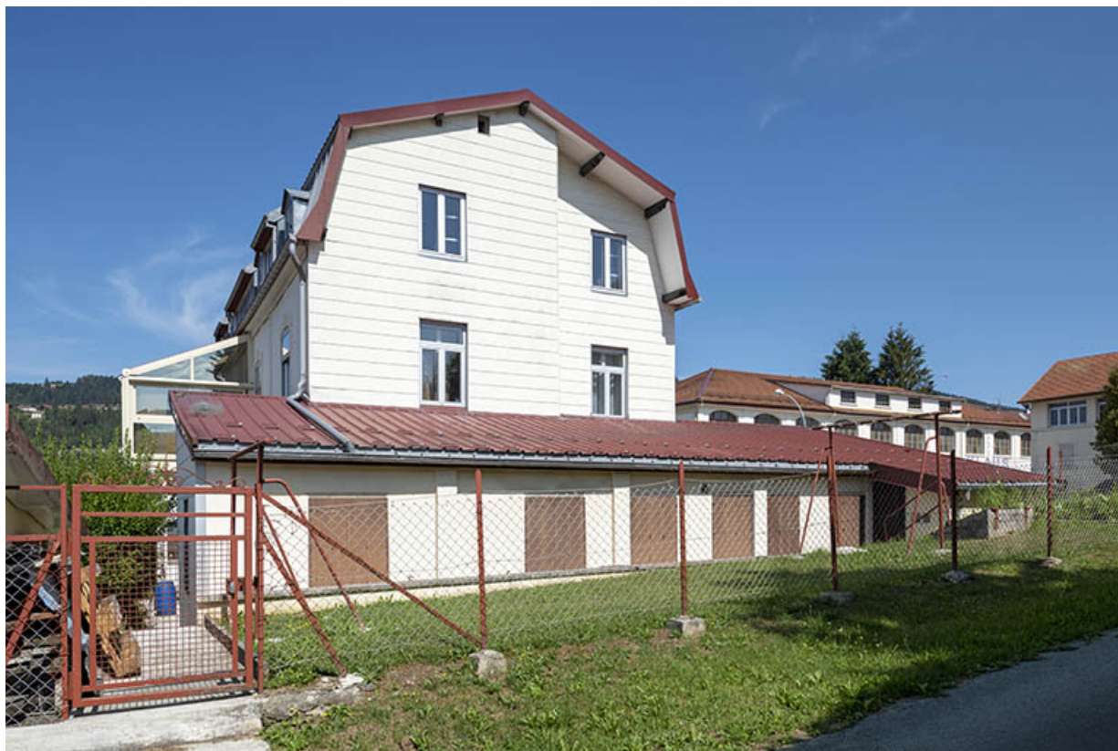
Façade latérale droite et atelier de fabrication.