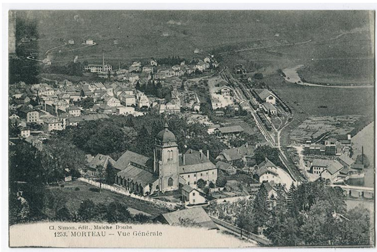
1253. Morteau - Vue générale [depuis l'ouest], 1ère moitié 20e siècle [après 1917]. 25, Morteau, 3 rue Victor Hugo