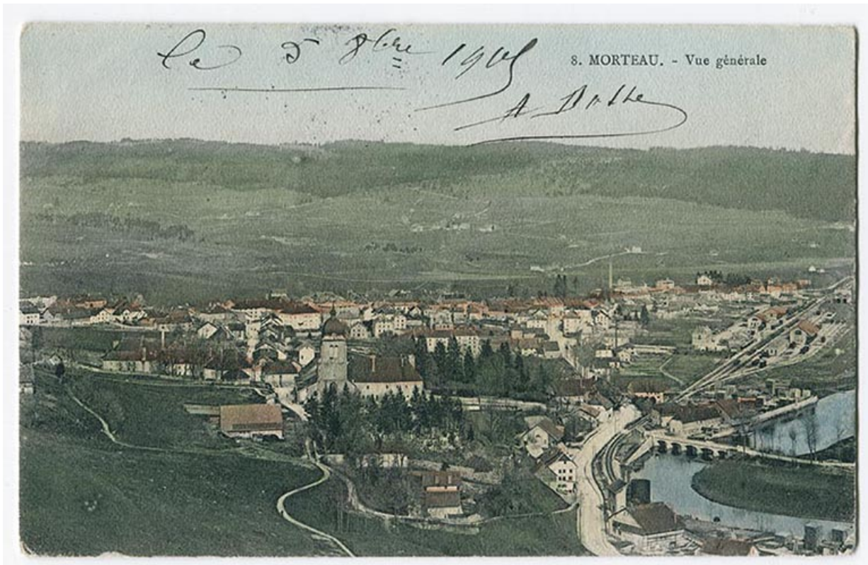
8. Morteau. - Vue générale [depuis la Table du Roi, à l'ouest], 4e quart 19e siècle [après 1895].