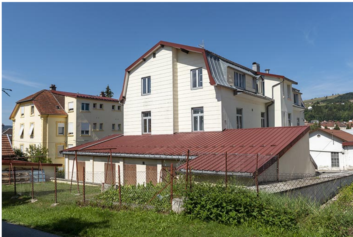
Façades postérieure et latérale droite, avec l'atelier de fabrication au 1er plan. 25, Morteau, 8 rue Victor Hugo