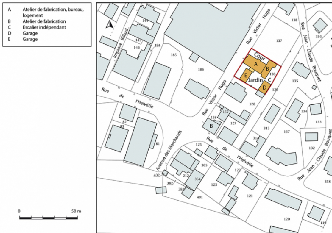
Plan-masse et de situation. Extrait du plan cadastral, 2018, section AF, 1/1 000. 25, Morteau, 8 rue Victor Hugo