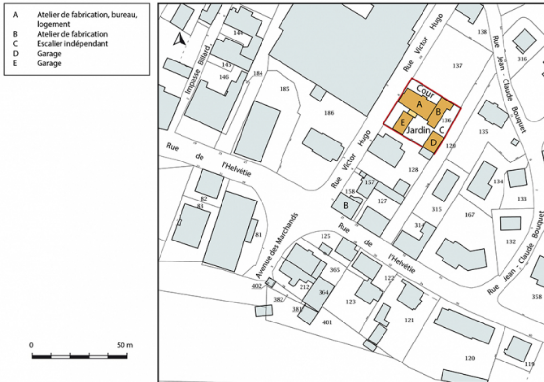
Plan-masse et de situation. Extrait du plan cadastral, 2018, section AF, 1/1 000. 25, Morteau, 8 rue Victor Hugo