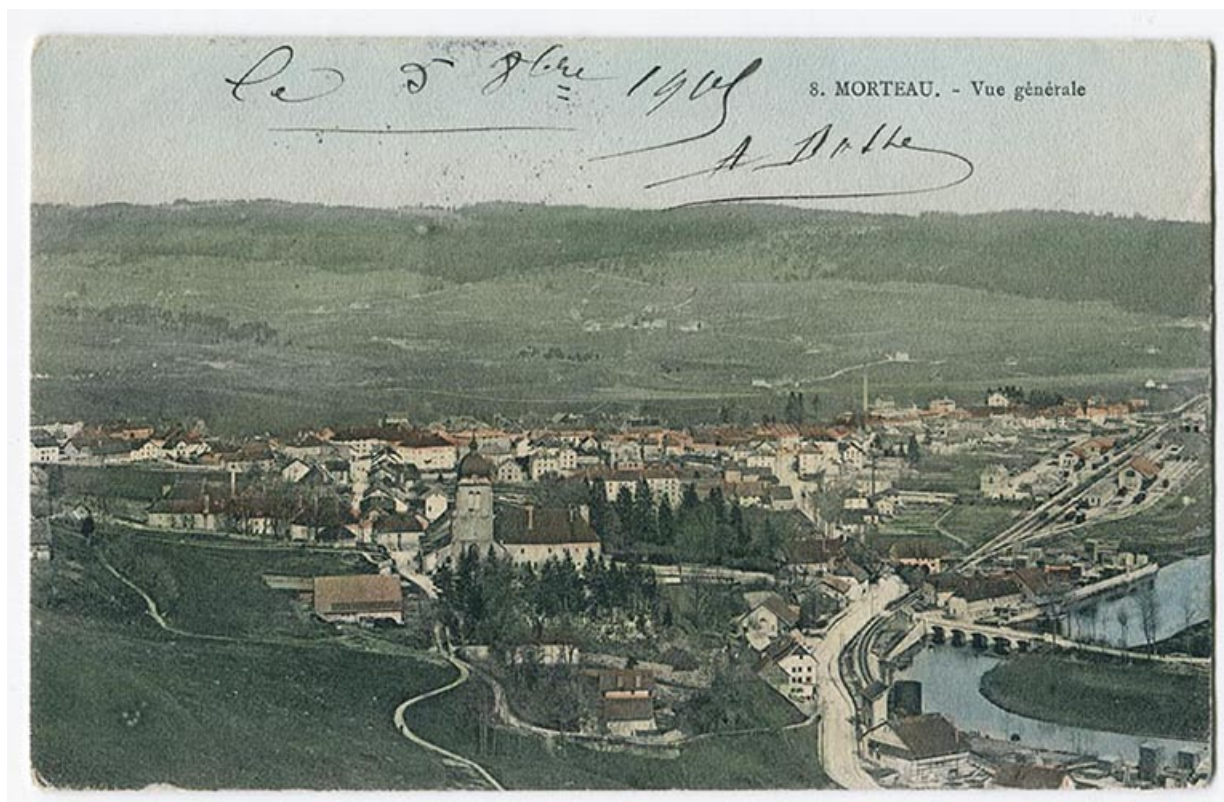
8. Morteau. - Vue générale [depuis la Table du Roi, à l'ouest], 4e quart 19e siècle [après 1895].